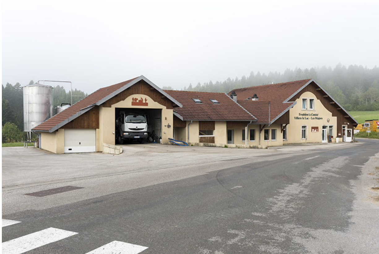
Vue d'ensemble, depuis l'est (façade antérieure).

25, Villers-le-Lac, lieudit : les Majors