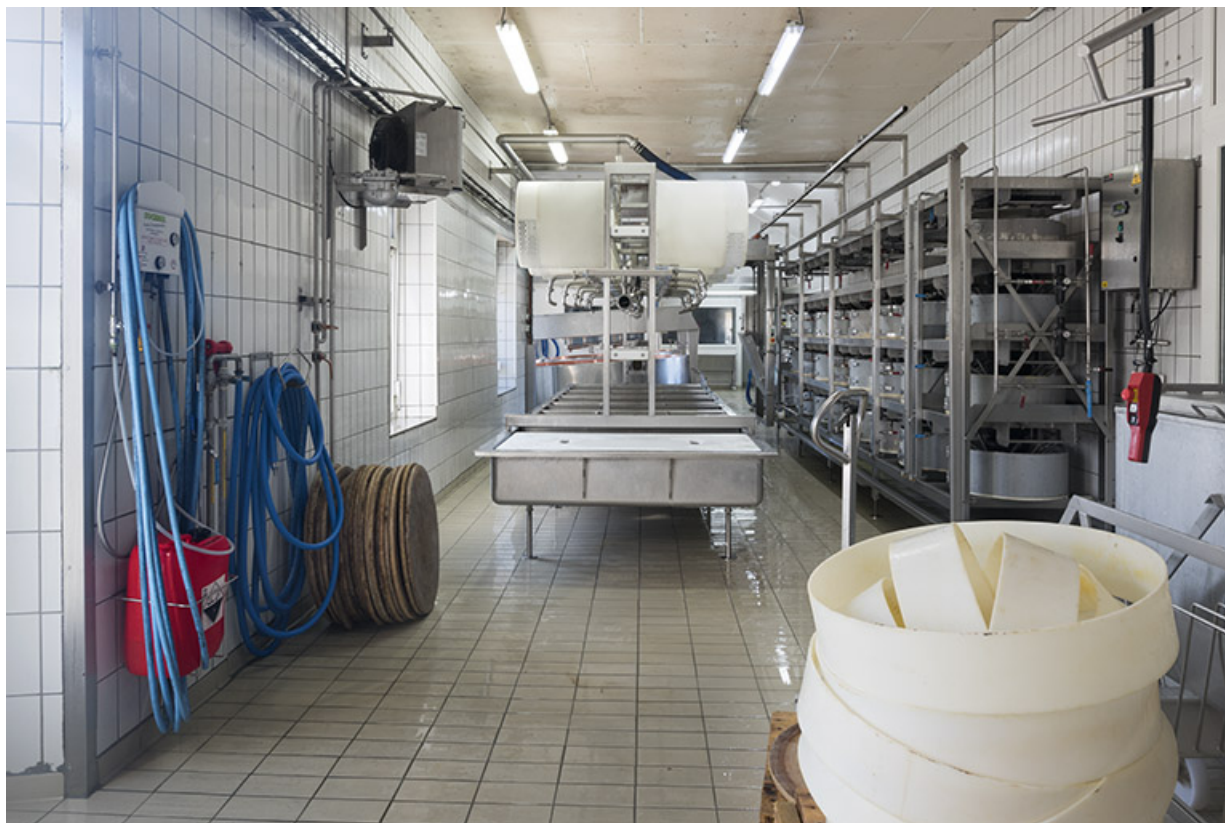
Atelier de fabrication : banc de soutirage et installation de pressage. 25, Villers-le-Lac, lieudit : les Majors