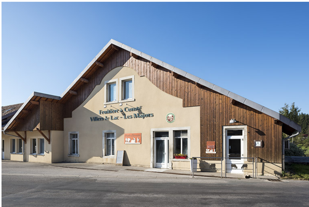
Façade antérieure, de trois quarts droite.

25, Villers-le-Lac, lieudit : les Majors