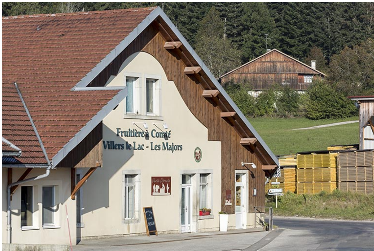
Façade antérieure, de trois quarts gauche.

25, Villers-le-Lac, lieudit : les Majors