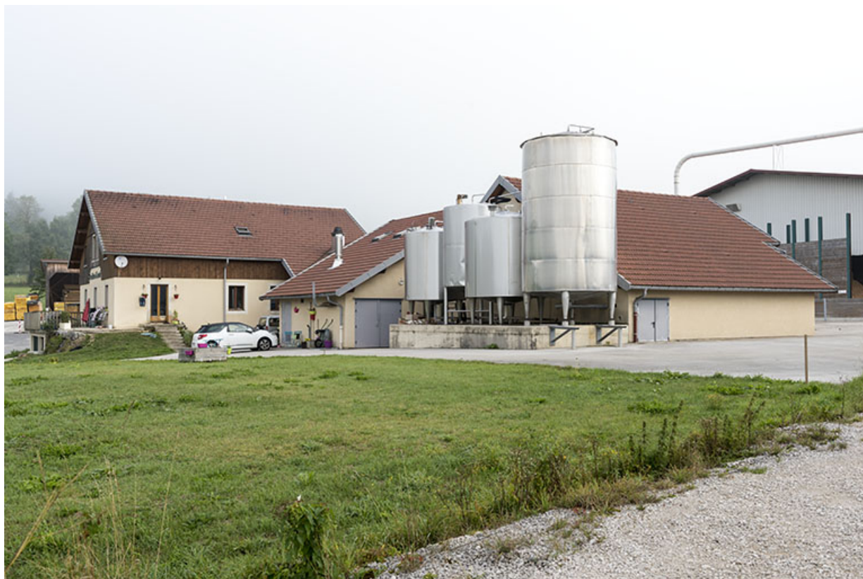
Vue d'ensemble, depuis le sud.

25, Villers-le-Lac, lieudit : les Majors