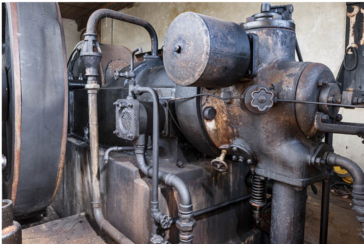
Moteur diesel Duvant. Détail.