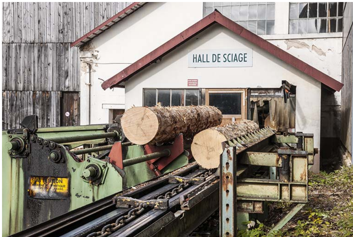
Entrée des grumes dans le hall de sciage.