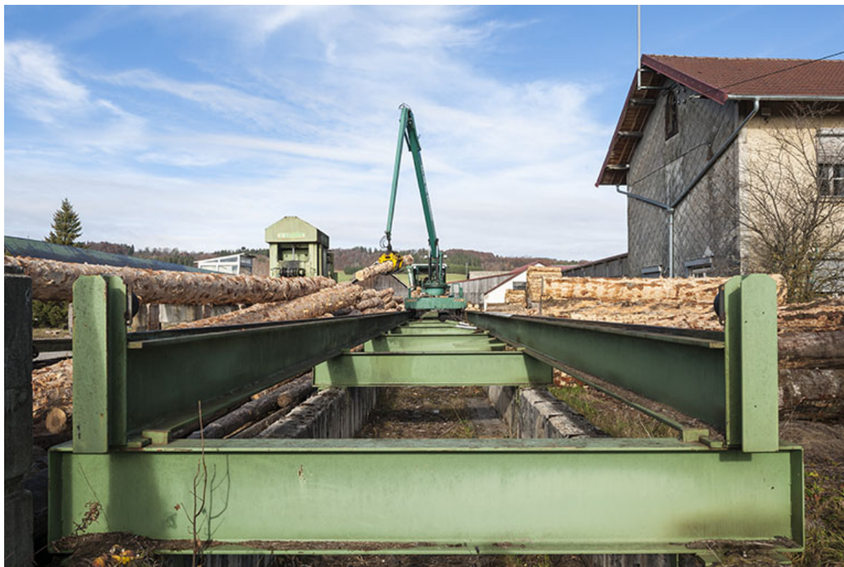
Chariot sur rail du poste d'écorçage.