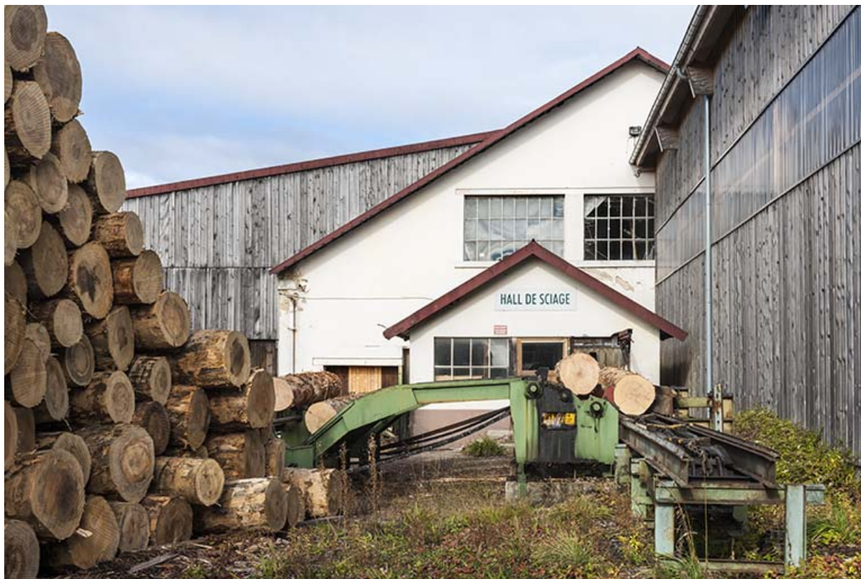
Entrée des grumes dans l'atelier de sciage.