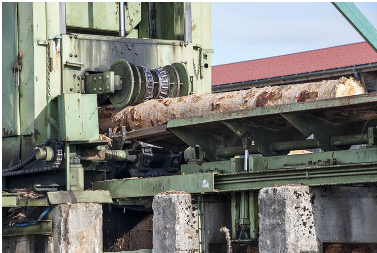
Détail du poste d'écorçage.