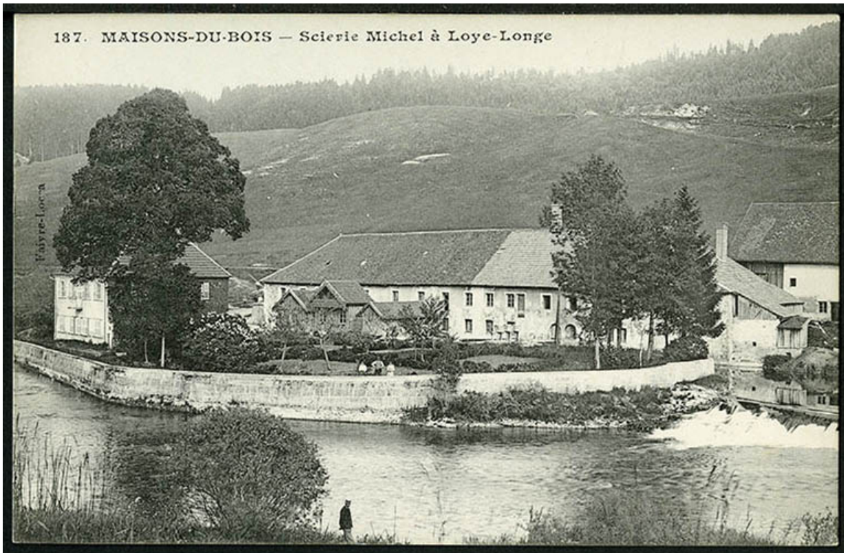
Maisons-du-Bois - Scierie Michel à Loye-Longe, carte postale, s.d. [fin 19e ou début 20e siècle].

25, Maisons-du-Bois-Lièvremont, lieudit : l' Oye Longe