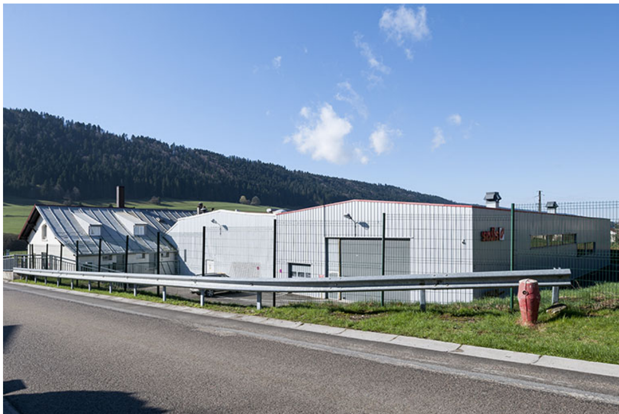
Vue depuis le nord-est.