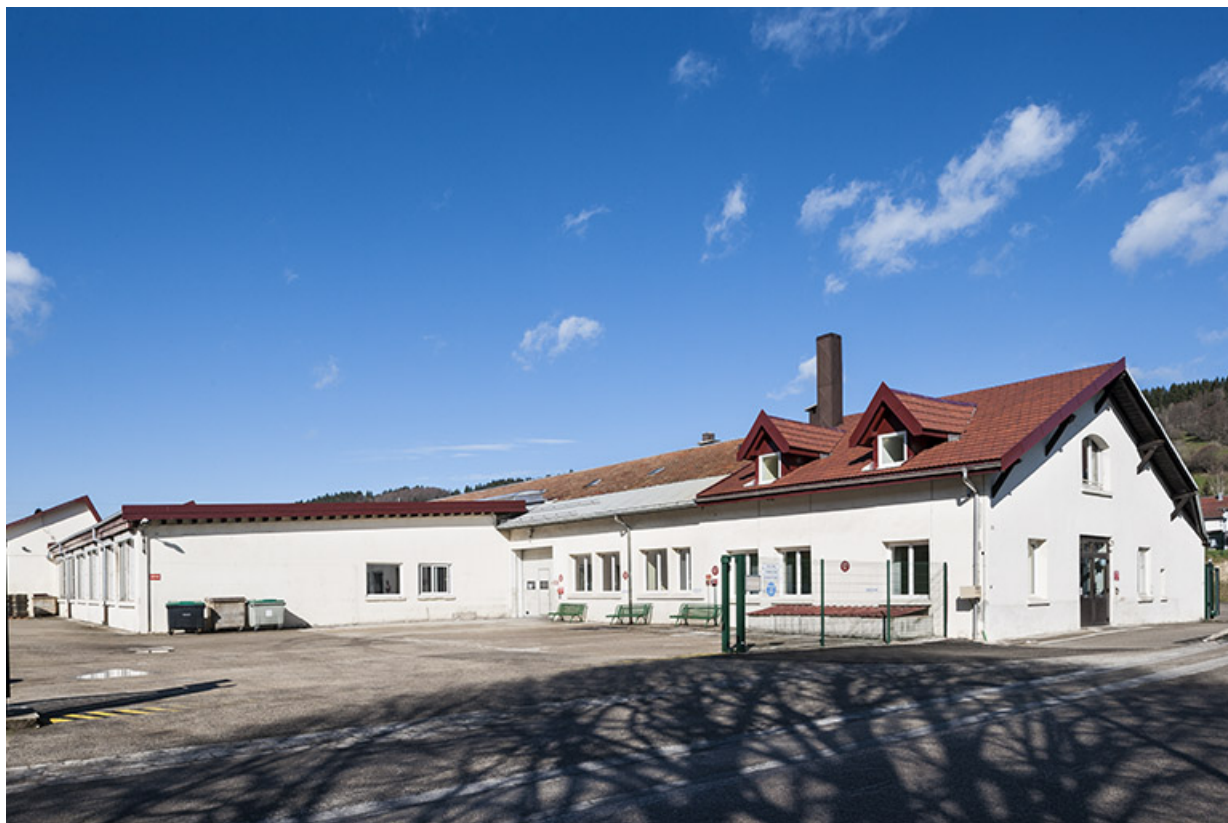
Usine originelle et extension, depuis l'est.