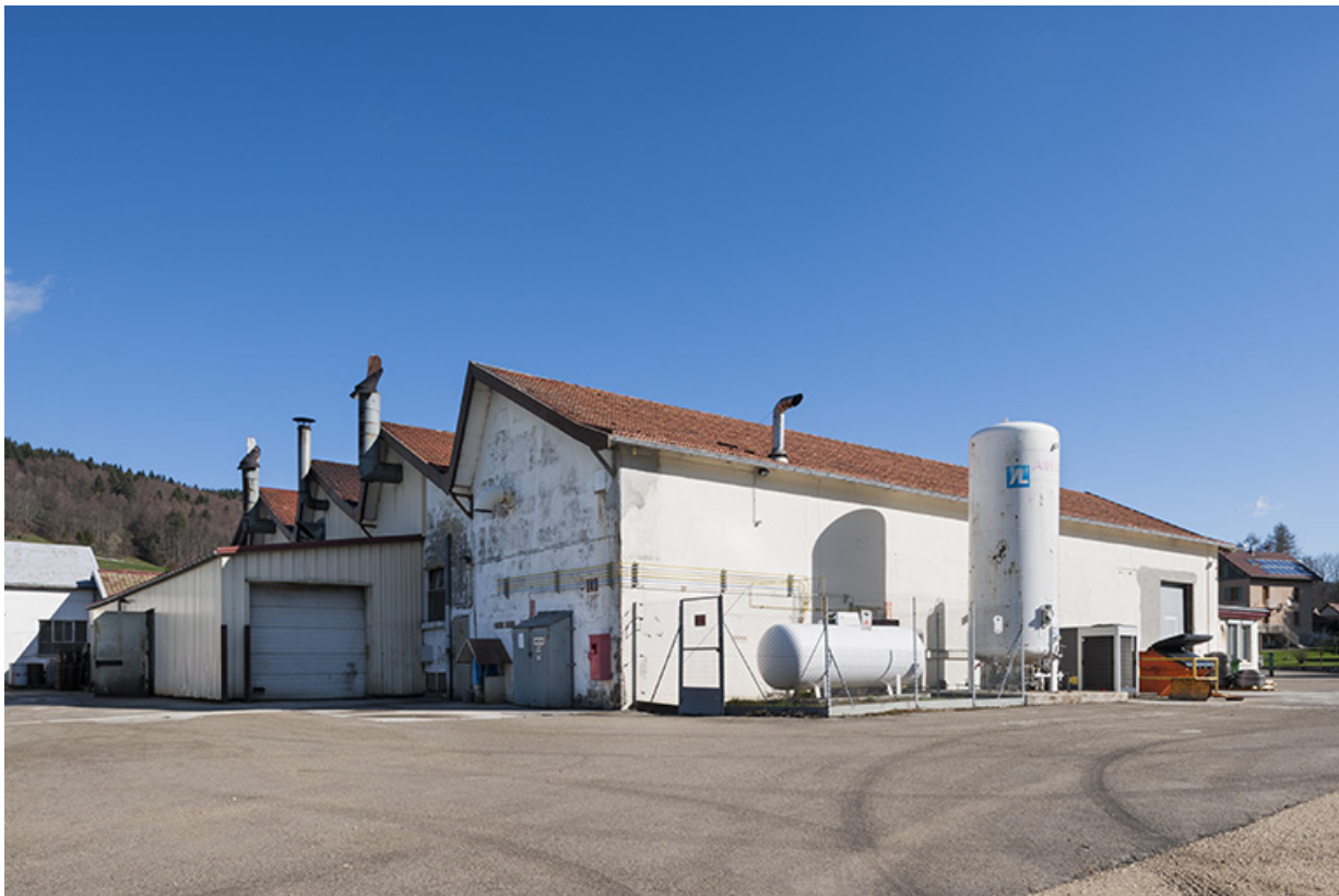
Extension sud de l'usine (1960).