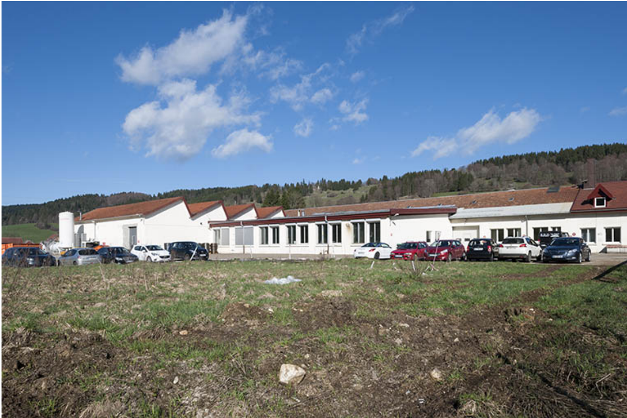
Vue depuis le sud-est.