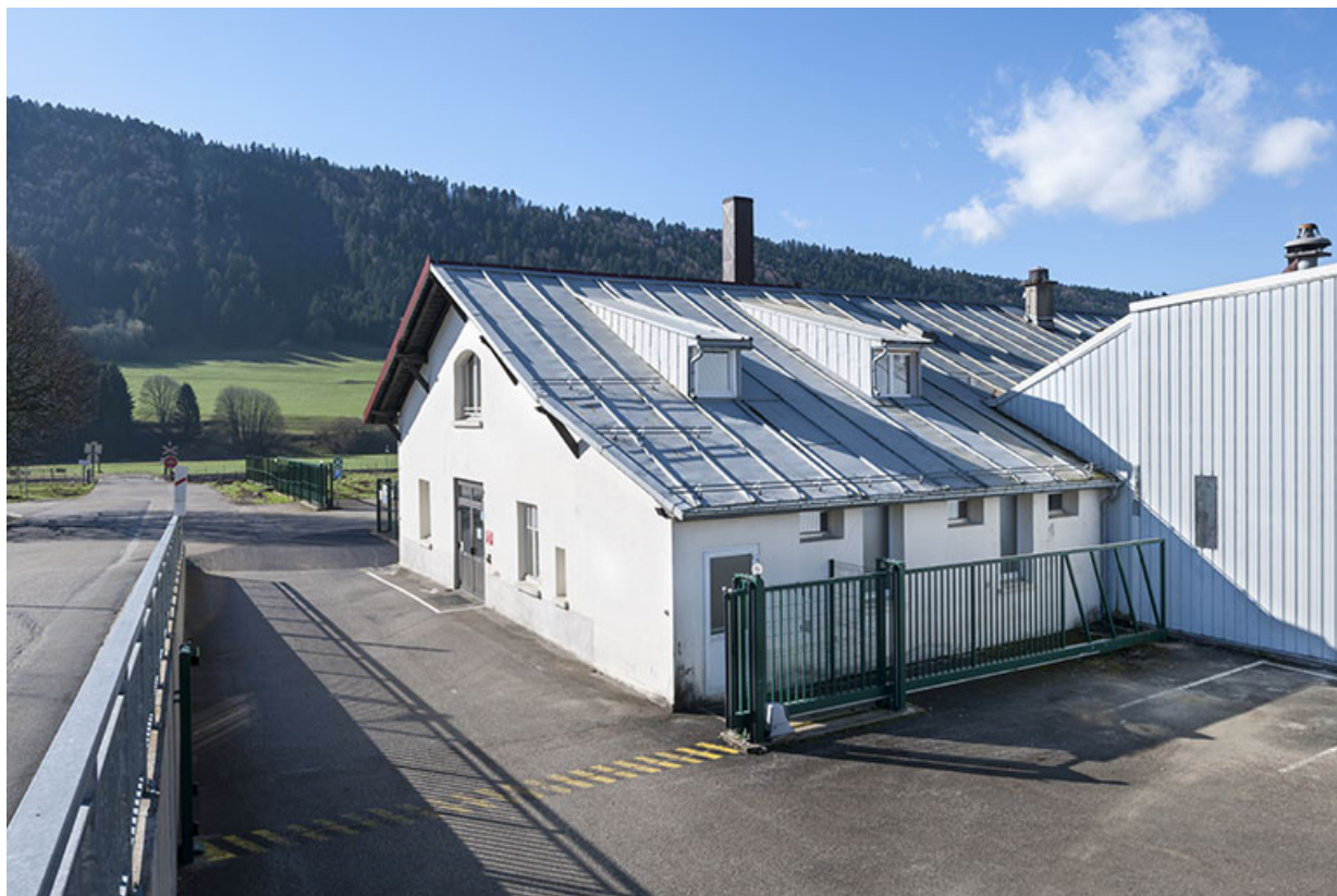
Partie sud du bâtiment originel (bureaux).