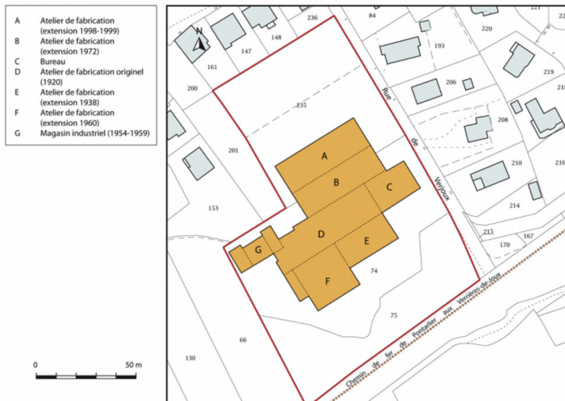
Plan-masse et de situation. Extrait du plan cadastral, 2015, section AC. 25, Verrières-de-Joux, 6 rue de Verjoux