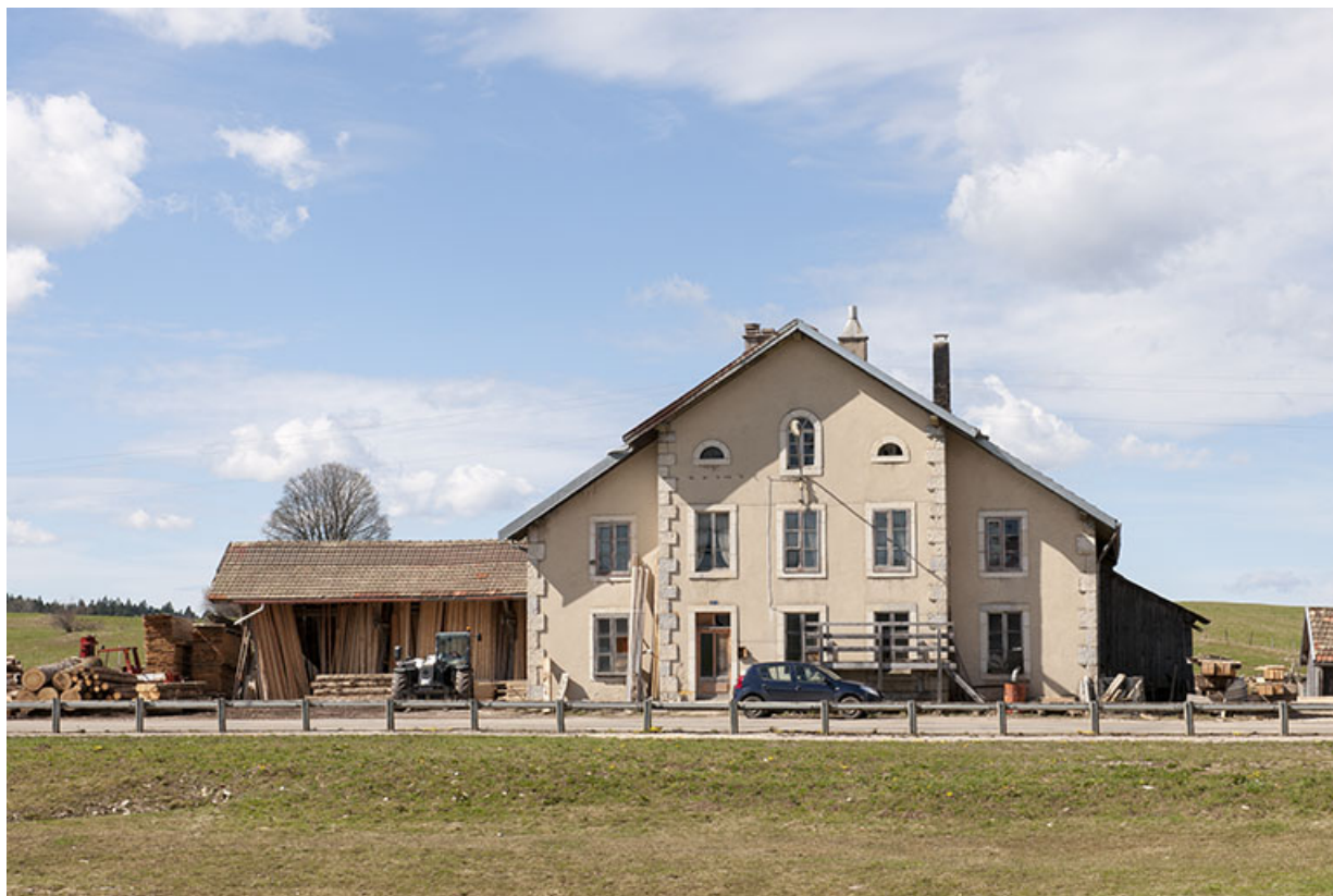
Vue d'ensemble depuis l'est.