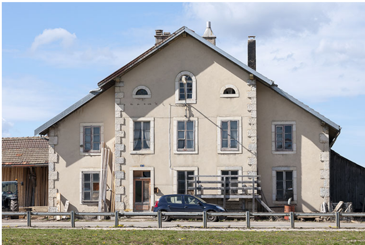
Façade antérieure vue de face.