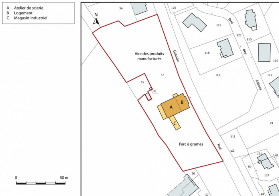
Plan-masse et de situation. Extrait du plan cadastral, 2015, section ZS. 25, Les Fourgs, 2 Grande-Rue