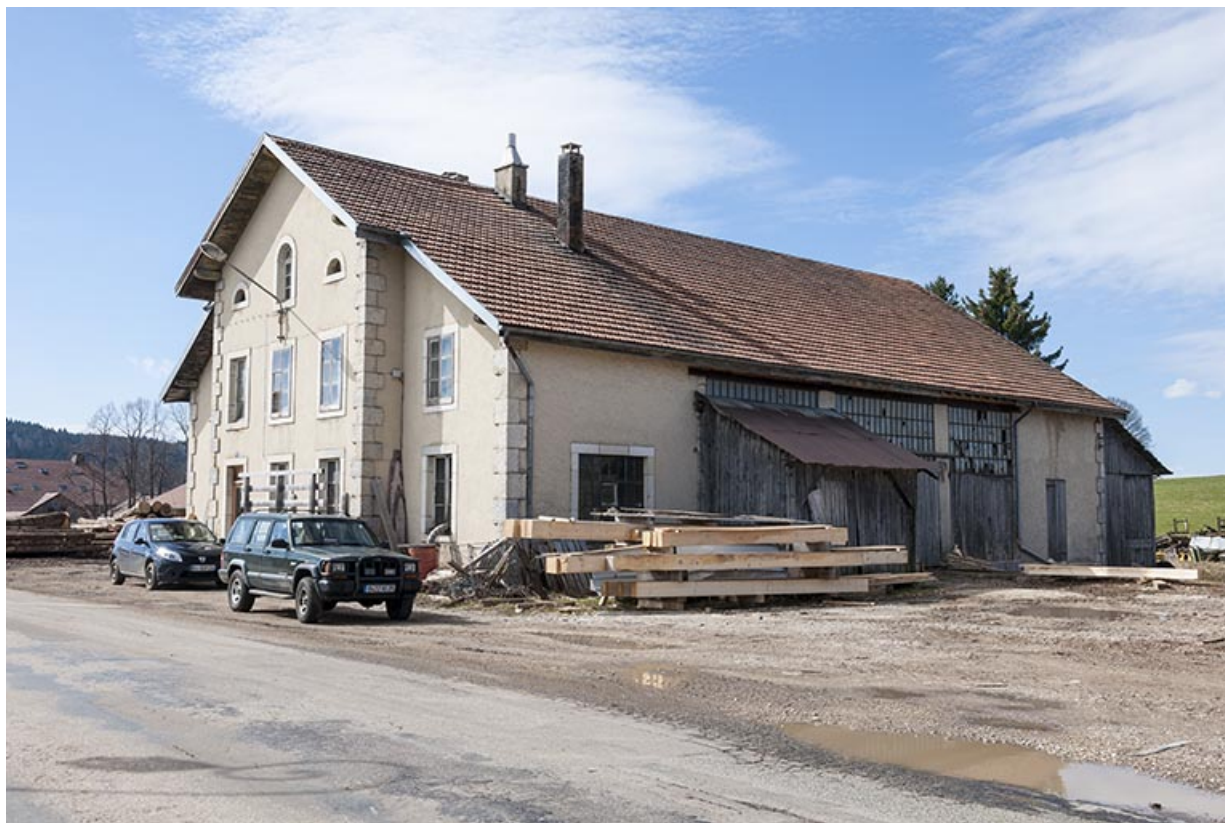
Vue de trois quarts droite.