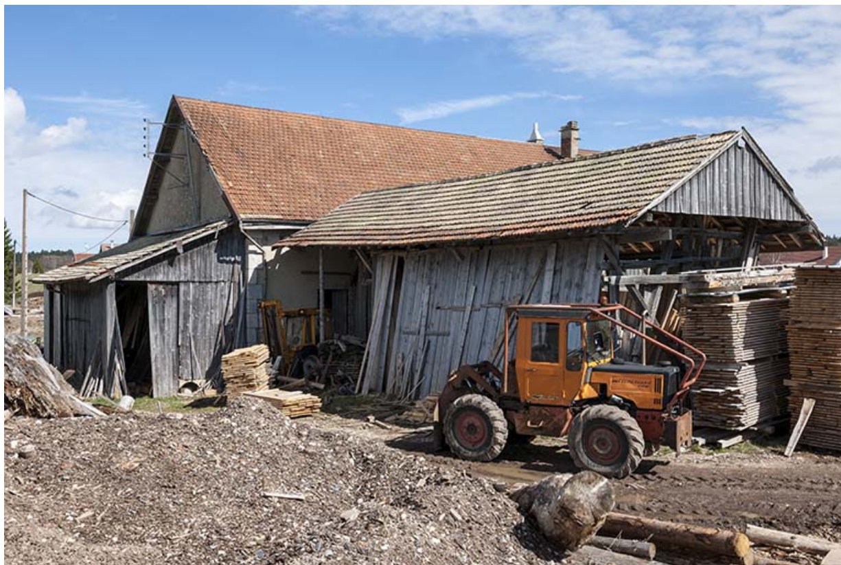
Vue de trois quarts arrière.