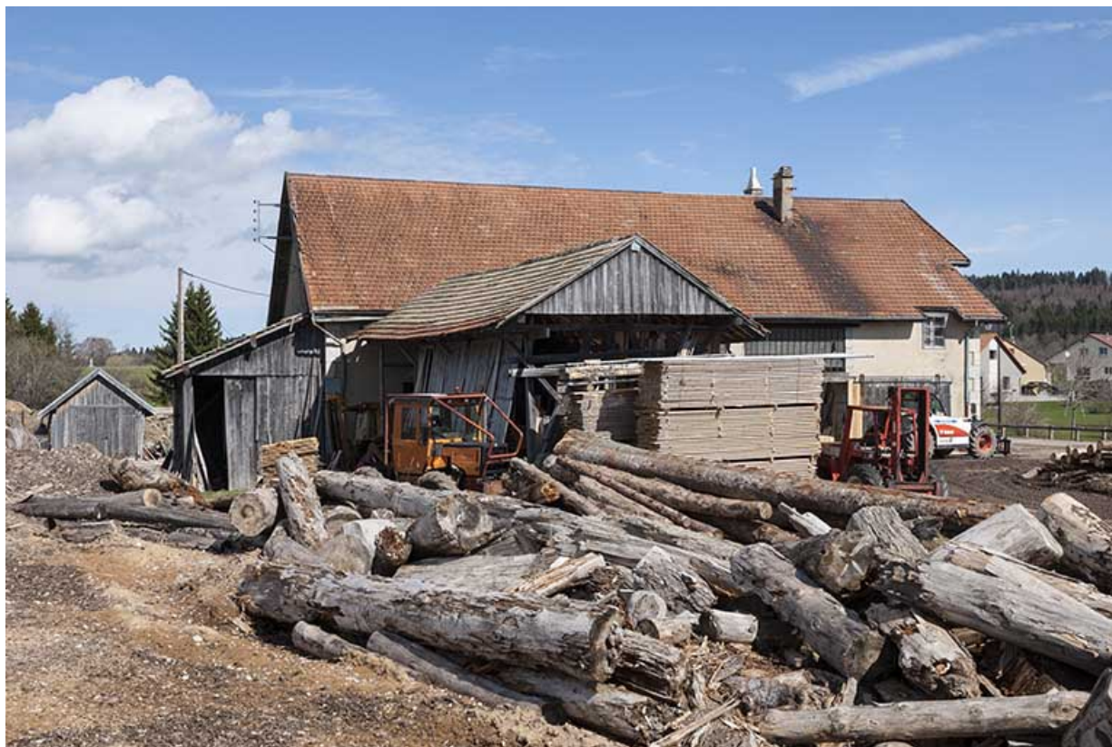
Vue depuis le sud.