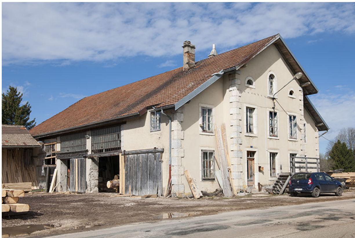
Vue de trois quarts gauche.