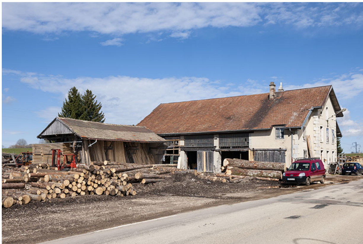
Vue d'ensemble depuis le sud-est.