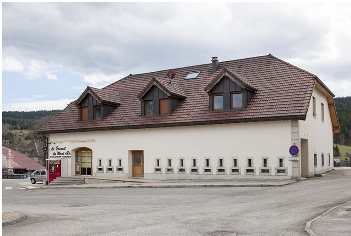
Vue d'ensemble depuis le nord-ouest.