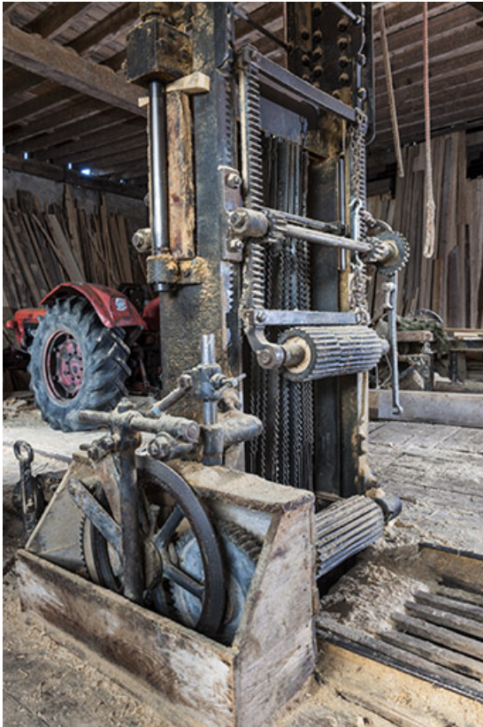
Châssis de scie vu de trois quarts. Au premier plan : système d'entraînement. 25, Chapelle-des-Bois, lieudit : Les Mortes