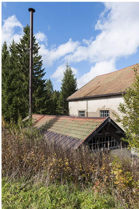
Toiture de la salle de la machine à vapeur et scierie.

25, Chapelle-des-Bois, lieudit : Les Mortes