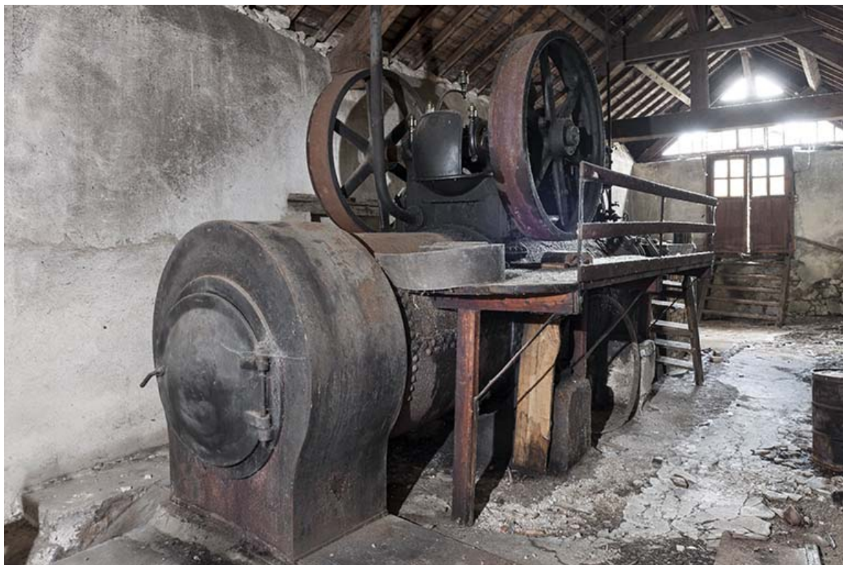
La machine à vapeur vue de trois quarts.

25, Chapelle-des-Bois, lieudit : Les Mortes