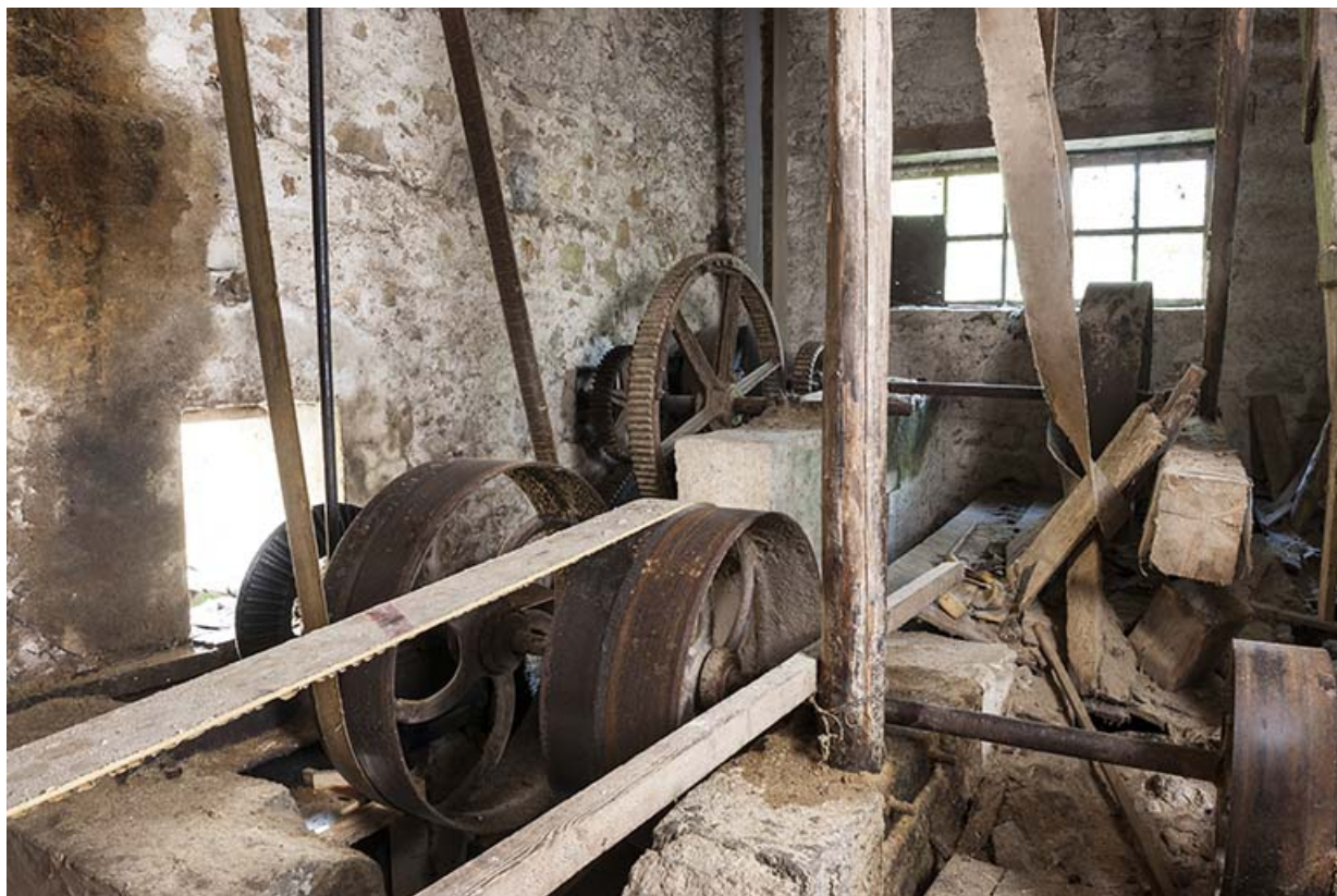
Etage de soubassement. Axe de transmission de la turbine et poulies de renvoi. 25, Chapelle-des-Bois, lieudit : Les Mortes