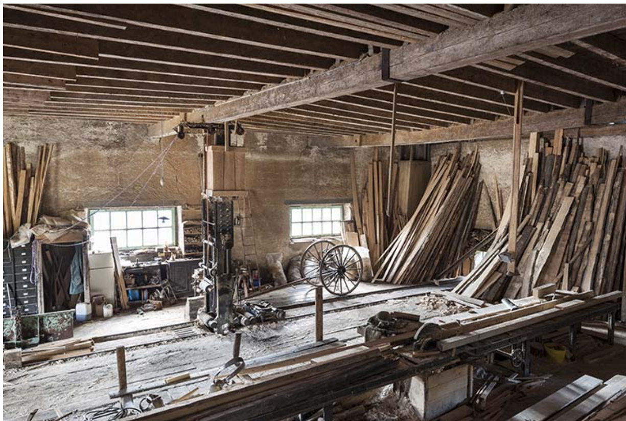
Vue plongeante sur l'atelier de scierie.