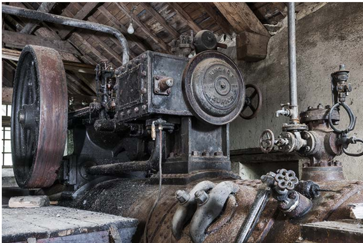
Volant d'inertie et cylindre de la machine à vapeur.

25, Chapelle-des-Bois, lieudit : Les Mortes