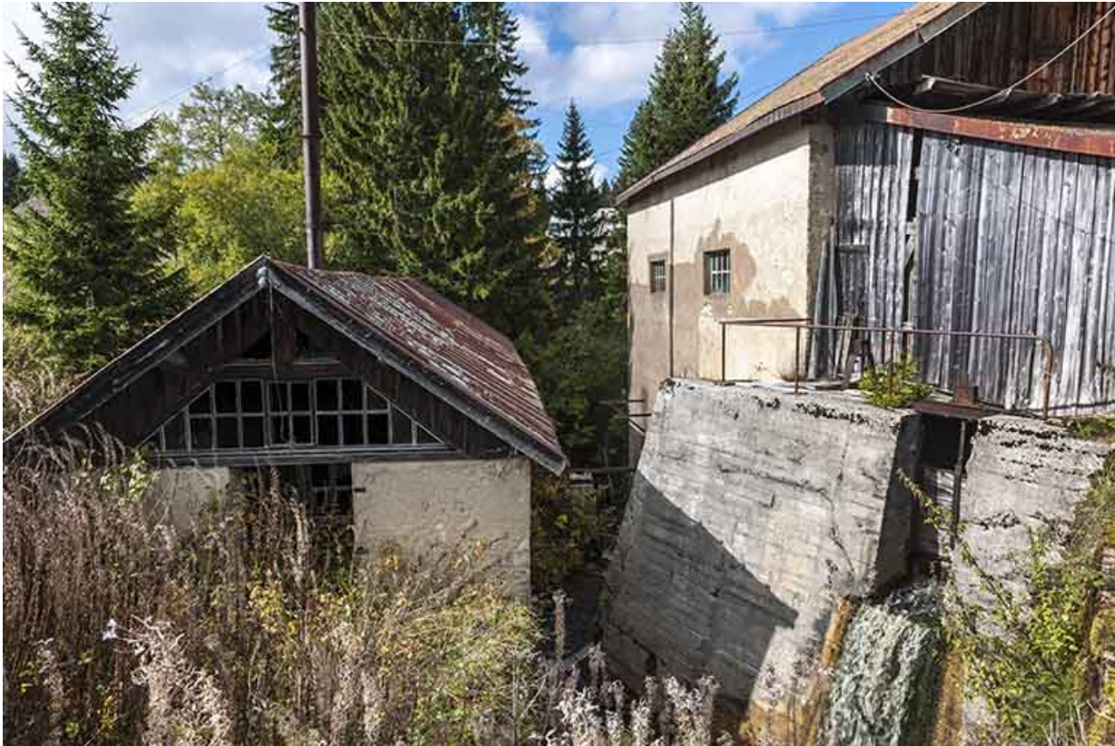
Salle de la machine à vapeur et atelier de la scierie.

25, Chapelle-des-Bois, lieudit : Les Mortes