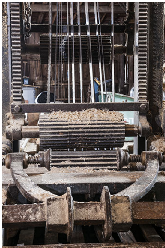
Détail du chariot et du châssis de scie.

25, Chapelle-des-Bois, lieudit : Les Mortes