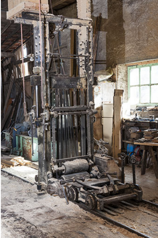
Châssis de scie et son chariot.

25, Chapelle-des-Bois, lieudit : Les Mortes