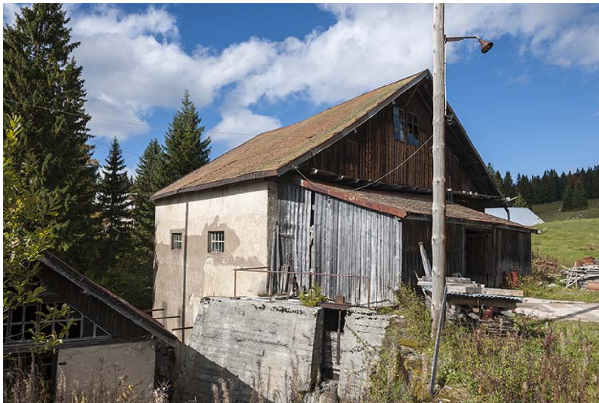
Atelier de scierie vu depuis le sud.

25, Chapelle-des-Bois, lieudit : Les Mortes