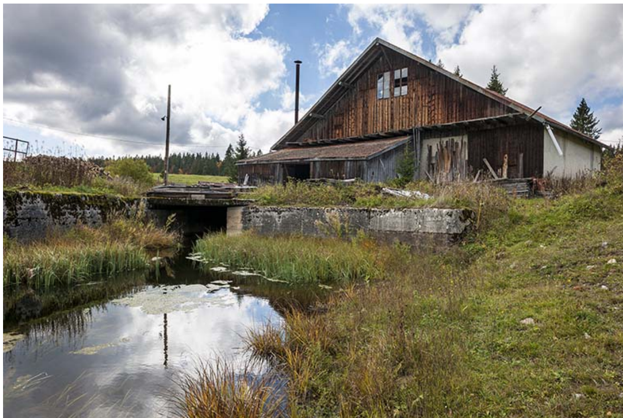
Vue de la scierie depuis le bassin de retenue.

25, Chapelle-des-Bois, lieudit : Les Mortes