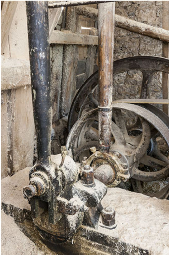
Bielle de transmission de l'axe secondaire (étage de soubassement) au châssis de scie. 25, Chapelle-des-Bois, lieudit : Les Mortes