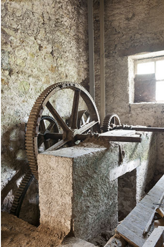
Système de transmission annexe par engrenages (scie circulaire ?). 25, Chapelle-des-Bois, lieudit : Les Mortes