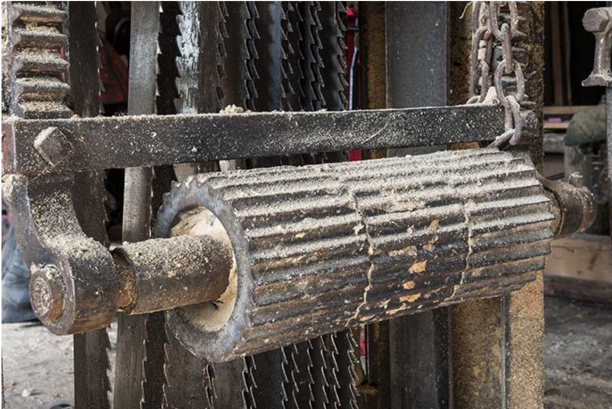
Châssis de scie. Détail d'un cylindre d'avancée de la grume.

25, Chapelle-des-Bois, lieudit : Les Mortes