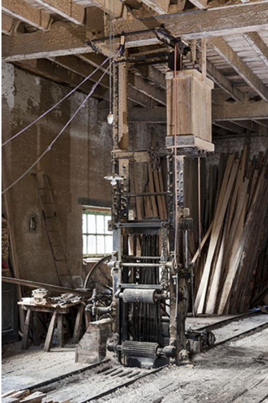
Châssis de scie multilames.

25, Chapelle-des-Bois, lieudit : Les Mortes