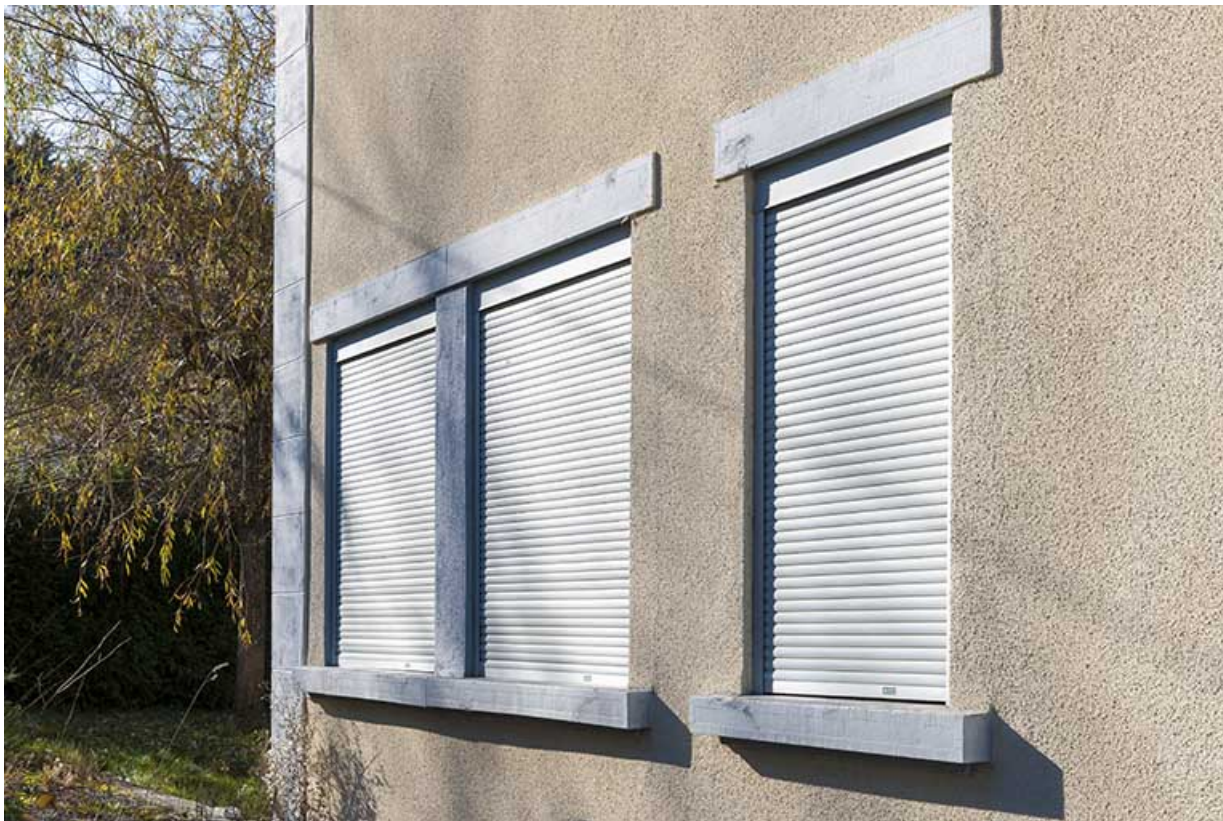
Façade latérale gauche : fenêtre horlogère. 25, Maîche, 8 rue Pasteur