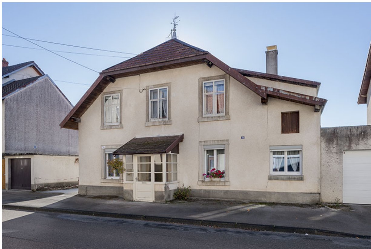
Façade antérieure, de trois quarts droite. 25, Maîche