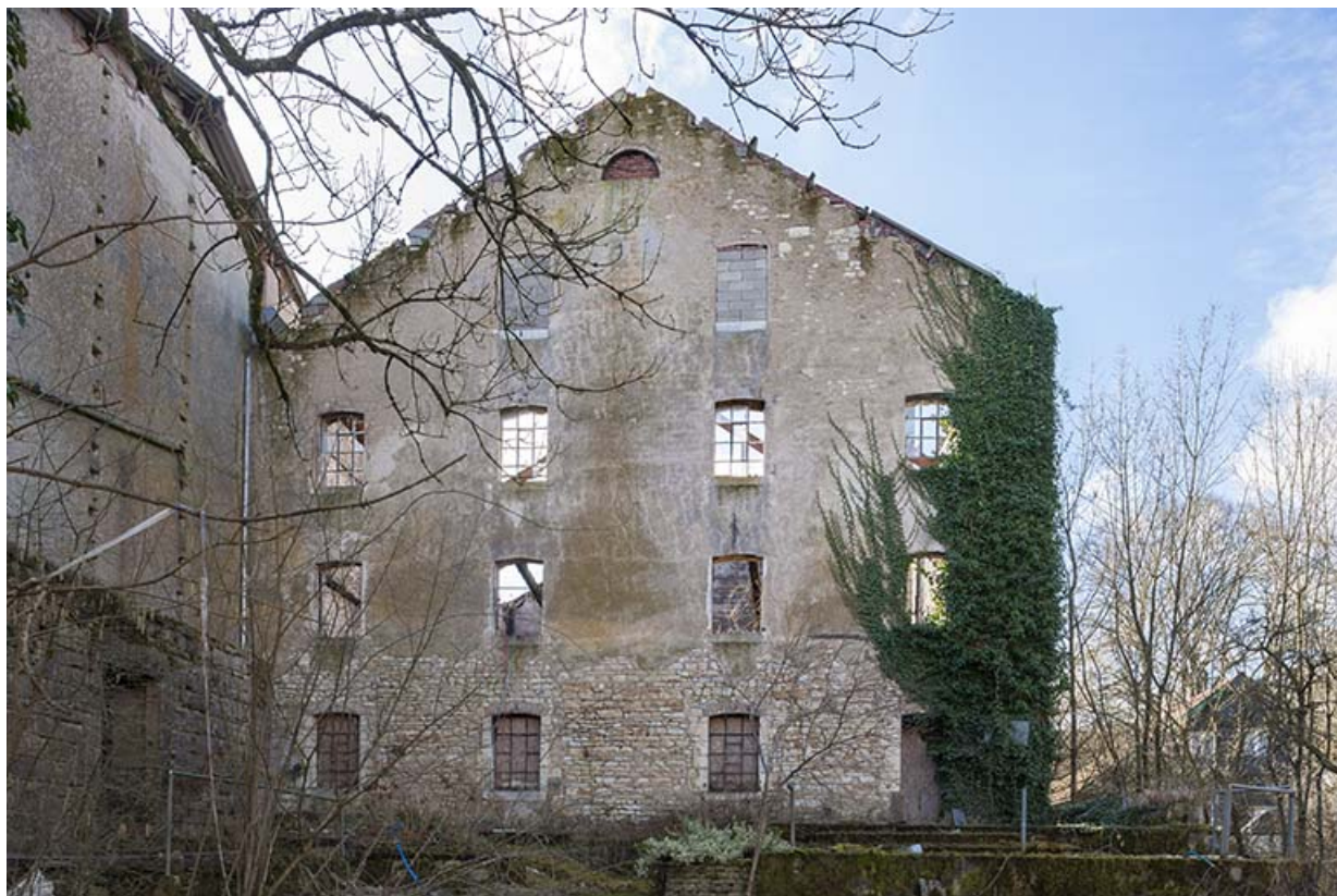
Pignon nord de l'atelier de minoterie.