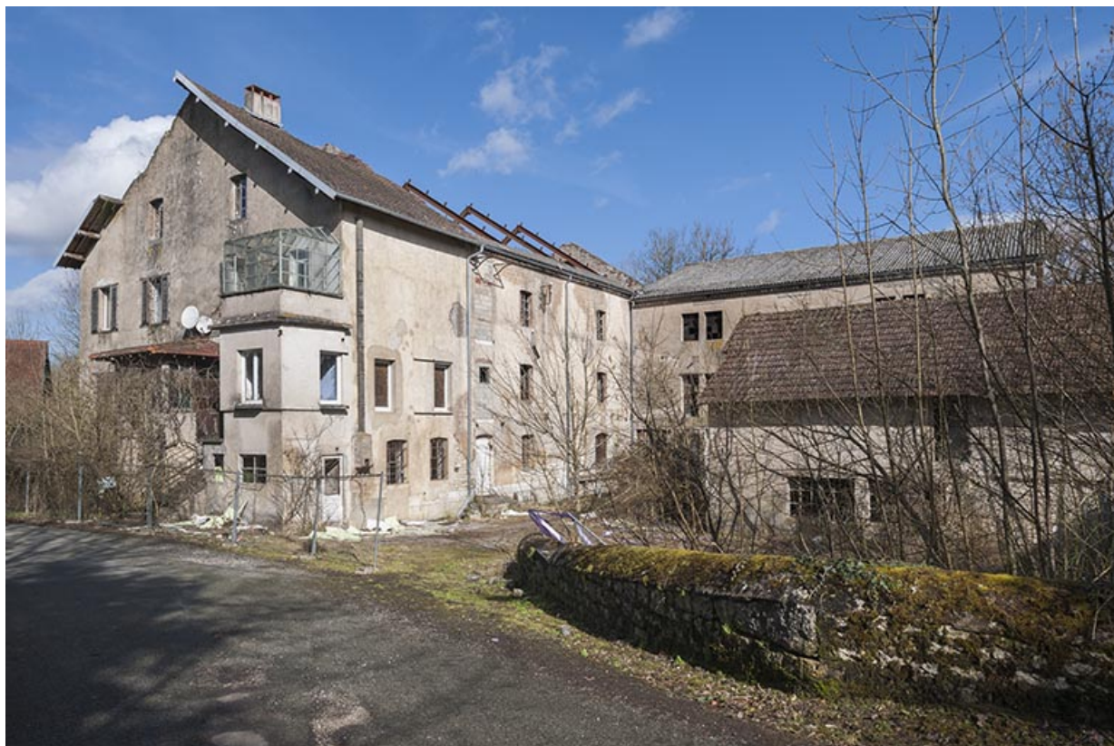
Vue d'ensemble depuis la rue du Canal.