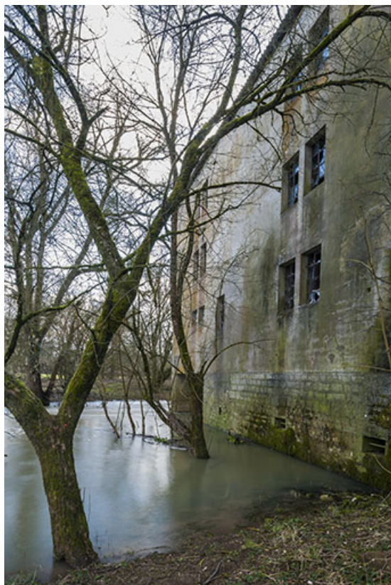
Façade nord du magasin industriel.