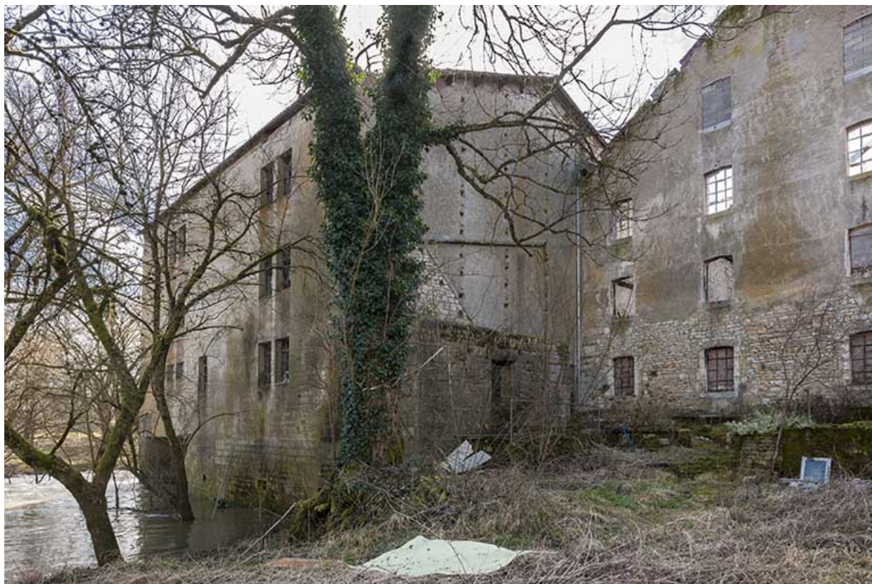
Façade sur l'Ognon du magasin et pignon de l'atelier de minoterie. 25, Cussey-sur-l'Ognon, 8 rue du Canal