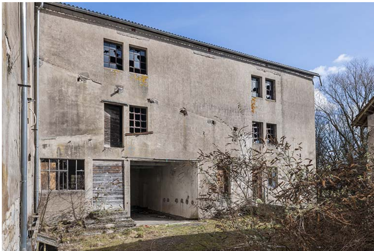
Façade sud du magasin industriel.