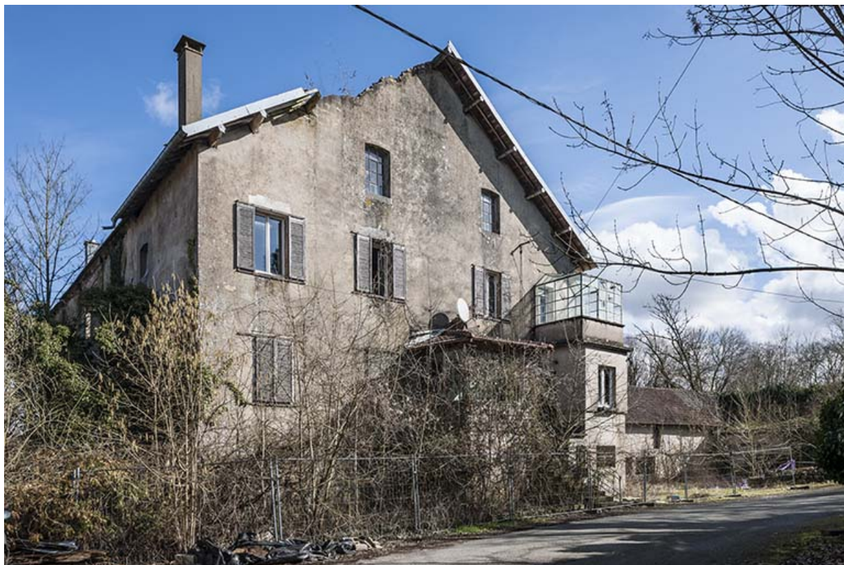
Pignon sud de l'atelier de minoterie (logement au premier plan). 25, Cussey-sur-l'Ognon, 8 rue du Canal