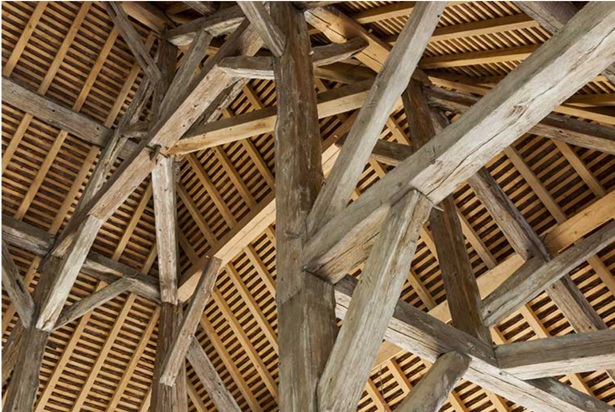
Croupe du séchoir. Partie supérieure de la charpente.