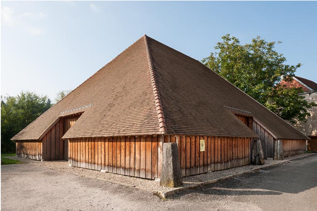
Vue de trois quarts depuis le chemin de Roche.