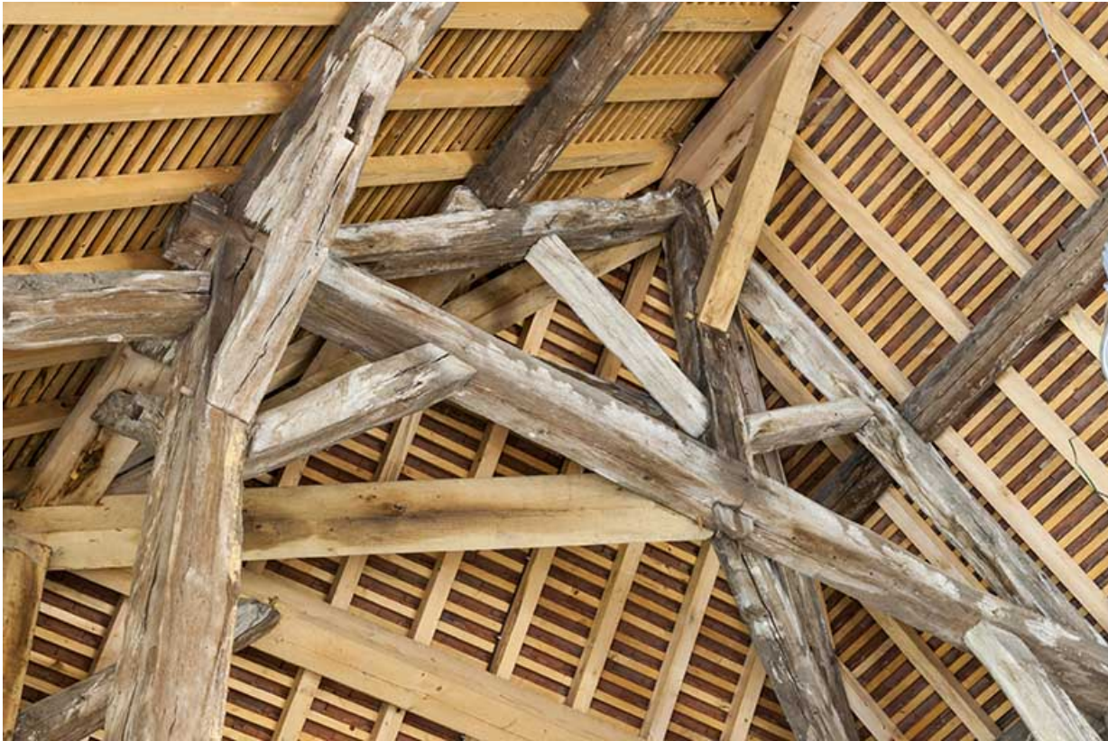
Détail de la charpente de la croupe.