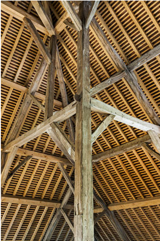
Charpente du séchoir. Détail de la croupe.