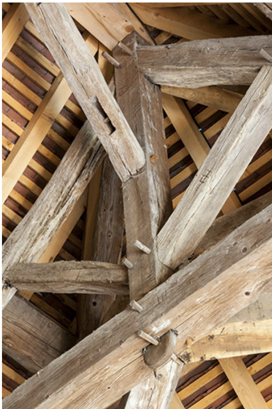
Assemblage de la ferme de la croupe. Détail. 25, Vaire-le-Petit chemin de Roche