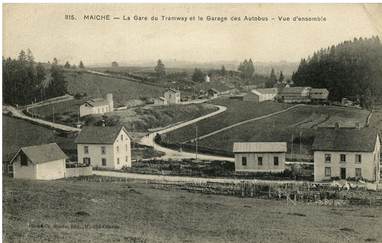
815. Maïche - La gare du tramway et le garage des autobus - Vue d'ensemble, 1er quart 20e siècle (entre 1905 et 1911). 25, Maïche, 26 rue du Mont