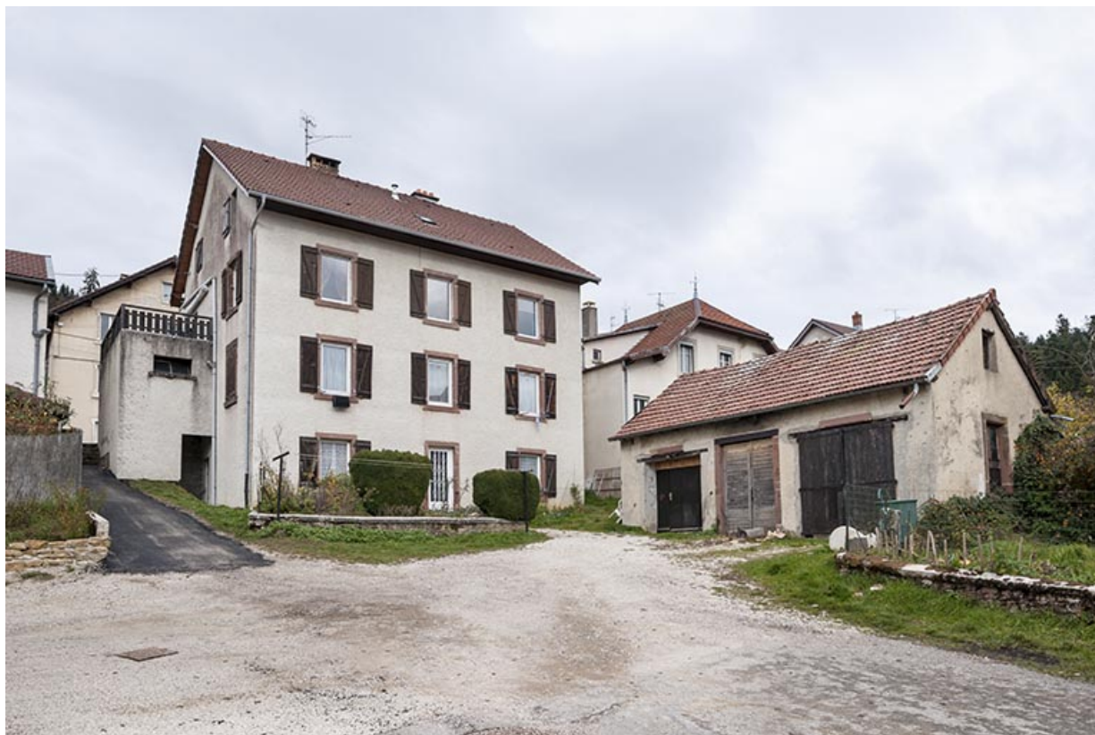
Façade postérieure et ancien atelier ou remise.