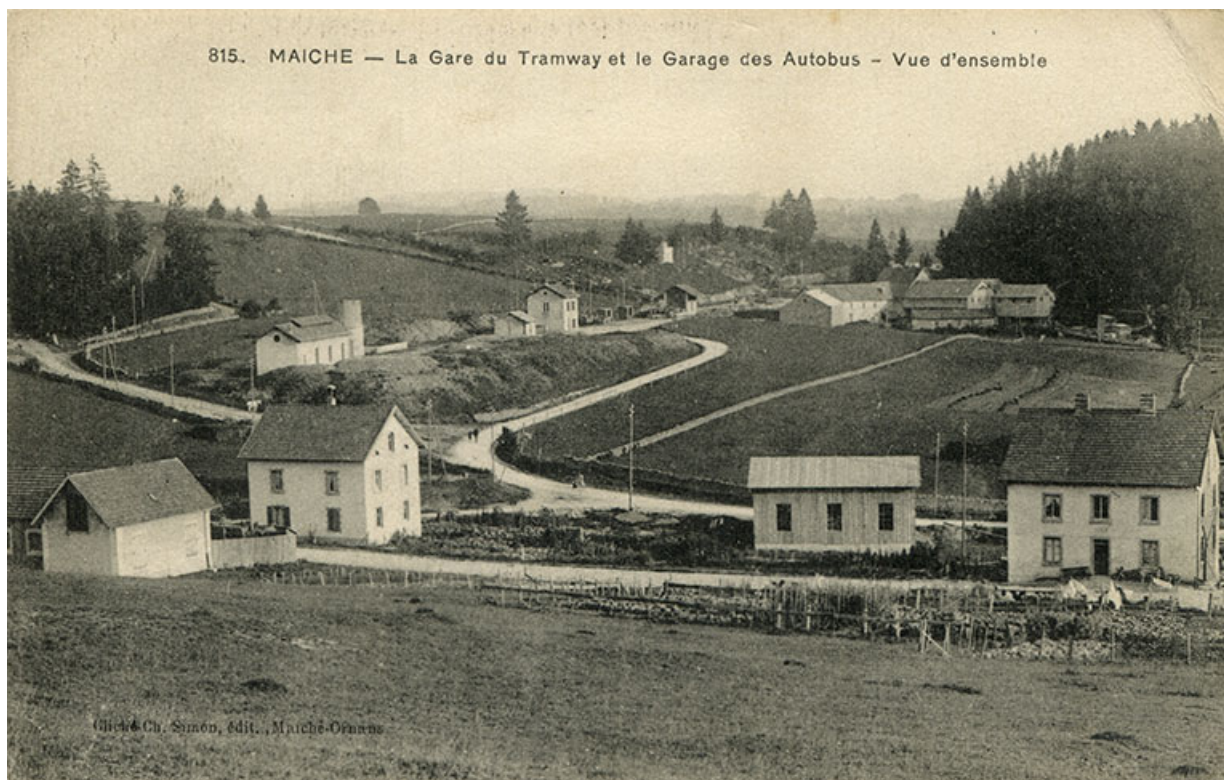
815. Maïche - La gare du tramway et le garage des autobus - Vue d'ensemble, 1er quart 20e siècle (entre 1905 et 1911). 25, Maïche, 26 rue du Mont