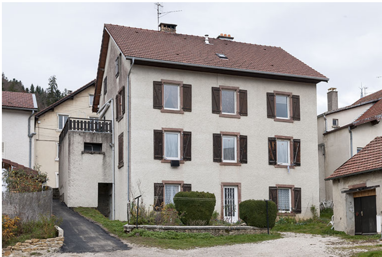
Façade postérieure, de trois quarts gauche. 25, Maîche, 26 rue du Mont