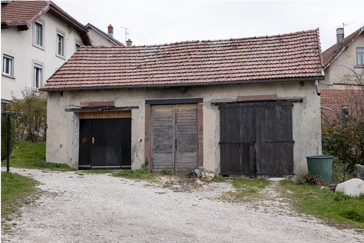
Ancien atelier ou remise.