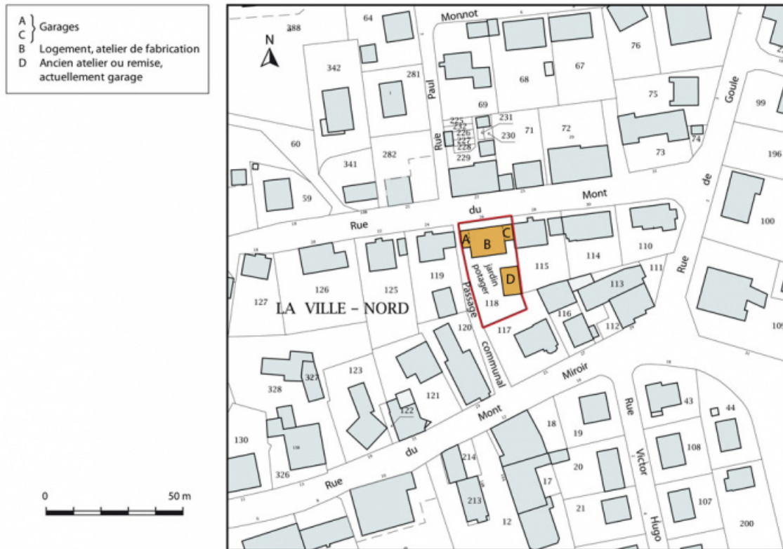
Plan-masse et de situation. Extrait du plan cadastral, 2015, section AB. 25, Maïche, 26 rue du Mont