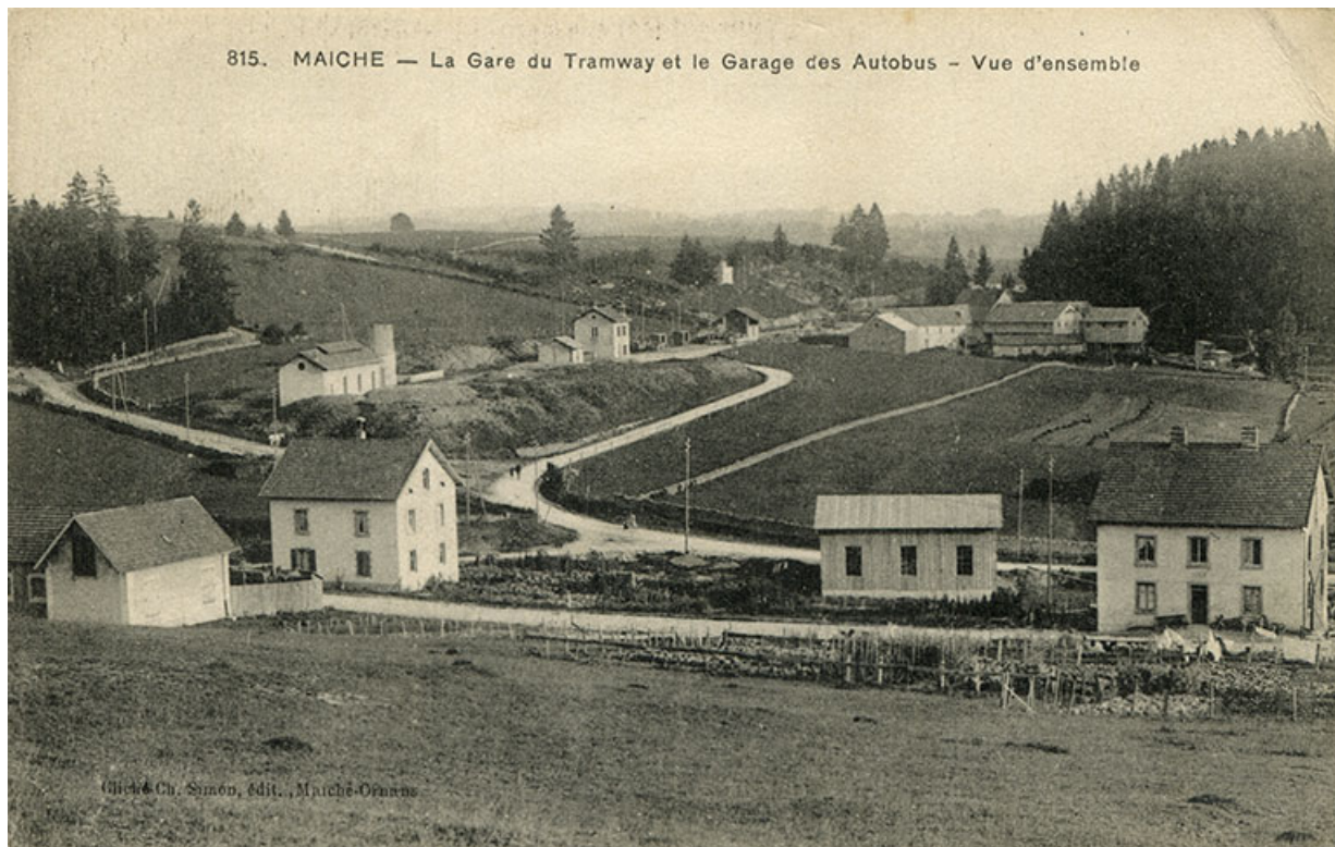
815. Maïche - La gare du tramway et le garage des autobus - Vue d'ensemble, 1er quart 20e siècle (entre 1905 et 1911). 25, Maïche, 26 rue du Mont