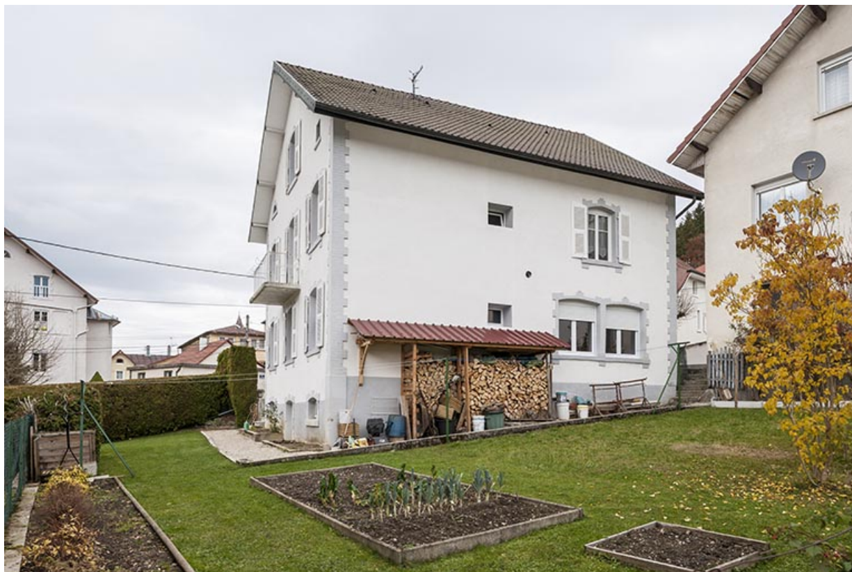
Façade postérieure, de trois quarts gauche. 25, Maîche, 12 rue du Mont