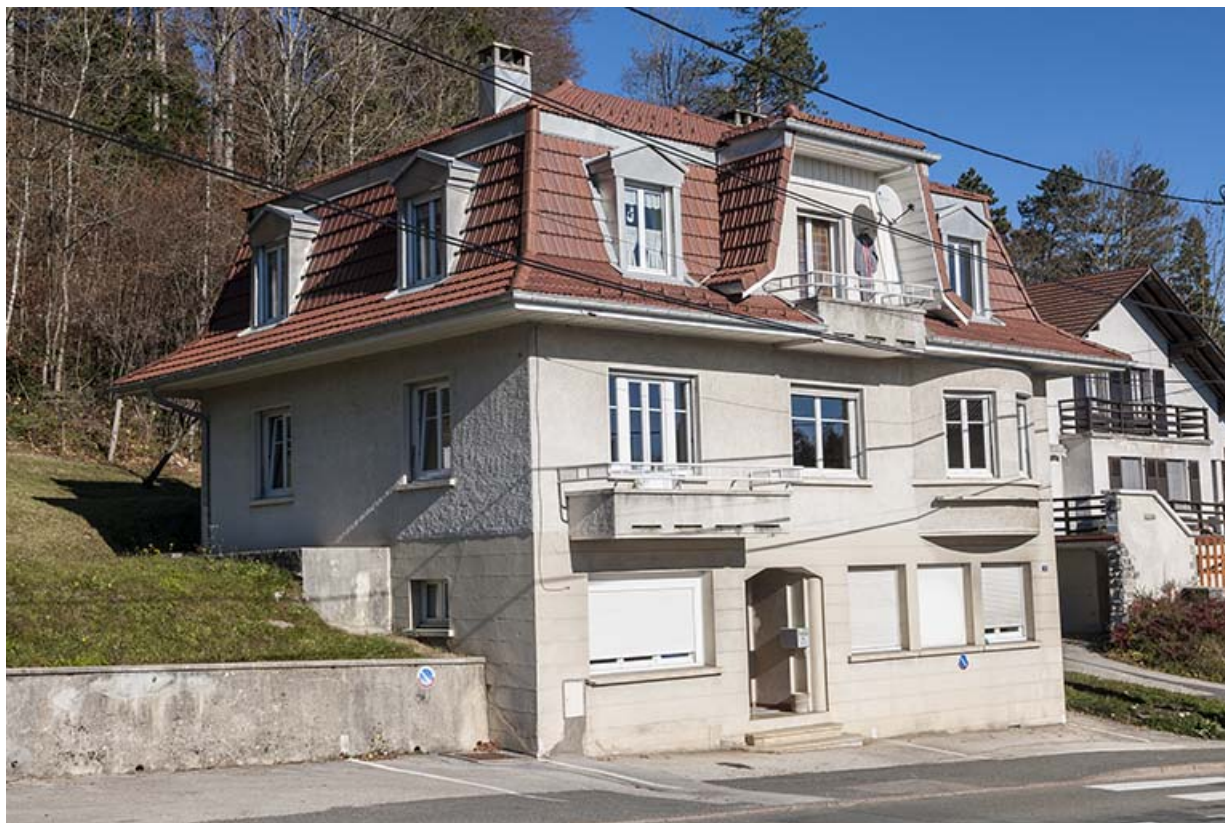
Un petit atelier de décolletage de l'après-guerre : l'affaire d'Emile Bessot (1953), au 8 rue Saint-Michel. 25, Maîche