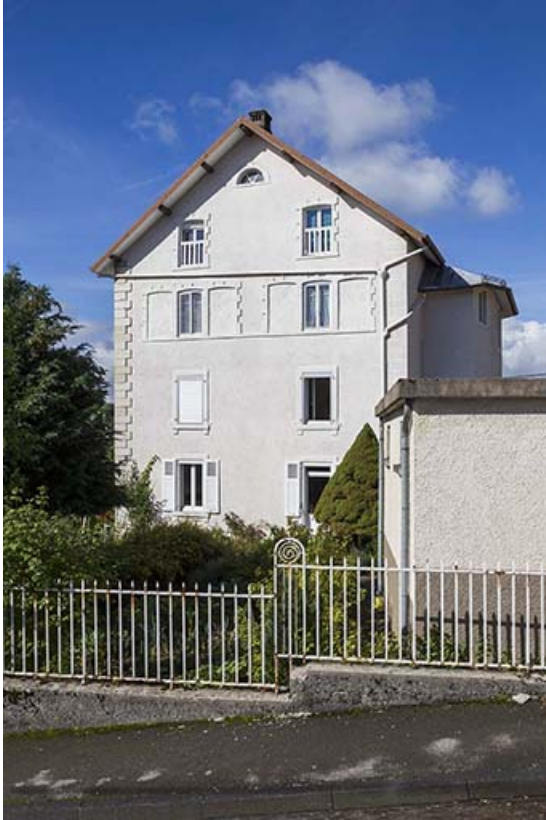
Les Mauvais, une famille d'horlogers entrepreneurs : l'immeuble de Paul (vers 1900) et son atelier, au 10 rue du Mont. 25, Maîche, 10 rue du Mont