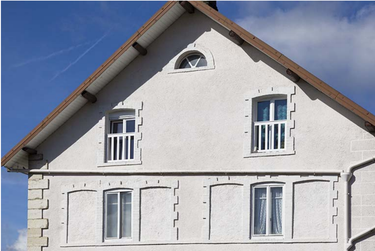
Façade latérale gauche : fenêtres multiples du 2e étage carré et baies du pignon.