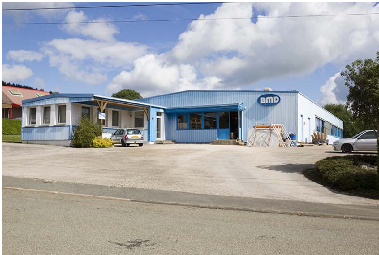
Façade antérieure, de trois quarts droite.