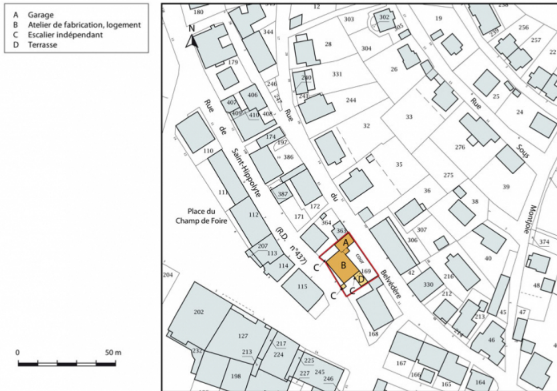
Plan-masse et de situation. Extrait du plan cadastral, 2015, section AB. 25, Maïche, 4 rue de Saint-Hippolyte