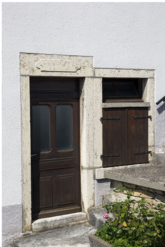
Façade latérale droite : porte avec linteau daté.