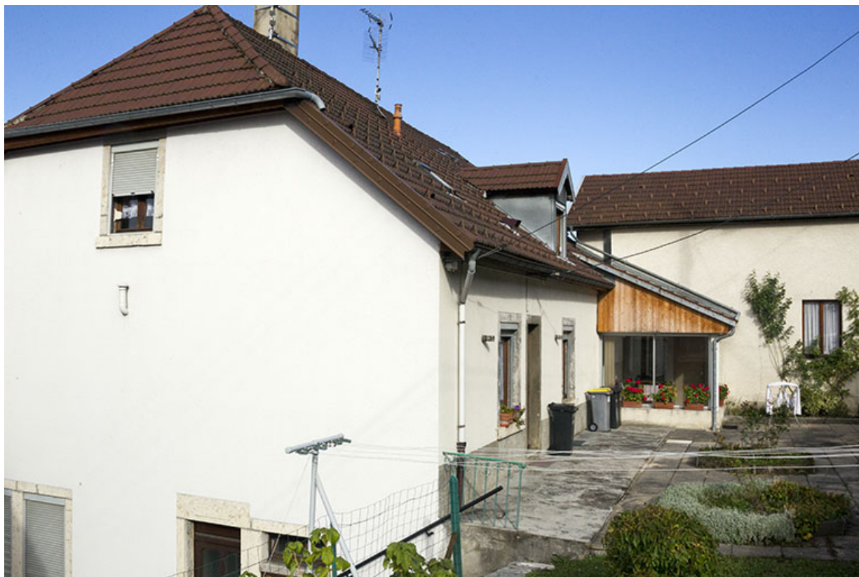
Façades postérieure et latérale droite.