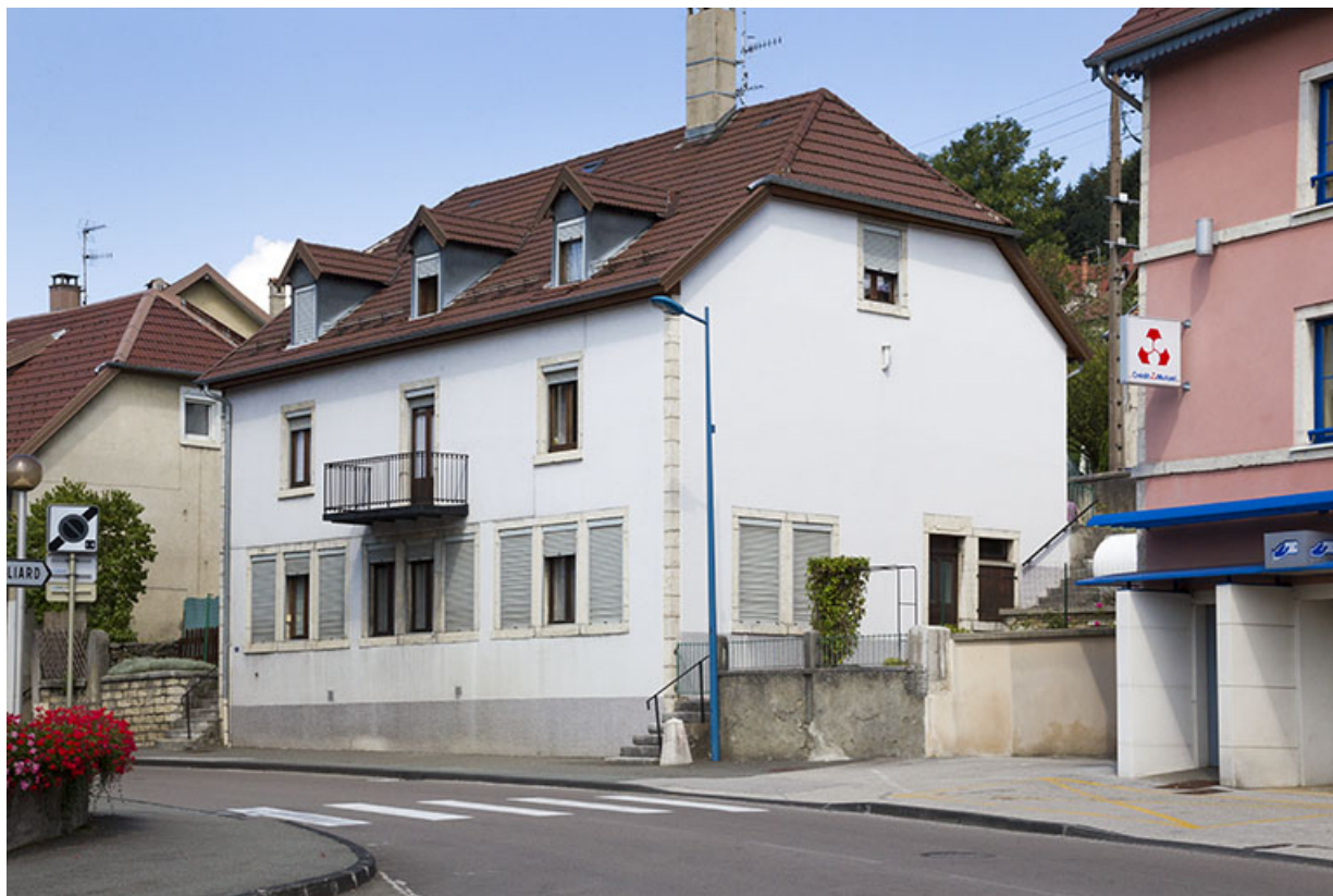
Réutilisation d'un bâtiment existant (1866) : la fabrique d'échappements à cylindre Delacour Frères, au 4 rue de Saint-Hippolyte. 25, Maîche