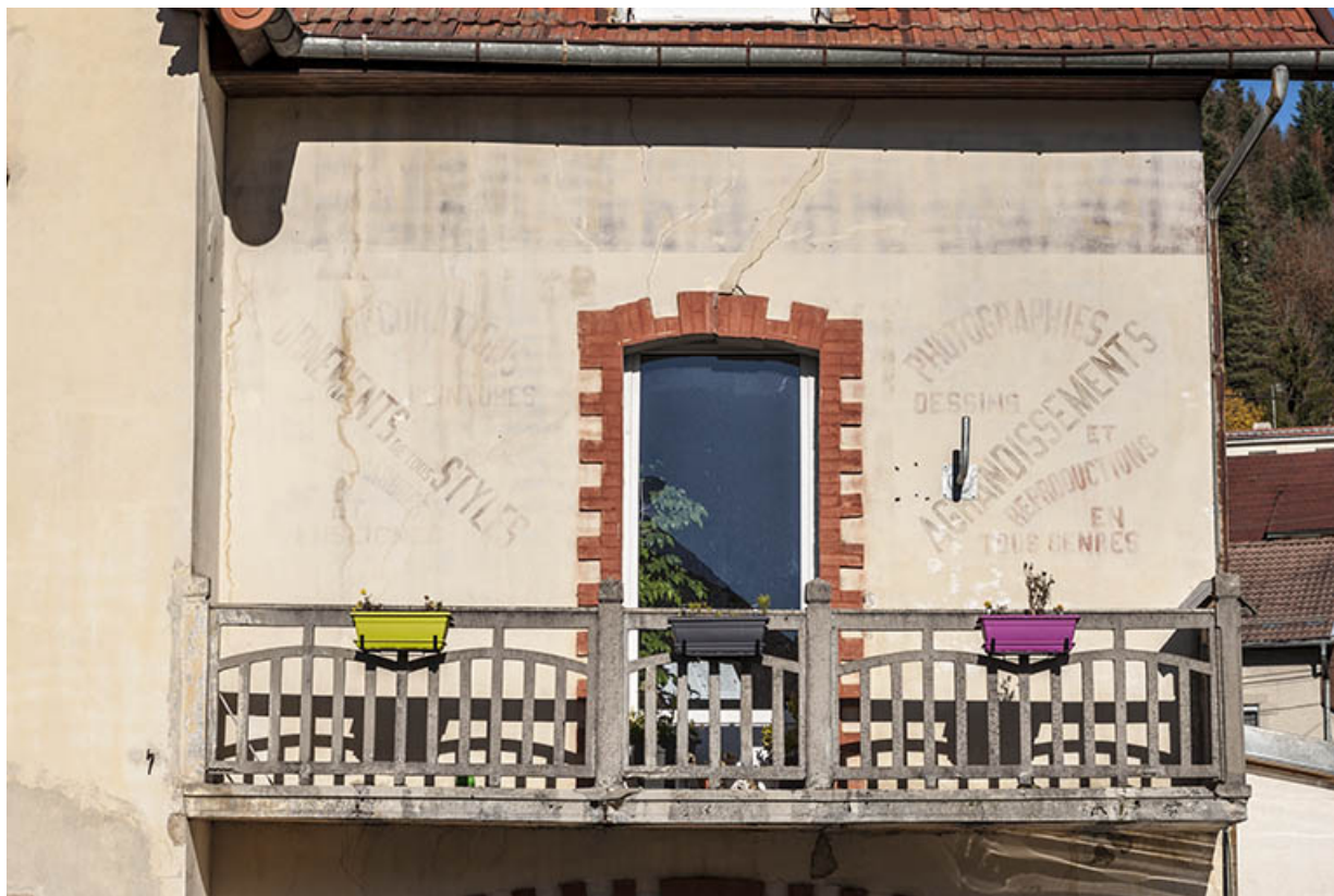
Façade antérieure : enseigne peinte.