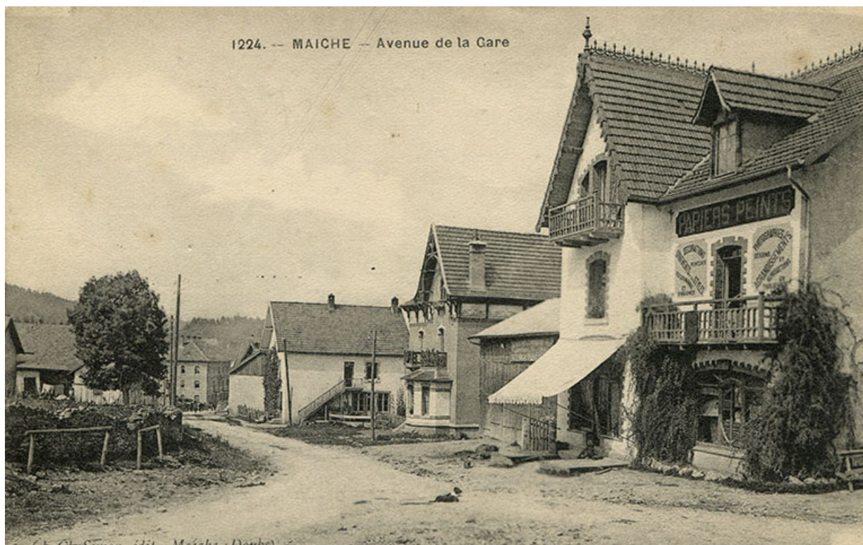
1224. - Maïche - Avenue de la Gare [depuis le carrefour des rues de Goule et du Mont], 1er quart 20e siècle (entre 1911 et 1921). Maison Grux puis atelier d'horlogerie d'Amédée Mairot à droite, maison de l'architecte Langlois puis de l'horloger Paul Mauvais au centre.