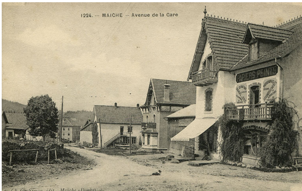
1224. - Maïche - Avenue de la Gare [depuis le carrefour des rues de Goule et du Mont], 1er quart 20e siècle (entre 1911 et 1921). Maison Grux puis atelier d'horlogerie d'Amédée Mairot à droite, maison de l'architecte Langlois puis de l'horloger Paul Mauvais au centre.