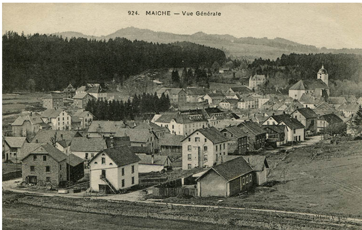
924. Maïche - Vue générale [à l'angle des rues de Goule et du Mont], vers 1911. Le bâtiment est visible à gauche. 25, Maïche, 29 rue du Mont-Miroir