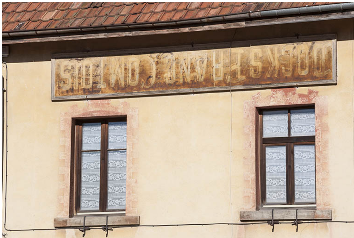
Façade antérieure : encadrements de fenêtres peints en trompe-l'oeil et enseigne réutilisée. 25, Maîche, 29 rue du Mont-Miroir