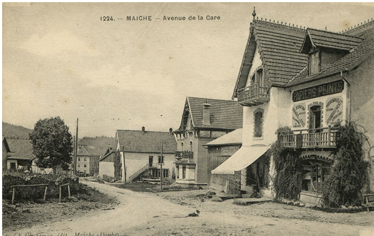
1224. - Maïche - Avenue de la Gare [depuis le carrefour des rues de Goule et du Mont], 1er quart 20e siècle (entre 1911 et 1921). Maison Grux puis atelier d'horlogerie d'Amédée Mairot à droite, maison de l'architecte Langlois puis de l'horloger Paul Mauvais au centre.