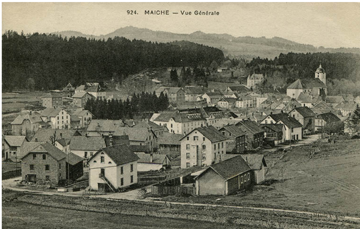
924. Maïche - Vue générale [à l'angle des rues de Goule et du Mont], vers 1911. Le bâtiment est visible à gauche. 25, Maïche, 29 rue du Mont-Miroir