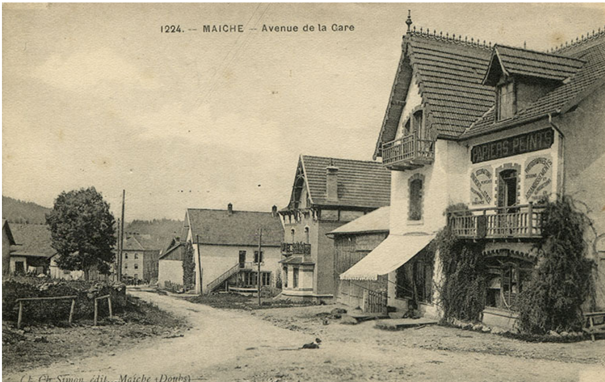
1224. - Maïche - Avenue de la Gare [depuis le carrefour des rues de Goule et du Mont], 1er quart 20e siècle (entre 1911 et 1921). Maison Grux puis atelier d'horlogerie d'Amédée Mairot à droite, maison de l'architecte Langlois puis de l'horloger Paul Mauvais au centre.