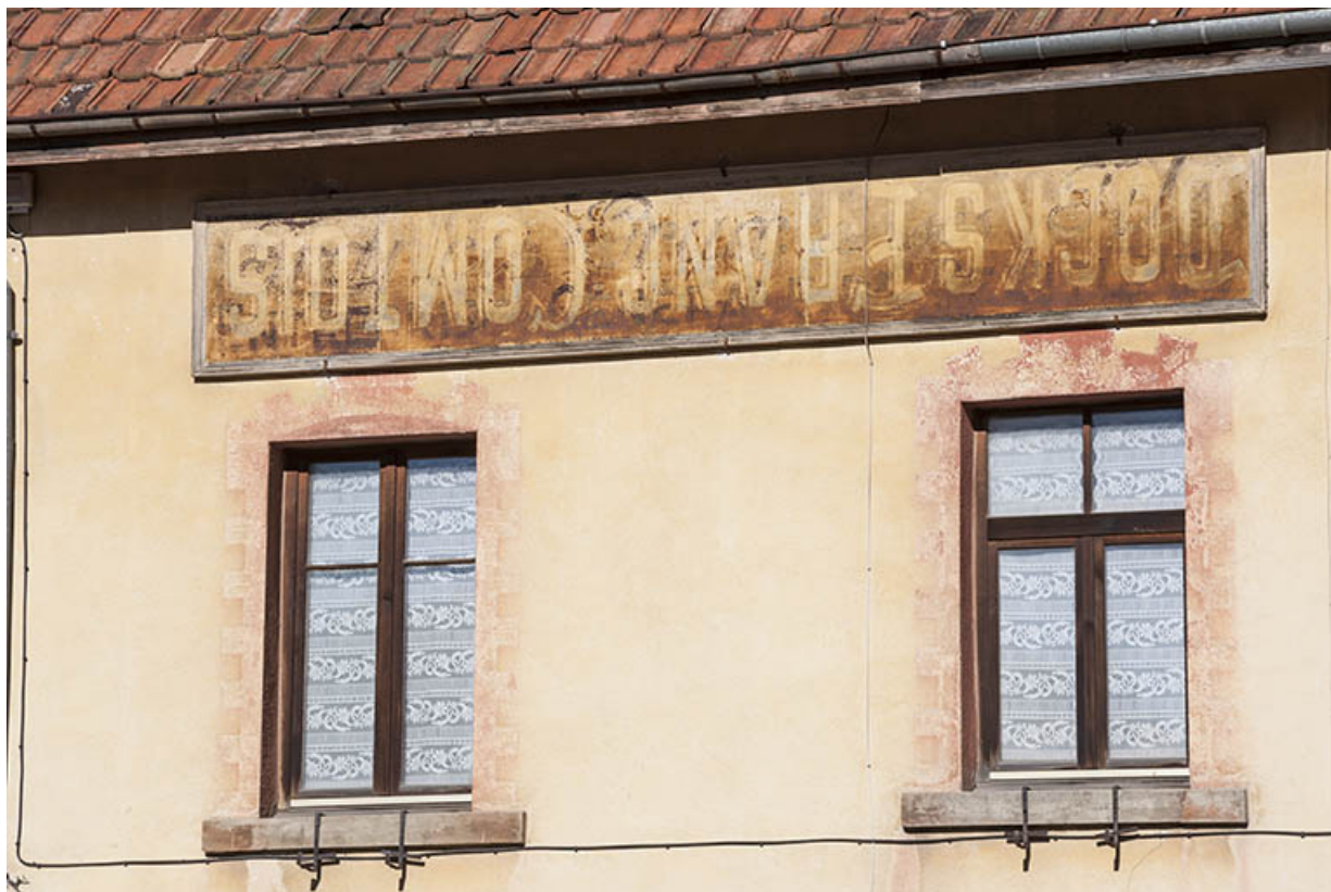
Façade antérieure : encadrements de fenêtres peints en trompe-l'oeil et enseigne réutilisée. 25, Maîche, 29 rue du Mont-Miroir