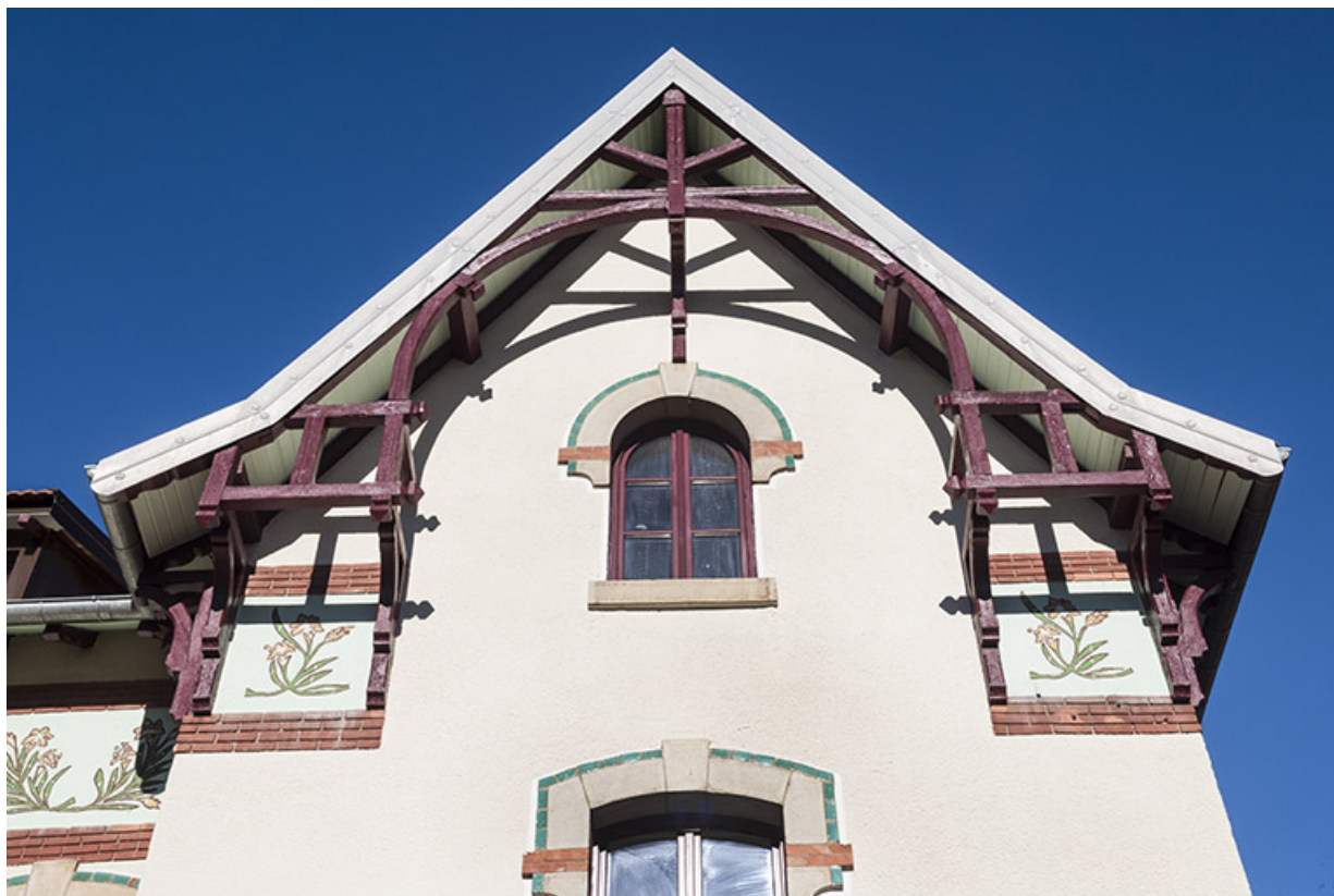
Maison, façade antérieure : le pignon, vu en contre-plongée.