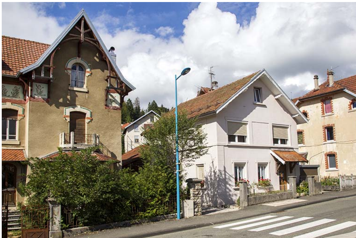
Vue d'ensemble depuis le sud-ouest, avant rénovation de la maison. 25, Maîche, 25 et 27 rue du Mont-Miroir