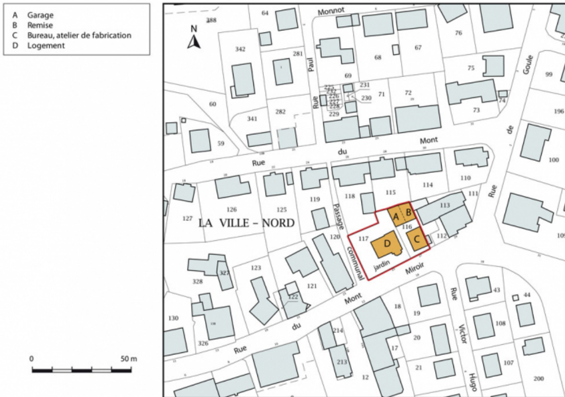
Plan-masse et de situation. Extrait du plan cadastral, 2015, section AB. 25, Maïche, 25 et 27 rue du Mont-Miroir