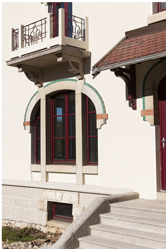
Maison, façade antérieure : baies et balcon à gauche de l'entrée.