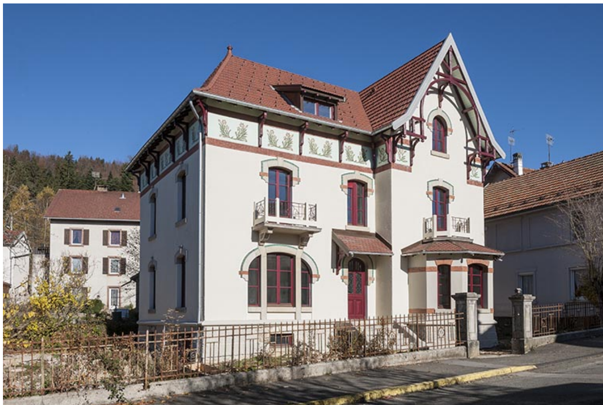
Maison : façade antérieure, de trois quarts gauche.