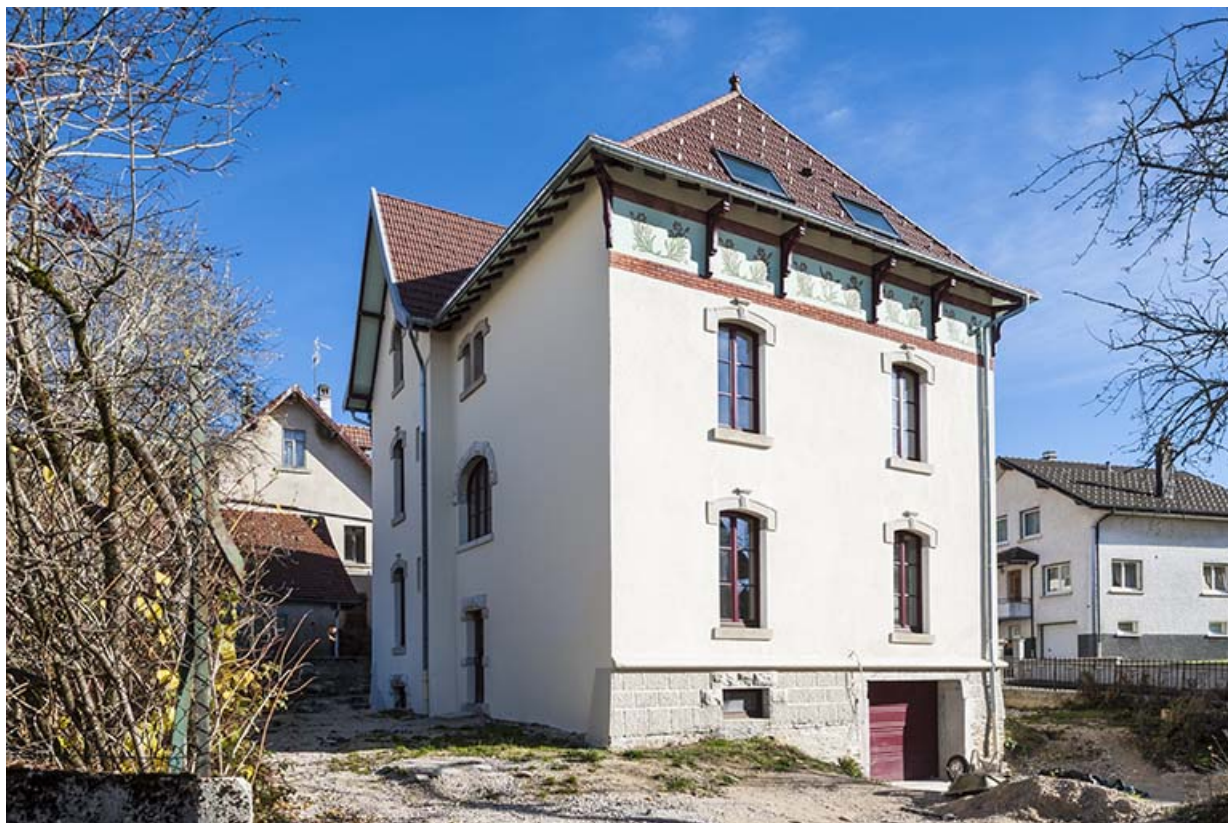
Maison : façades postérieure et latérale gauche.