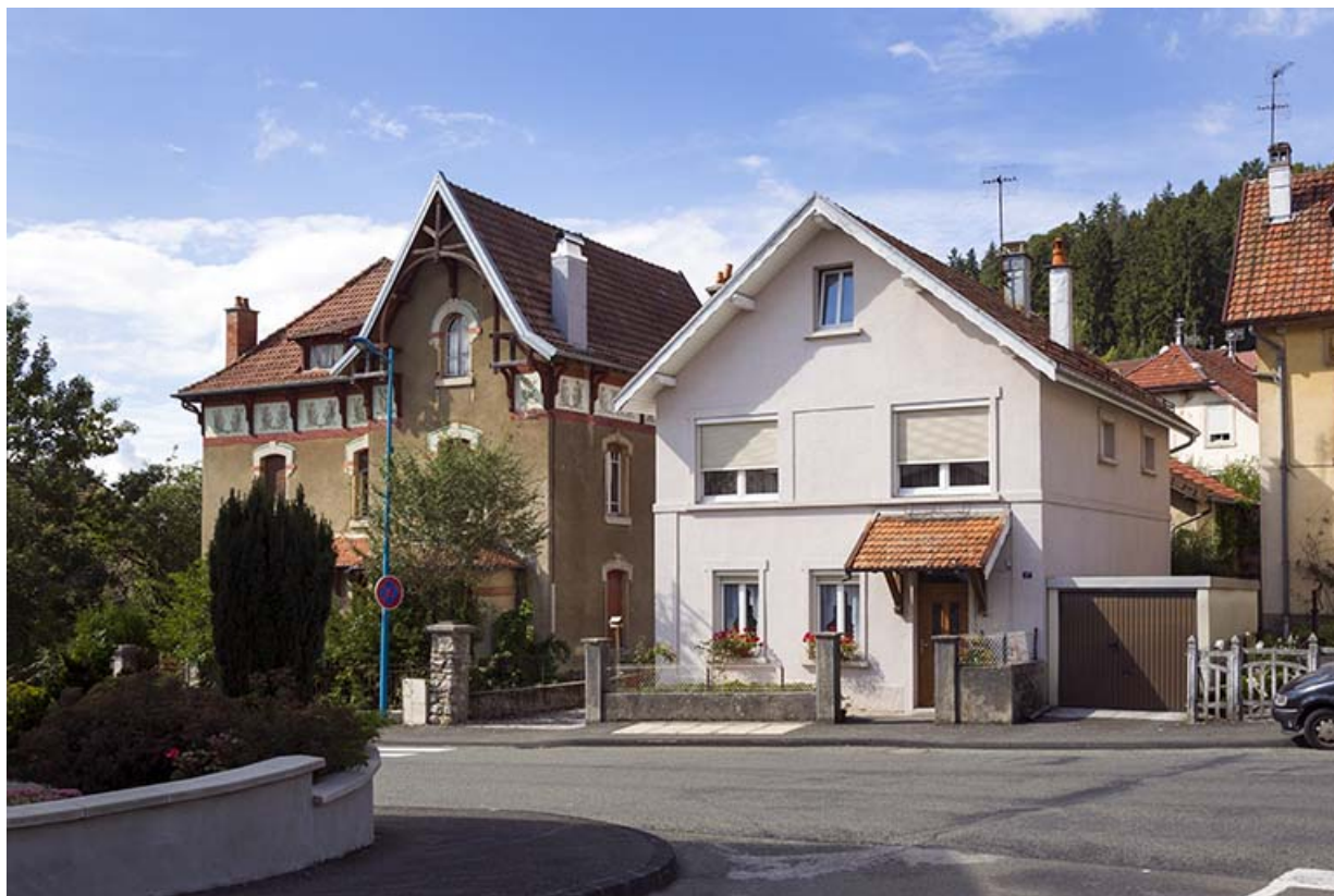
Usine : façade antérieure, de trois quarts droite. A gauche, la demeure de Paul Mauvais avant sa rénovation. 25, Maîche, 25 et 27 rue du Mont-Miroir