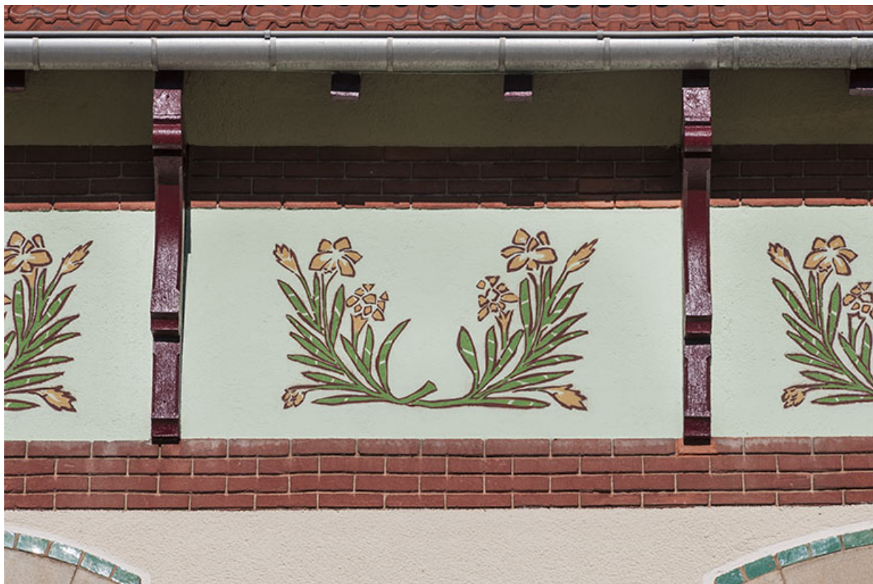
Maison, façade antérieure : détail de la frise peinte.