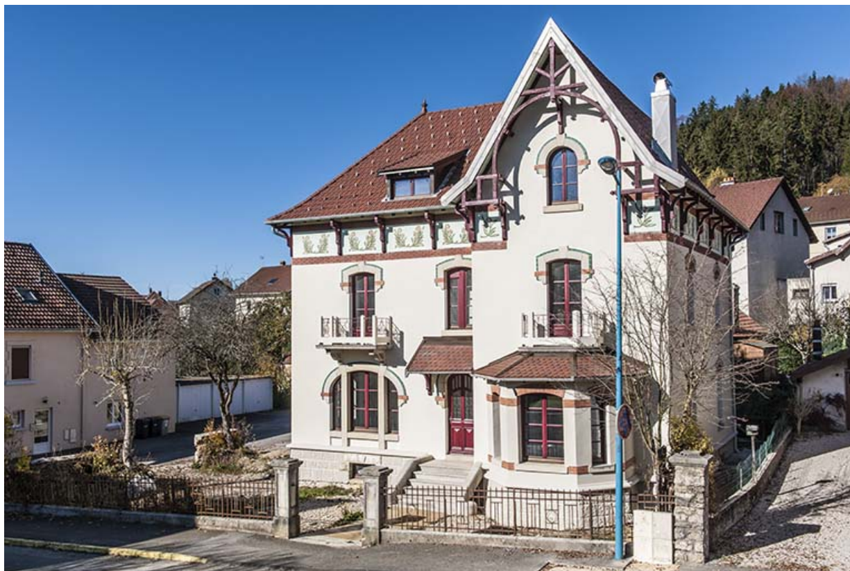
Maison : façade antérieure, de trois quarts droite.