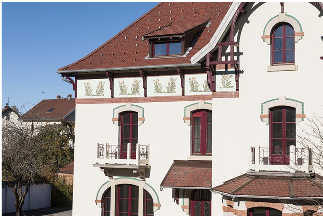
Maison, façade antérieure : détail de la partie supérieure. 25, Maîche, 25 et 27 rue du Mont-Miroir