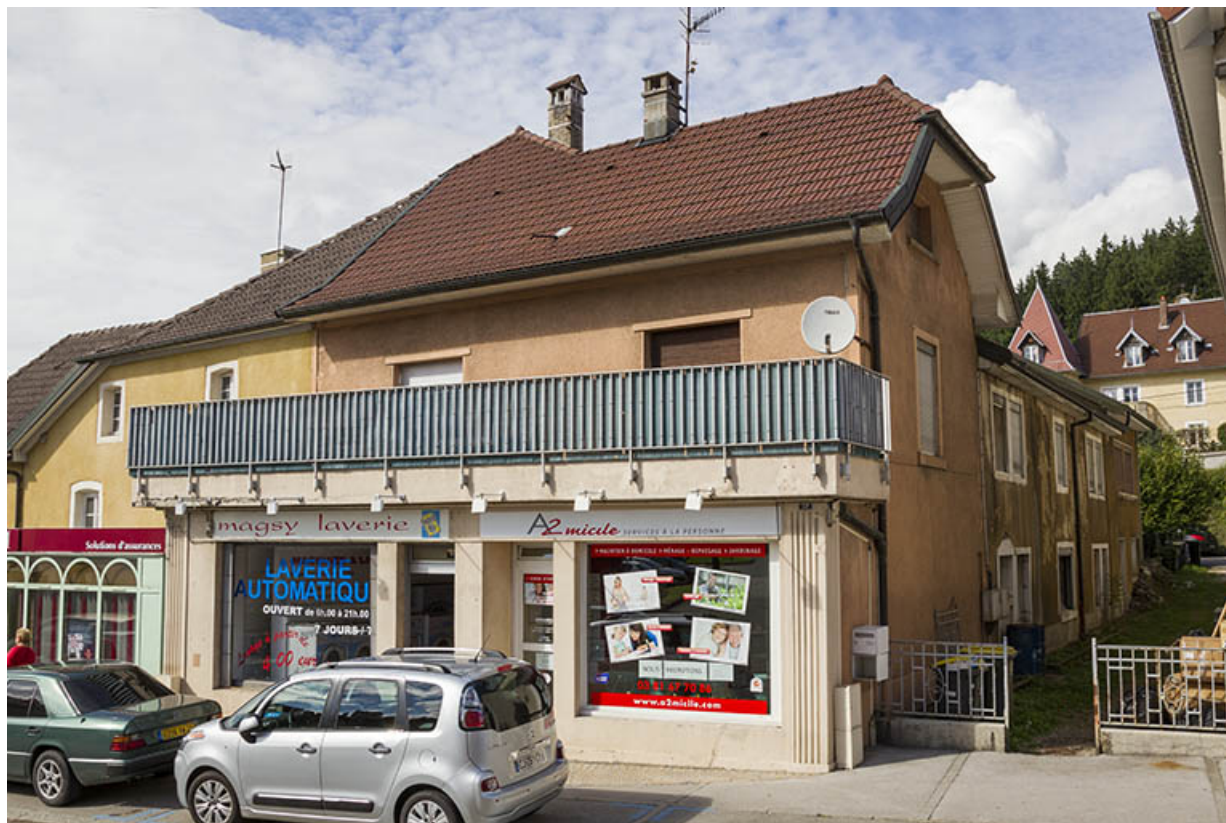
Partie au 19 rue Montalembert : façades antérieure et latérale droite (orientale). 25, Maîche, 17 et 19 rue Montalembert