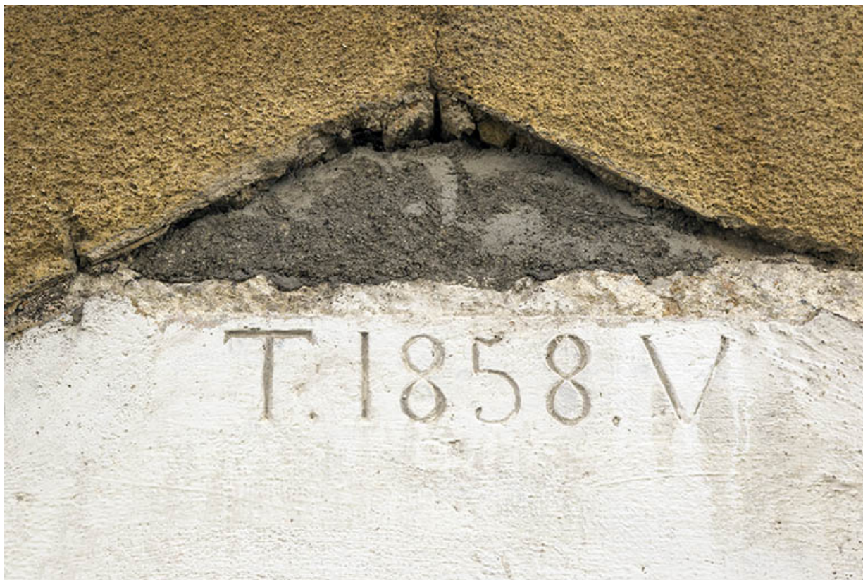
Partie au 19 rue Montalembert, façade latérale droite (orientale) : linteau daté. 25, Maîche, 17 et 19 rue Montalembert