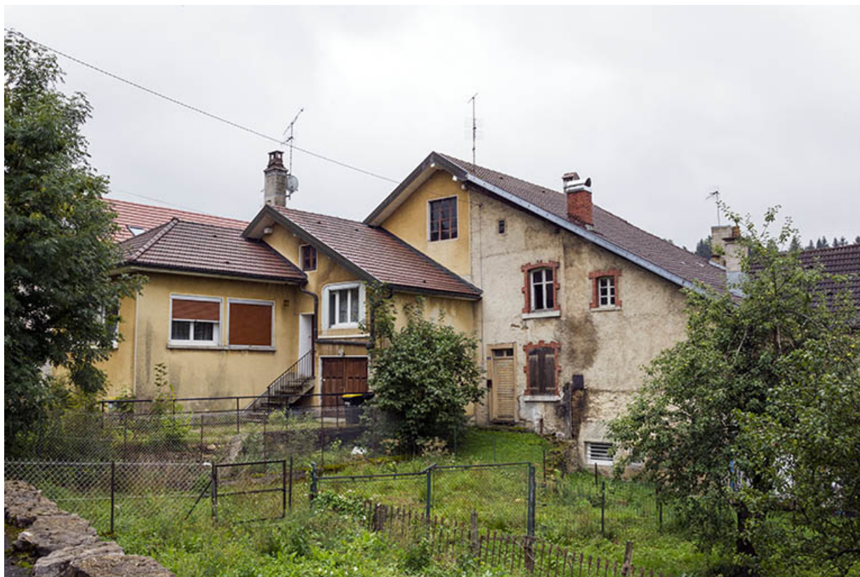
Vue d'ensemble, depuis le nord-ouest (façade postérieure).