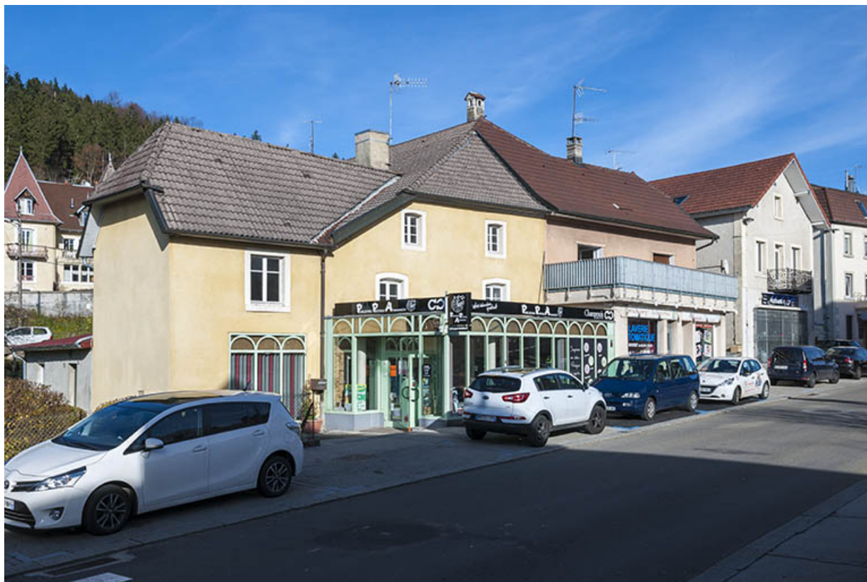
Vue d'ensemble, depuis le sud-ouest (façade antérieure). 25, Maïche, 17 et 19 rue Montalembert