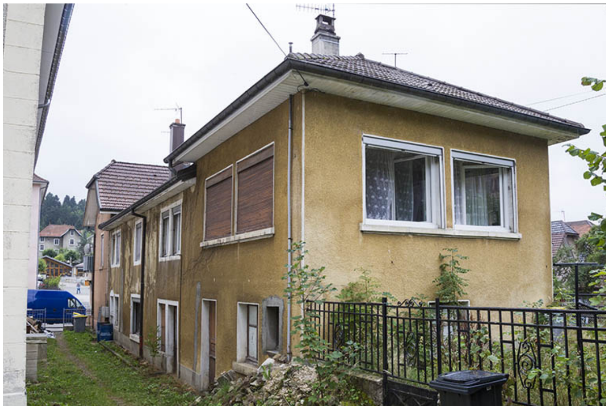
Atelier au 3 rue du Bélvédère et façade orientale. 25, Maîche, 17 et 19 rue Montalembert