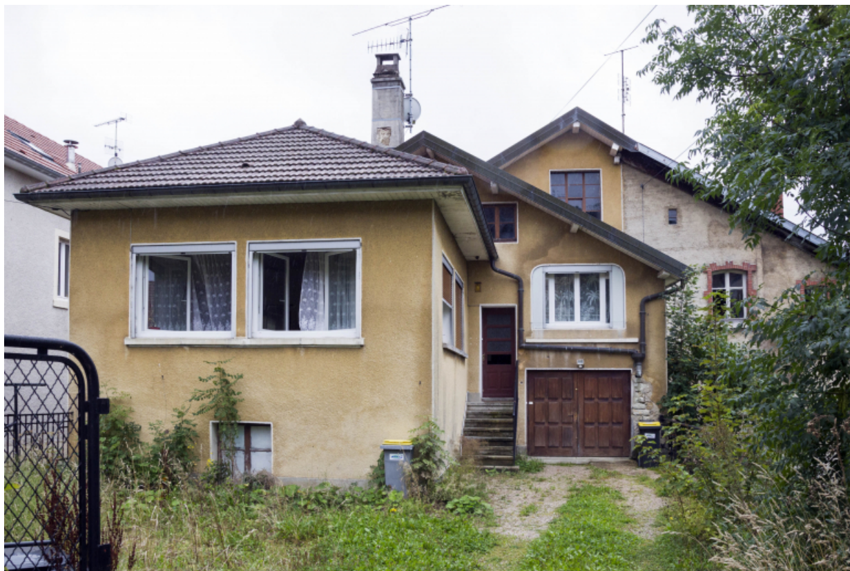
Atelier au 3 rue du Bélvédère et corps intermédiaire. 25, Maïche, 17 et 19 rue Montalembert