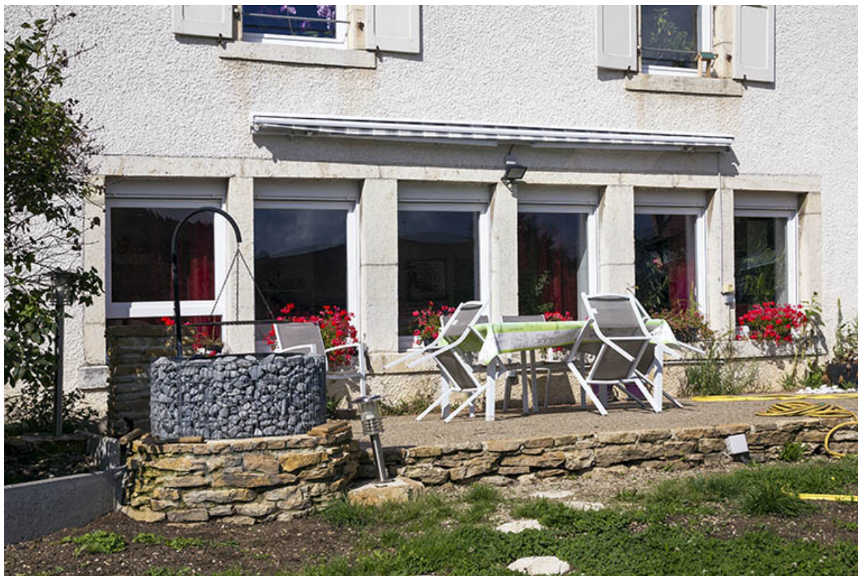
Façade postérieure : fenêtres multiples à l'étage de soubassement. 25, Maîche, 24 rue du Mont