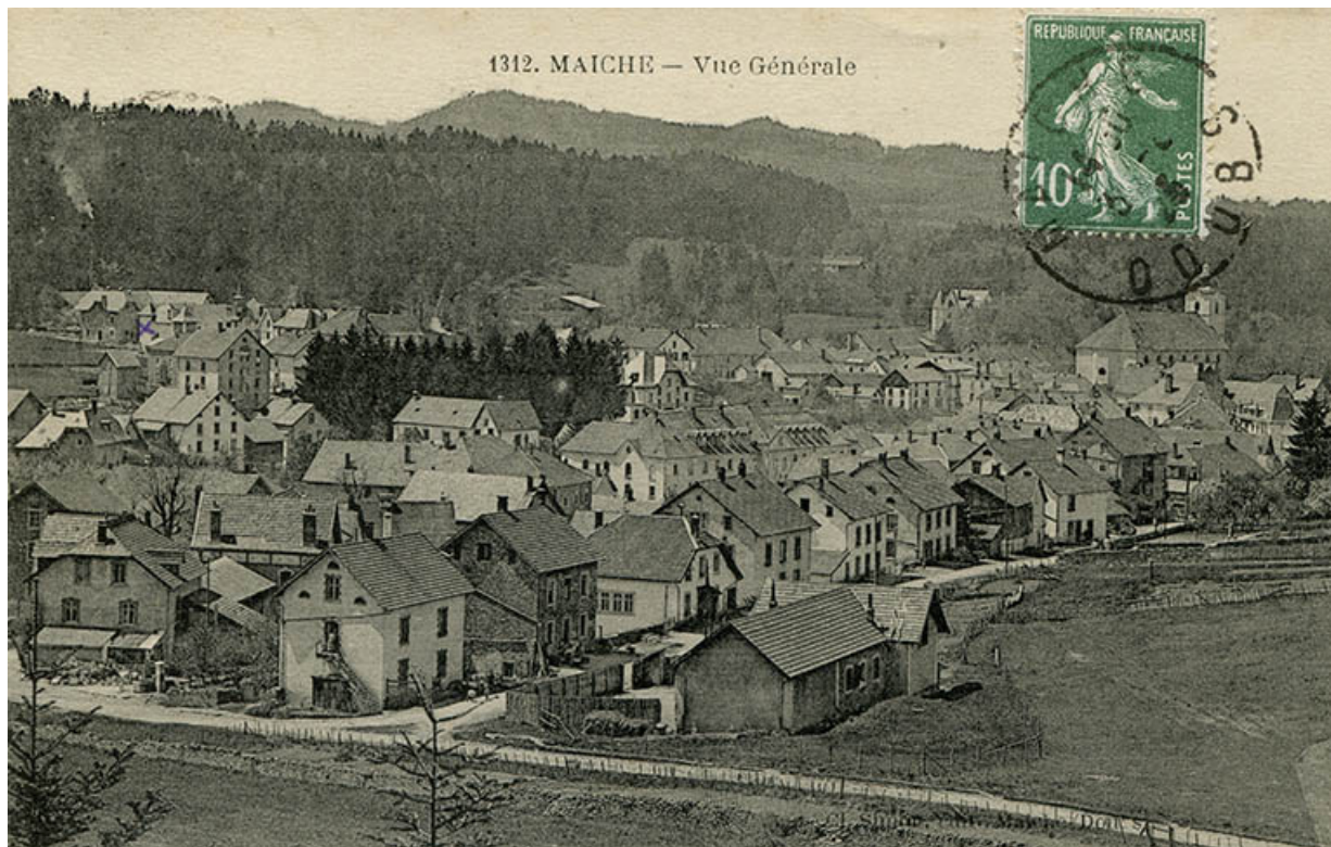
1312. Maïche - Vue générale [à l'angle des rues de Goule et du Mont], 1er quart 20e siècle. 25, Maïche