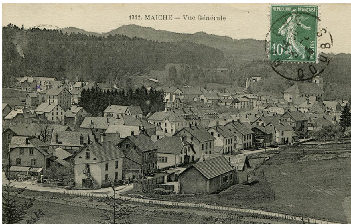
1312. Maïche - Vue générale [à l'angle des rues de Goule et du Mont], 1er quart 20e siècle. 25, Maïche