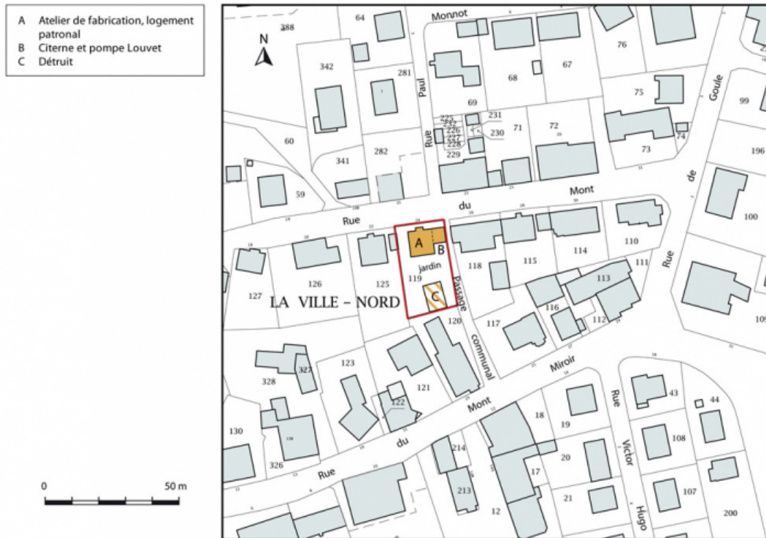
Plan-masse et de situation. Extrait du plan cadastral, 2015, section AB. 25, Maïche, 24 rue du Mont