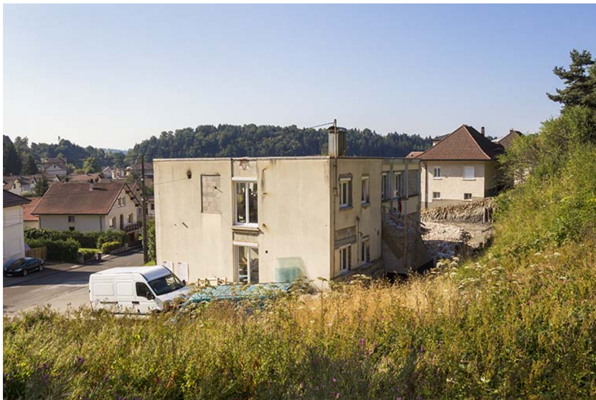
Façades postérieure et latérale droite, avant la transformation en immeuble. 25, Maîche, 13 rue Paul Monnot