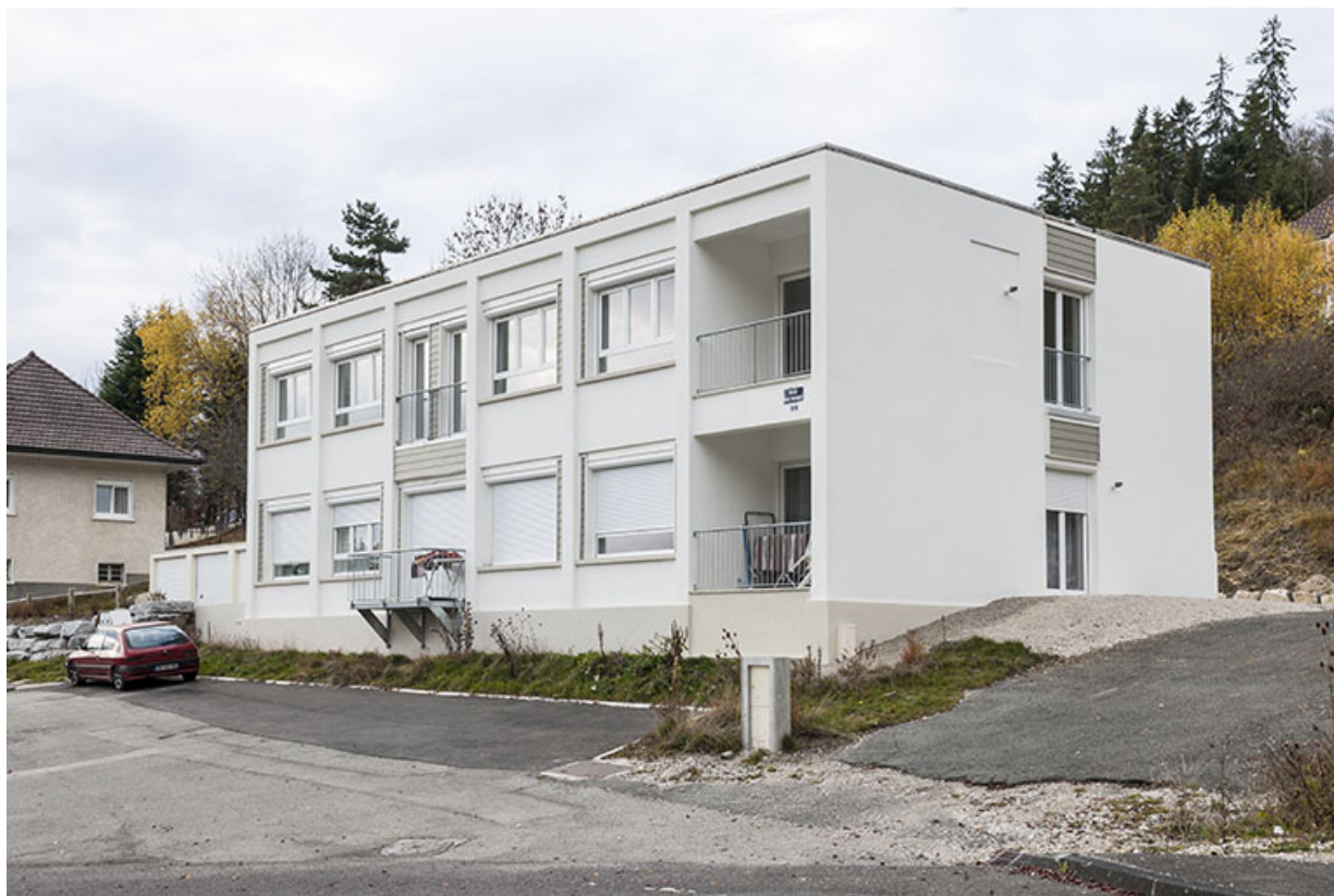
Façades antérieure et latérale droite, après la transformation en immeuble. 25, Maîche, 13 rue Paul Monnot