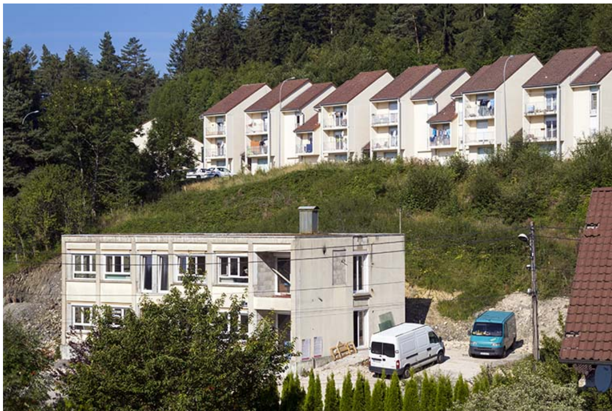
Vue d'ensemble depuis l'est, avant la transformation en immeuble. 25, Maîche, 13 rue Paul Monnot