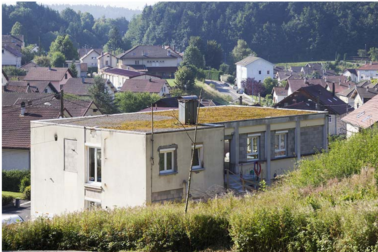
Façade postérieure de trois quarts gauche, avant la transformation en immeuble. 25, Maîche, 13 rue Paul Monnot