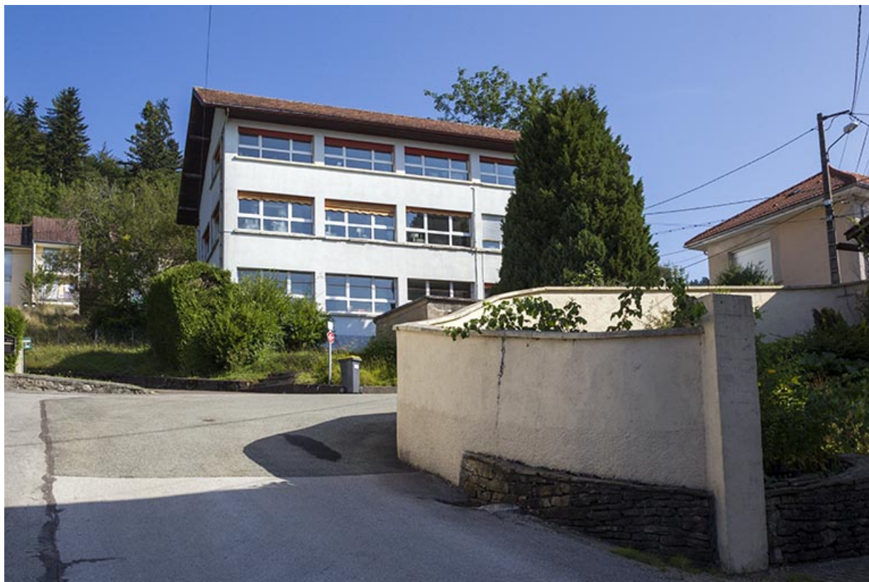
Usine : vue d'ensemble, depuis le sud.