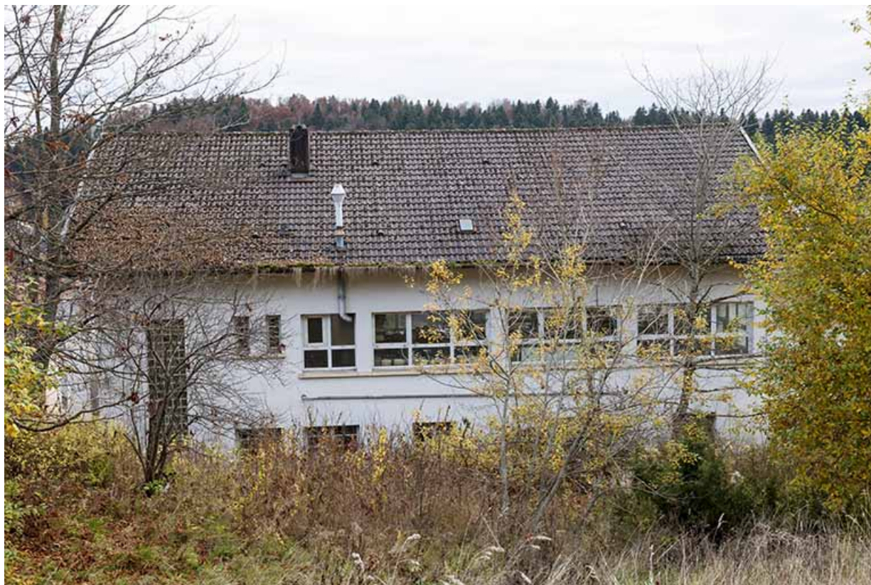
Usine : façade postérieure.