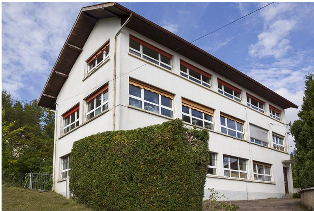
Usine : façades antérieure et latérale gauche.