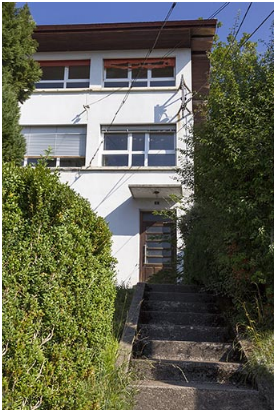
Usine : entrée sur la façade antérieure.