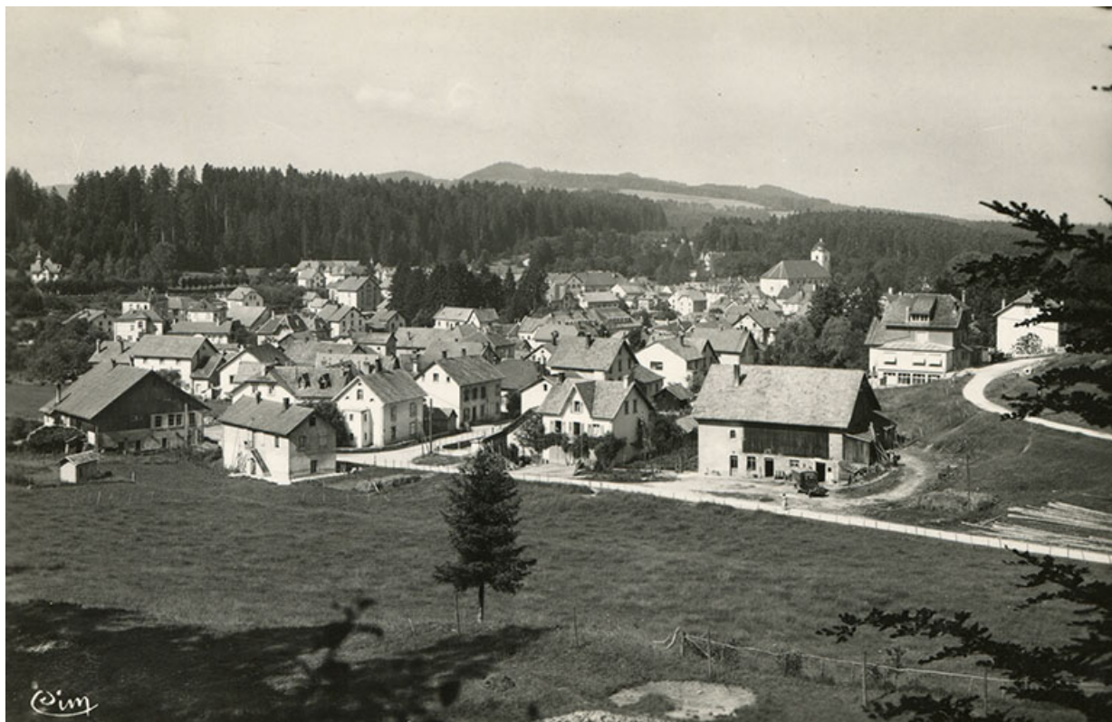
Maïche (Doubs) - Vue générale [depuis le nord-est, montrant les rues de Goule, du Mont et Paul Monnot], milieu 20e siècle. 25, Maïche, 5 et 6 rue Paul Monnot