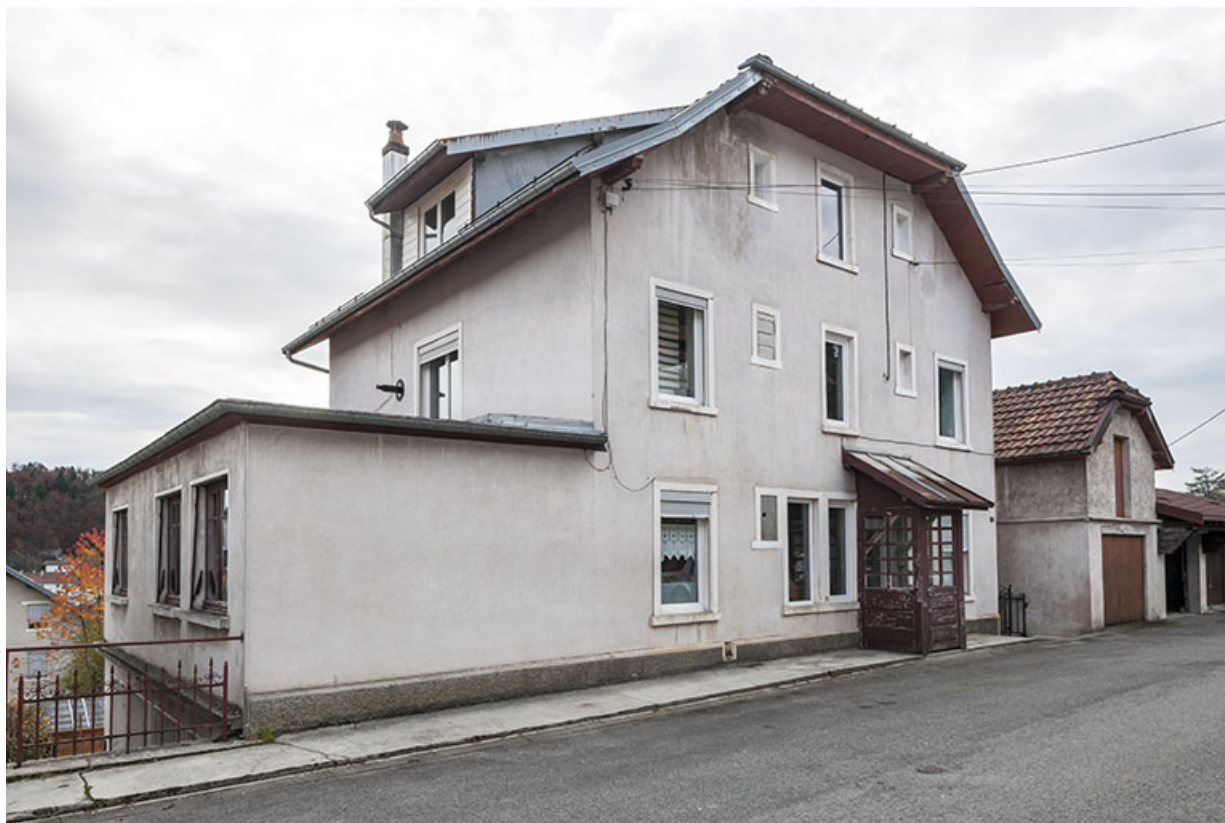
Logement et atelier de fabrication, de trois quarts gauche. le garage est visible à droite.