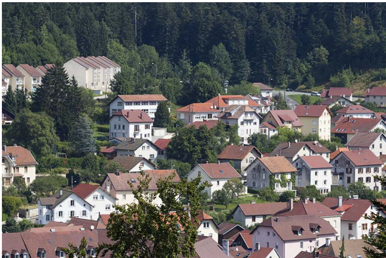
Vue d'ensemble éloignée, depuis le sud-ouest.