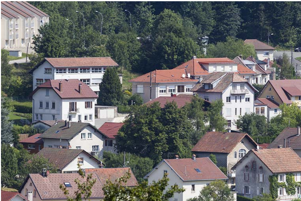
Vue d'ensemble, depuis le sud-ouest. 25, Maîche