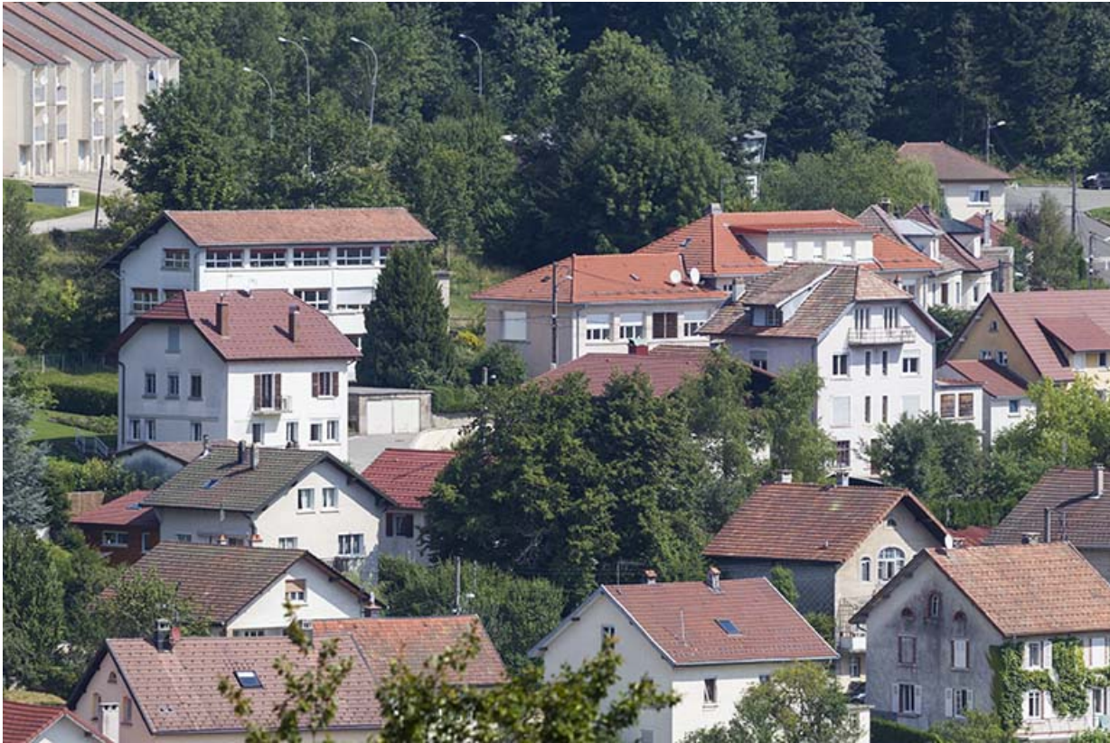
Vue d'ensemble, depuis le sud-ouest.