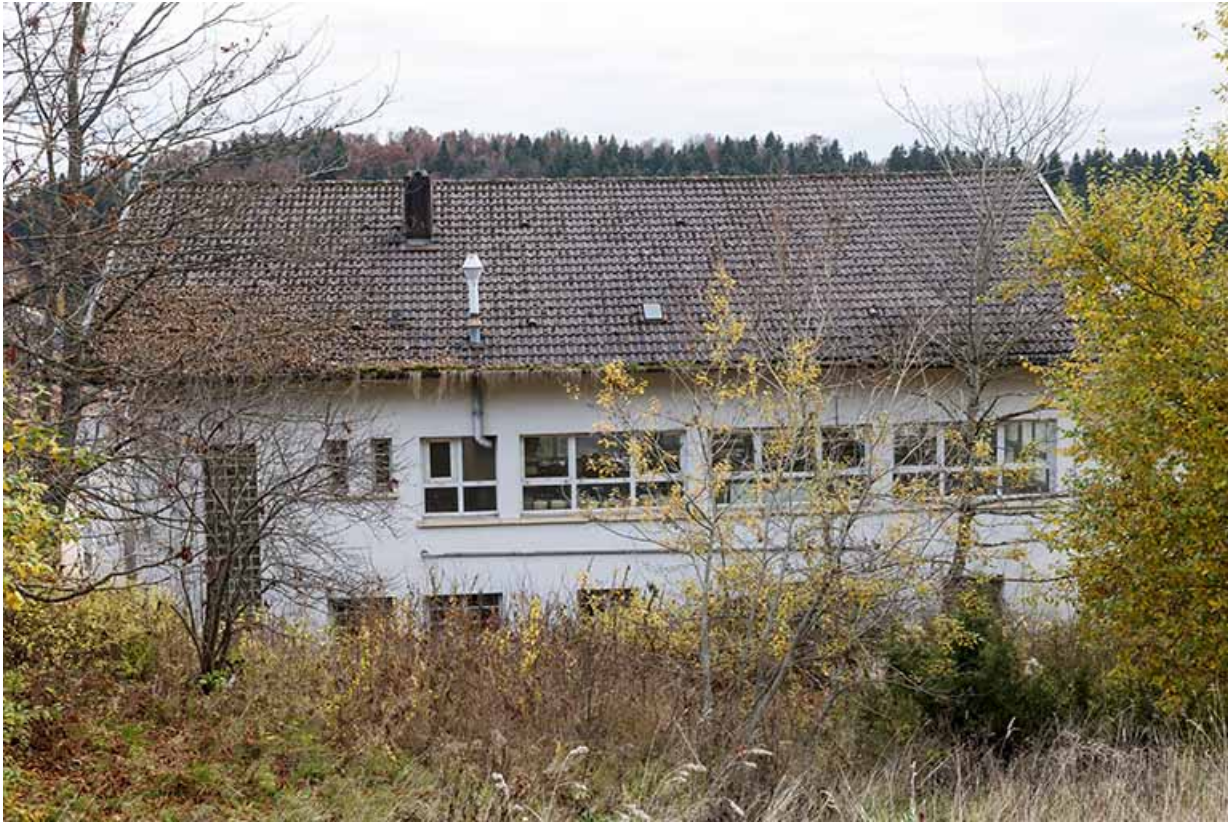
Usine : façade postérieure.