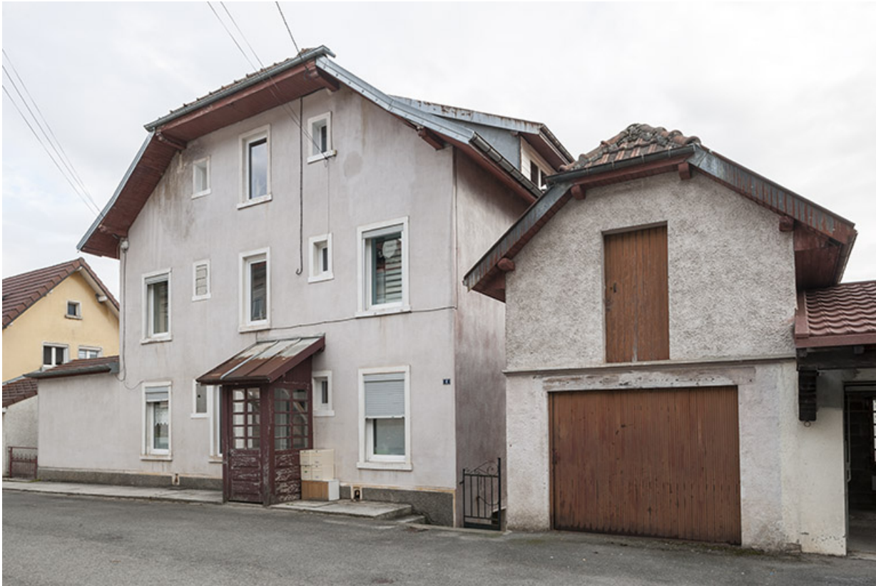
Logement et garage, de trois quarts droite.