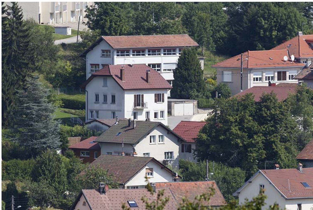
Vue d'ensemble éloignée, depuis le sud-ouest.