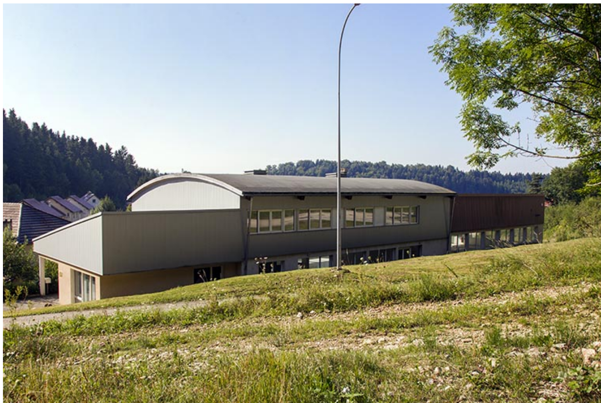
Vue d'ensemble, depuis le nord.