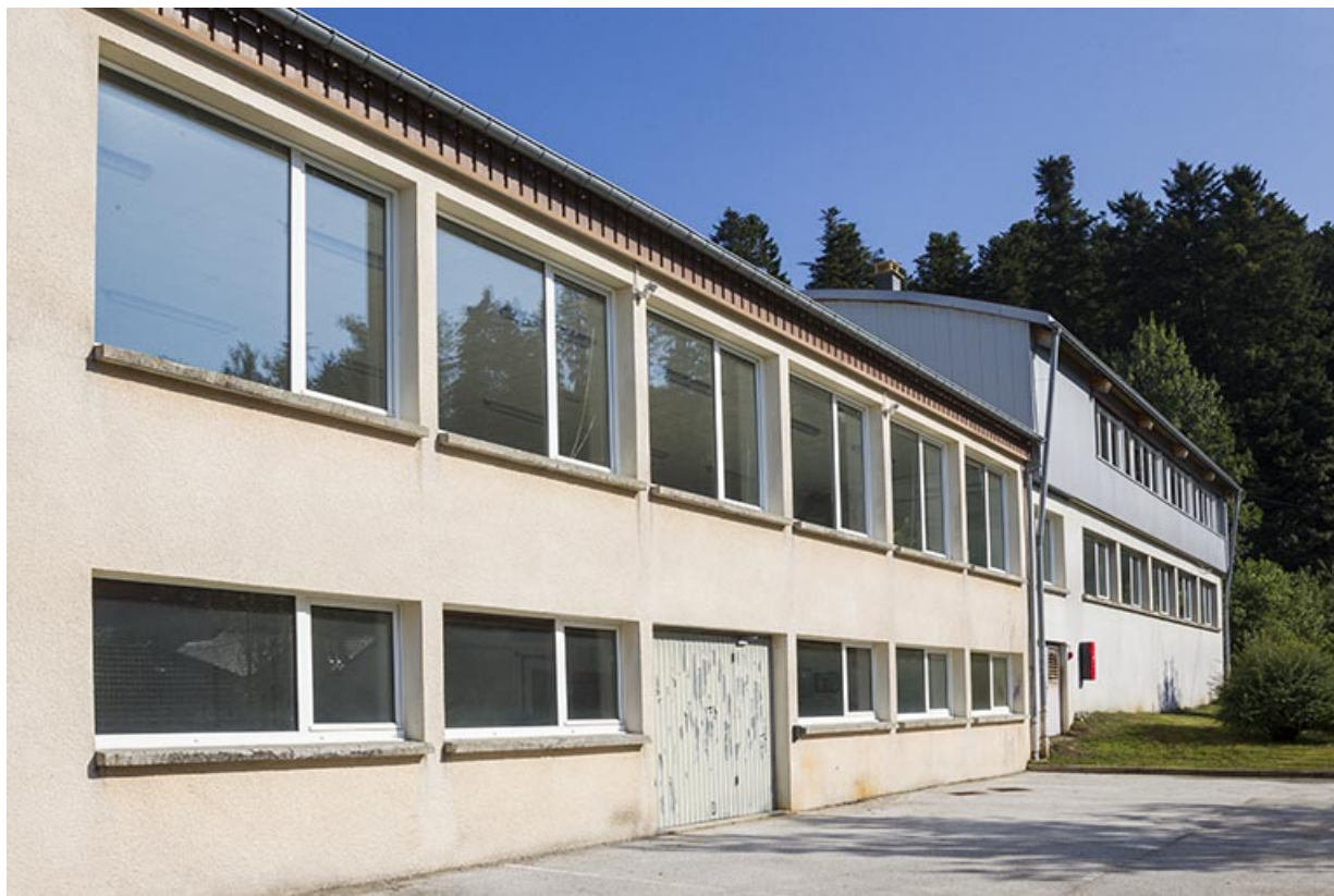
Façade latérale gauche, vue en enfilade.