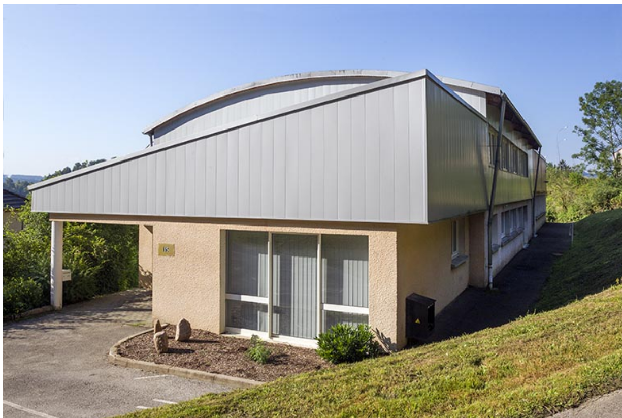
Façade antérieure, de trois quarts droite.