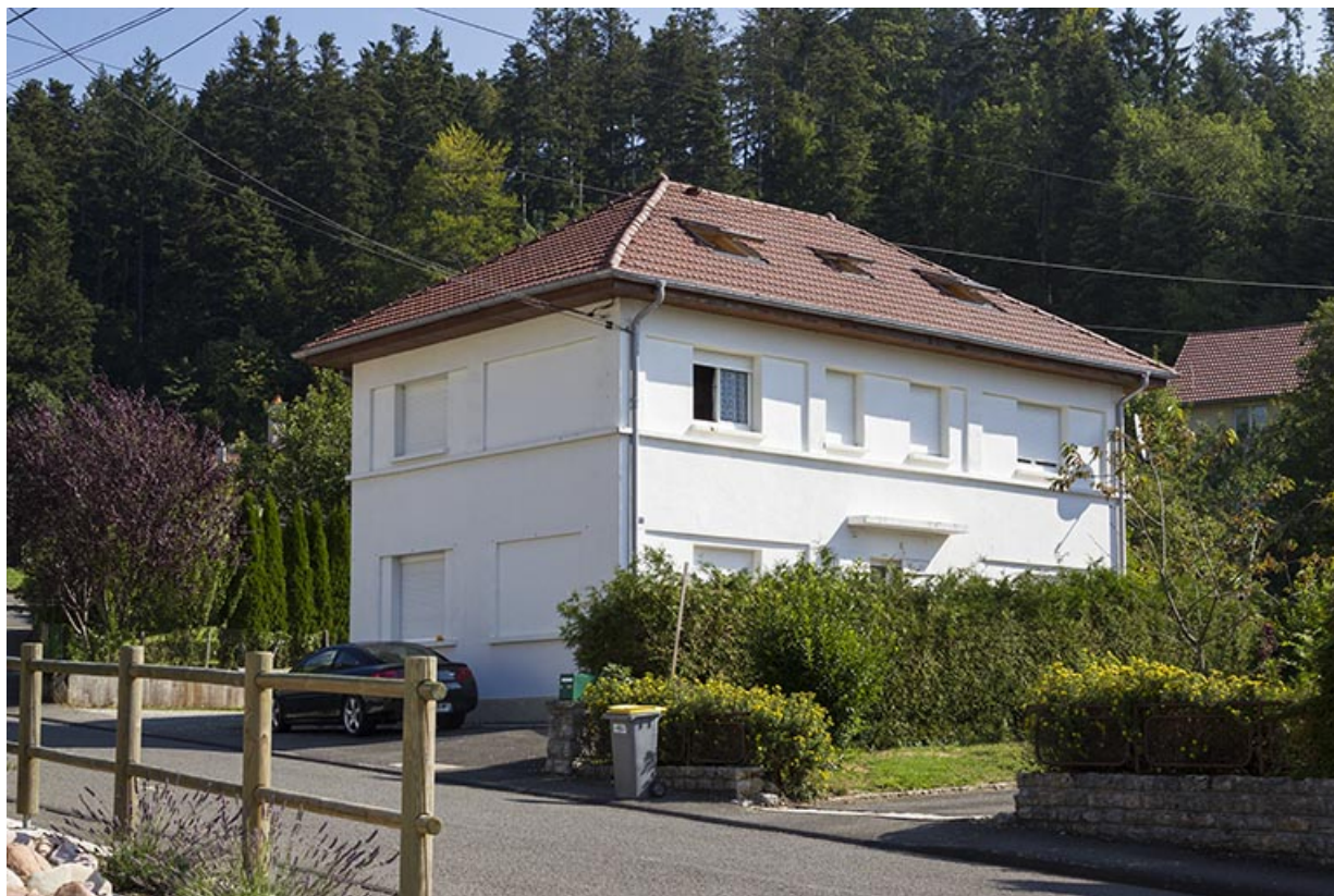
Une fabrique de montres de taille moyenne de l'après-guerre : l'usine Roch Frères (1951), au 14 rue de Goule. 25, Maîche