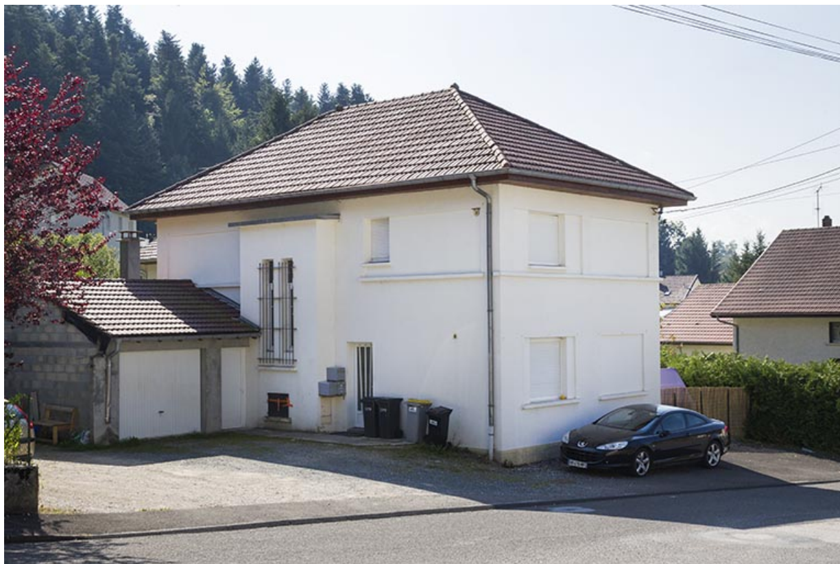
Vue d'ensemble, depuis le nord-ouest.