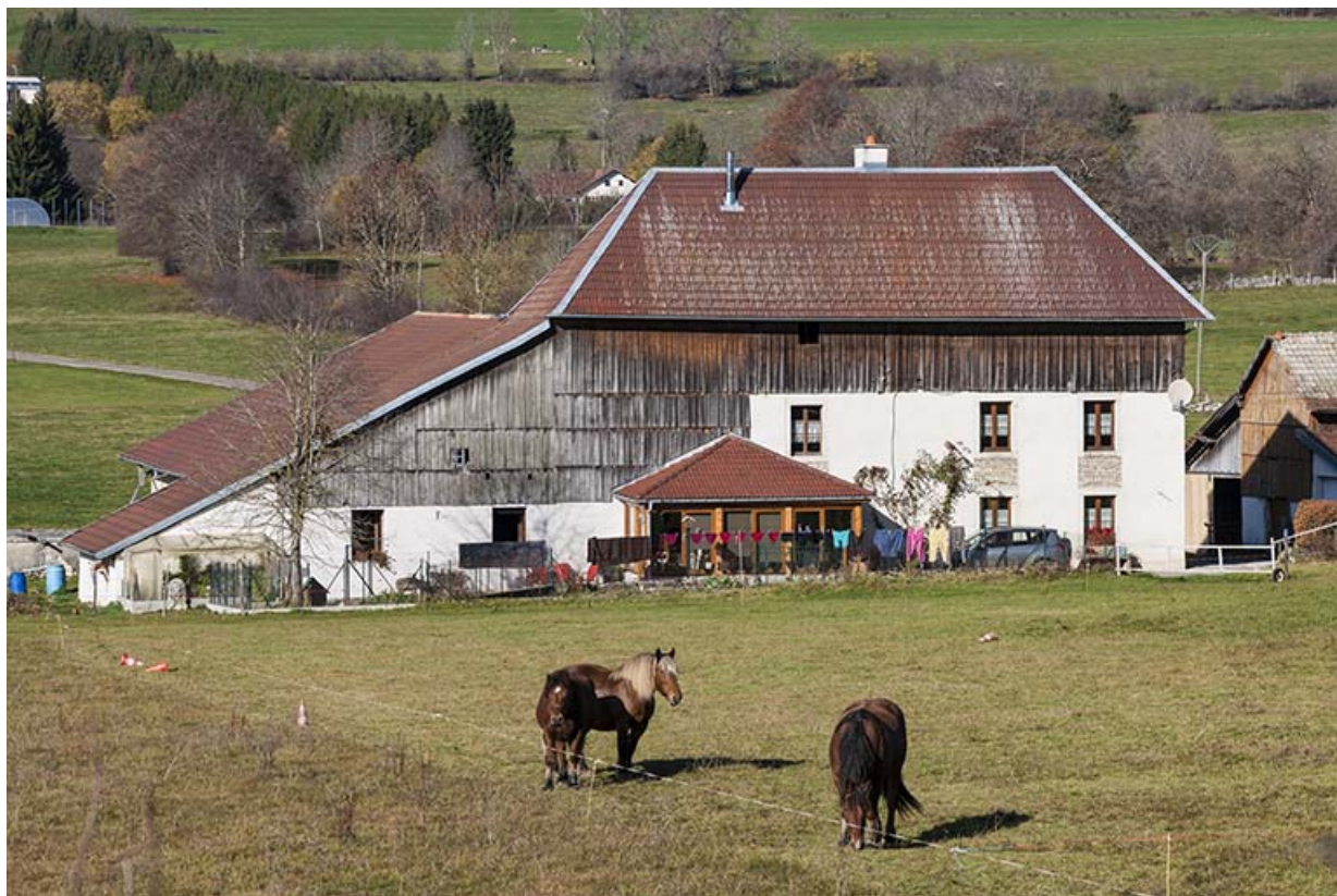
Ferme : façade sud.