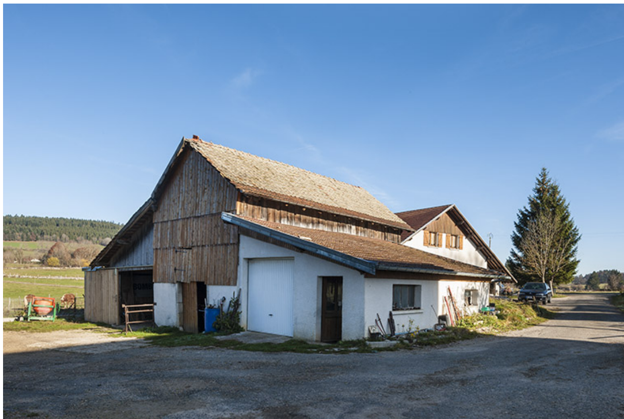
Remise agricole, en avant de la maison de 1984.