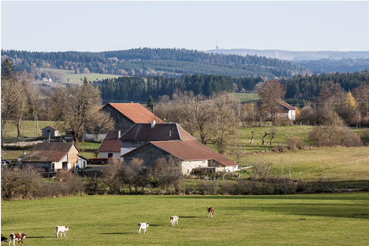
Vue d'ensemble de la ferme et de la remise agricole, depuis le nord-ouest.