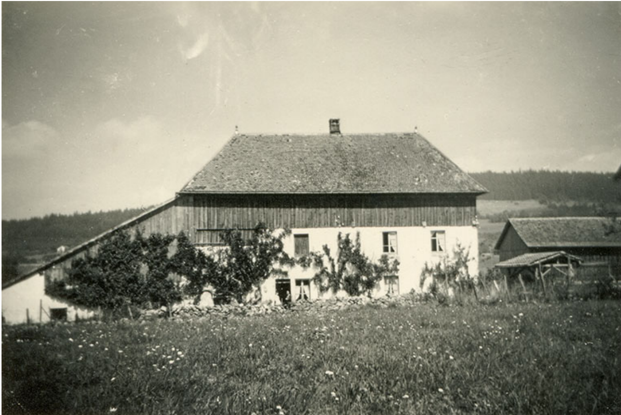
[Façade antérieure de la ferme], été 1961.