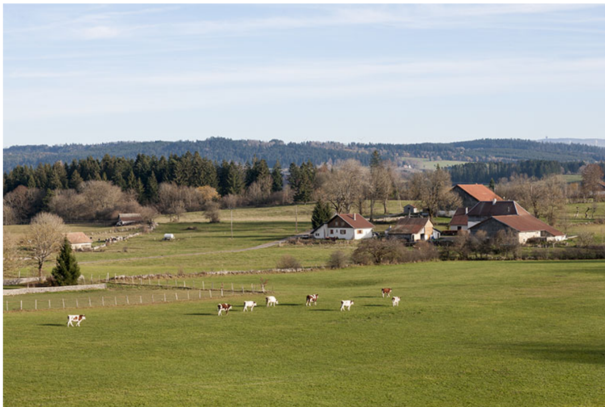
La campagne maïchoise au Grand Vau. 25, Maïche