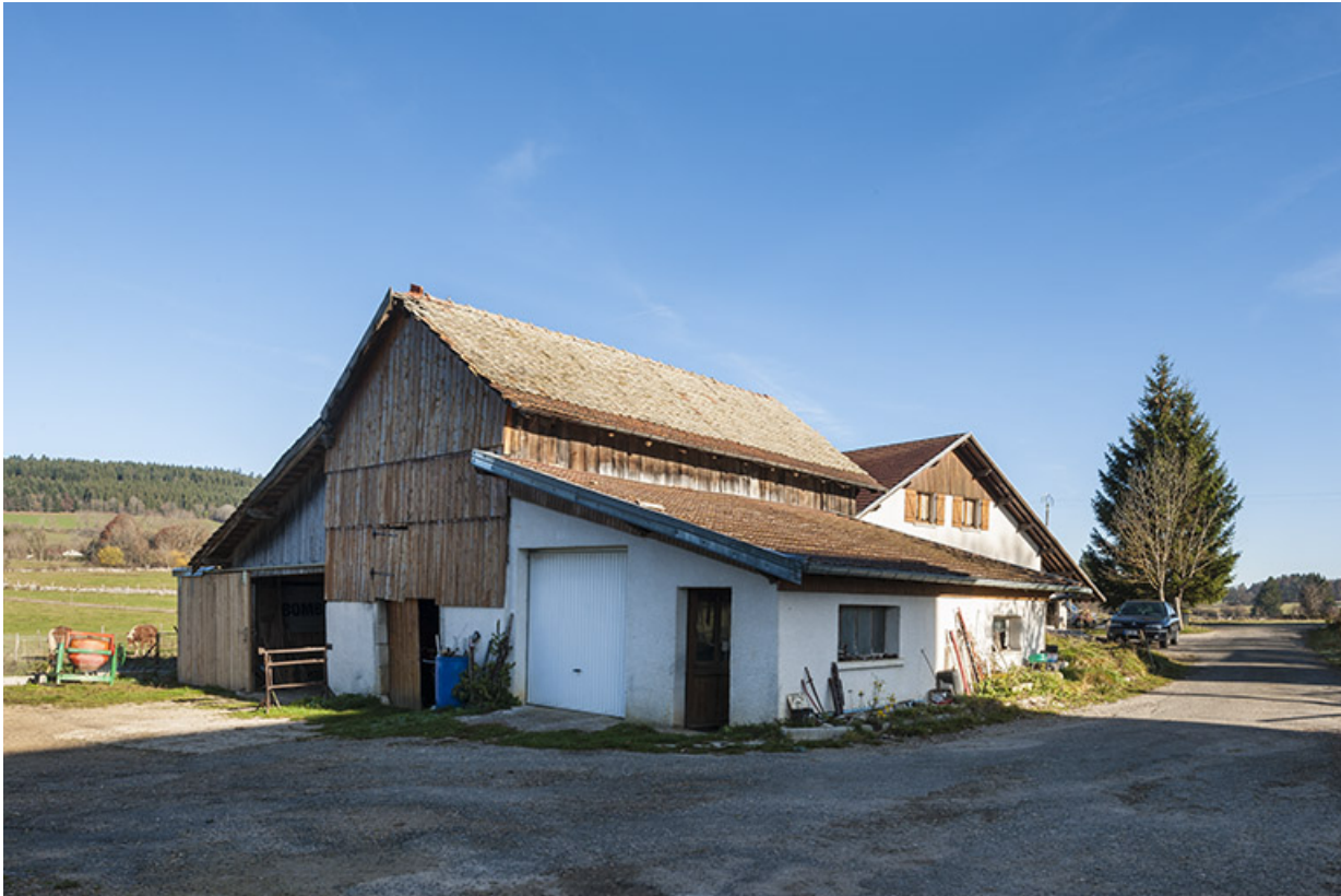
Remise agricole, en avant de la maison de 1984.