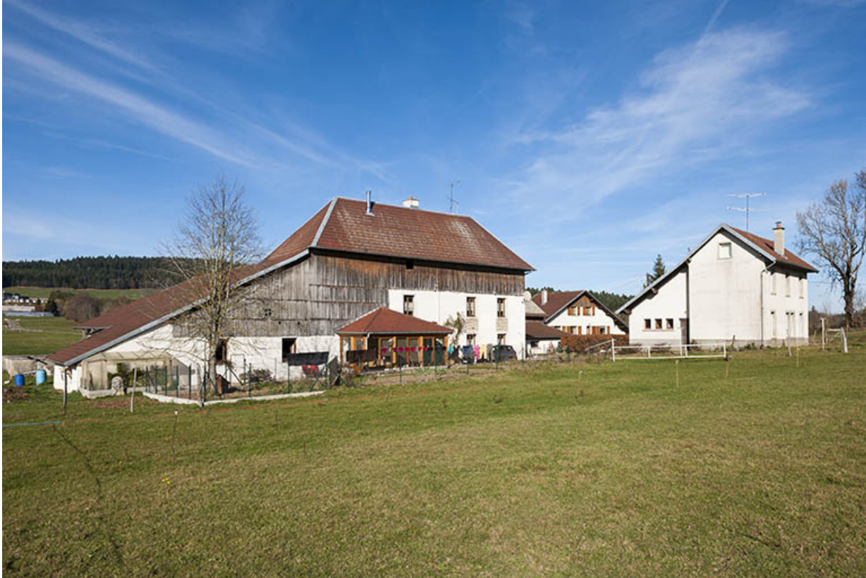
Une ferme dotée d'un atelier indépendant, au Grand Vau : la ferme de Lucien Bessot (1731) et son atelier de 1924. 25, Maîche, lieudit : Grand Vau