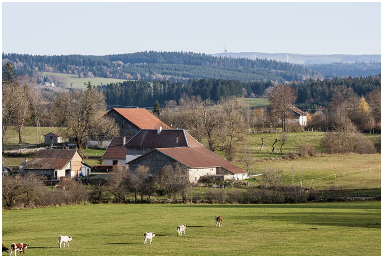
Vue d'ensemble de la ferme et de la remise agricole, depuis le nord-ouest.