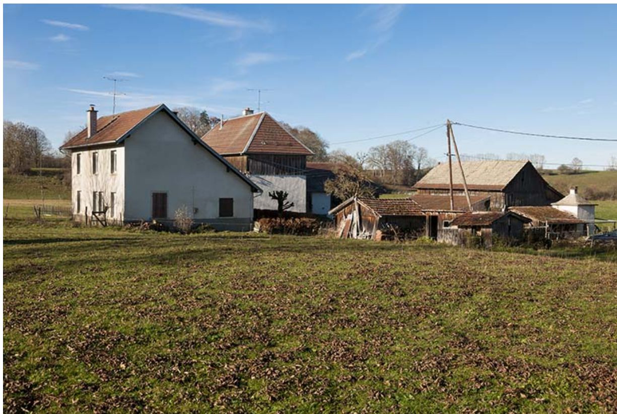
Atelier, ferme et remise agricole, depuis l'est.