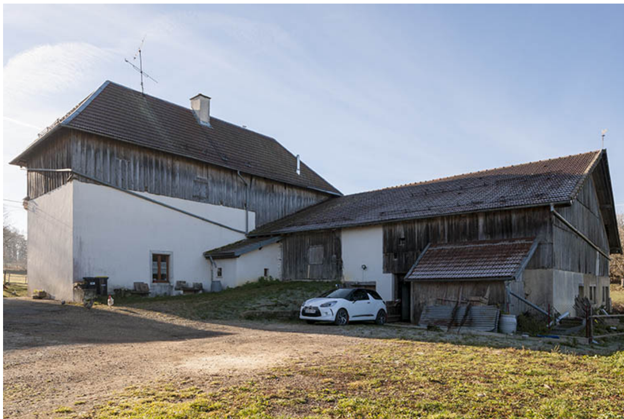
Ferme : façades nord et est. 25, Maîche, lieudit : Grand Vau