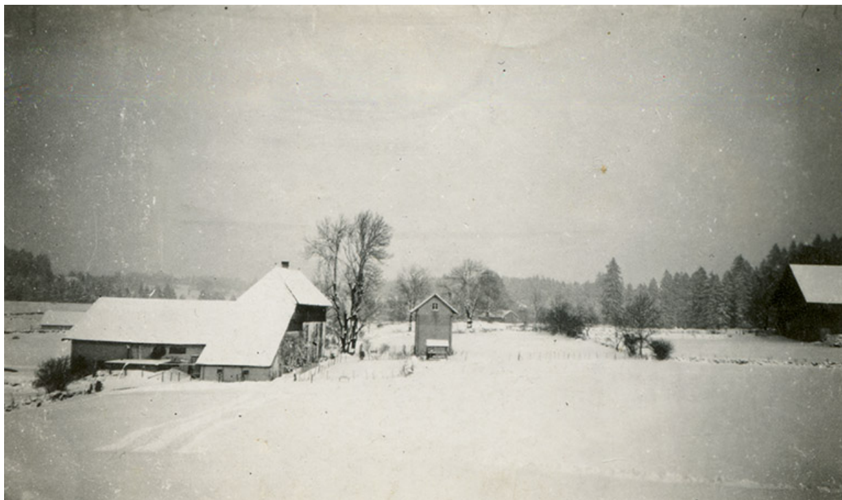
[Vue d'ensemble de la ferme du Grand Vau et de son atelier d'horlogerie, commune de Maïche], 3e quart 20e siècle.