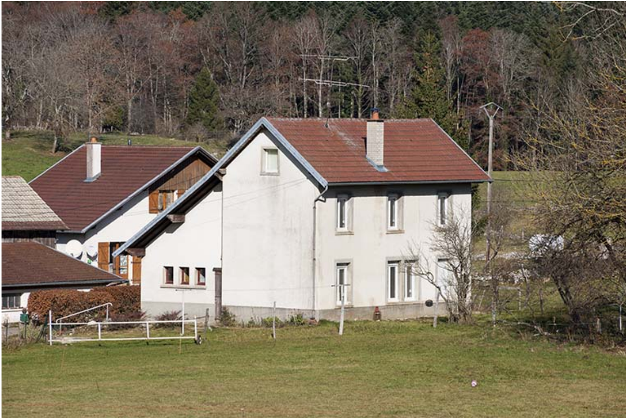
Atelier : façades sud et ouest. L'ancienne fenêtre multiple est visible au rez-de-chaussée.