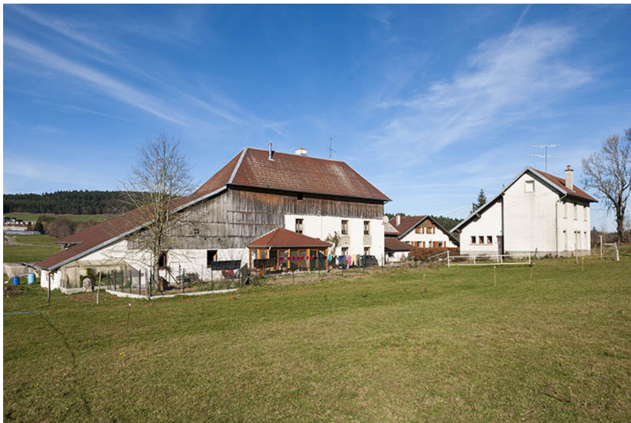
Une ferme dotée d'un atelier indépendant, au Grand Vau : la ferme de Lucien Bessot (1731) et son atelier de 1924. 25, Maîche, lieudit : Grand Vau