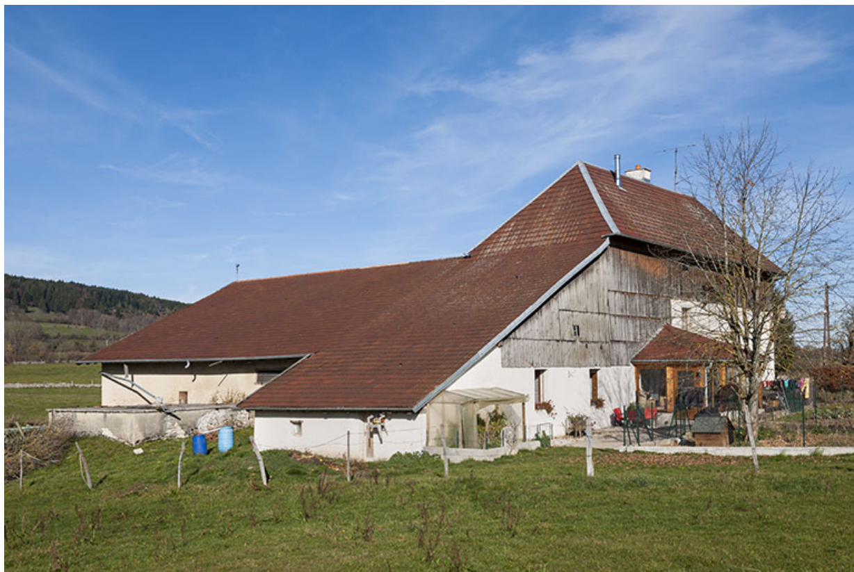
Ferme : façades sud et ouest.