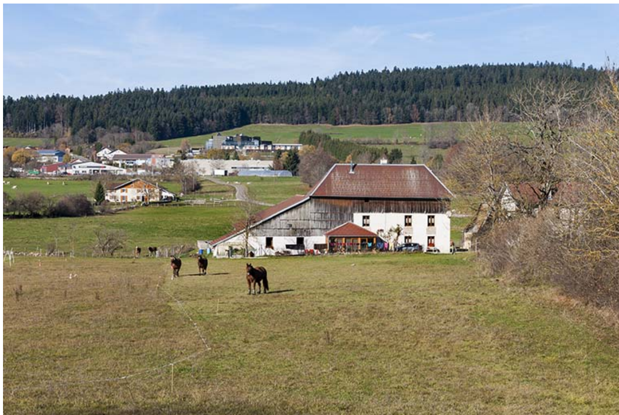
Vue d'ensemble du site, depuis le sud-est.