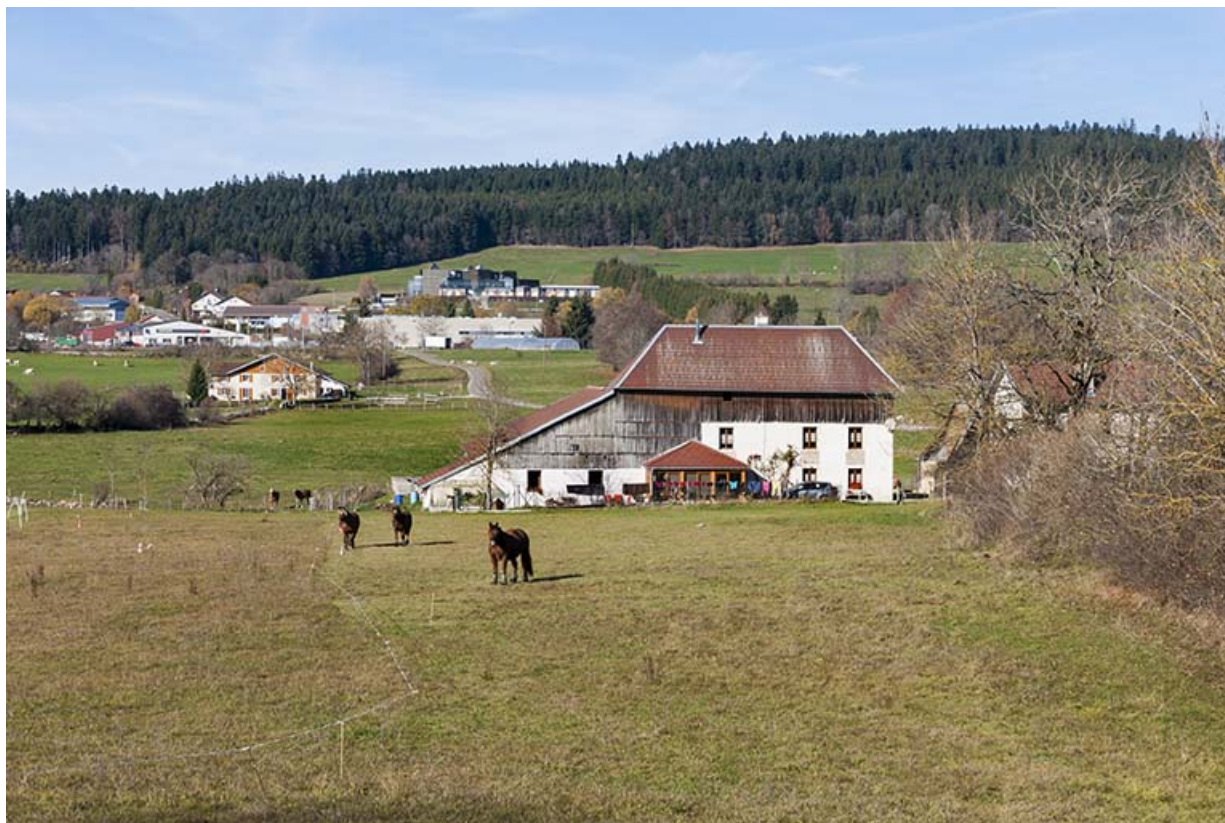
Vue d'ensemble du site, depuis le sud-est.