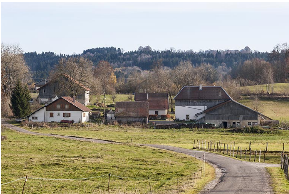
Vue d'ensemble rapprochée du site, depuis le nord.