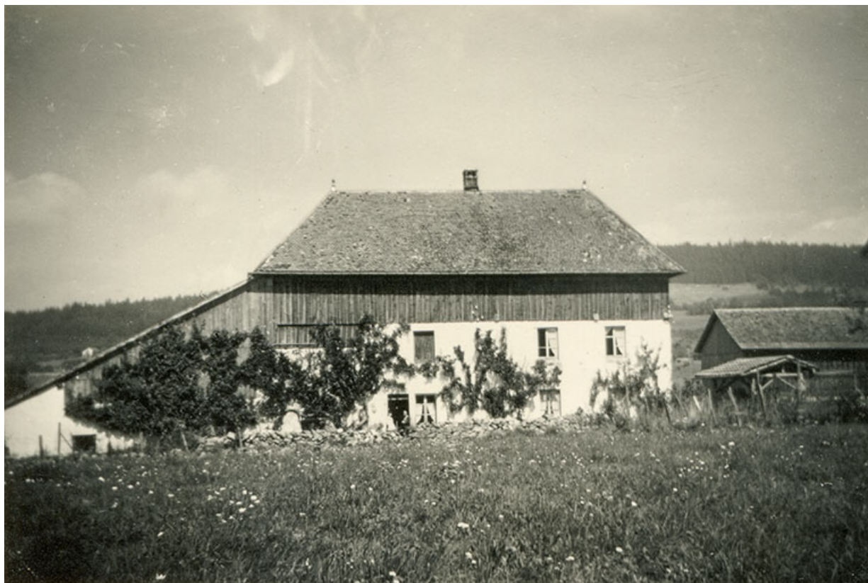
[Façade antérieure de la ferme], été 1961.