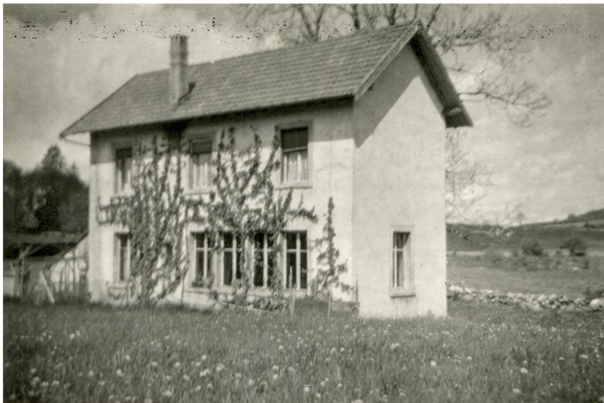
[Façades postérieure et latérale gauche de l'atelier], 3e quart 20e siècle. 25, Maîche, lieudit : Grand Vau