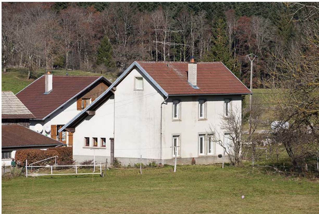
Atelier : façades sud et ouest. L'ancienne fenêtre multiple est visible au rez-de-chaussée. 25, Maîche, lieudit : Grand Vau