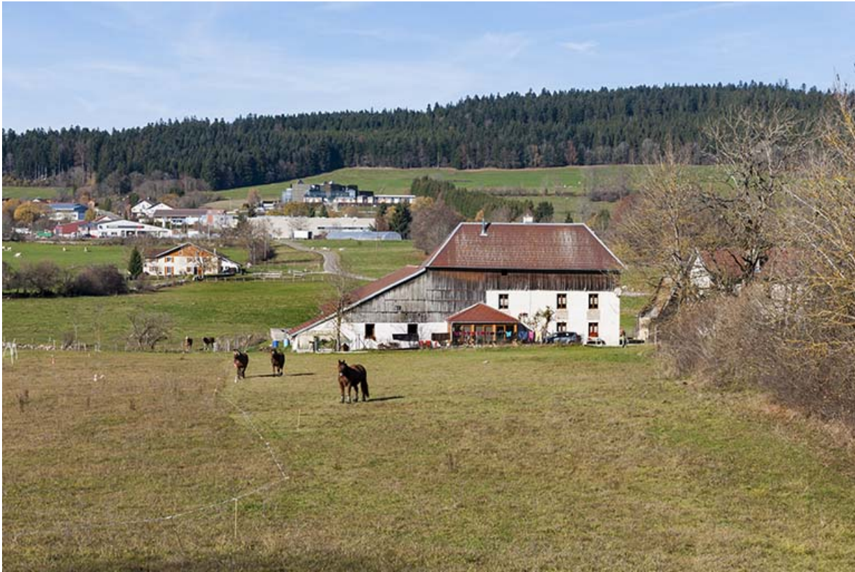
Vue d'ensemble du site, depuis le sud-est.