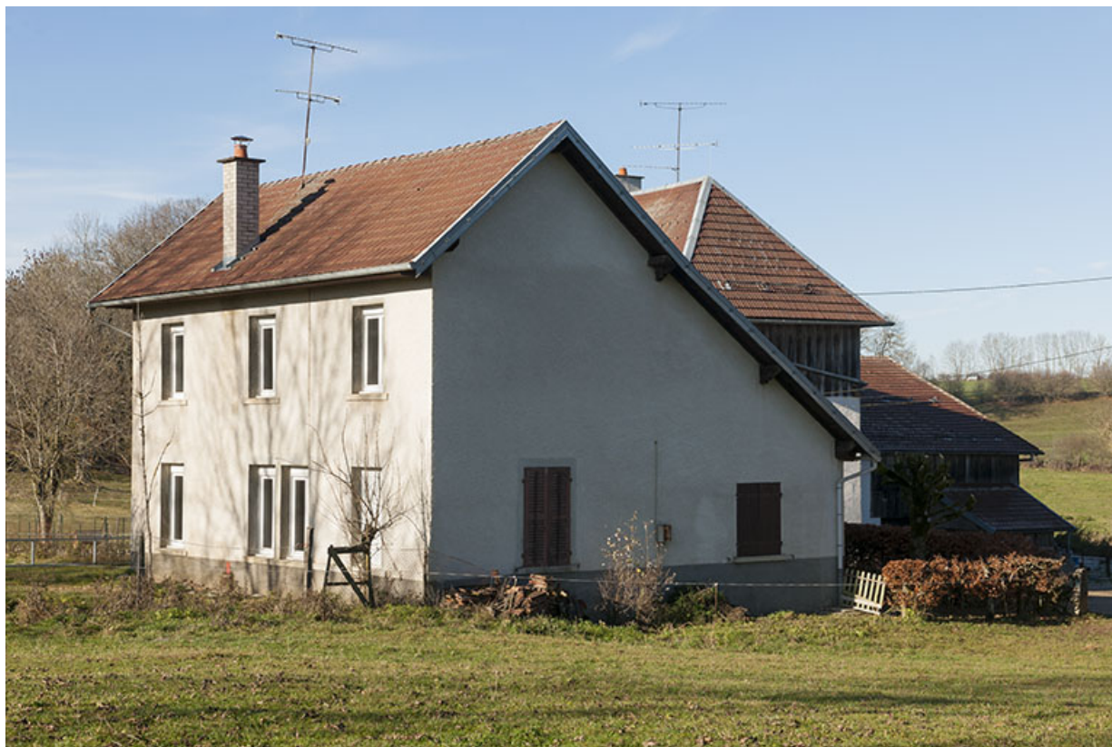
Atelier : façades sud et est. L'ancienne fenêtre multiple est visible au rez-de-chaussée. 25, Maîche, lieudit : Grand Vau