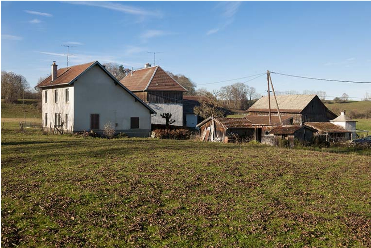
Atelier, ferme et remise agricole, depuis l'est.