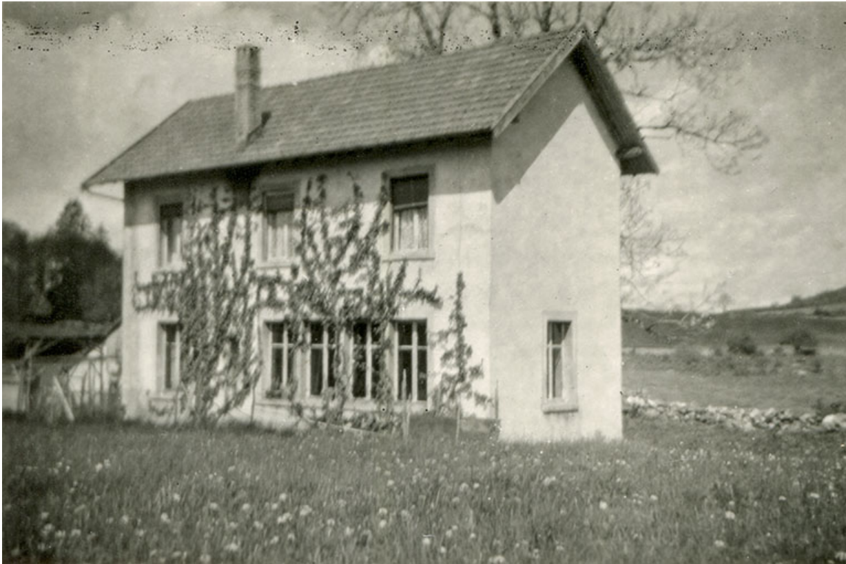
[Façades postérieure et latérale gauche de l'atelier], 3e quart 20e siècle. 25, Maîche, lieudit : Grand Vau