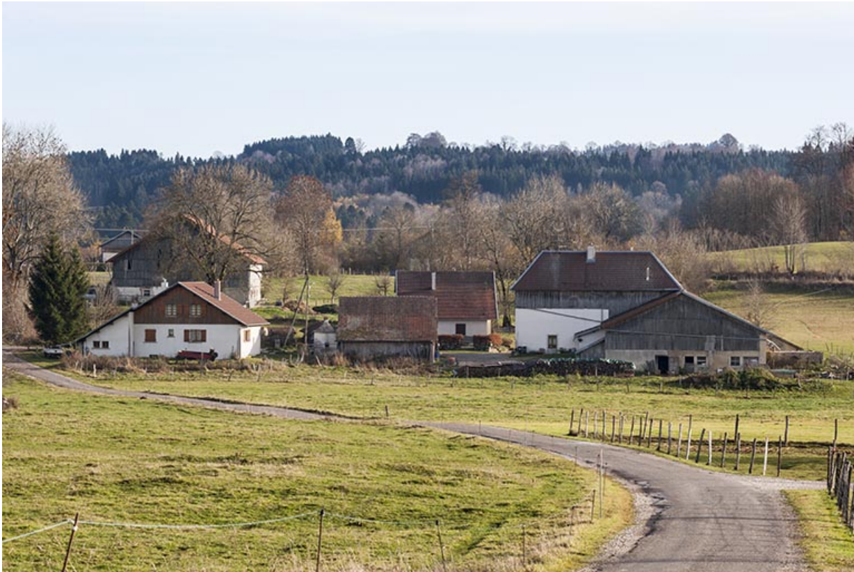
Vue d'ensemble rapprochée du site, depuis le nord.