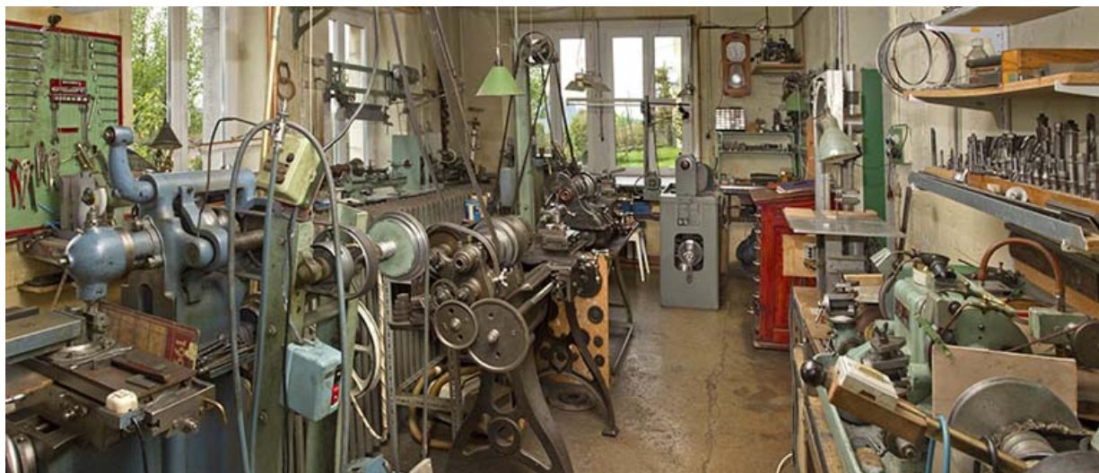
Intérieur de l'atelier de mécanique.