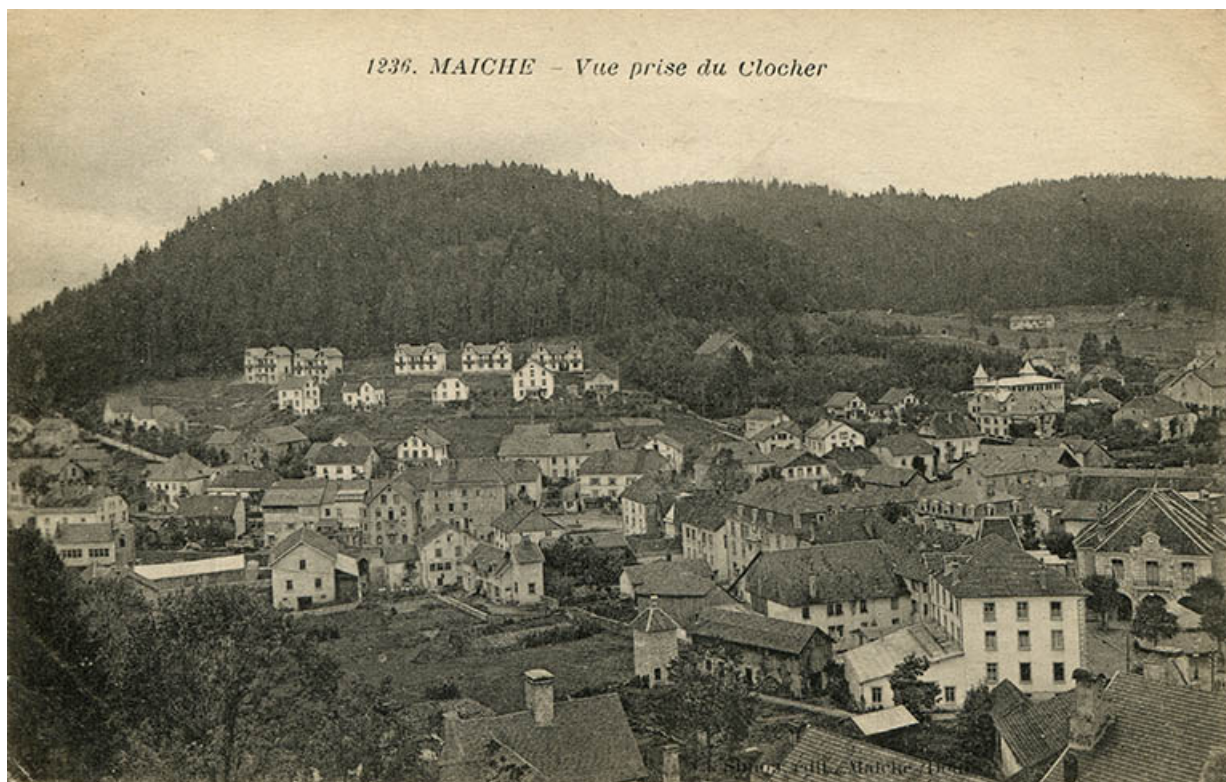
1236. Maïche - Vue prise du clocher [centre du village et quartier de Montjoie], 2e quart 20e siècle. 25, Maïche, 7-9 rue du Mont