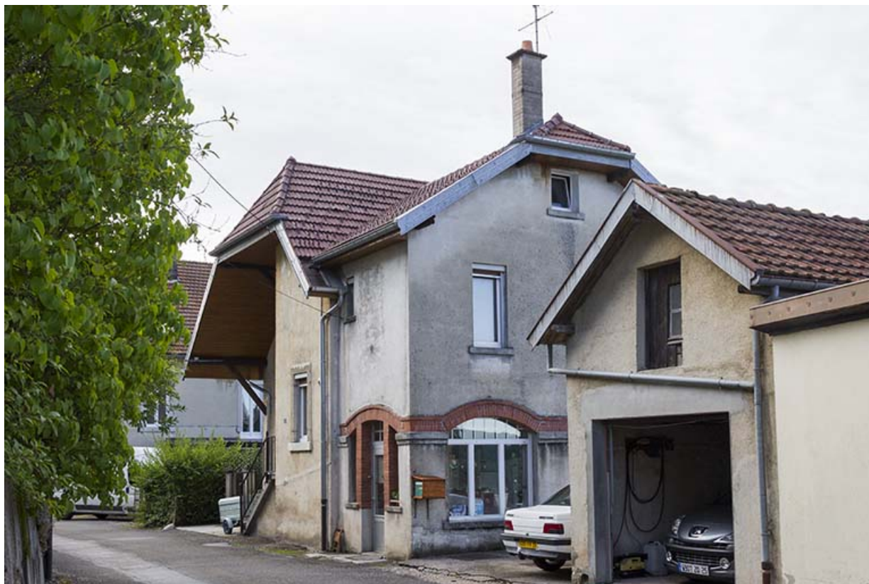
Vue d'ensemble, depuis le nord-ouest (façades antérieure et latérale droite). Garage au premier plan. 25, Maîche, 13 rue Sous Montjoie