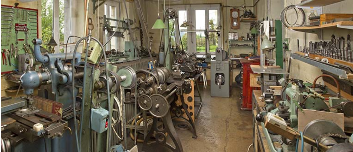
Intérieur de l'atelier de mécanique.