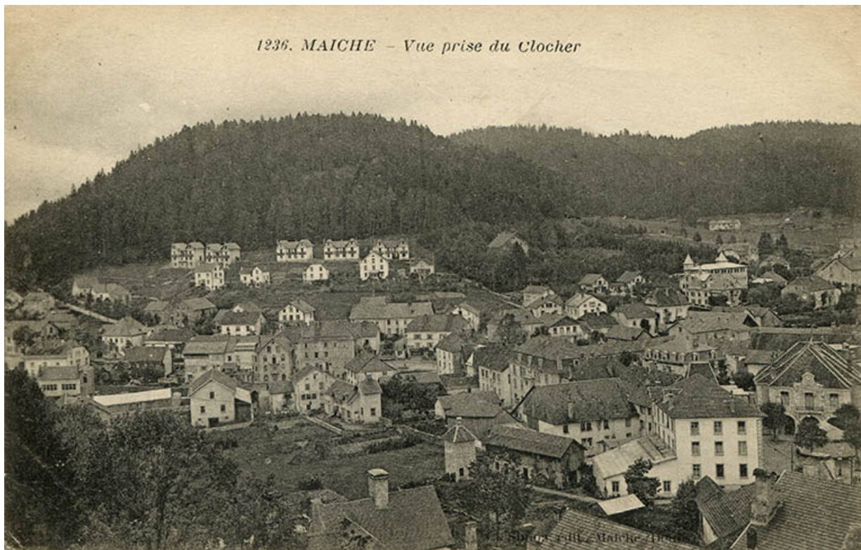
1236. Maïche - Vue prise du clocher [centre du village et quartier de Montjoie], 2e quart 20e siècle. 25, Maïche