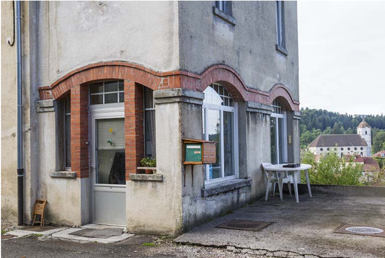
Façades antérieure et latérale droite : baies du rez-de-chaussée.