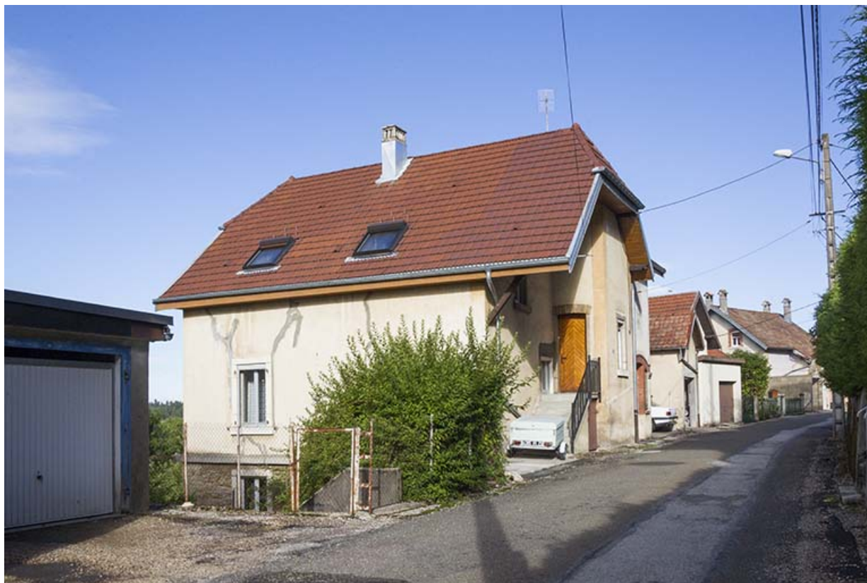
Vue d'ensemble, depuis le sud-est (façades antérieure et latérale gauche). 25, Maîche, 13 rue Sous Montjoie