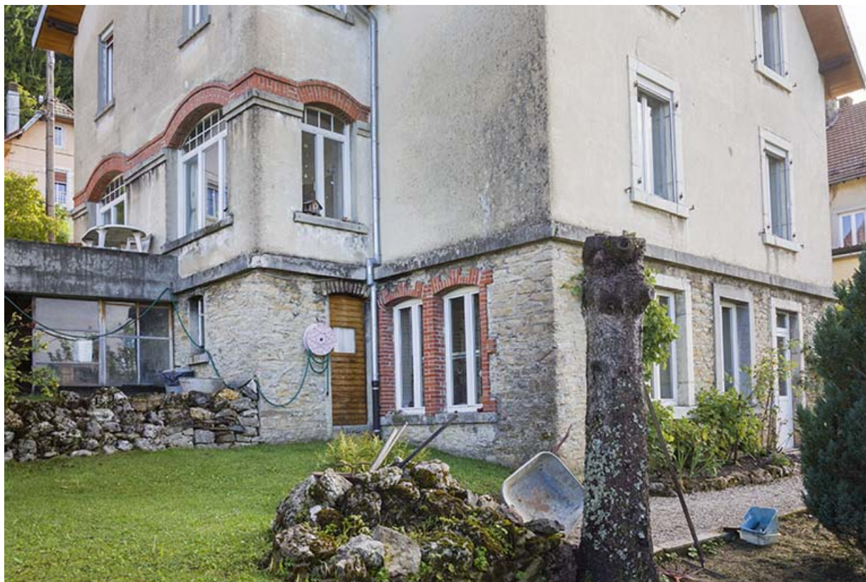
Façades postérieure et latérale droite : baies de l'atelier en soubassement. 25, Maîche