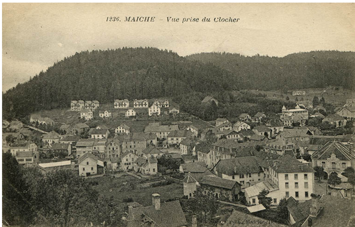
1236. Maïche - Vue prise du clocher [centre du village et quartier de Montjoie], 2e quart 20e siècle. 25, Maïche, 7-9 rue du Mont