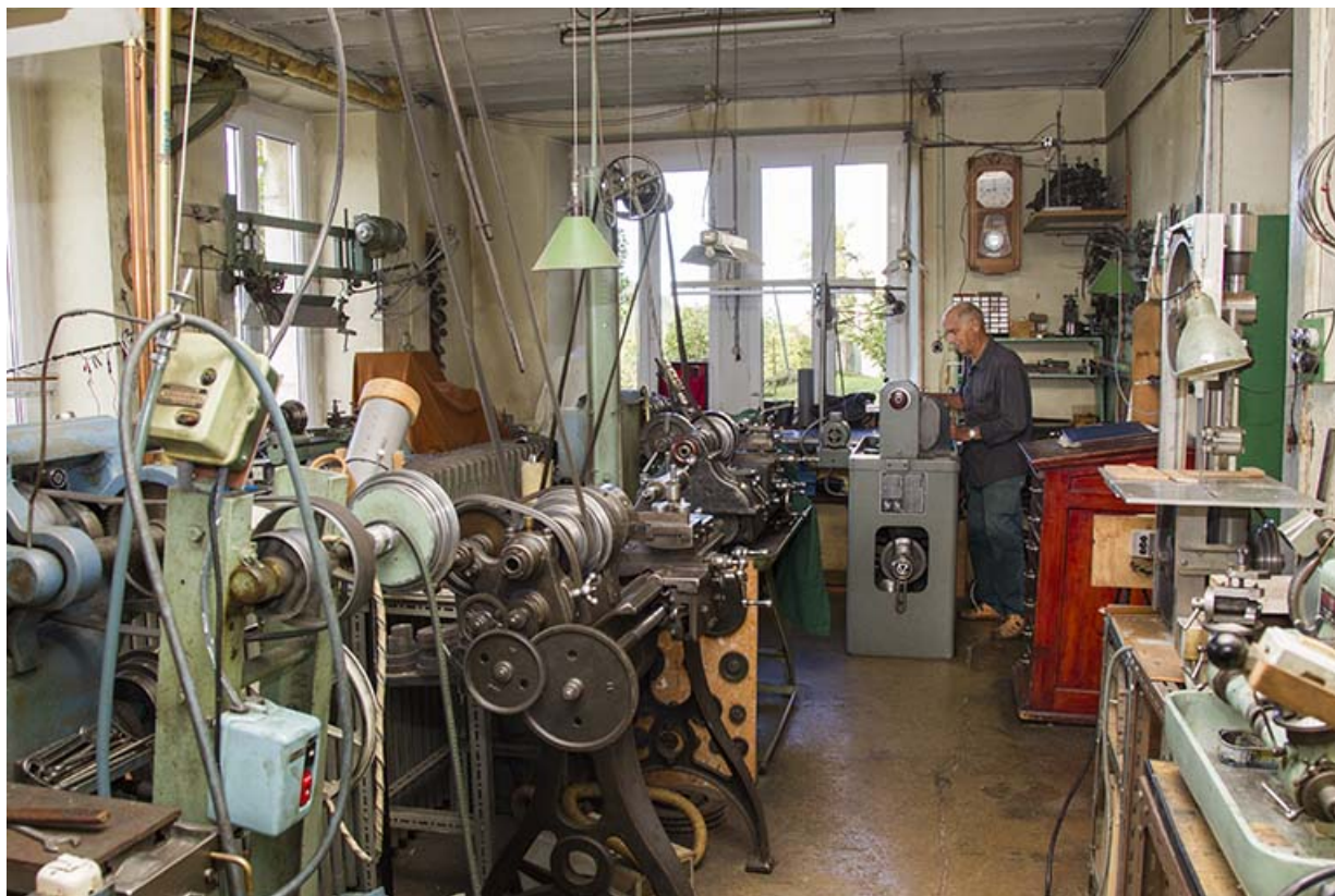
Fabrique de machines pour les horloger Berçot puis Roch, à Maïche.