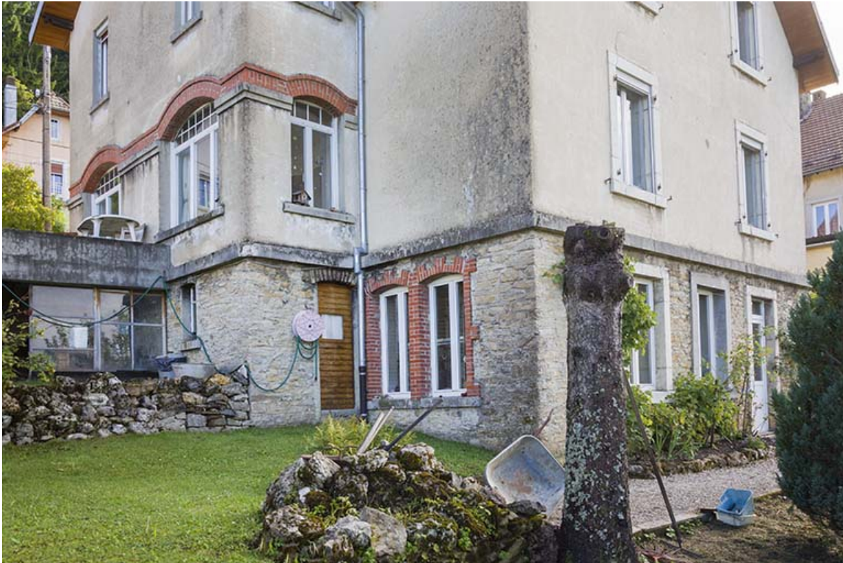
Façades postérieure et latérale droite : baies de l'atelier en soubassement. 25, Maîche