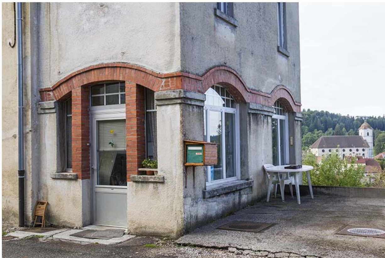
Façades antérieure et latérale droite : baies du rez-de-chaussée.