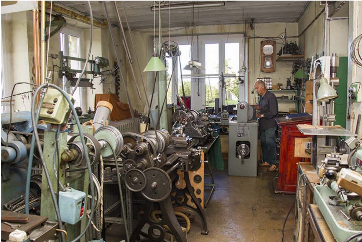
Fabrique de machines pour les horloger Berçot puis Roch, à Maîche. 25, Maîche