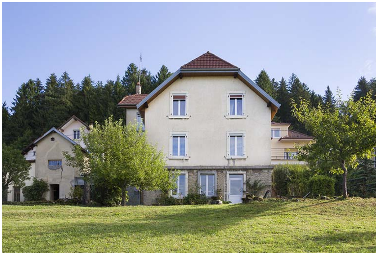
Vue d'ensemble, depuis le sud-ouest (façade postérieure). L'atelier est visible à l'étage de soubassement, l'arrière du garage à gauche.