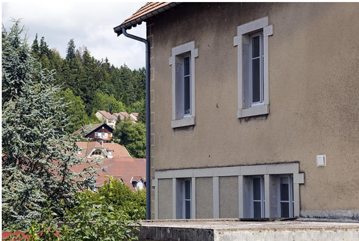
Façade latérale gauche : fenêtres multiples.