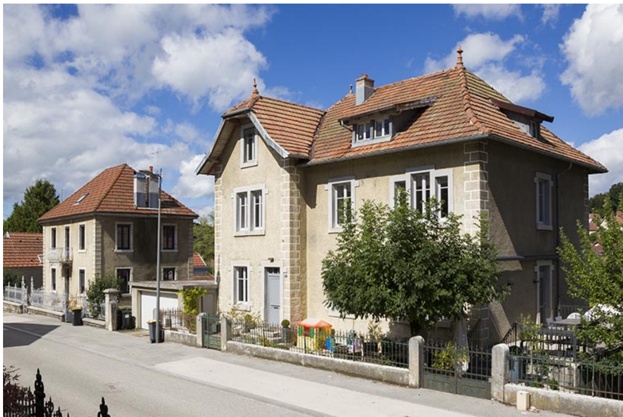
Vue d'ensemble, depuis l'est (façades antérieure et latérale droite). 25, Maîche, 13 rue de l' Helvétie