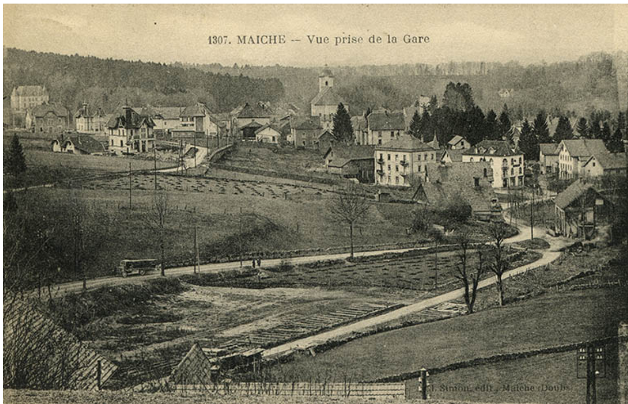
1307. Maïche - Vue prise de la gare, 1ère moitié 20e siècle (avant 1930). 25, Maïche, 22 rue de l' Helvétie