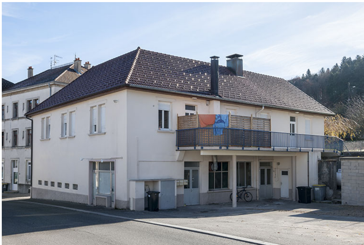
Vue d'ensemble, depuis le nord-ouest.