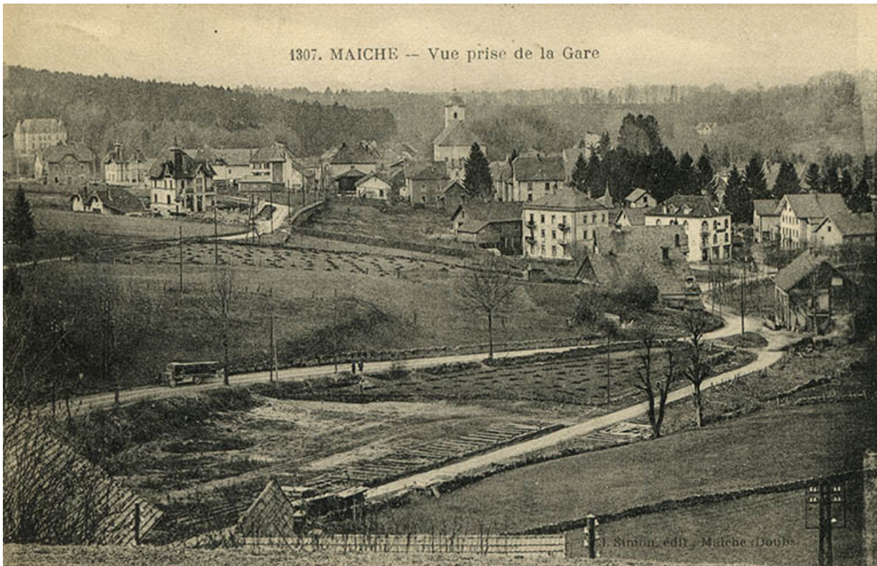
1307. Maïche - Vue prise de la gare, 1ère moitié 20e siècle (avant 1930). 25, Maïche, 22 rue de l' Helvétie