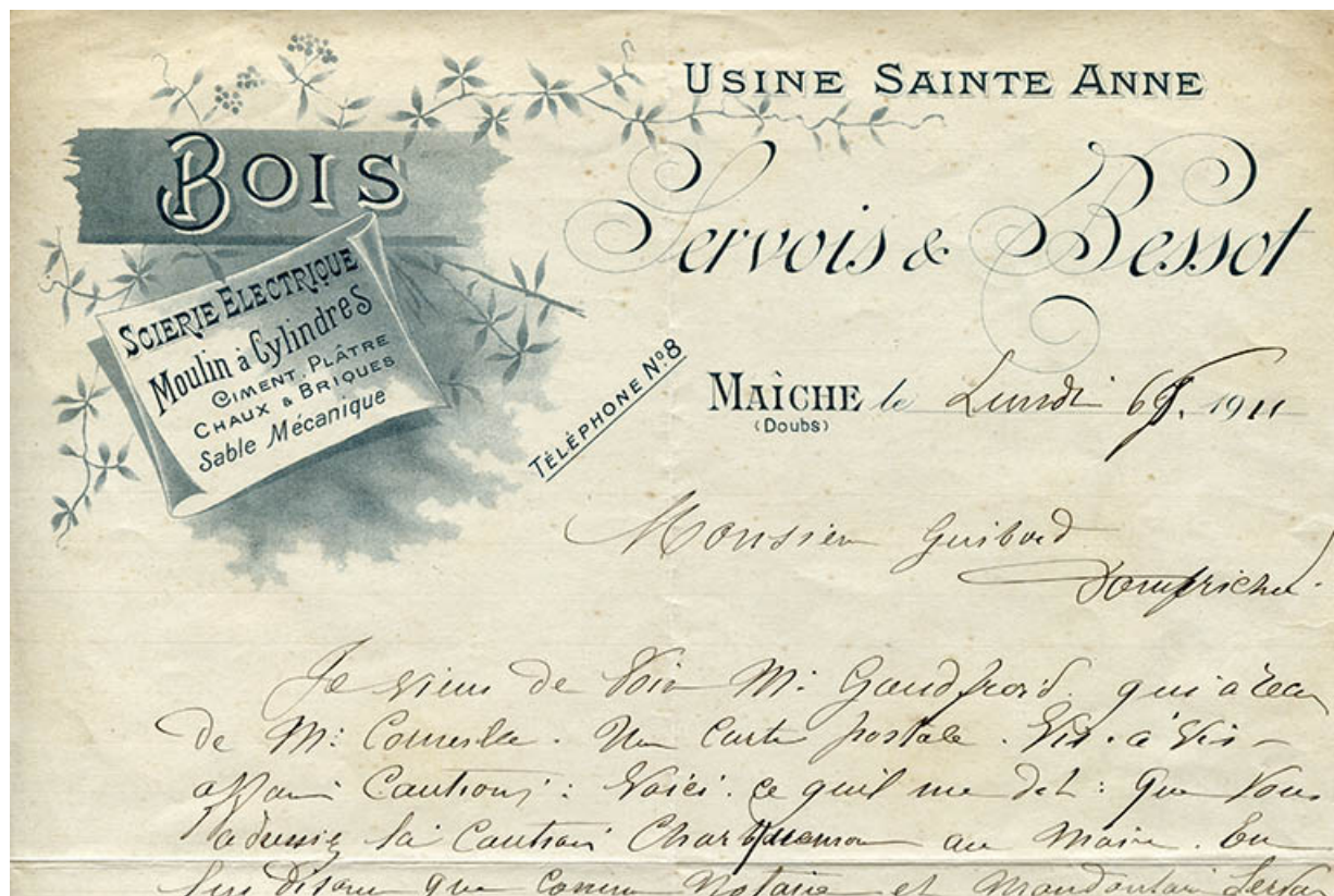
Papier à en-tête de la société Servois et Bessot - Usine de Sainte-Anne, 1911. 25, Maïche, 10 rue de la Gare