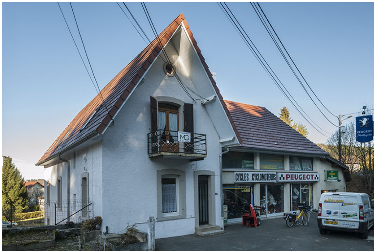
Logement et atelier de réparation de cycles. 25, Maîche, 10 rue de la Gare