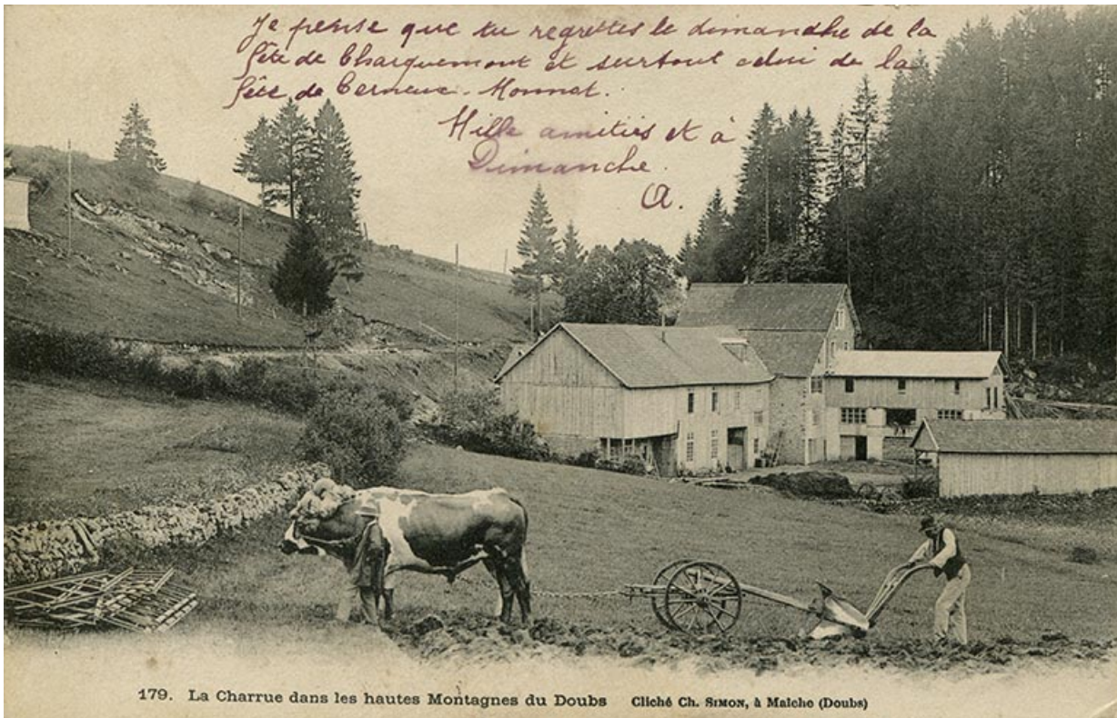
179. La charrue dans les hautes montagnes du Doubs [moulin et scierie Servois avant l'incendie de 1911], limite 19e siècle 20e siècle (avant 1904).