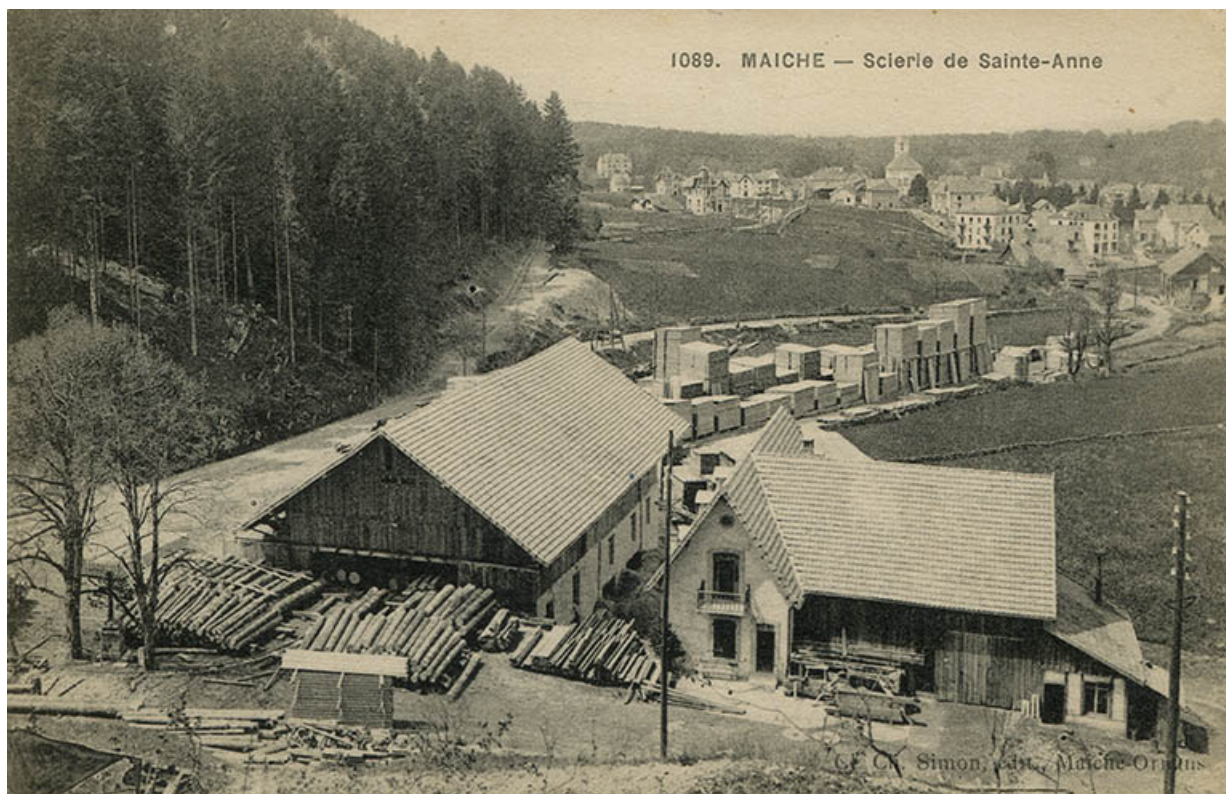
1089. Maïche - Scierie de Sainte-Anne, 1ère moitié 20e siècle (après 1911).