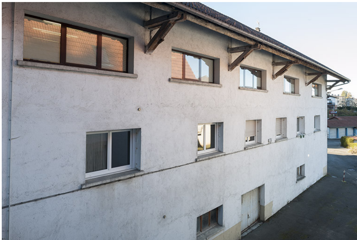
Atelier de fabrication : façade postérieure, de trois quarts gauche. 25, Maîche, 10 rue de la Gare