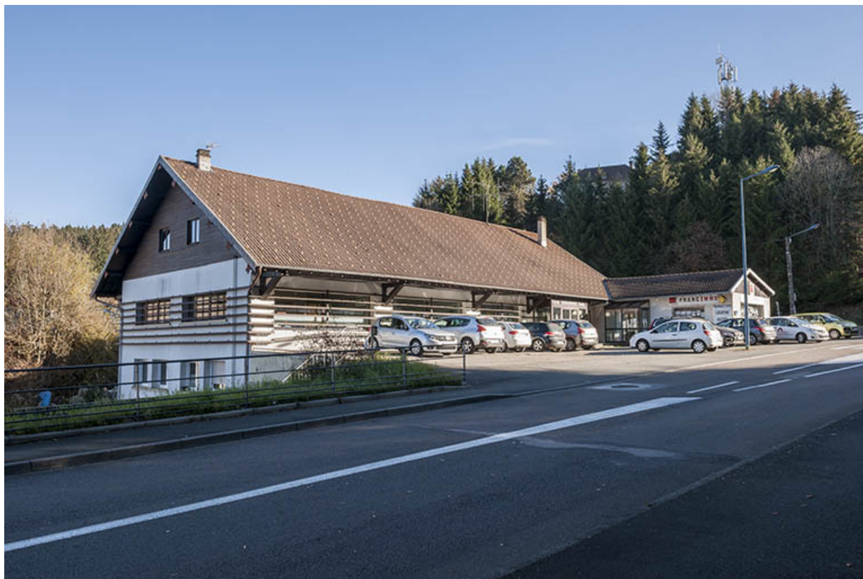
Atelier de fabrication et bureau récent, depuis l'ouest.