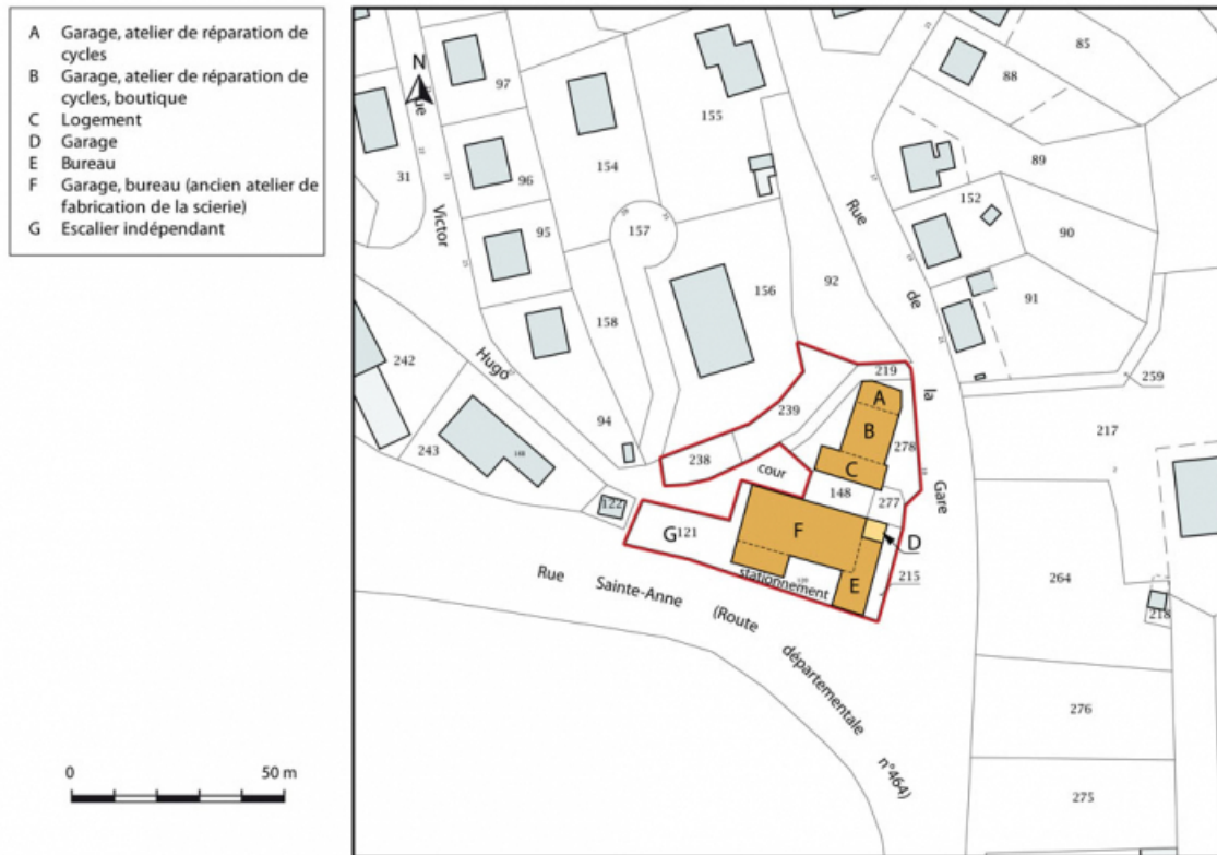
Plan-masse et de situation. Extrait du plan cadastral, 2015, section AC. 25, Maïche, 10 rue de la Gare