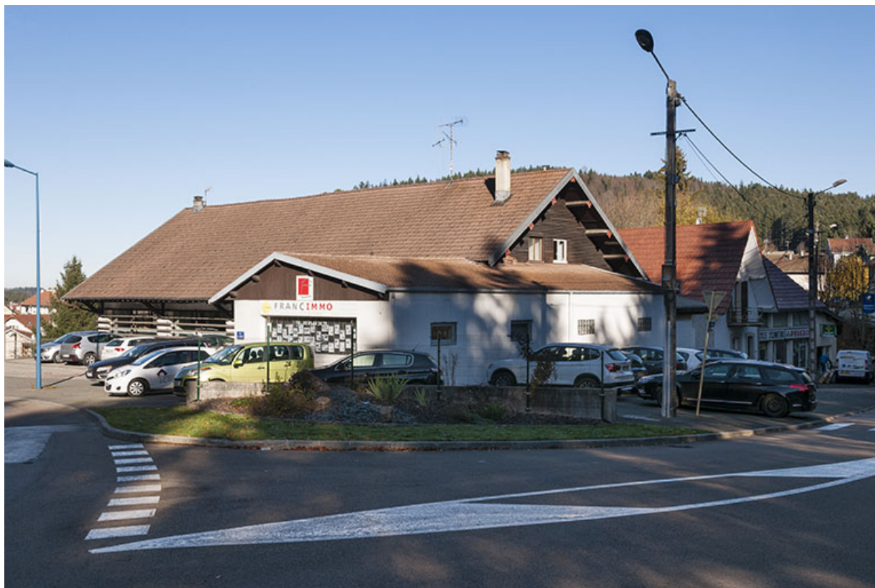
Vue d'ensemble, depuis le sud.