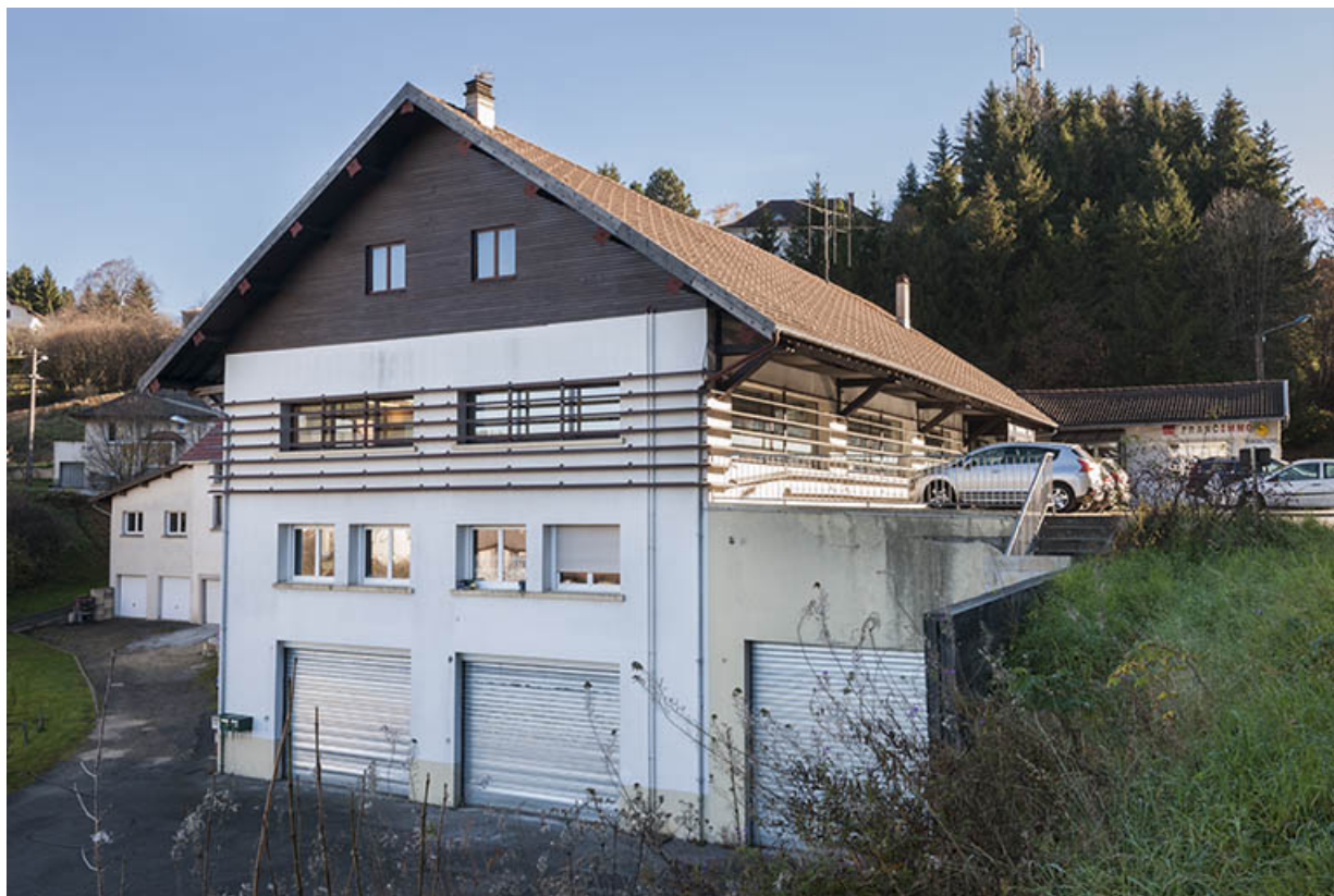
Atelier de fabrication : façade latérale gauche.