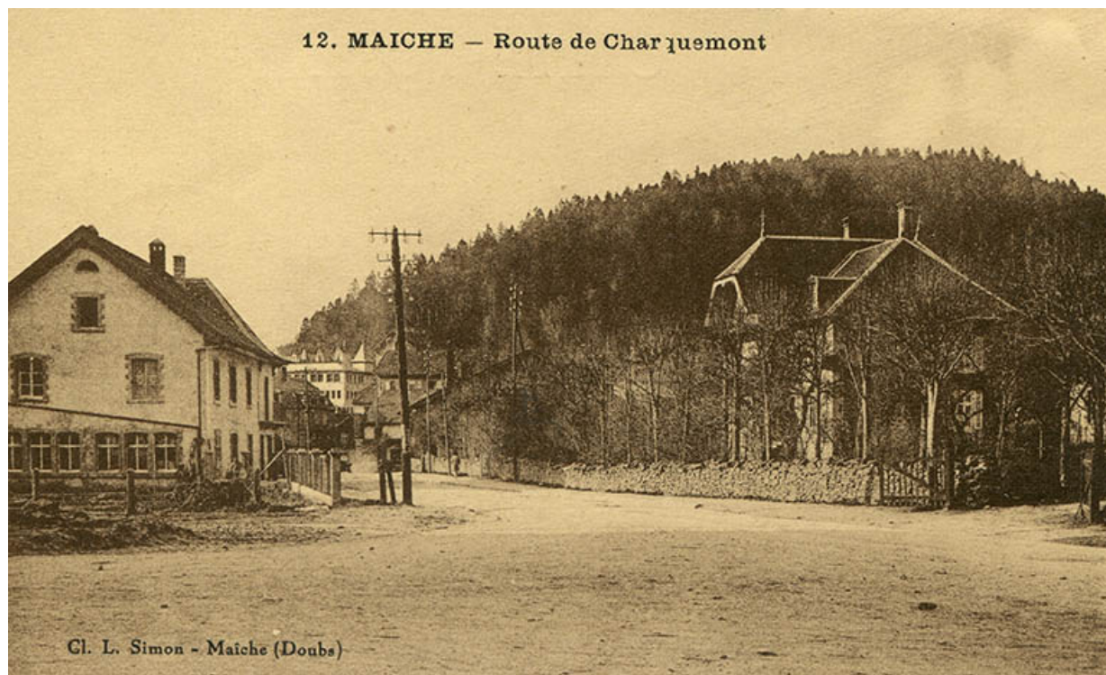
12. Maïche - Route de Charquemont [au niveau des n° 2 et 5 rue Sainte-Anne], 1ère moitié 20e siècle (avant 1936). 25, Maïche, 2 rue Sainte-Anne