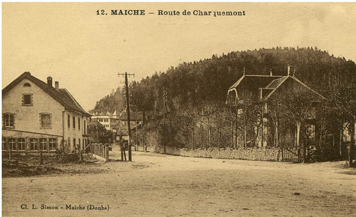
12. Maïche - Route de Charquemont [au niveau des n° 2 et 5 rue Sainte-Anne], 1ère moitié 20e siècle (avant 1936). 25, Maïche, 2 rue Sainte-Anne