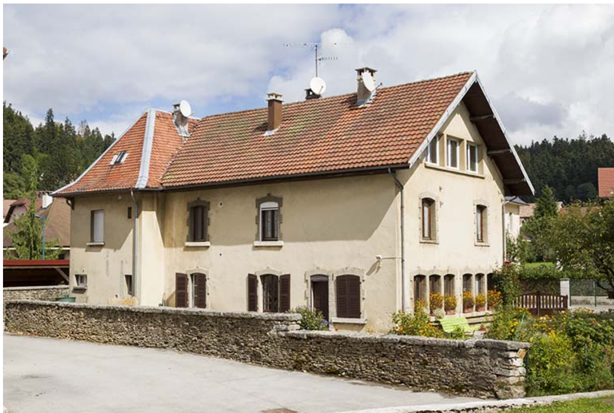
Façades postérieure et latérale gauche.