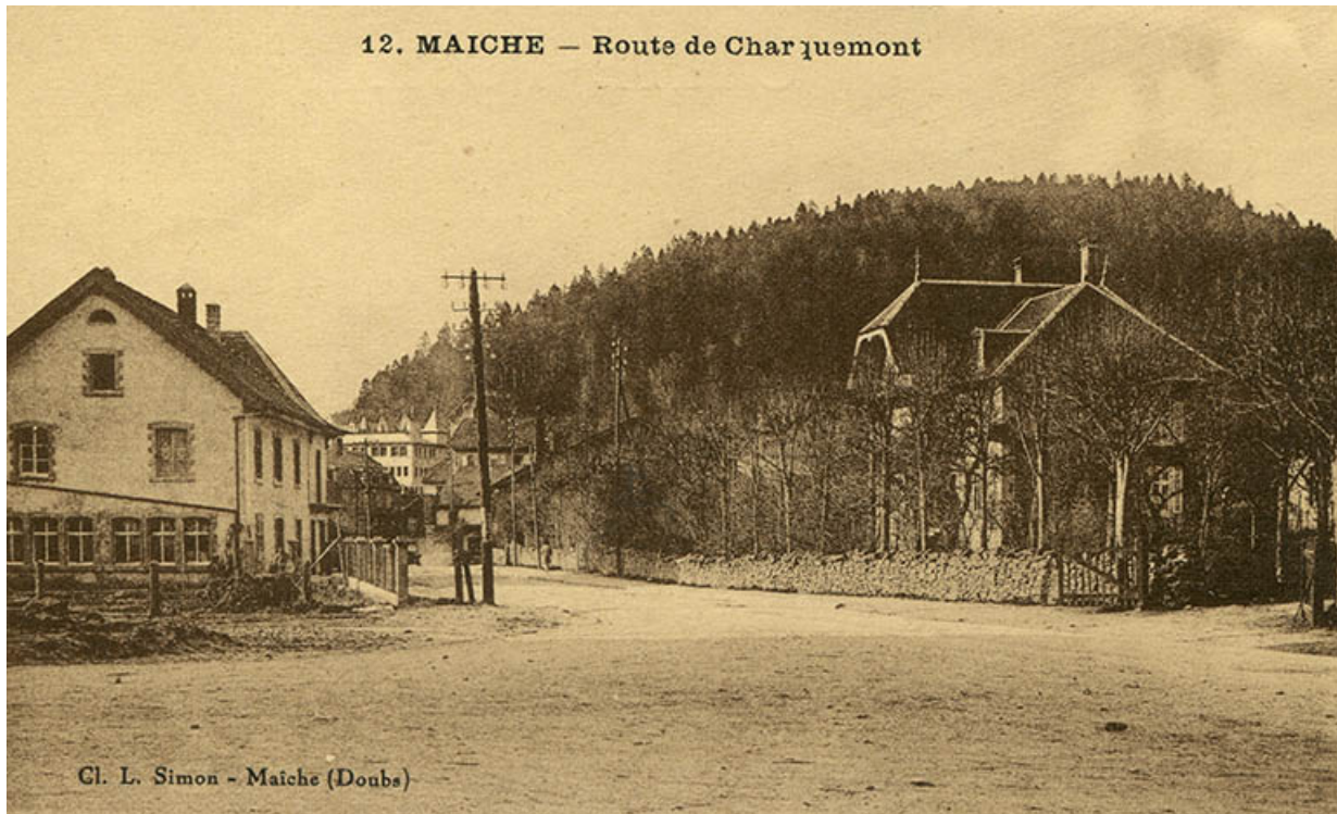
12. Maïche - Route de Charquemont [au niveau des n° 2 et 5 rue Sainte-Anne], 1ère moitié 20e siècle (avant 1936). 25, Maïche, 2 rue Sainte-Anne