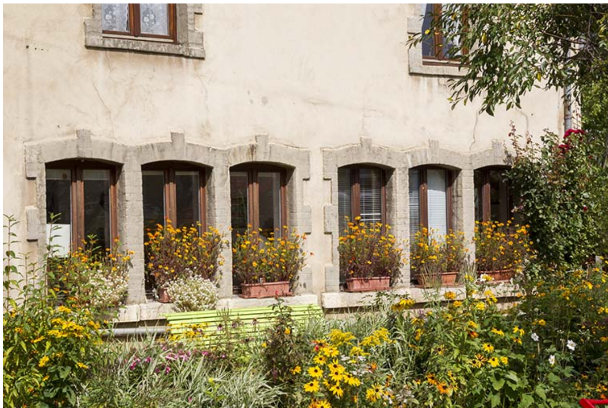
Fenêtres multiples ("fenestrage"), à Maîche. 25, Maîche, 2 rue Sainte-Anne