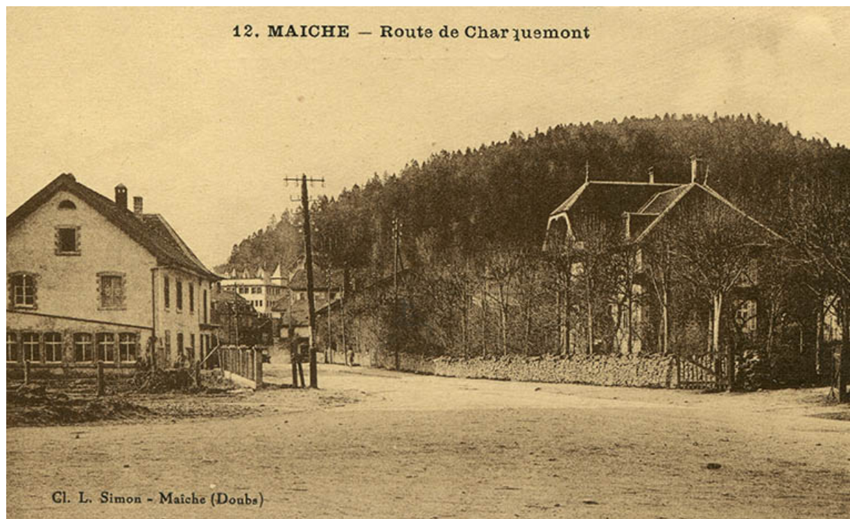
12. Maïche - Route de Charquemont [au niveau des n° 2 et 5 rue Sainte-Anne], 1ère moitié 20e siècle (avant 1936). 25, Maïche, 2 rue Sainte-Anne