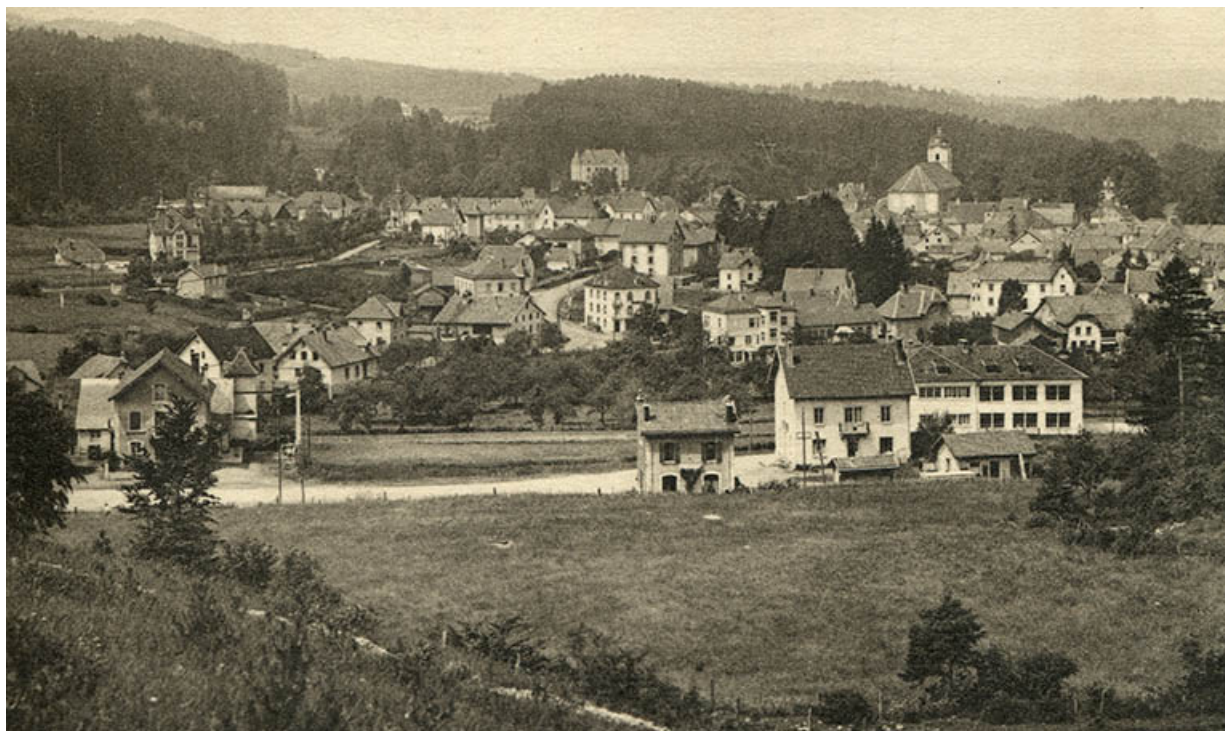
38 Maïche. Vue générale vers la gare et la ville, décennies 1920-1930.