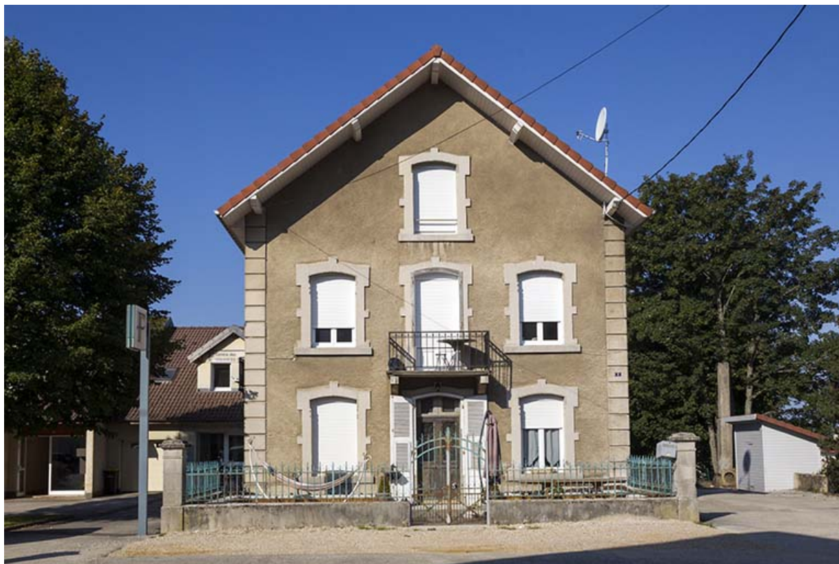
Logement : façade antérieure.