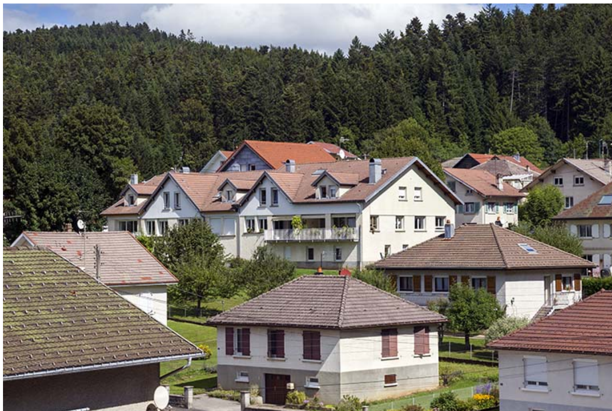
Vue d'ensemble, depuis le sud-ouest.