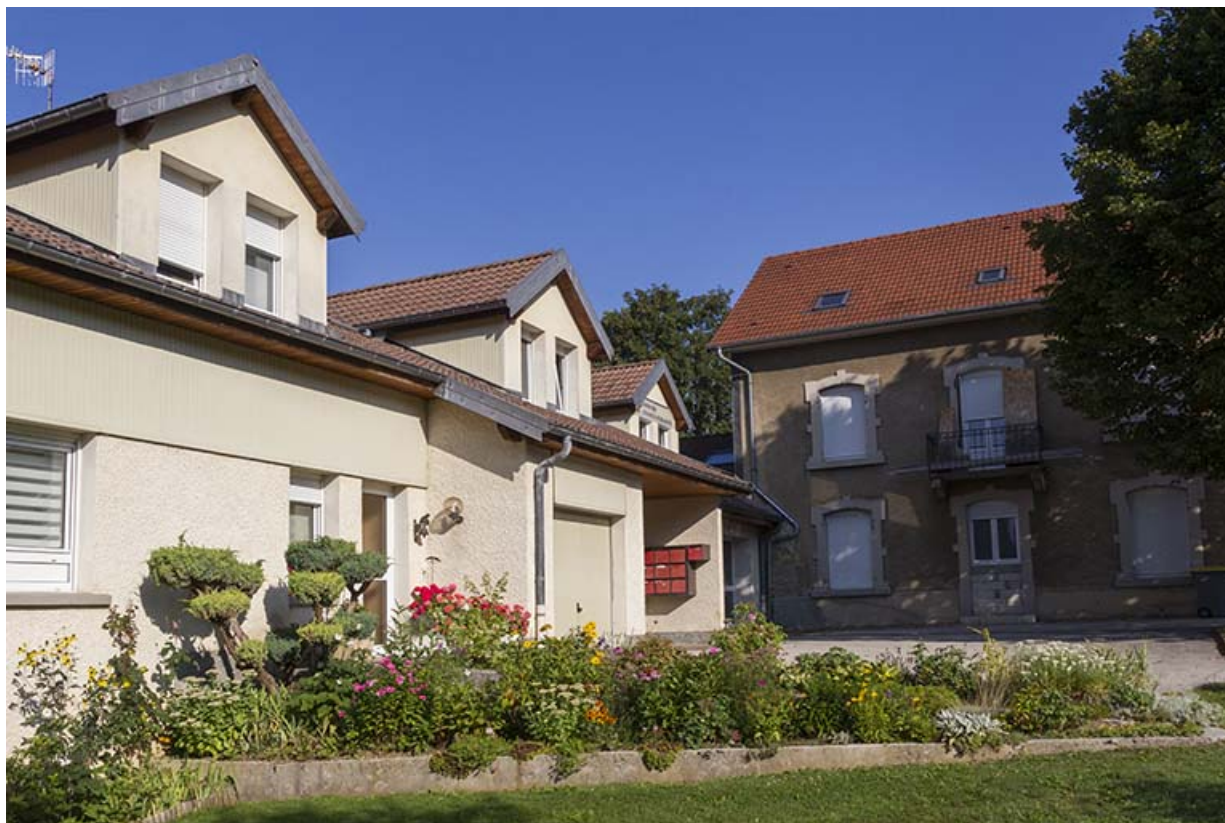
Ateliers de fabrication et logement (façade latérale gauche). 25, Maîche, 8 rue de la Gare