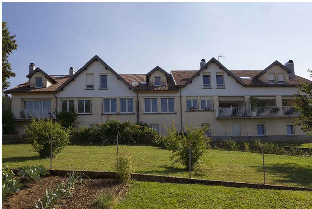
Ateliers de fabrication : façade postérieure.