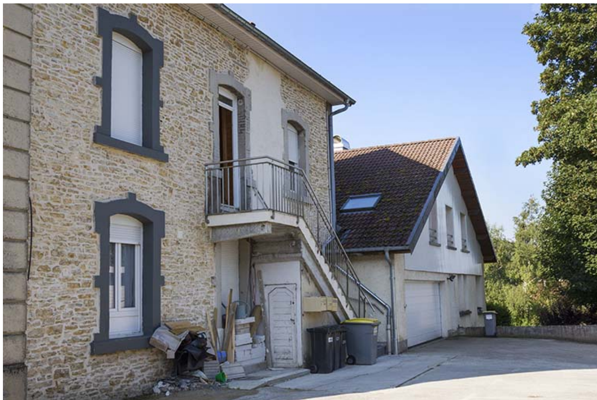
Logement : façade latérale droite.