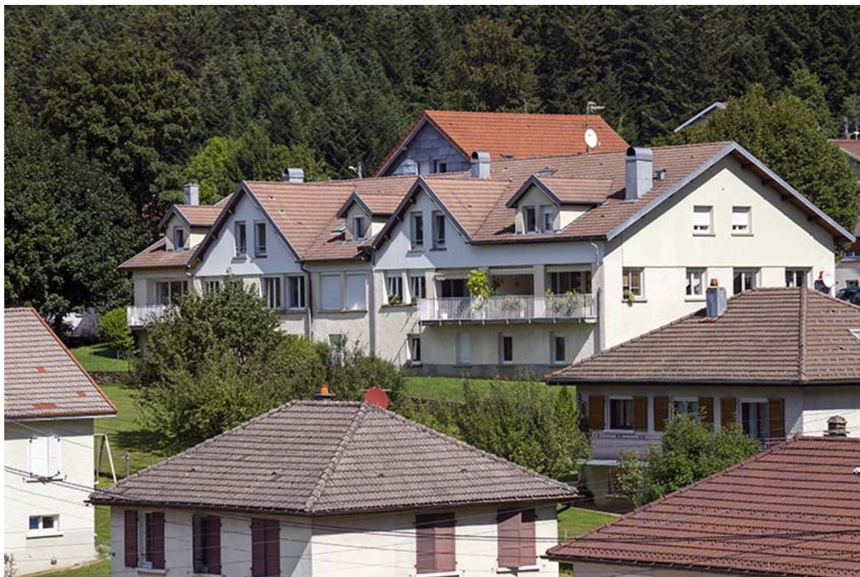
Ateliers de fabrication : façades postérieure et latérale gauche.