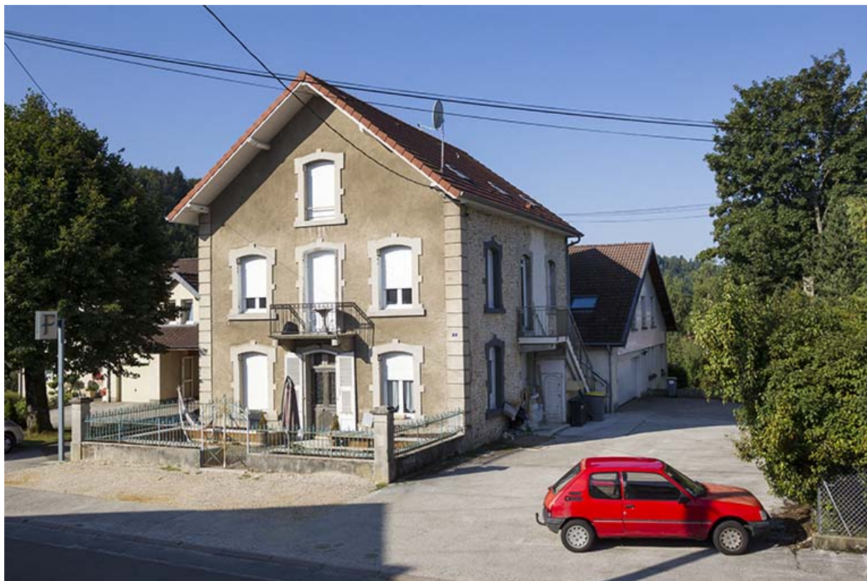
Logement, de trois quarts droite (façades antérieure et latérale droite). 25, Maîche, 8 rue de la Gare