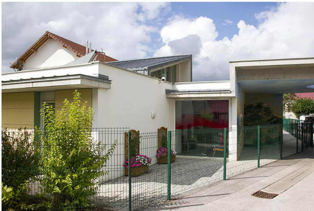
Bâtiments récents : extrémité orientale et porche.