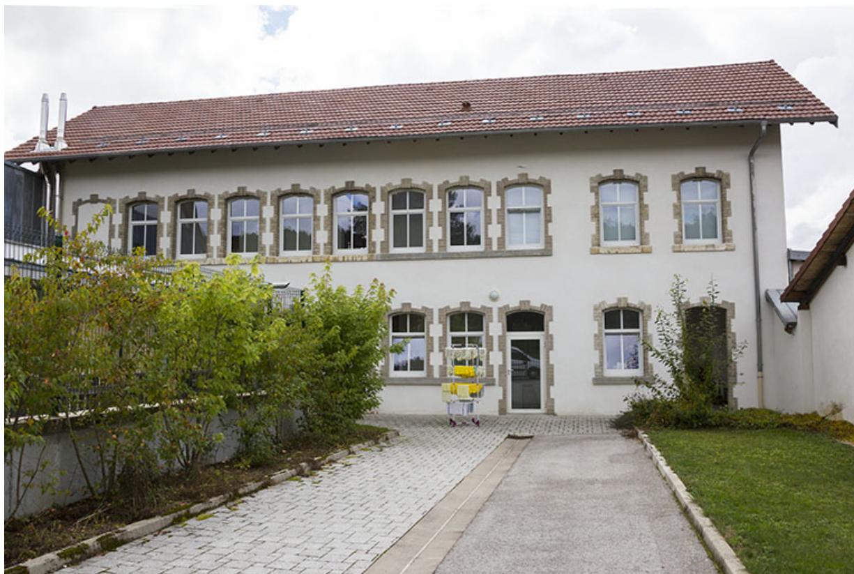
Atelier d'origine : façade orientale.