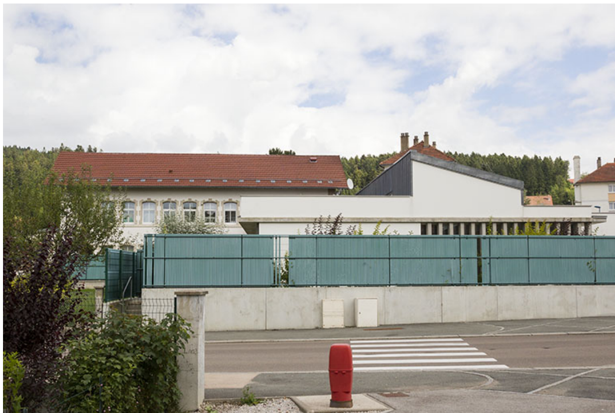
Vue d'ensemble, depuis la rue de l'Helvétie à l'ouest.