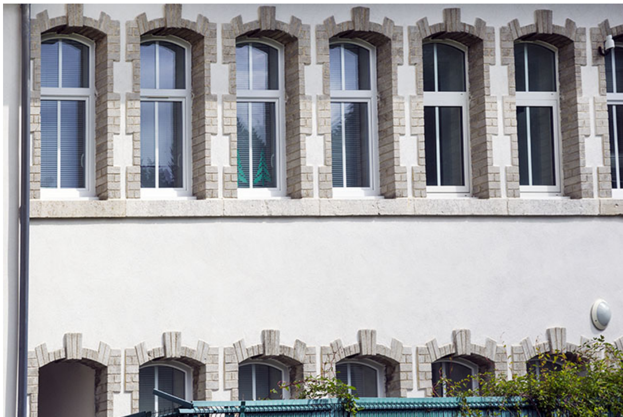
Atelier d'origine : fenêtres multiples.