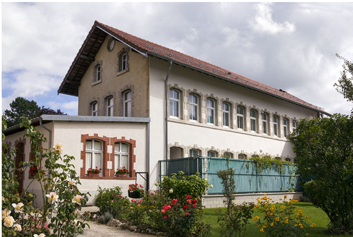
Atelier d'origine : façade occidentale, de trois quarts gauche. 25, Maîche