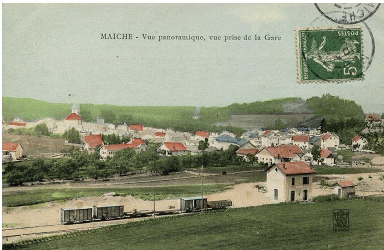
Maïche - Vue panoramique, vue prise de la gare, entre 1904 et 1909.