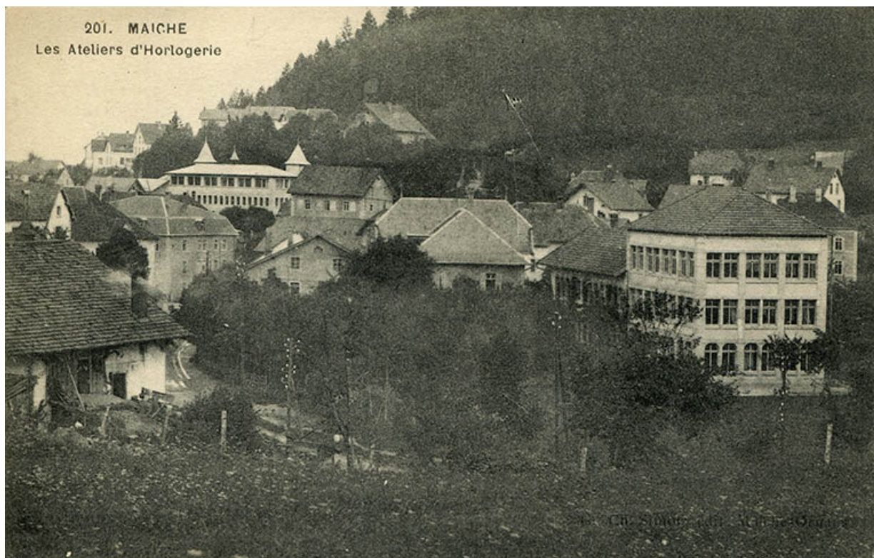
201. Maïche. Les ateliers d'horlogerie, entre 1914 et 1918.