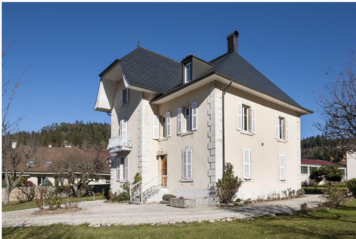
Logement patronal : façades antérieure et latérale droite.