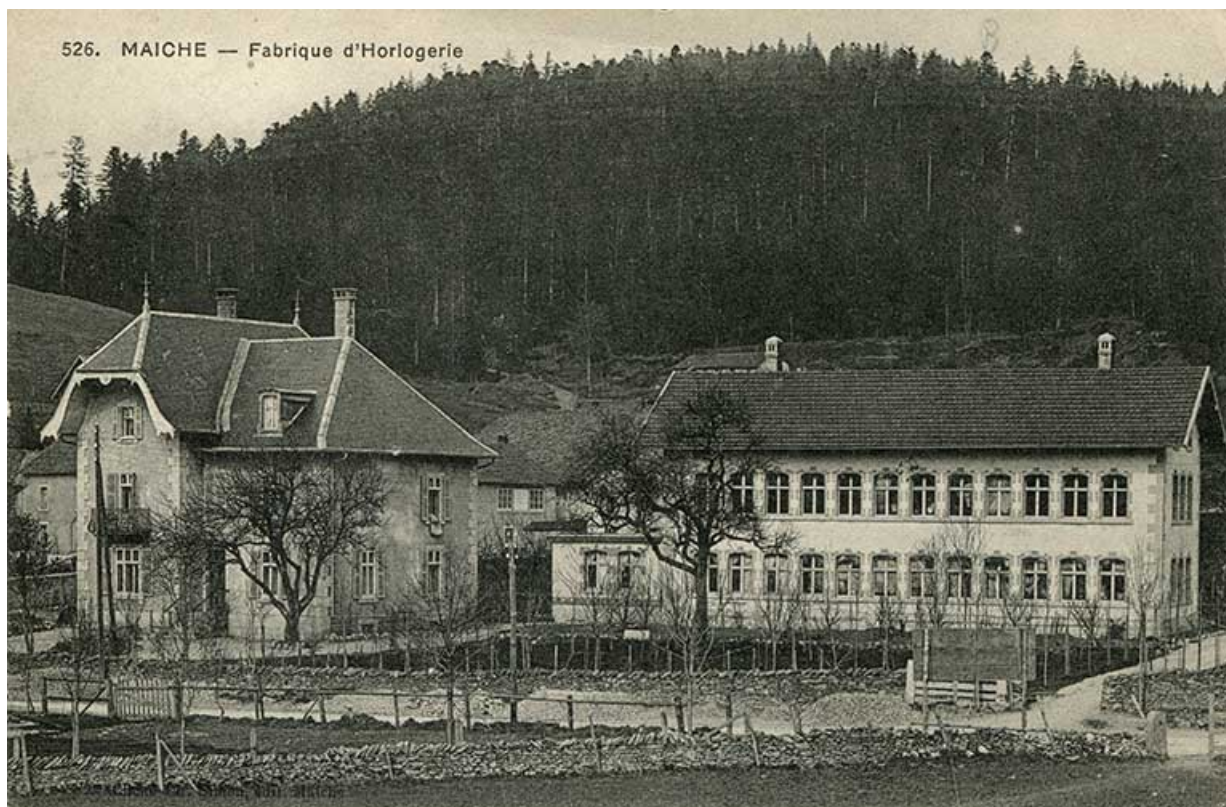
526. Maïche - Fabrique d'horlogerie, 1er quart 20e siècle (avant 1914).