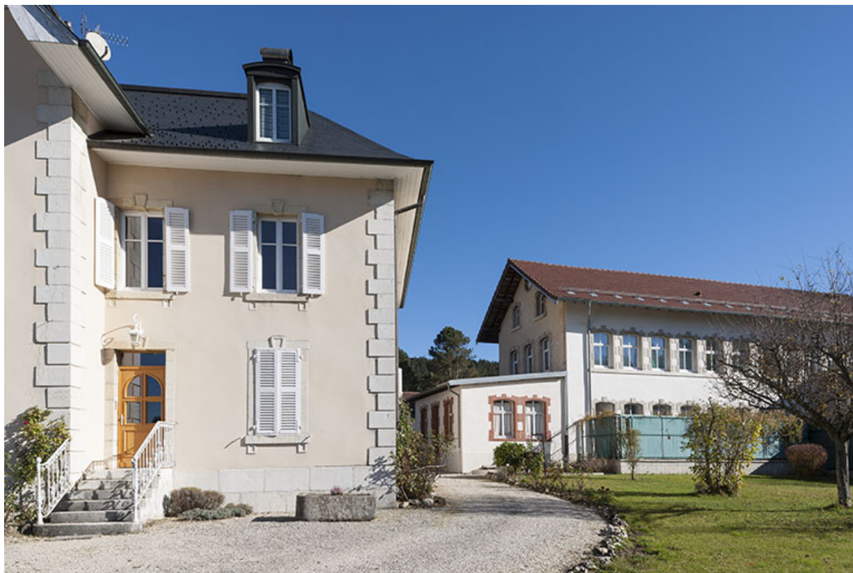
Logement patronal (corps d'entrée) et bâtiment d'origine, depuis la rue Sainte-Anne. 25, Maîche, 1 rue Guynemer