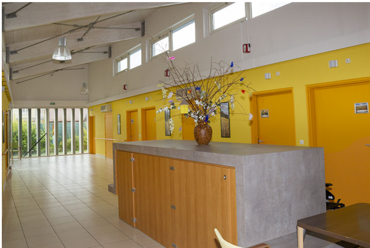
Bâtiments récents, intérieur : hall avec charpente en lamellé-collé apparente. 25, Maîche, 1 rue Guynemer