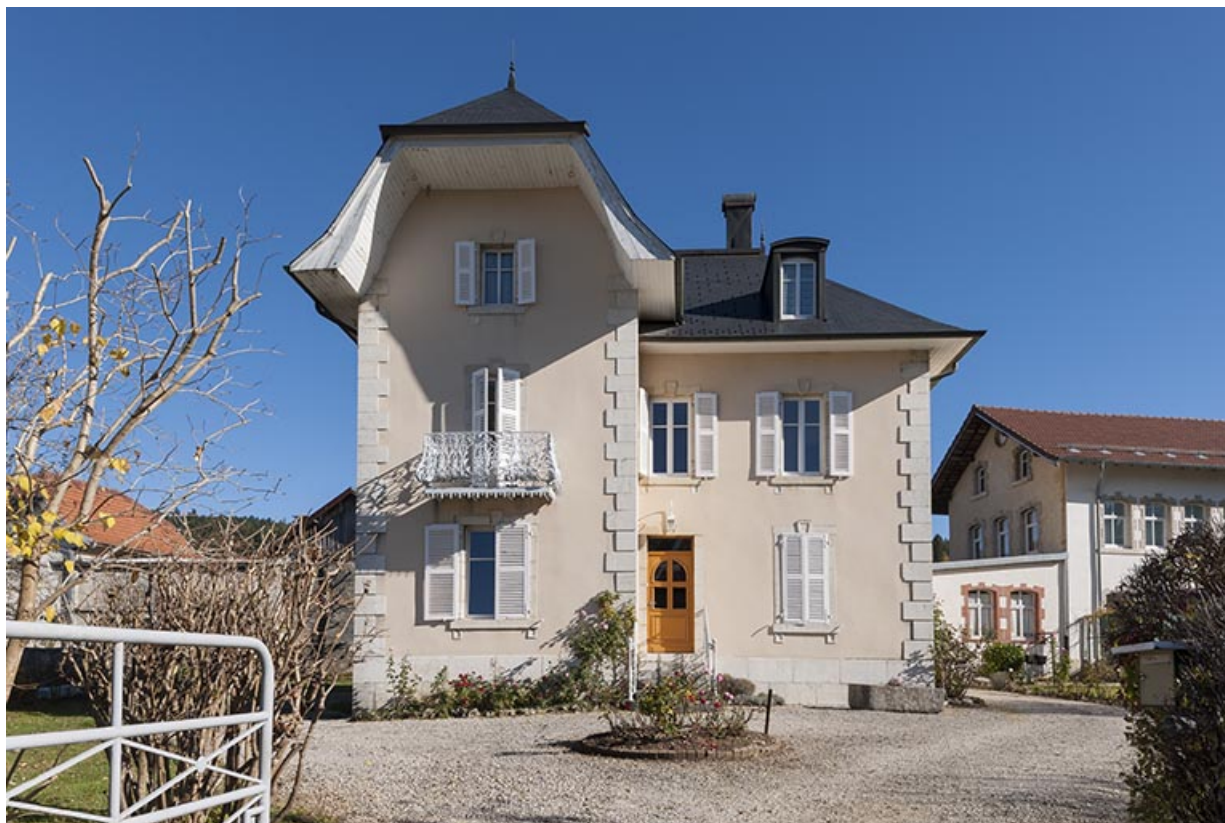
Logement patronal et atelier d'origine, depuis la rue Sainte-Anne.