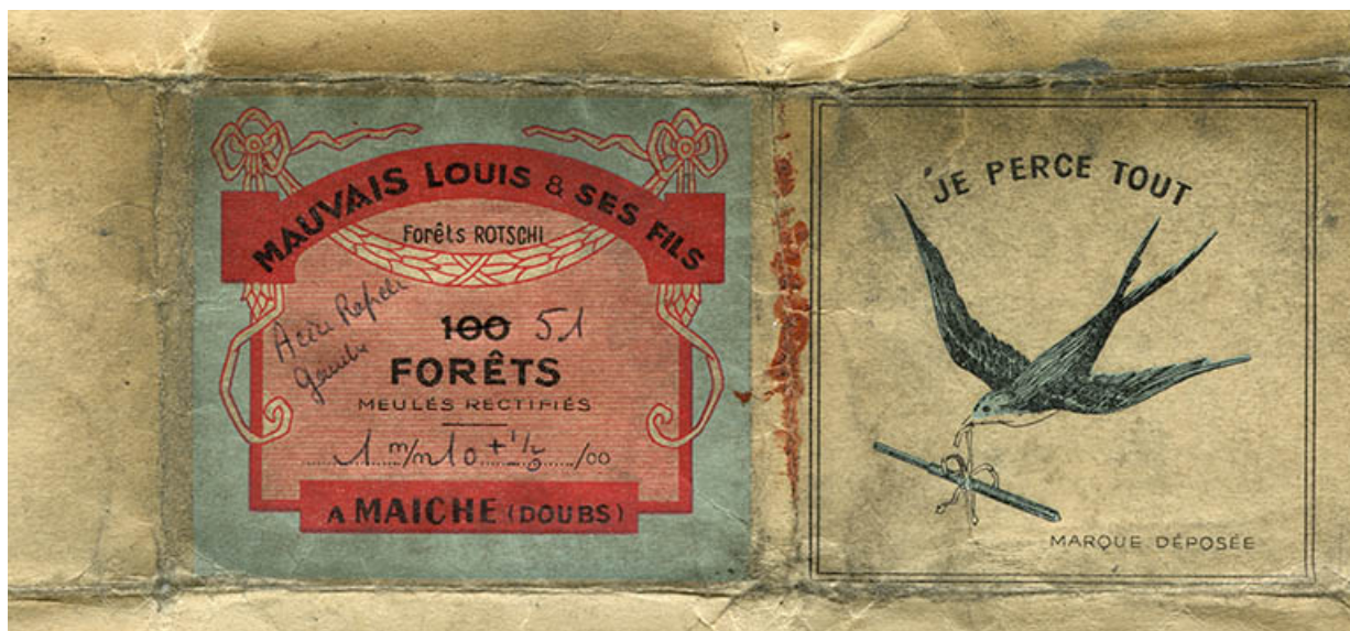
Mauvais Louis et ses Fils à Maïche (Doubs). Forêts Rotschi [sic], milieu 20e siècle. 25, Maïche, 1 rue Guynemer