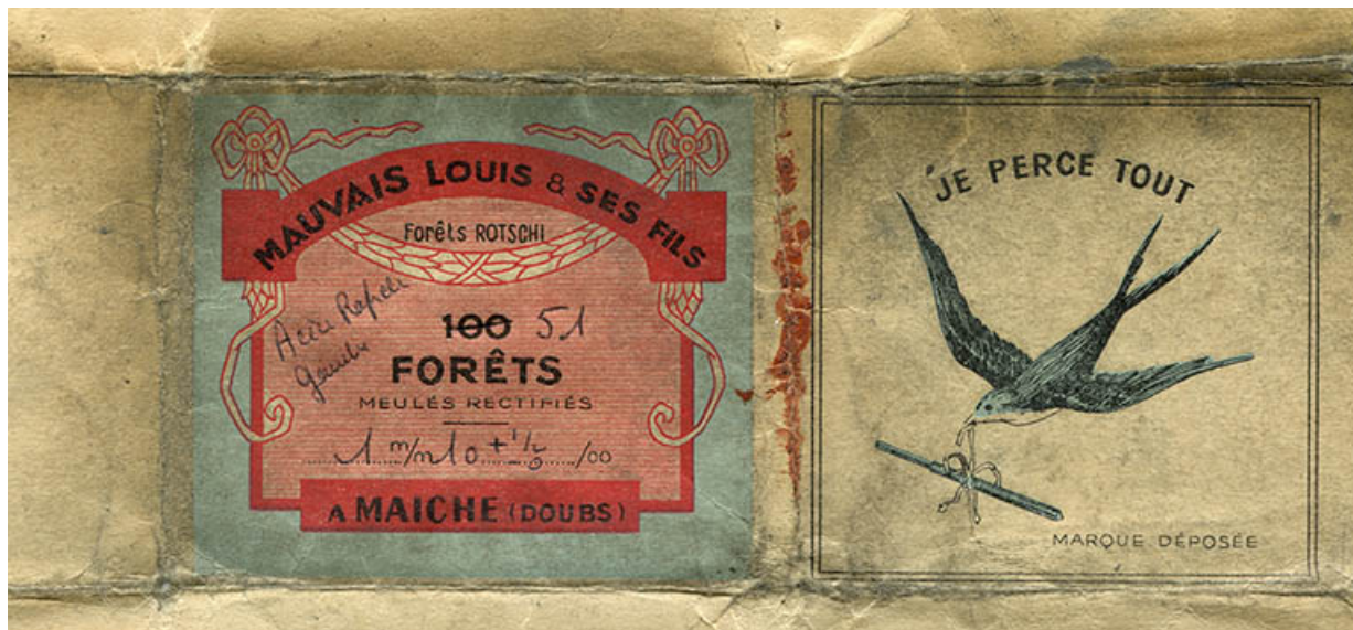
Mauvais Louis et ses Fils à Maïche (Doubs). Forêts Rotschi [sic], milieu 20e siècle. 25, Maïche, 1 rue Guynemer