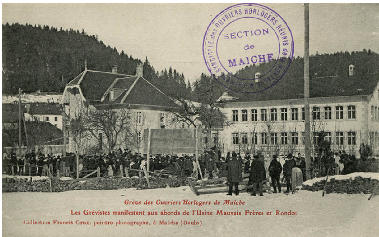
Grève des ouvriers horlogers de Maïche. Les grévistes manifestent aux abords de l'usine Mauvais Frères et Rondot, 1906.