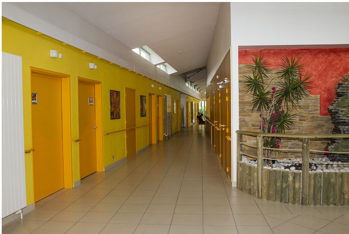
Bâtiments récents, intérieur : couloir desservant les chambres.