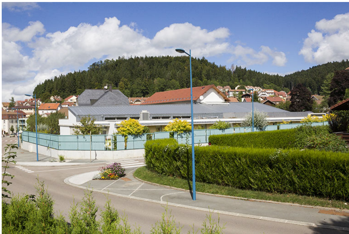
Vue d'ensemble du site, depuis le sud.