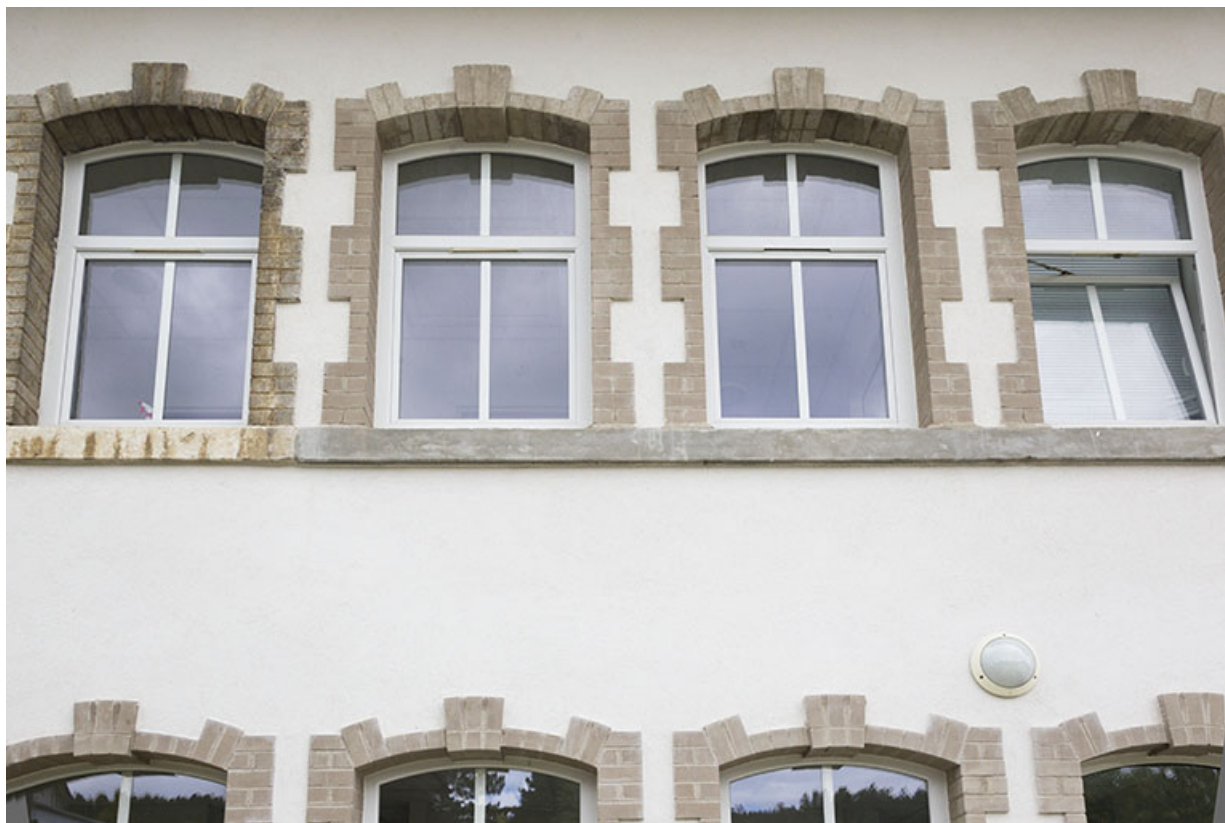
Atelier d'origine : fenêtres multiples (refaites) de l'étage, vues en contre-plongée.