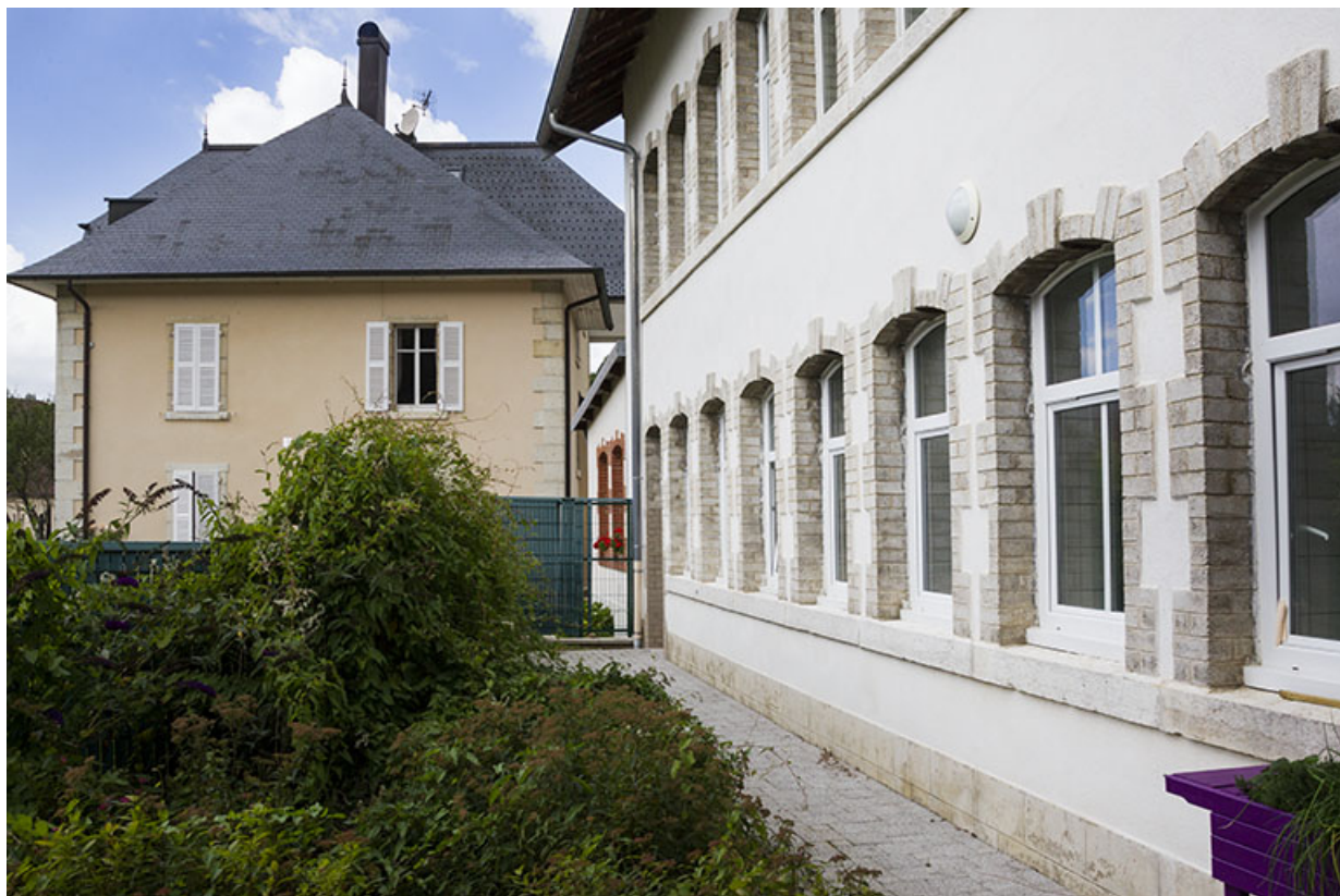
Atelier d'origine : façade occidentale, vue en enfilade. En arrière-plan, la villa. 25, Maîche, 1 rue Guynemer