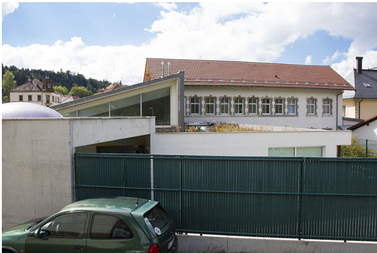
Bâtiments récents : extrémité orientale et porche. En arrière-plan, le bâtiment d'origine.