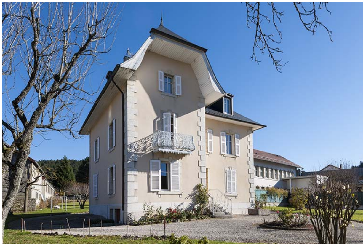
Logement patronal : façades antérieure et latérale gauche.