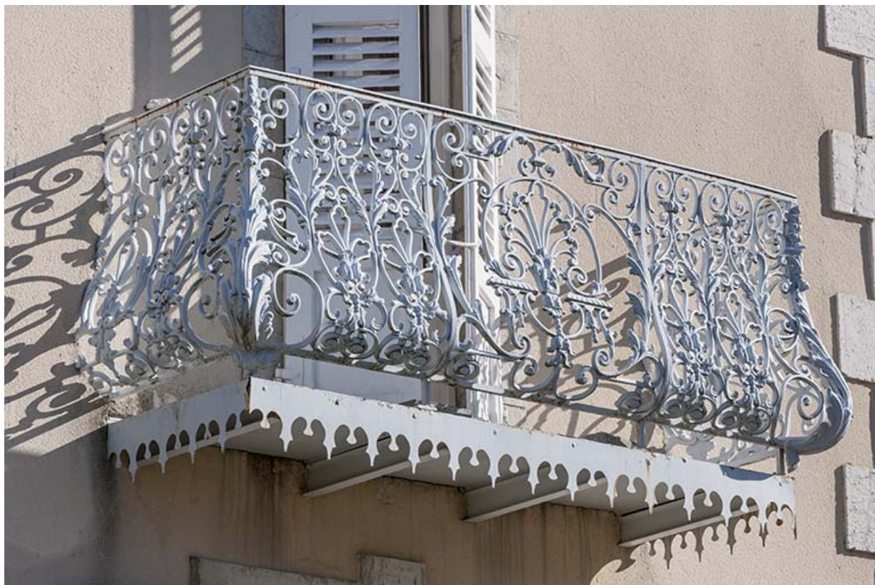
Logement patronal : balcon métallique sur la façade antérieure.