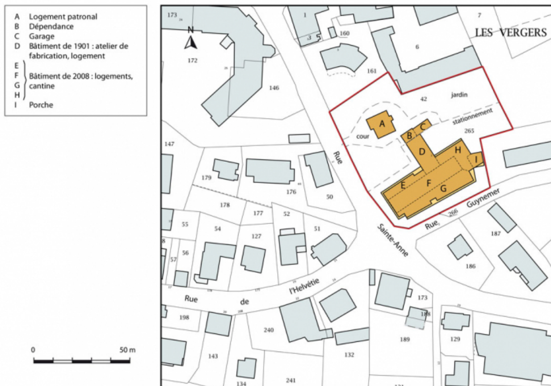
Plan-masse et de situation. Extrait du plan cadastral, 2015, section AC. 25, Maïche, 1 rue Guynemer