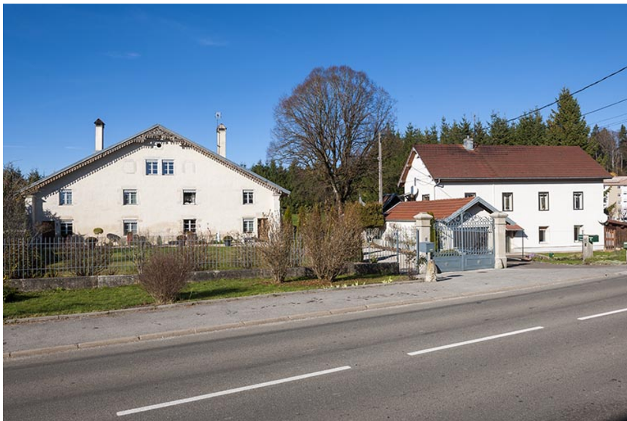
Vue d'ensemble, depuis la rue des Combes à l'est : ferme à gauche (au n° 8), atelier de fabrication à droite (au n° 6). 25, Maîche