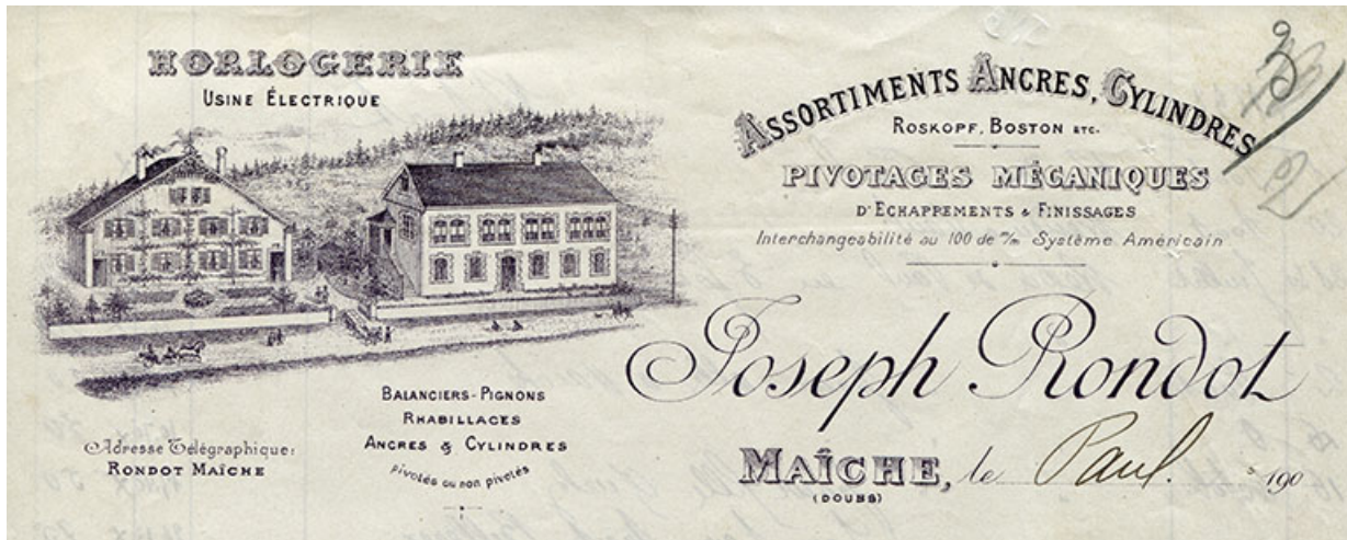
Papier à en-tête de la société Joseph Rondot [détail], décennie 1900 25, Maïche