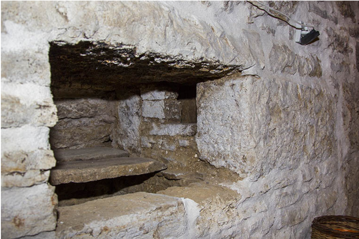
Cellier : niche dans le mur et sa cache.