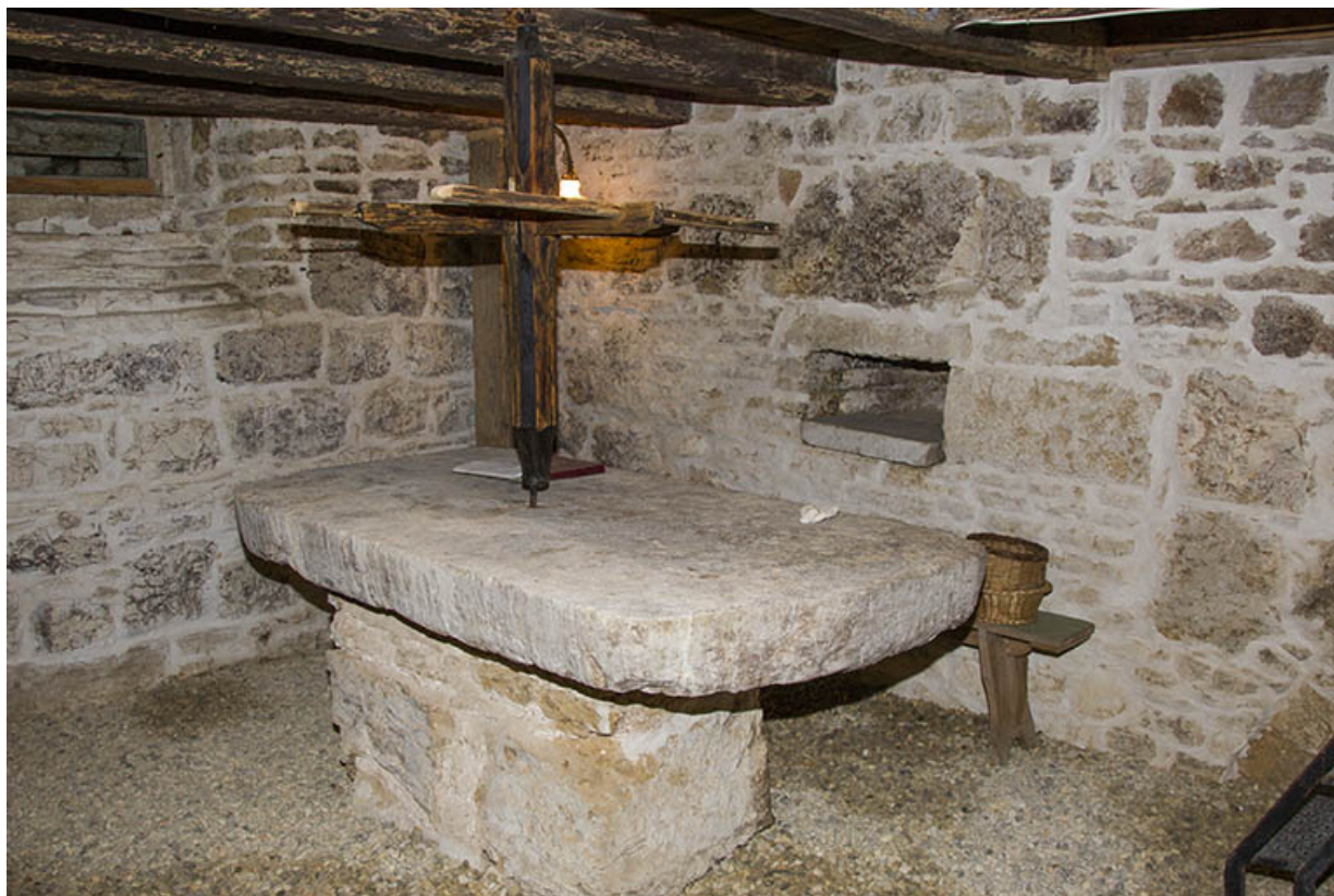
Cellier avec son "tablard".