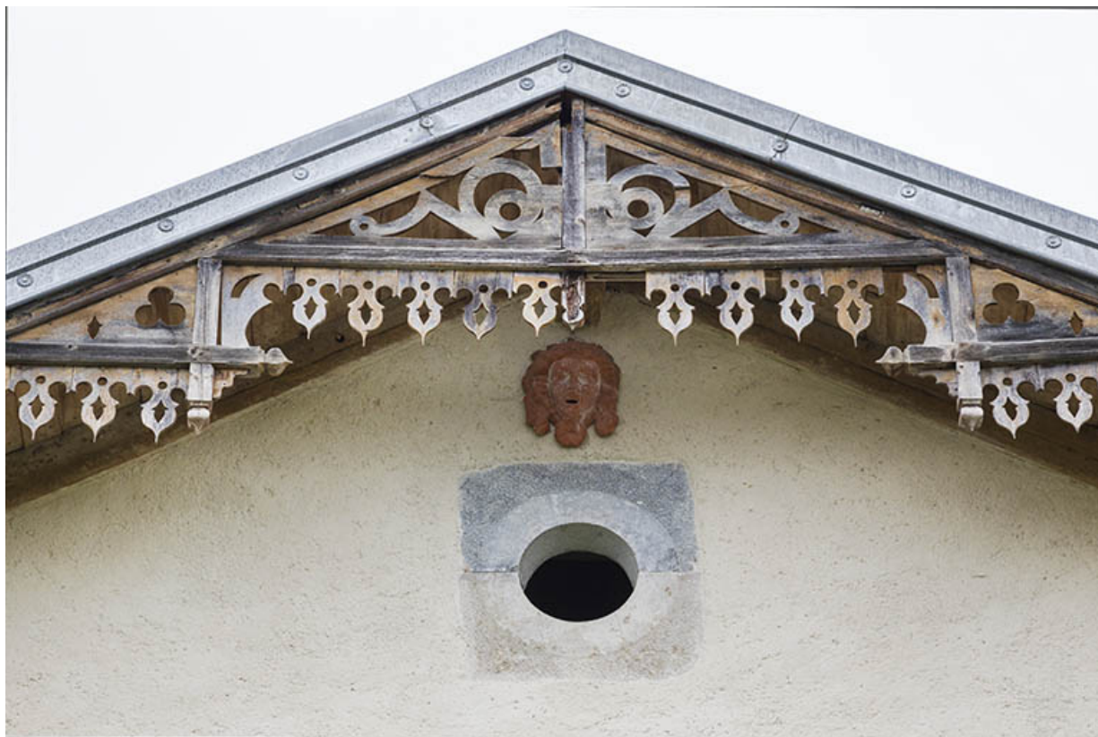
Façade antérieure : lambrequin et oculus du 2e étage de comble.