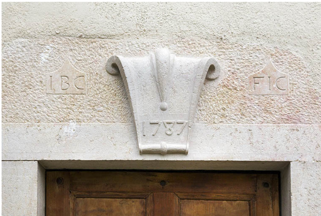
Façade antérieure : linteau orné et daté de la porte de gauche.