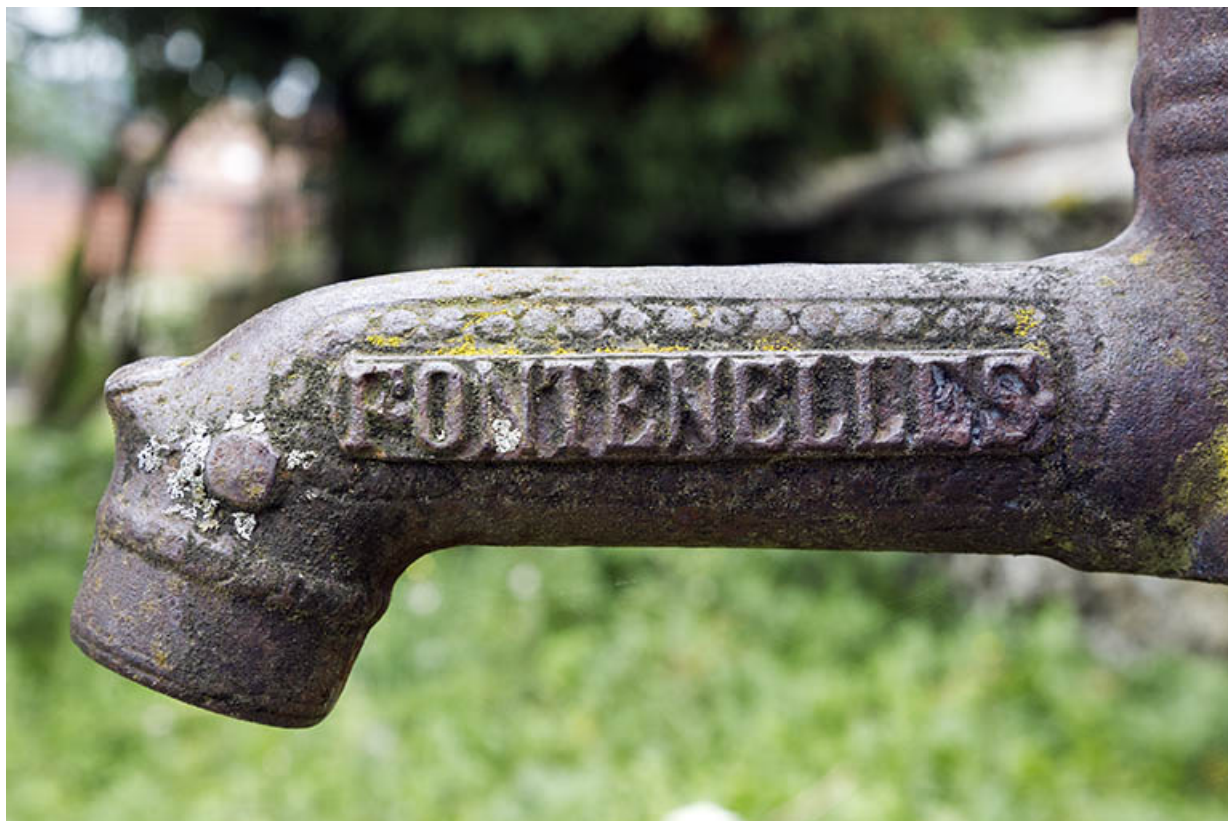
Pompe à eau Renaud : inscription localisant le fabricant aux Fontenelles. 25, Maîche, 6 et 8 rue des Combes