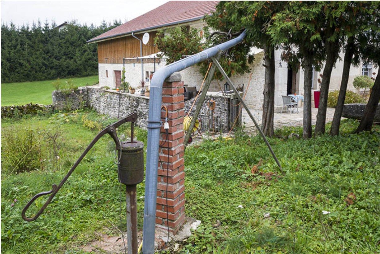
Citerne, pompe et tuyau d'amenée d'eau.