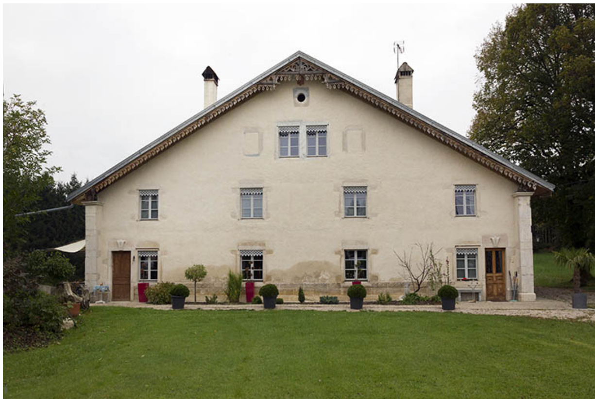
Ferme et atelier d'échappements à cylindre Joseph Rondot, à Maîche. 25, Maîche, 6 et 8 rue des Combes