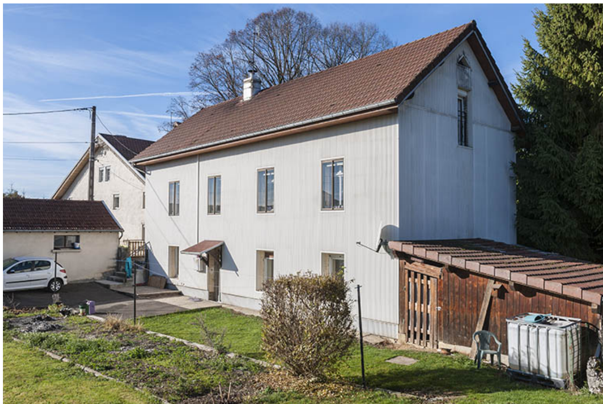
Atelier de fabrication (au n° 6), de trois quarts droite. 25, Maîche, 6 et 8 rue des Combes