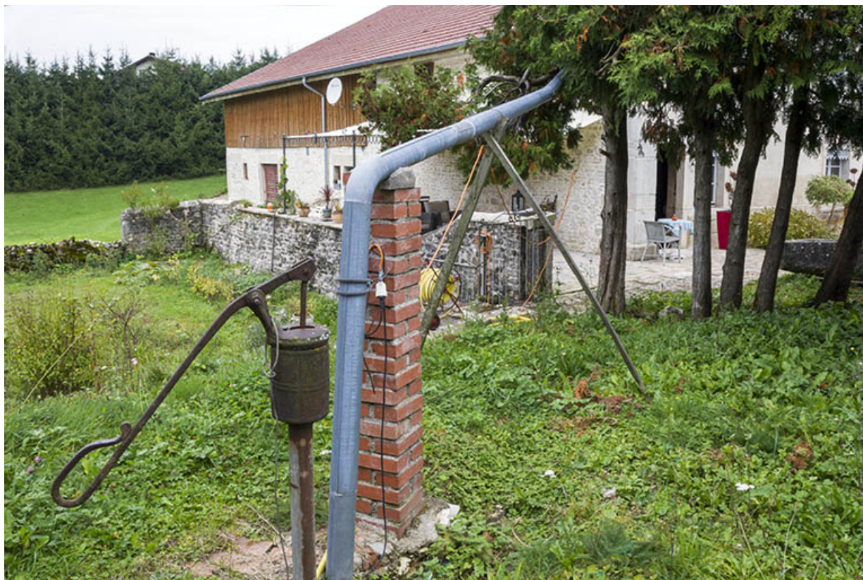
Citerne, pompe et tuyau d'amenée d'eau.