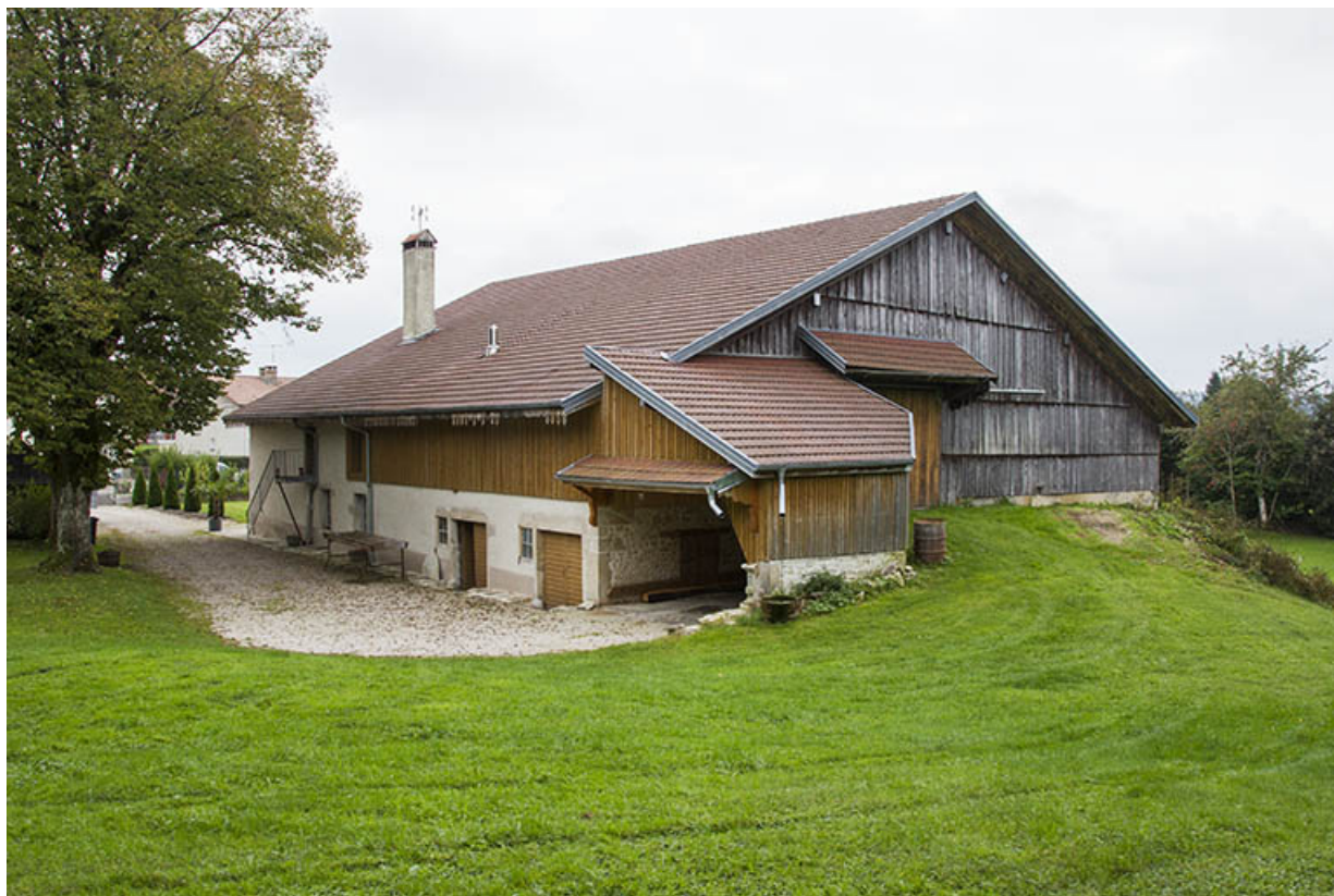
Ferme (au n° 8) : vue d'ensemble, depuis le nord (façades postérieure et latérale droite). 25, Maîche, 6 et 8 rue des Combes