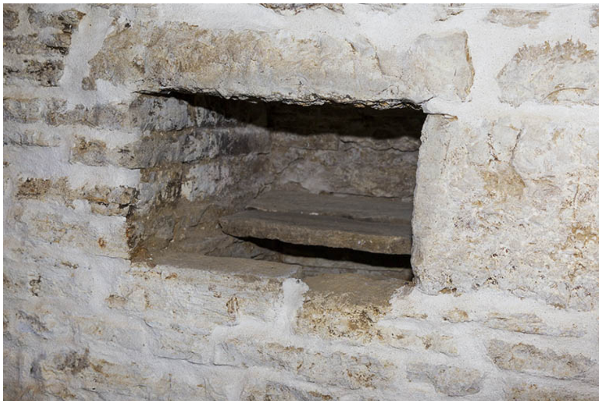
Cellier : niche dans le mur et sa cache.