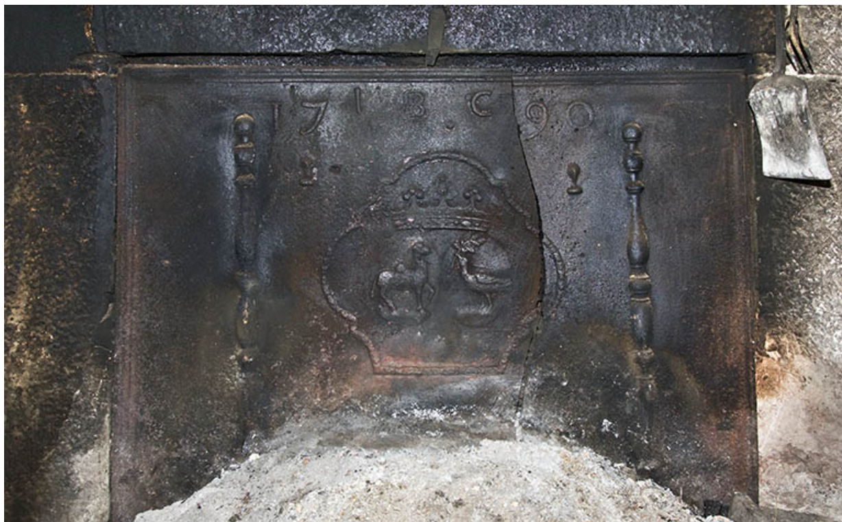
Plaque de cheminée datée 1790. 25, Maîche, 6 et 8 rue des Combes