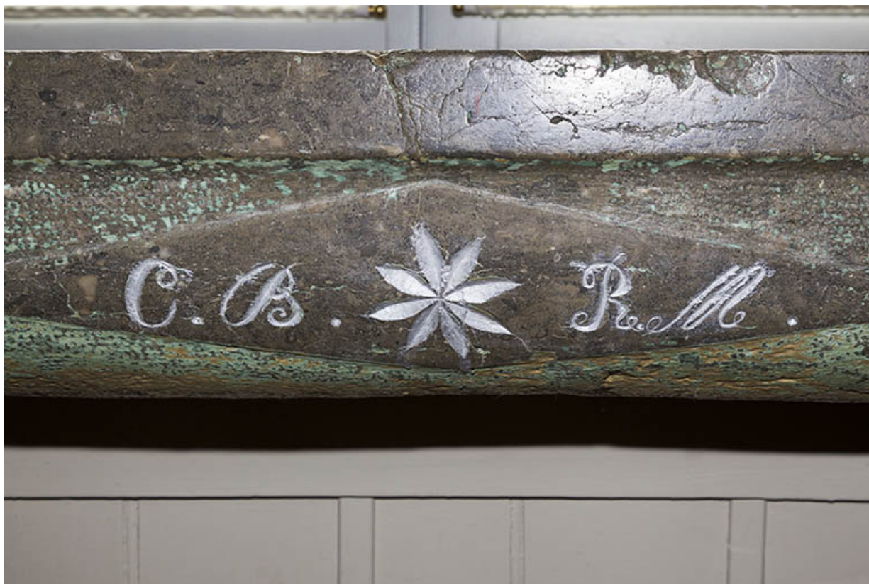
Pierre d'évier : initiales et rosace.