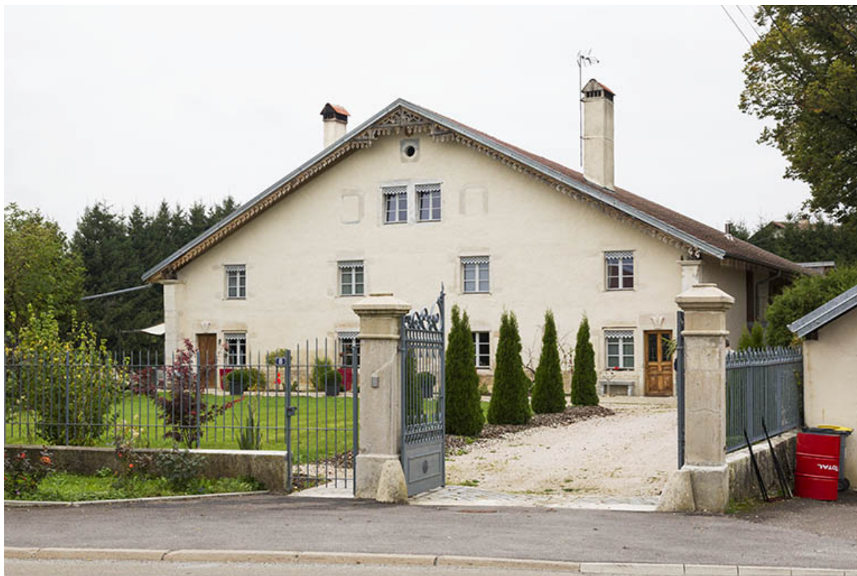
Ferme (au n° 8) : vue d'ensemble, depuis l'est (façade antérieure). 25, Maîche, 6 et 8 rue des Combes