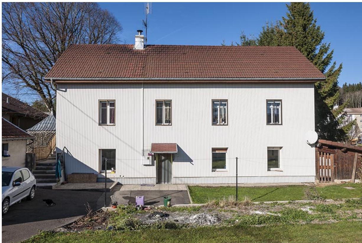
Atelier de fabrication (au n° 6) : façade antérieure. 25, Maîche, 6 et 8 rue des Combes