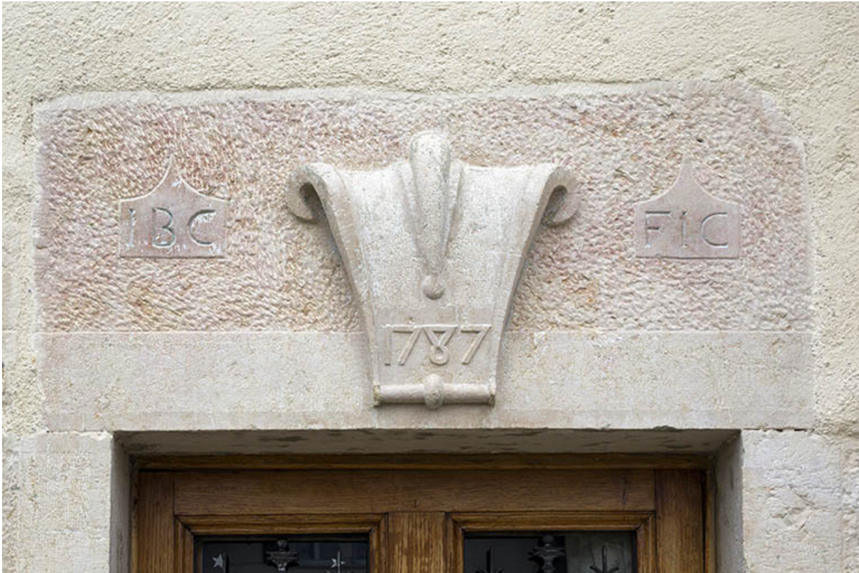
Façade antérieure : linteau orné et daté de la porte de droite.