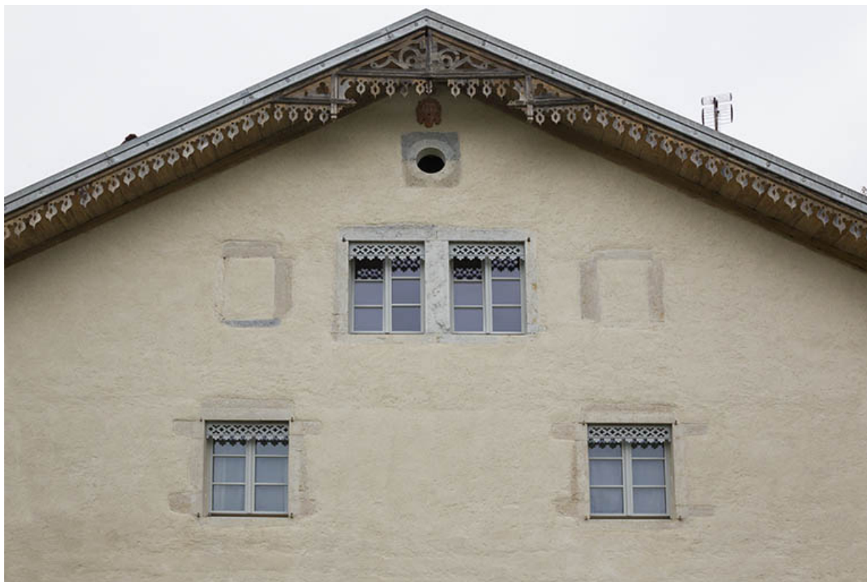
Façade antérieure : fenêtres horlogères du 1er étage de comble.