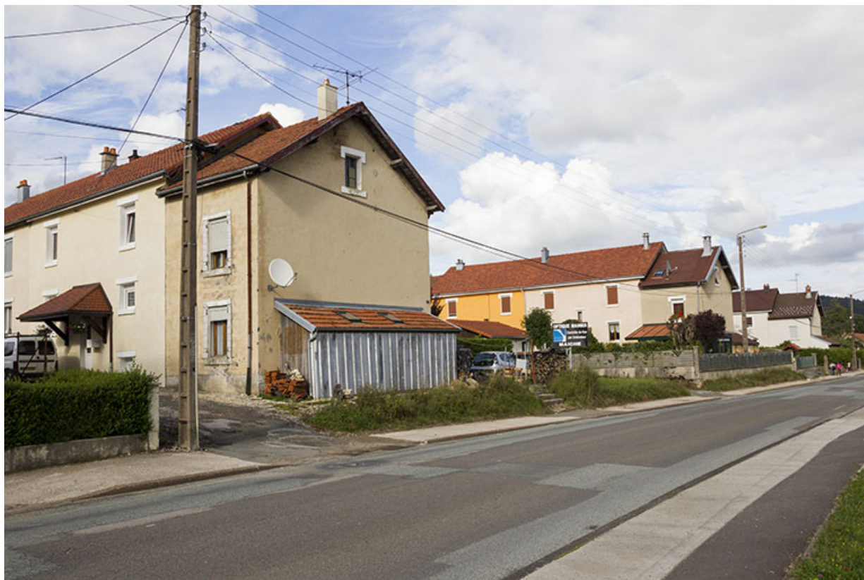
Vue d'ensemble rapprochée de la cité, depuis l'ouest.

25, Maîche, 7-11 avenue du Maréchal Leclerc