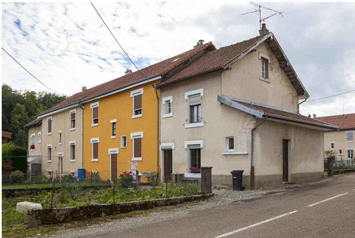
Immeuble au n° 9 : vue d'ensemble, depuis le nord-est. 25, Maîche, 7-9 rue du Mont