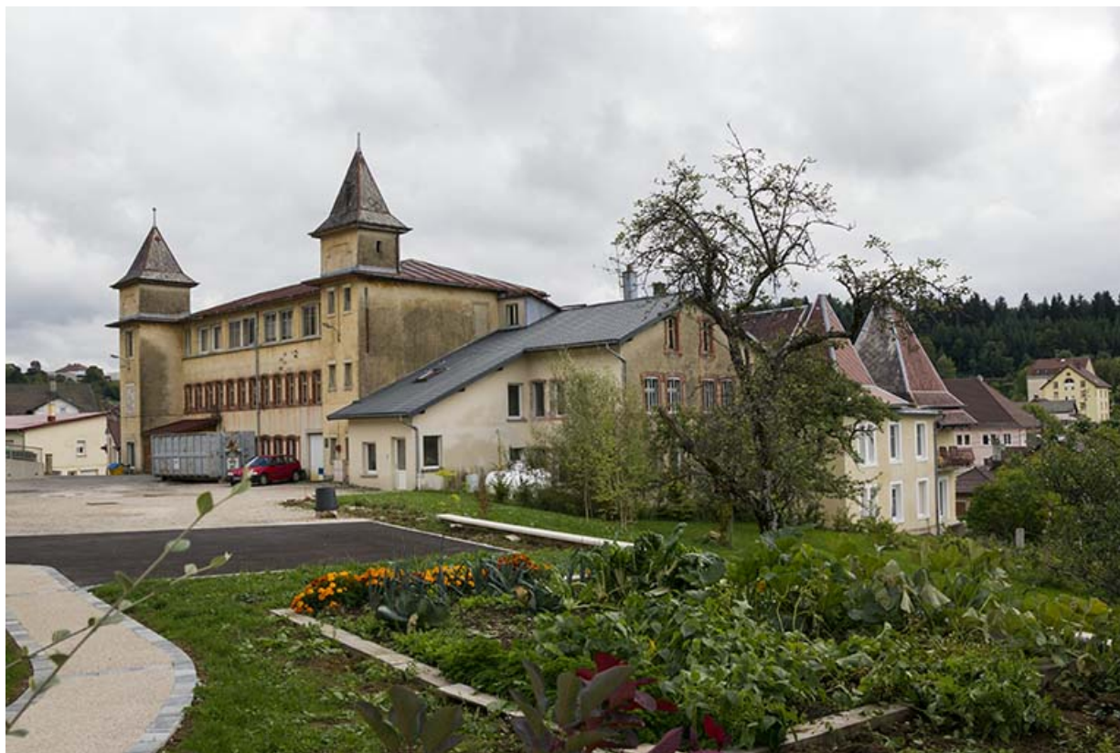
Vue d'ensemble, depuis le nord-ouest.