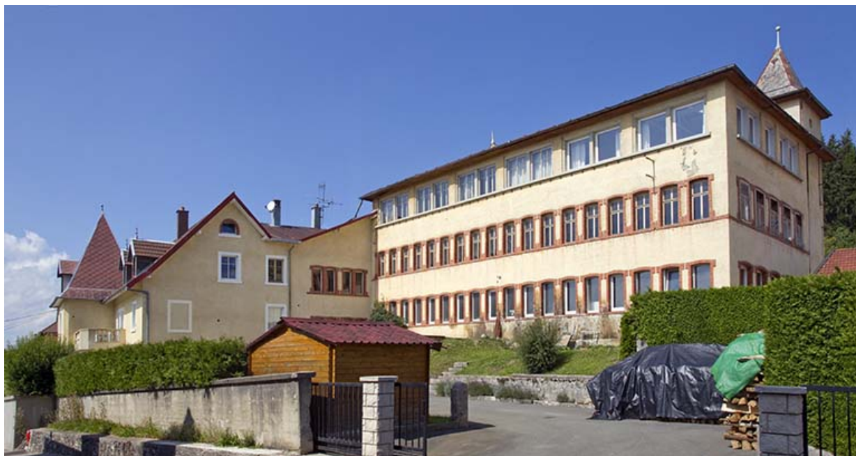
Vue d'ensemble, depuis la rue du Mont à l'est.