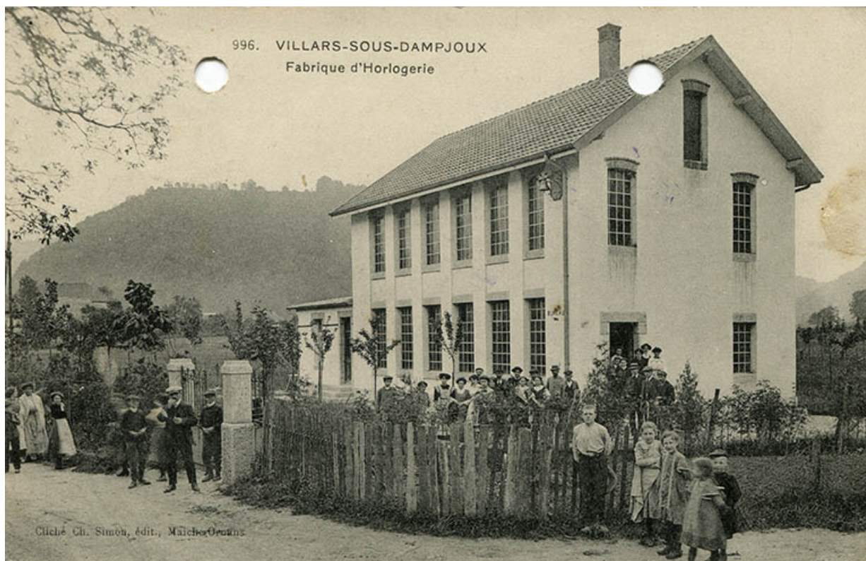
996. Villars-sous-Dampjoux. Fabrique d'horlogerie, entre 1908 et 1914. 25, Villars-sous-Dampjoux, 9 rue de Rochedane