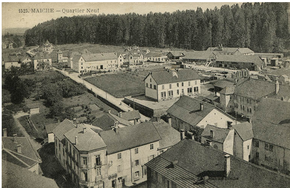
1525. Maïche - Quartier neuf [vu du clocher de l'église, au nord-ouest], 2e quart 20e siècle.