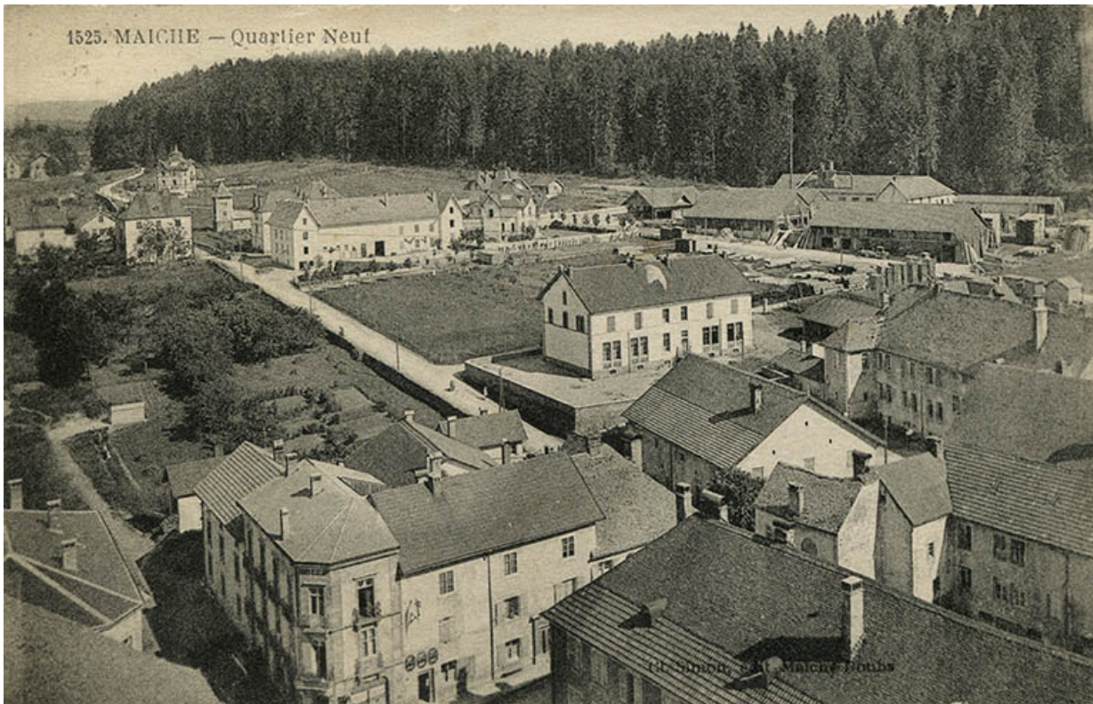
1525. Maïche - Quartier neuf [vu du clocher de l'église, au nord-ouest], 2e quart 20e siècle. 25, Maïche rue de la Scierie