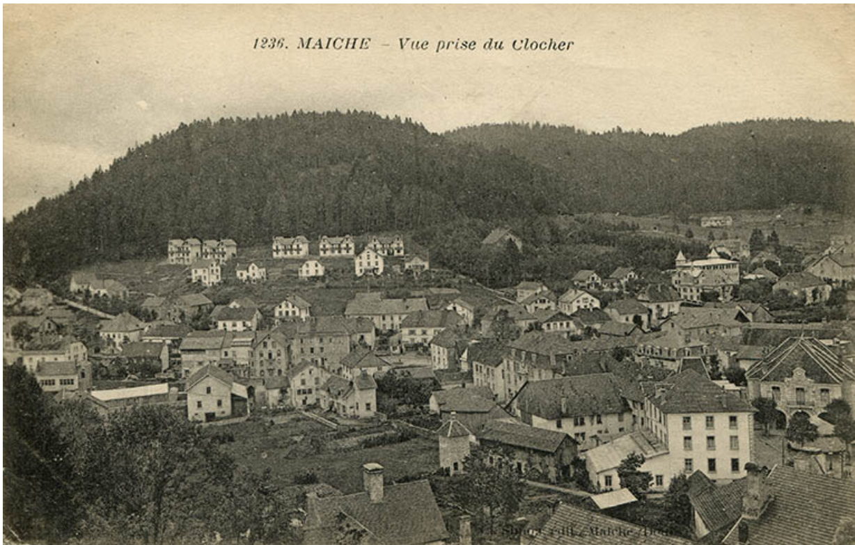
1236. Maïche - Vue prise du clocher [centre du village et quartier de Montjoie], 2e quart 20e siècle. 25, Maïche, 7-9 rue du Mont