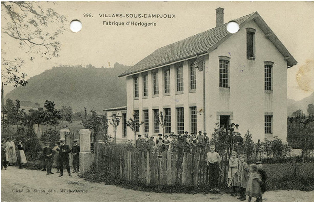
996. Villars-sous-Dampjoux. Fabrique d'horlogerie, entre 1908 et 1914. 25, Villars-sous-Dampjoux, 9 rue de Rochedane