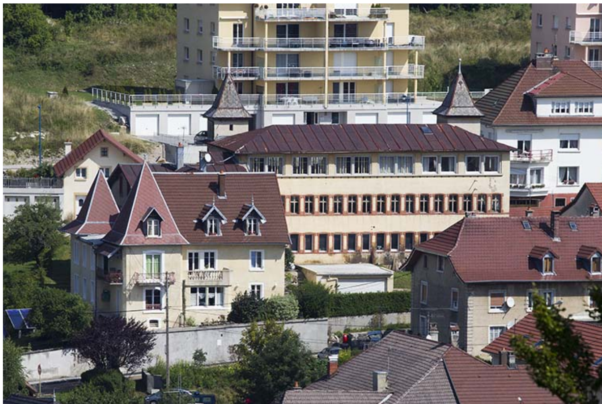
Vue d'ensemble plongeante, depuis le sud. 25, Maïche, 7-9 rue du Mont