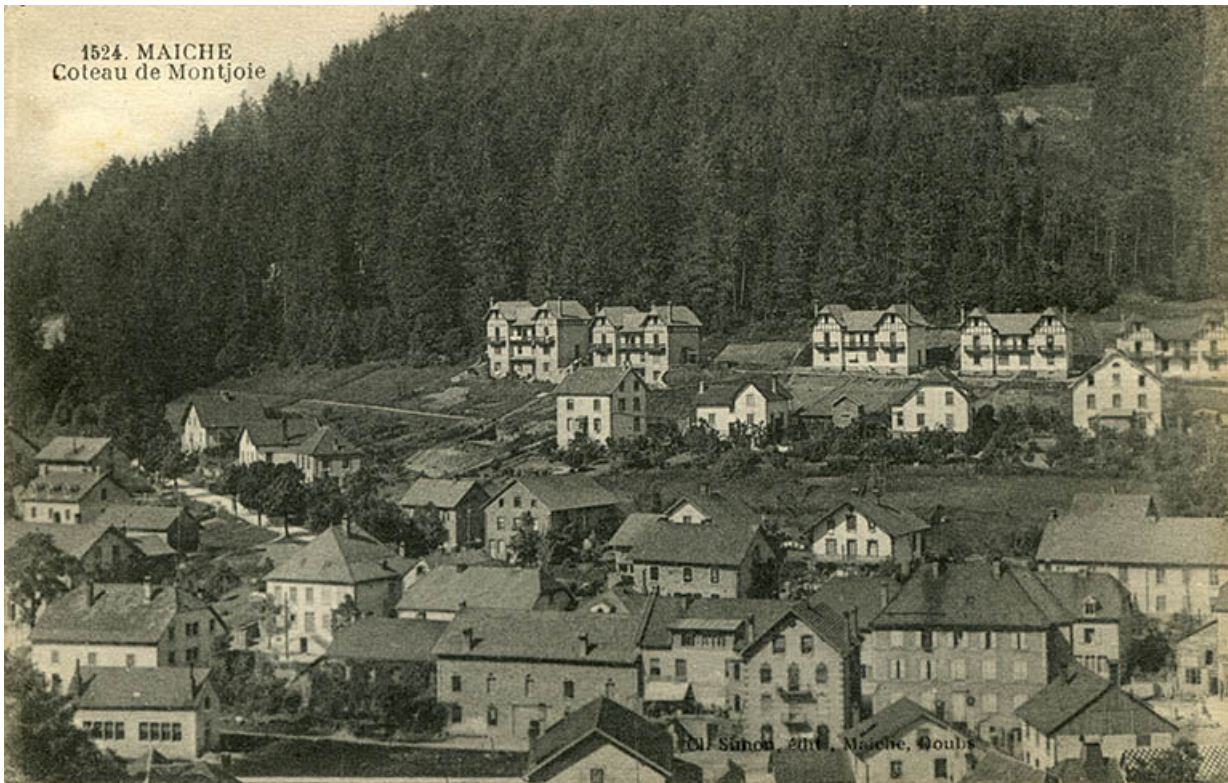
1524. Maîche - Coteau de Montjoie, 1er quart 20e siècle.