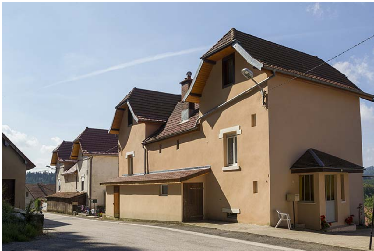
Immeubles n° 4 et 6 : façades côté rue (est), de trois quarts droite.