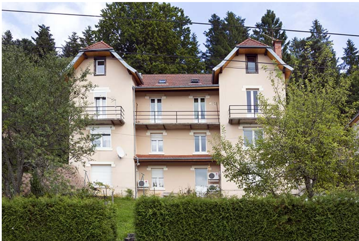
Immeuble n° 4 : façade côté vallée (ouest). 25, Maîche, 1, 3-7 rue Montjoie