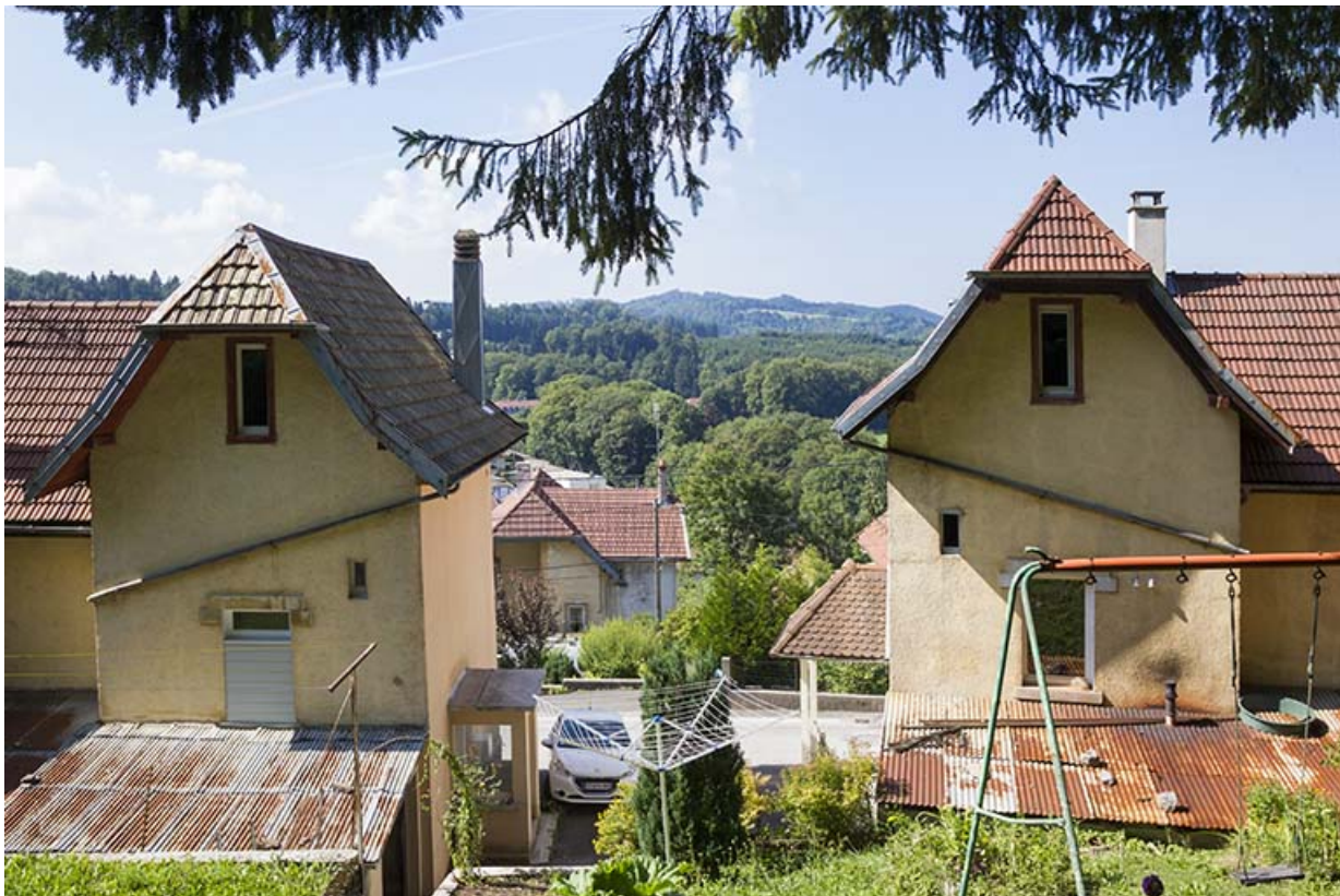
Immeubles aux n° 1 (à droite) et 3 (à gauche) : mur pignon des corps d'extrémité côté mont (est). 25, Maîche, 1, 3-7 rue Montjoie