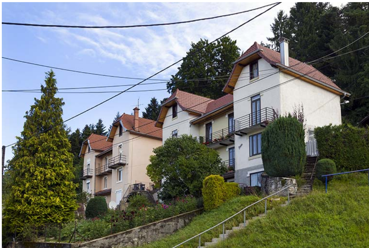
Immeubles n° 4 et 6 : façades côté vallée (ouest), de trois quarts droite. 25, Maîche, 1, 3-7 rue Montjoie