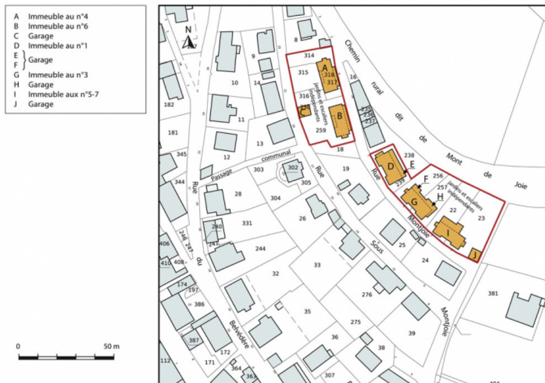
Plan-masse et de situation. Extrait du plan cadastral, 2015, section AB. 25, Maîche, 1, 3-7 rue Montjoie