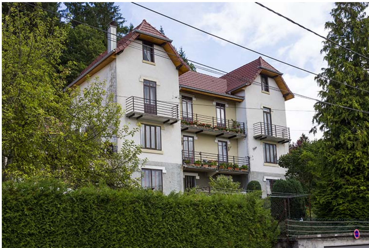
Immeuble n° 6 : façade côté vallée (ouest), de trois quarts gauche. 25, Maîche, 7-9 rue du Mont