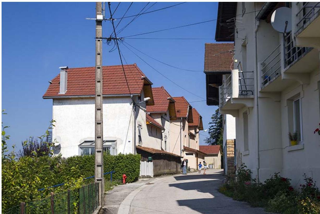
Immeubles n° 4 et 6 rue Montjoie : vue en enfilade côté rue, depuis le sud-ouest. 25, Maîche, 7-9 rue du Mont