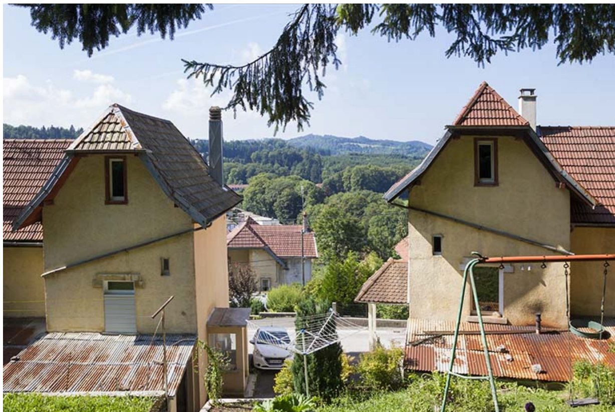
Immeubles aux n° 1 (à droite) et 3 (à gauche) : mur pignon des corps d'extrémité côté mont (est). 25, Maîche, 1, 3-7 rue Montjoie