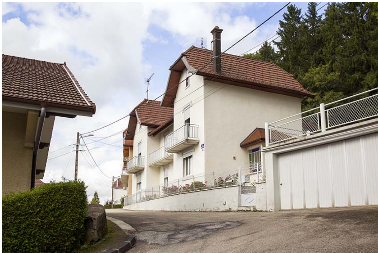
Immeuble aux n° 5-7 : façade côté vallée (ouest), de trois quarts droite. 25, Maîche, 1, 3-7 rue Montjoie