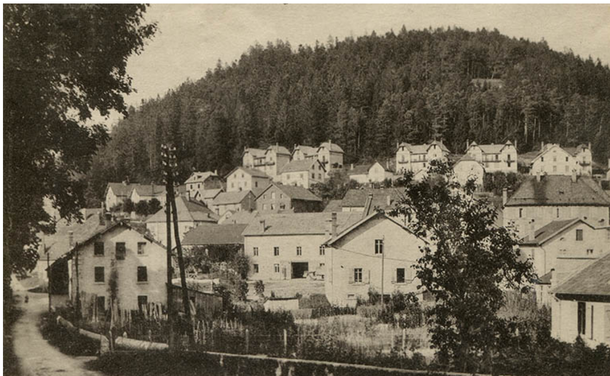
Montagnes du Doubs. 9 - Maïche (Doubs). - Coteau de Montjoie, 2e quart 20e siècle (avant 1937). 25, Maïche, 1, 3-7 rue Montjoie