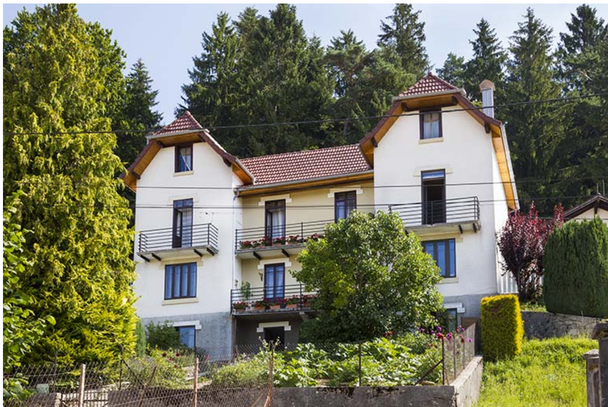
Immeuble n° 6 : façade côté vallée (ouest). 25, Maîche, 1, 3-7 rue Montjoie