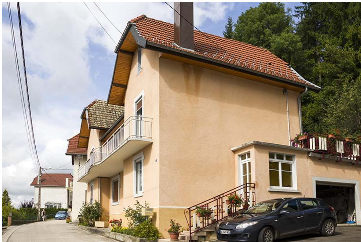
Immeuble au n° 3 : façade côté vallée (ouest), vue en enfilade depuis l'est. 25, Maîche, 1, 3-7 rue Montjoie