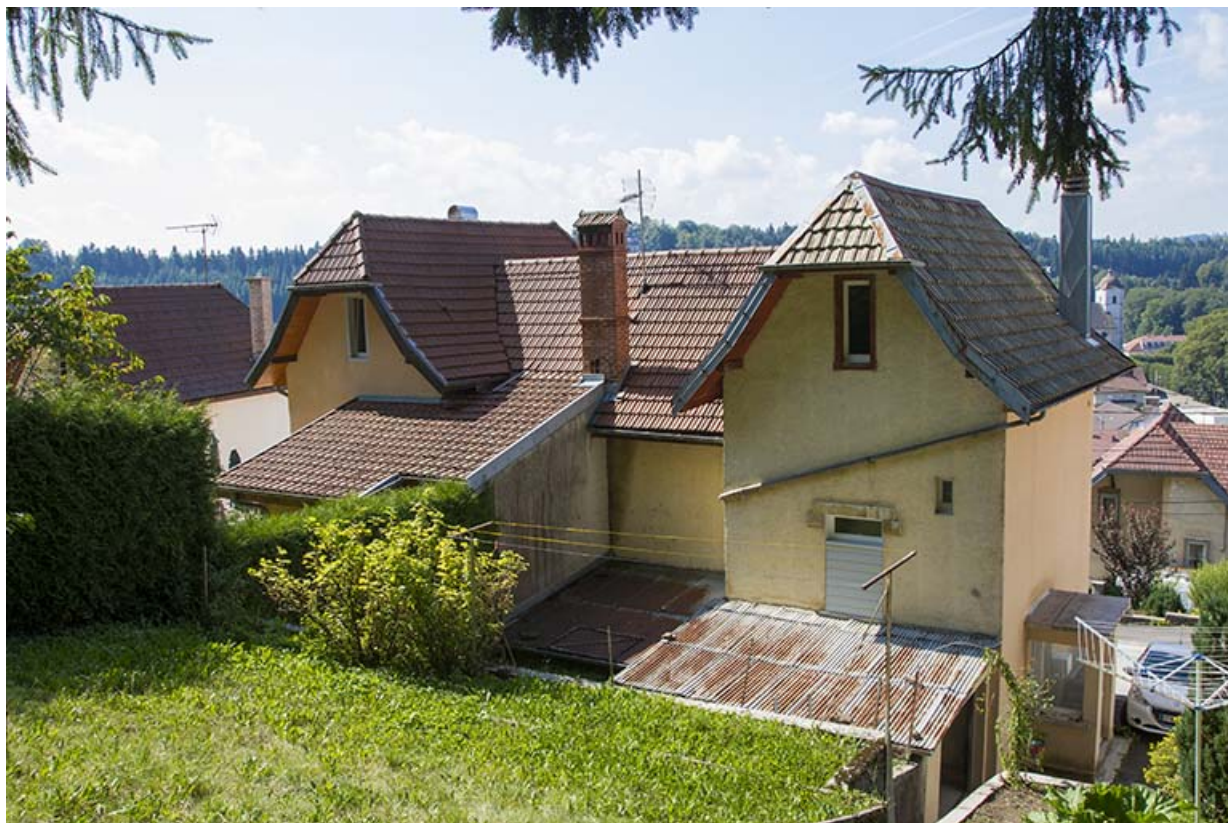
Immeuble au n° 3 : façade côté mont (est), de trois quarts droite. 25, Maîche, 1, 3-7 rue Montjoie