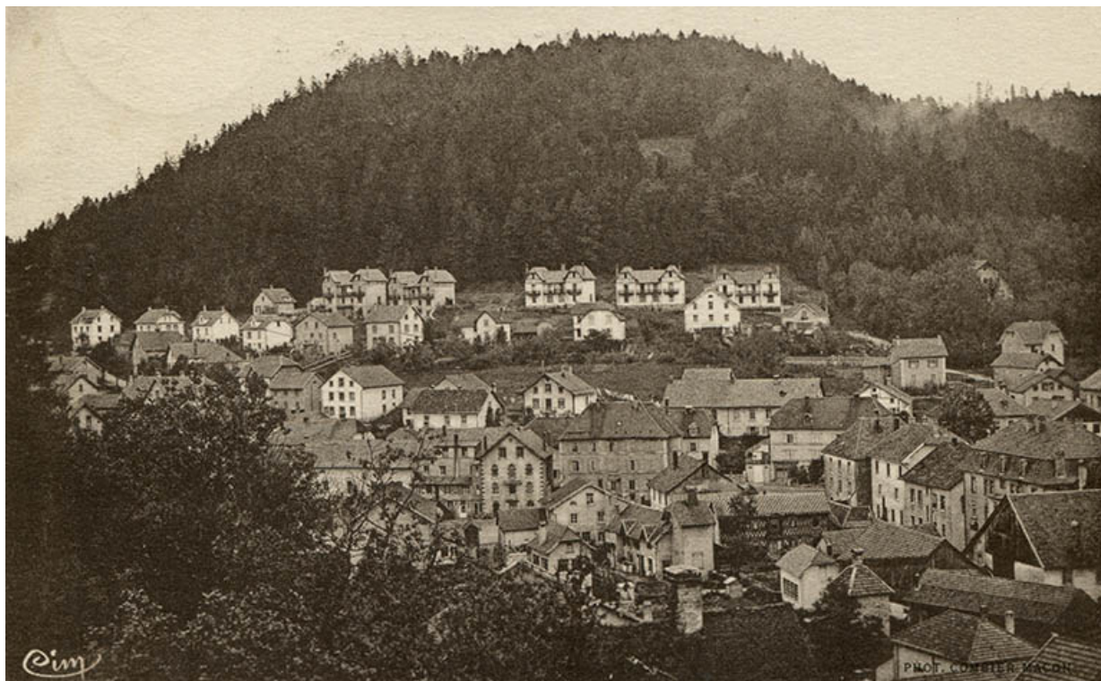
Maîche (Doubs) - Côteau de Monjoie [sic], 2e quart 20e siècle (avant 1943).