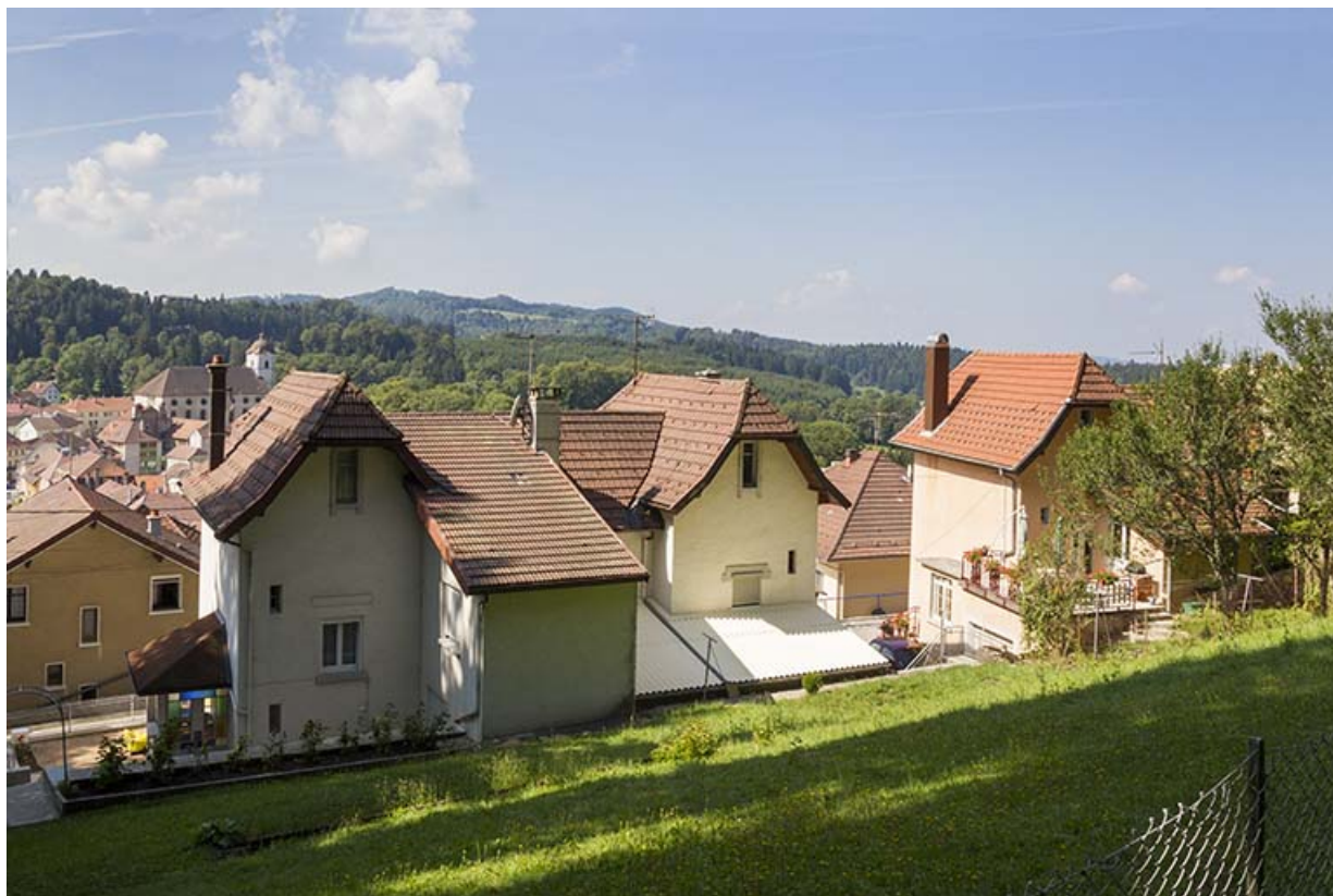
Immeuble aux n° 5-7 : façade côté mont (est), de trois quarts gauche. 25, Maîche, 1, 3-7 rue Montjoie