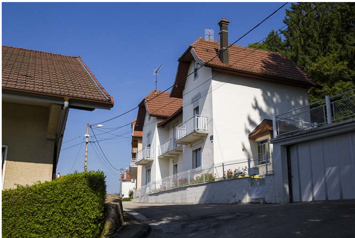
Immeuble aux n° 5-7 : façade côté vallée (ouest), de trois quarts droite. 25, Maîche, 1, 3-7 rue Montjoie