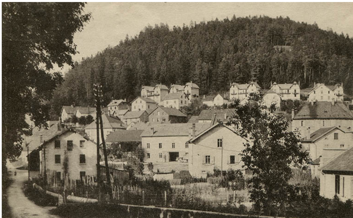
Montagnes du Doubs. 9 - Maïche (Doubs). - Coteau de Montjoie, 2e quart 20e siècle (avant 1937). 25, Maïche, 1, 3-7 rue Montjoie