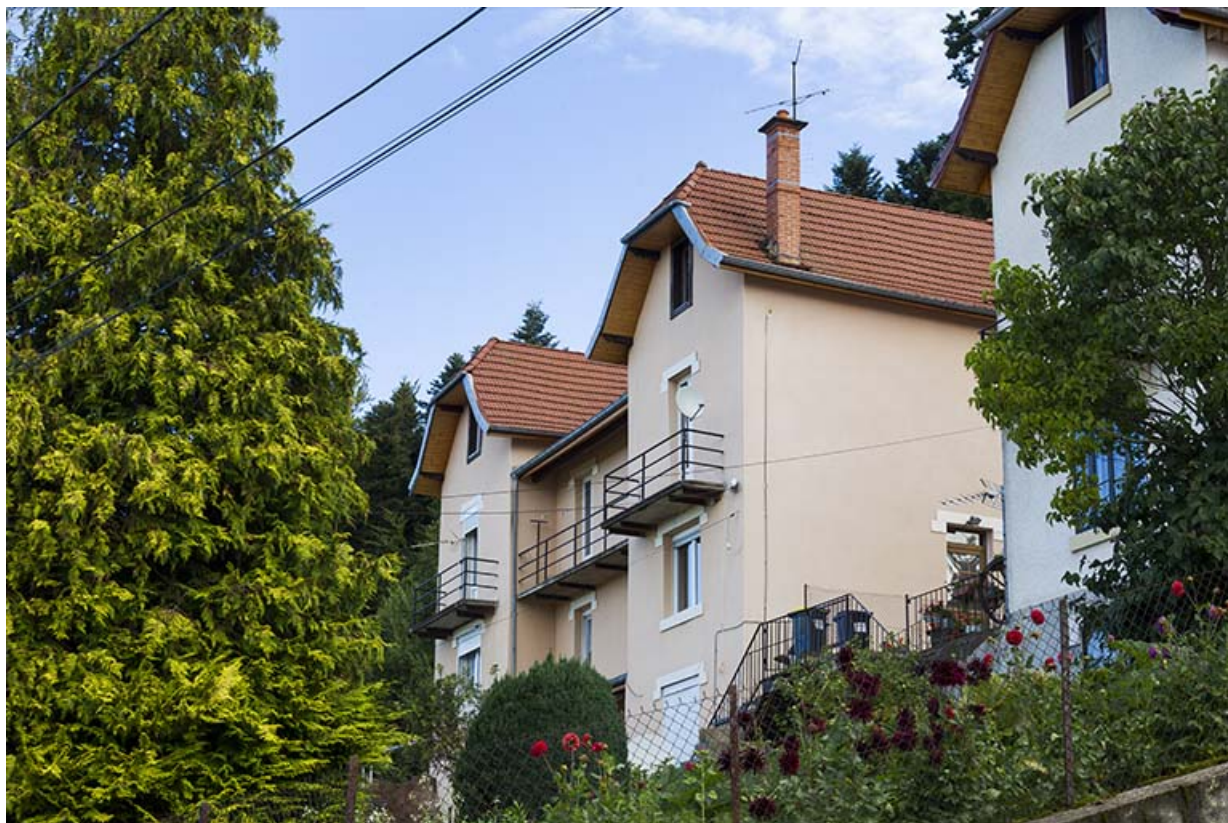
Immeuble n° 4 : façade côté vallée (ouest), de trois quarts droite. 25, Maîche, 1, 3-7 rue Montjoie