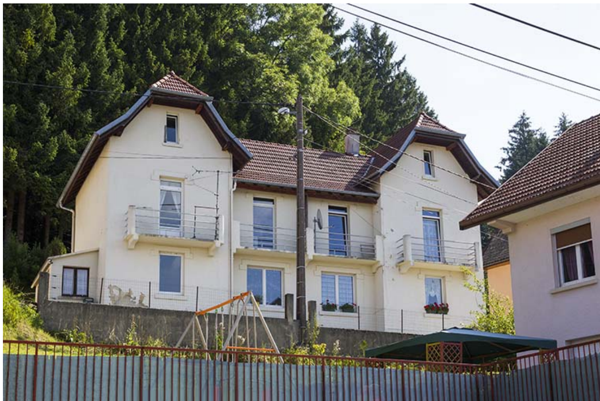
Immeuble au n° 1 : façade côté vallée (ouest).