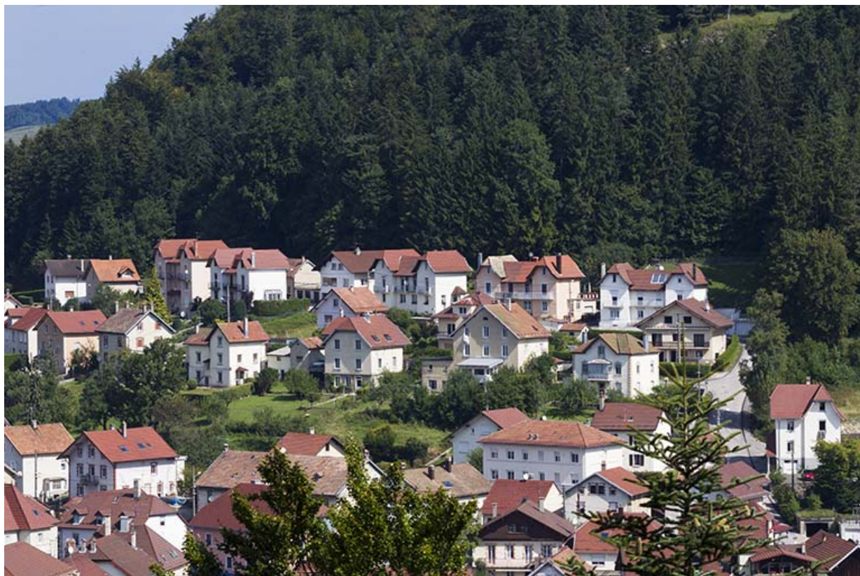
Vue d'ensemble du quartier de Montjoie, depuis le sud.