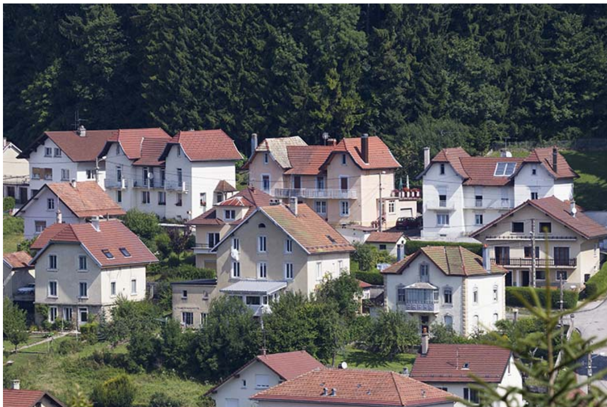
Vue d'ensemble des trois immeubles orientaux (n° 1 à 7 rue Montjoie), depuis le sud. 25, Maîche