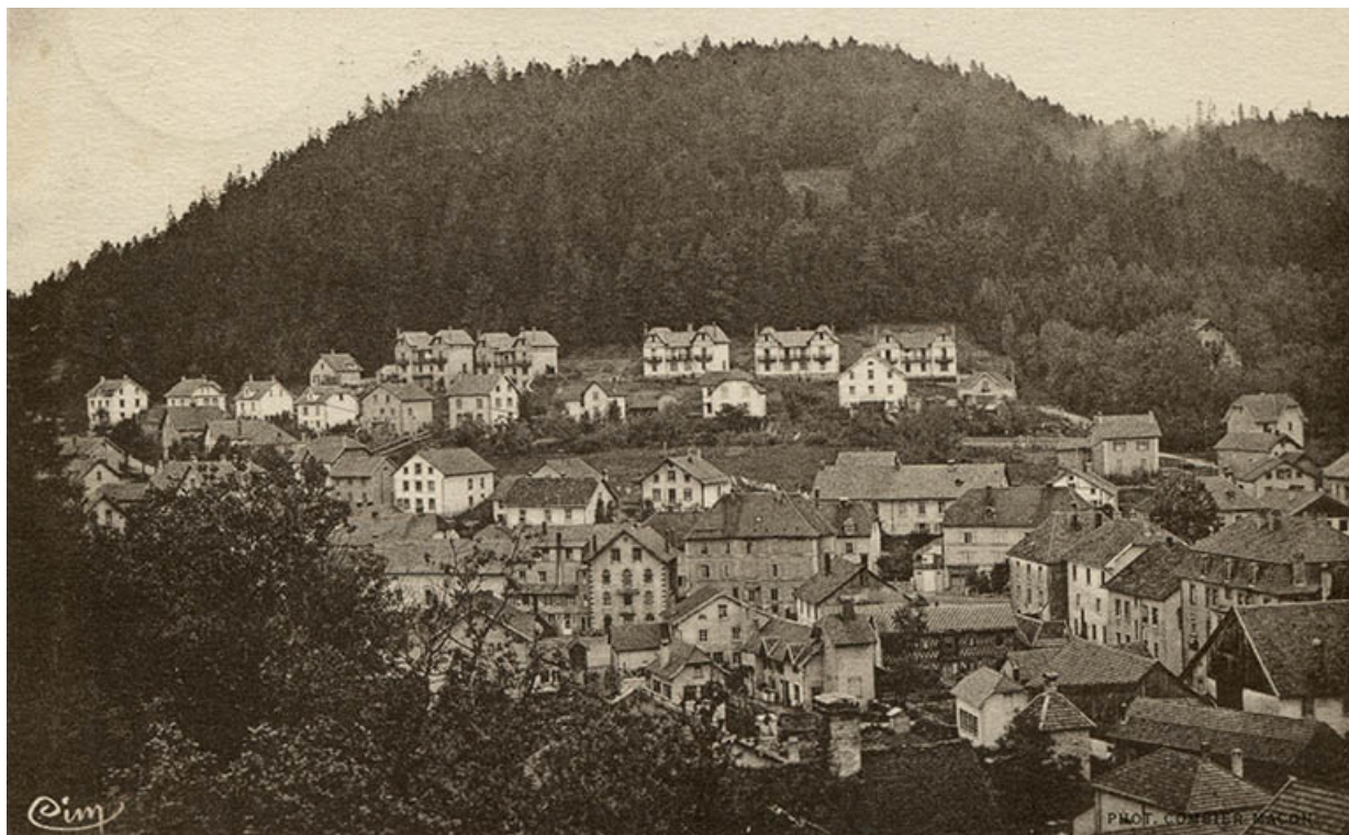
Maïche (Doubs) - Côteau de Monjoie [sic], 2e quart 20e siècle (avant 1943). 25, Maïche, 1, 3-7 rue Montjoie