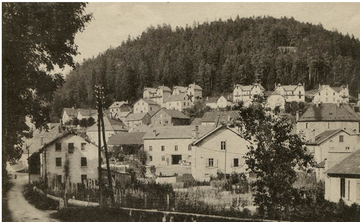
Montagnes du Doubs. 9 - Maîche (Doubs). - Coteau de Montjoie, 2e quart 20e siècle (avant 1937).