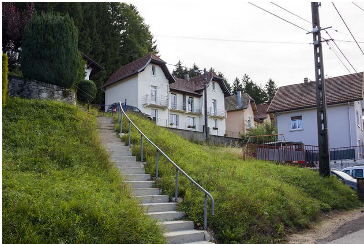
Immeuble au n° 1 : façade côté vallée (ouest), de trois quarts gauche. 25, Maîche, 1, 3-7 rue Montjoie