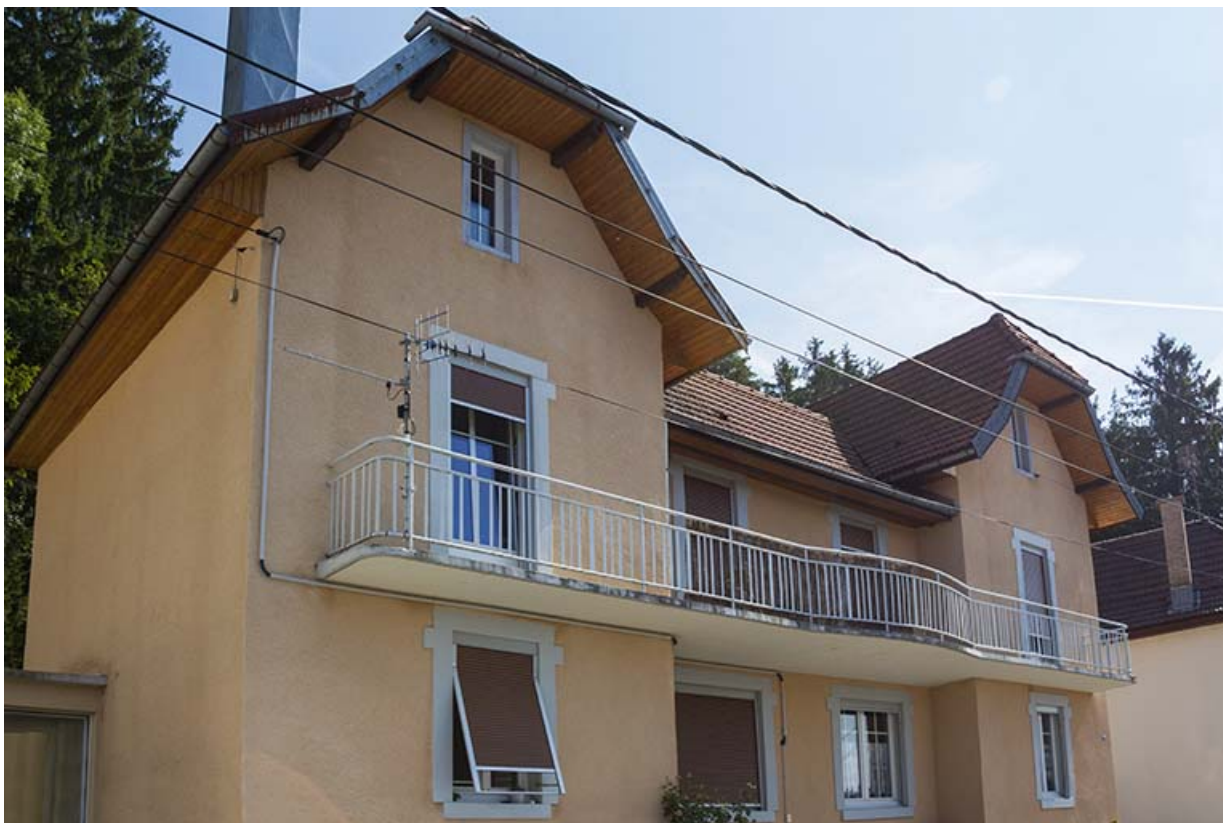
Immeuble au n° 3 : façade côté vallée (ouest), de trois quarts gauche. 25, Maîche, 1, 3-7 rue Montjoie