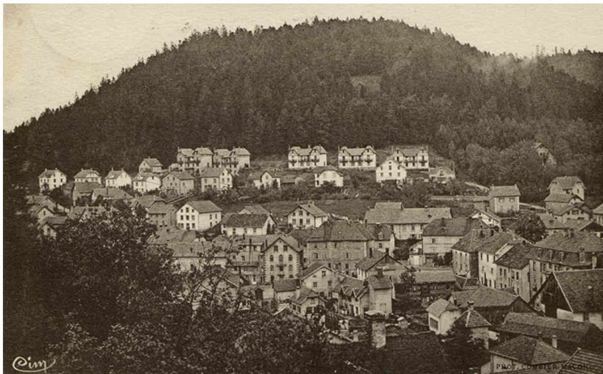
Maïche (Doubs) - Côteau de Monjoie [sic], 2e quart 20e siècle (avant 1943). 25, Maïche, 1, 3-7 rue Montjoie