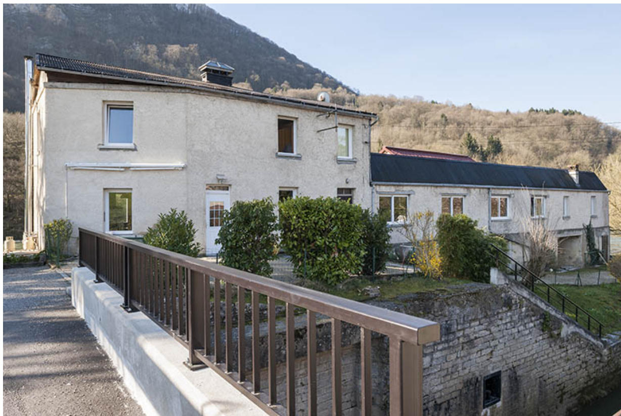
Logement et atelier de fabrication depuis l'écluse.

25, Ougney-Douvot, lieudit : Ougney-les-Champs