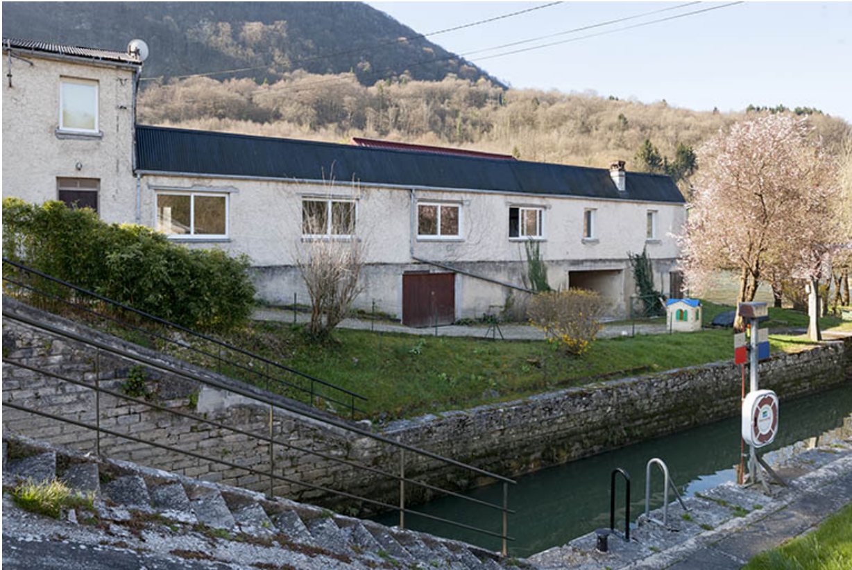
Atelier de fabrication depuis le chemin de halage.

25, Ougney-Douvot, lieudit : Ougney-les-Champs