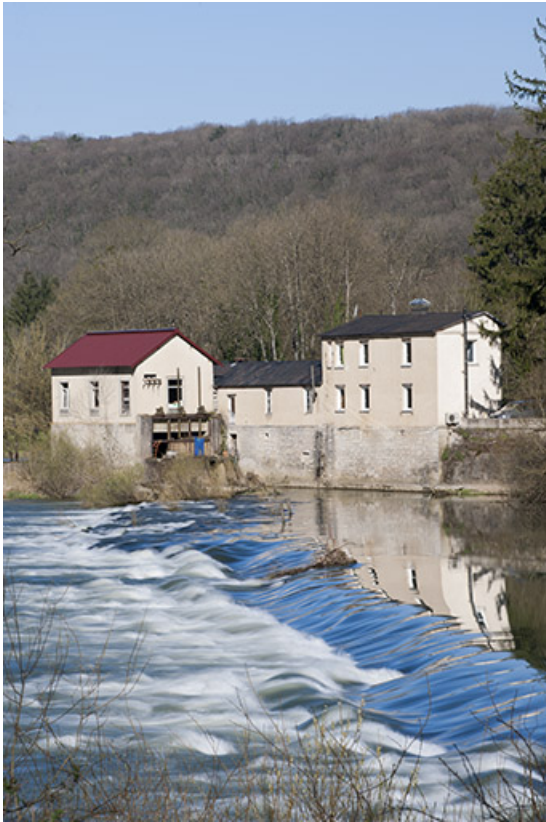
Vue depuis la rive gauche du barrage.

25, Ougney-Douvot, lieudit : Ougney-les-Champs