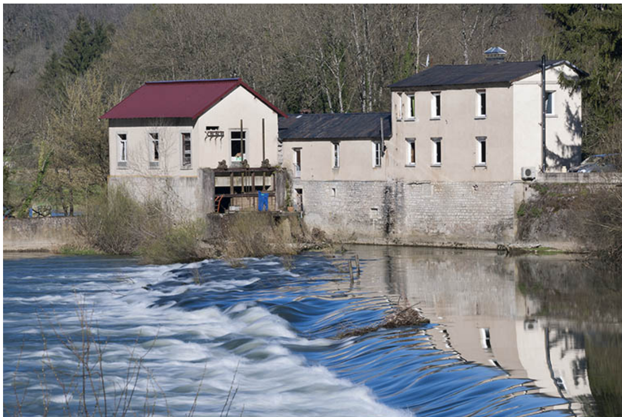
Vue d'ensemble depuis la rive gauche du Doubs.

25, Ougney-Douvot, lieudit : Ougney-les-Champs