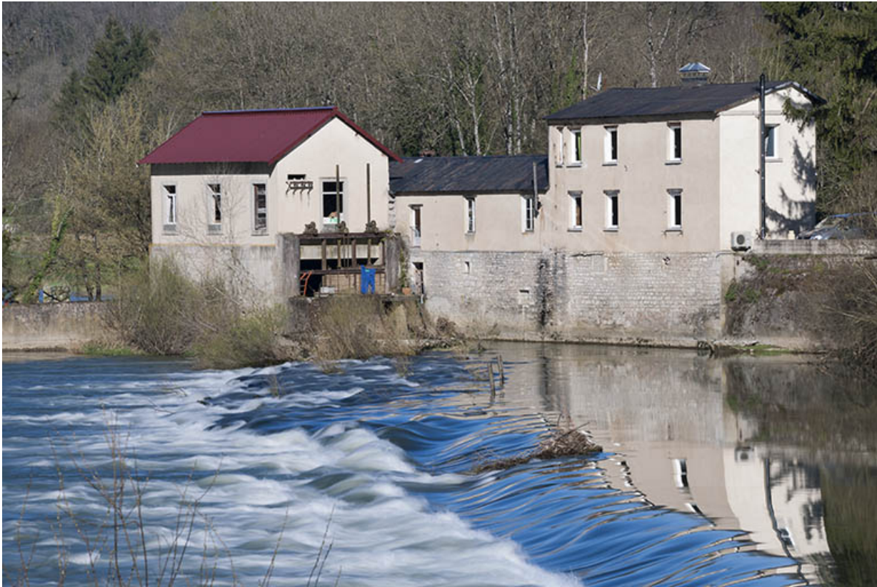
Vue d'ensemble depuis la rive gauche du Doubs.

25, Ougney-Douvot, lieudit : Ougney-les-Champs