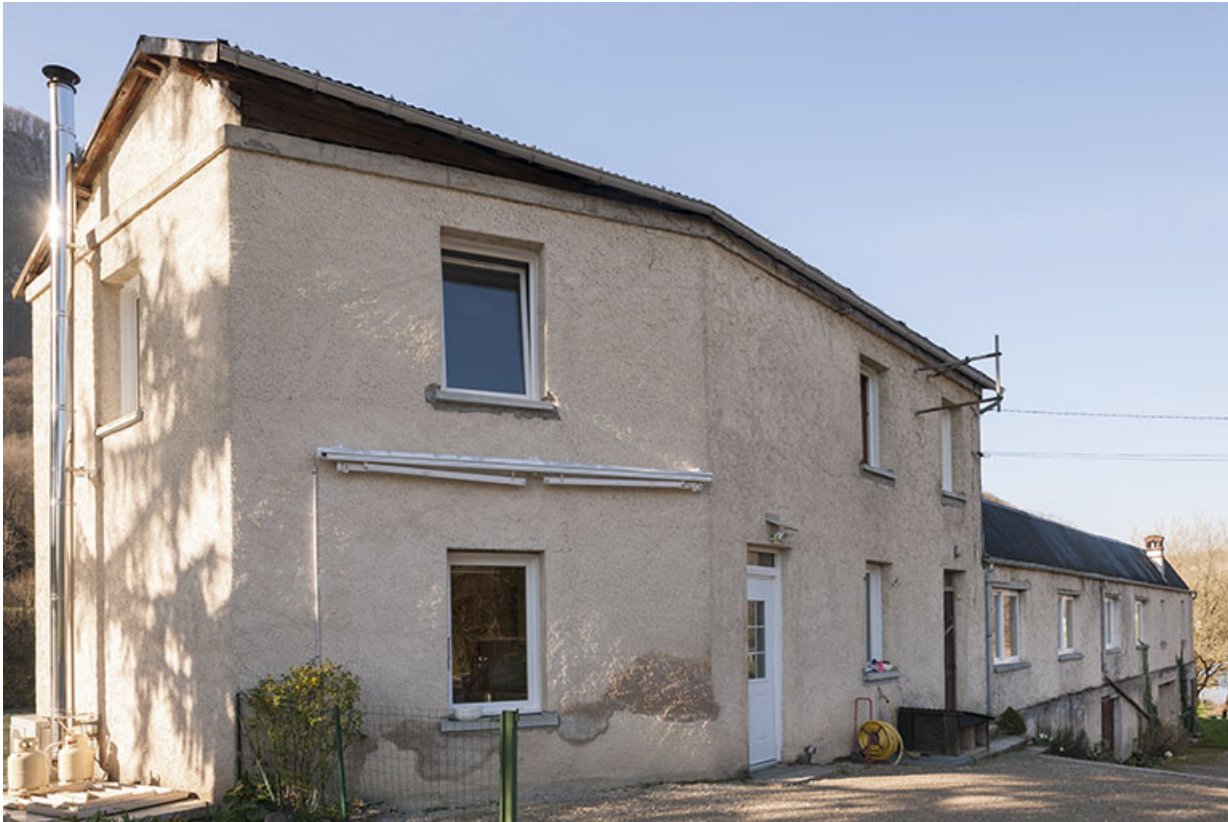
Façade nord du logement et de l'atelier.

25, Ougney-Douvot, lieudit : Ougney-les-Champs