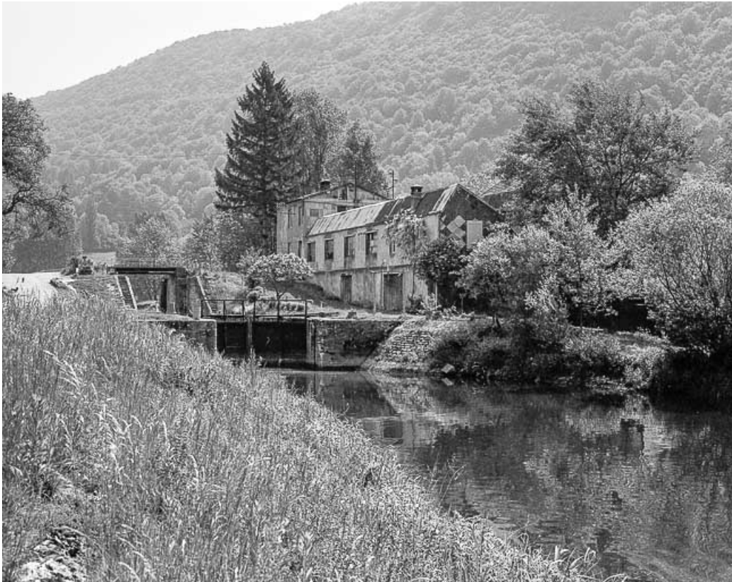
Maison d'éclusier et canal.

25, Ougney-Douvot, lieudit : Ougney-les-Champs