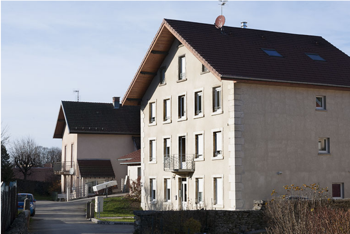
Vue d'ensemble, depuis la rue Sainte-Anne.