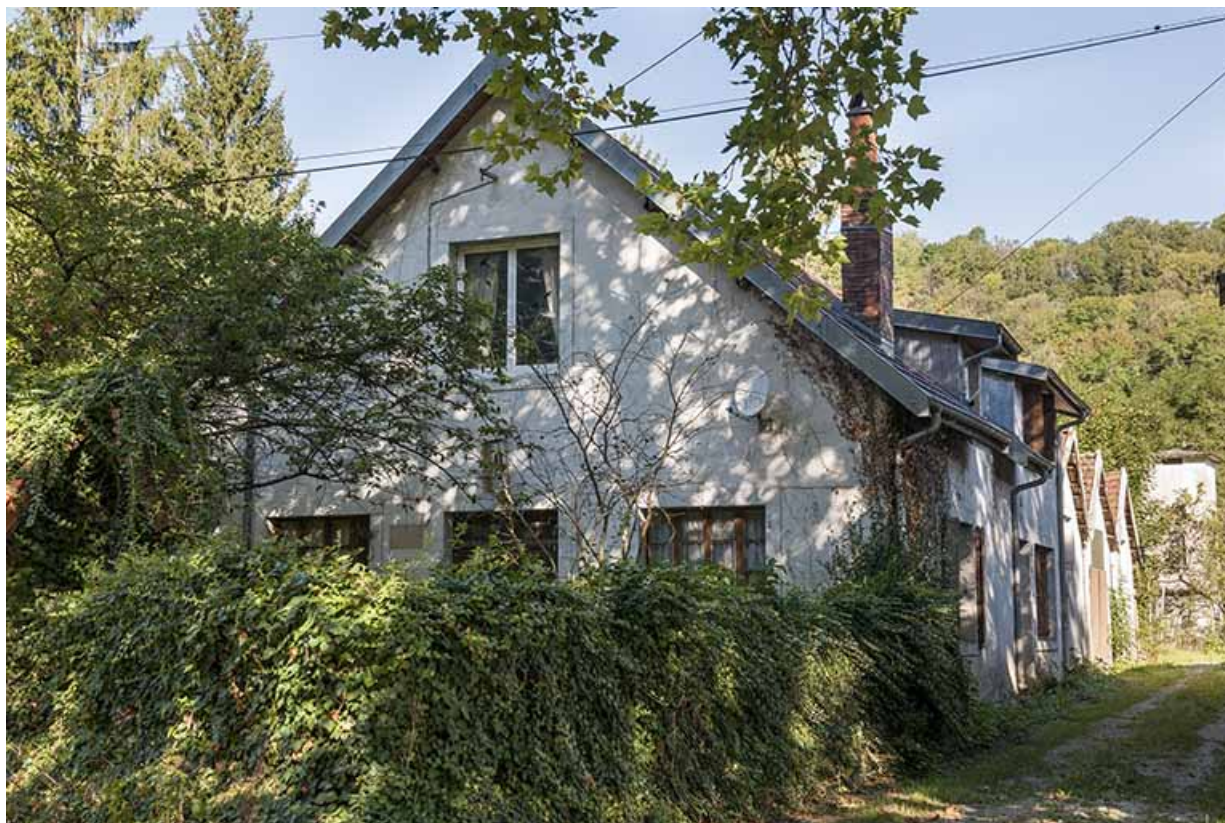
Bureau et magasin industriel. Vue depuis la route.

25, Ougney-Douvot RD 277, lieudit : Douvot