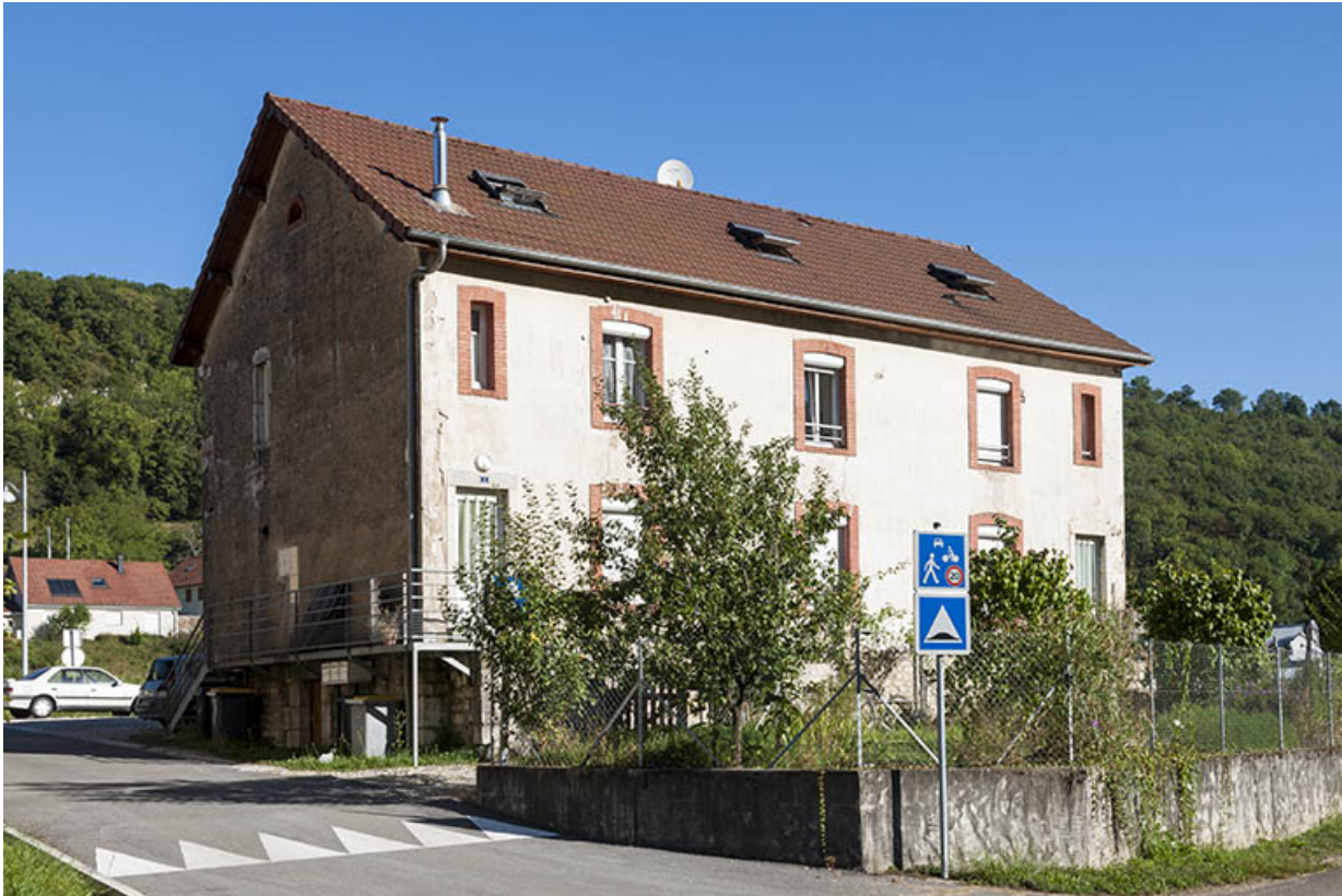
Logement ouvrier (sud) à 4 appartements. Façade est.

25, Ougney-Douvot RD 277, lieudit : Douvot