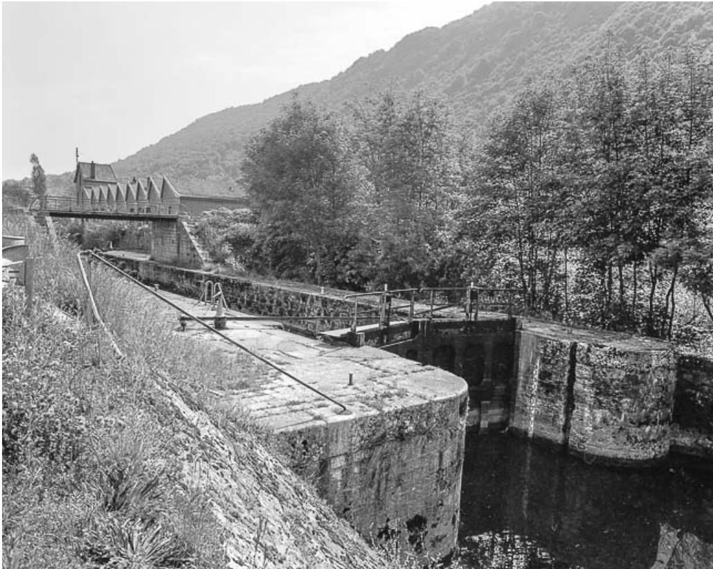
Vue de l'usine depuis l'écluse.

25, Ougney-Douvot RD 277, lieudit : Douvot