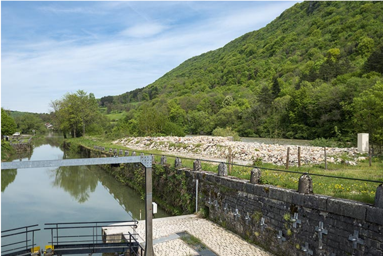
Vue d'ensemble depuis la porte aval de l'écluse (octobre 2014).

25, Ougney-Douvot RD 277, lieudit : Douvot