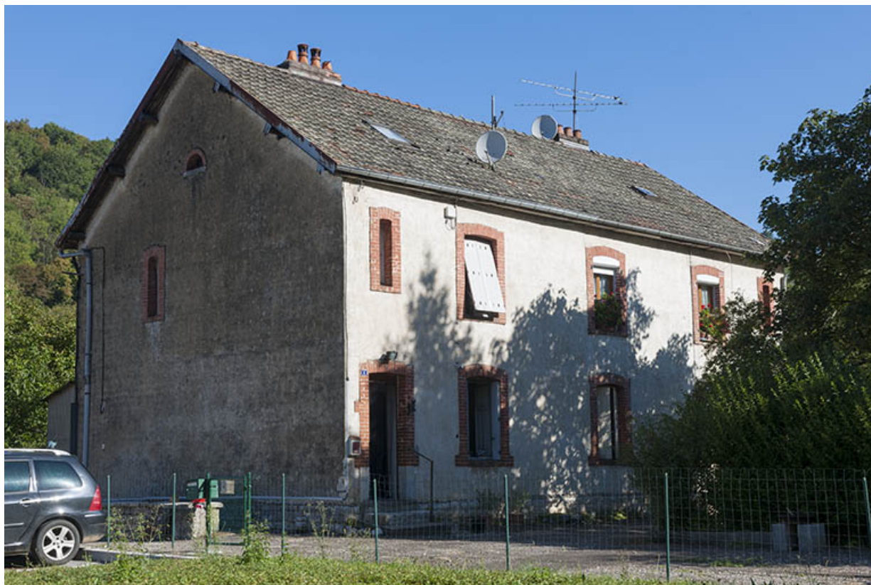
Logement ouvrier (nord) à 4 appartements. Vue depuis le sud.

25, Ougney-Douvot RD 277, lieudit : Douvot