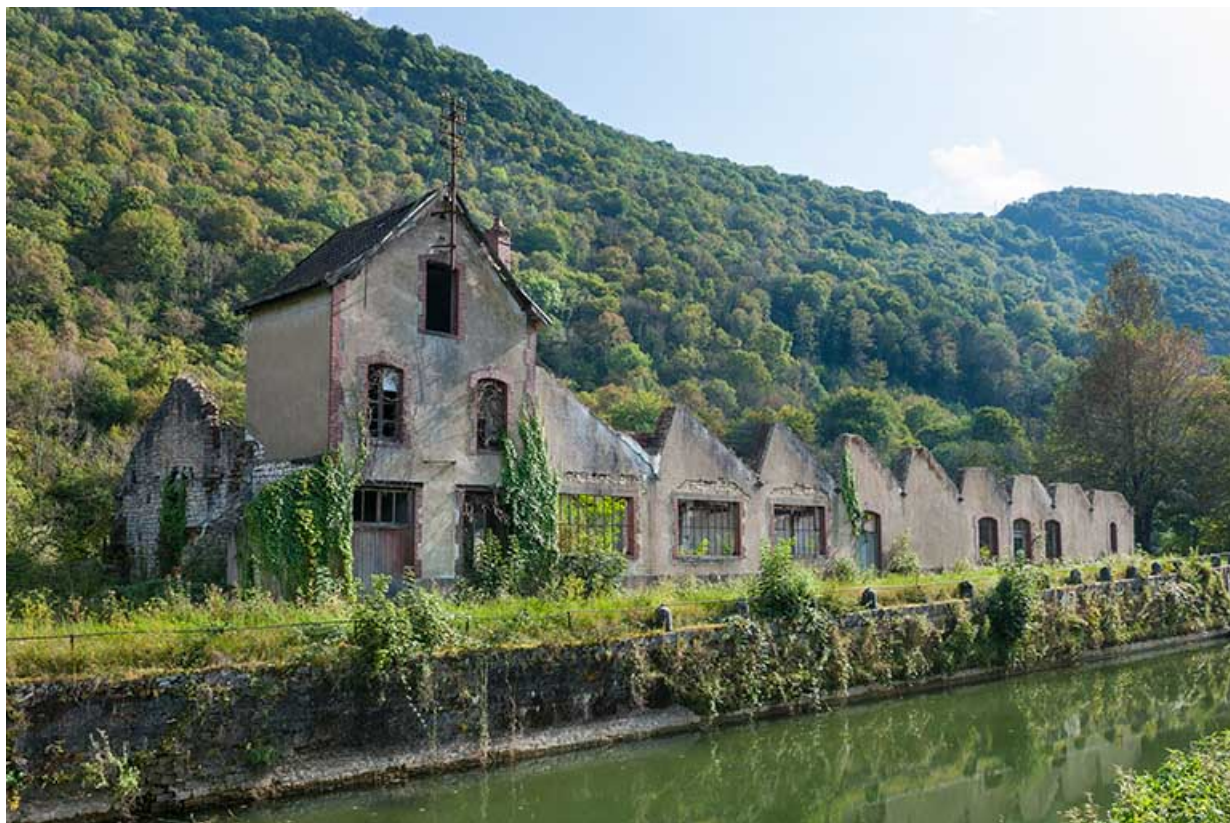
Vue d'ensemble depuis le nord.