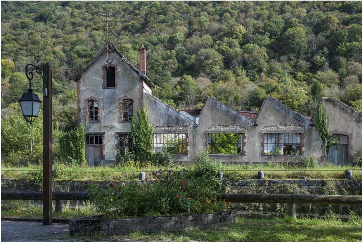
Partie nord de l'usine, depuis la route départementale.

25, Ougney-Douvot RD 277, lieudit : Douvot