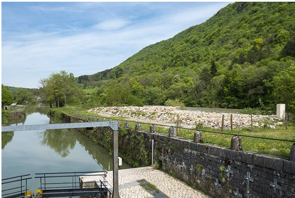
Vue d'ensemble depuis la porte aval de l'écluse (octobre 2014).

25, Ougney-Douvot RD 277, lieudit : Douvot