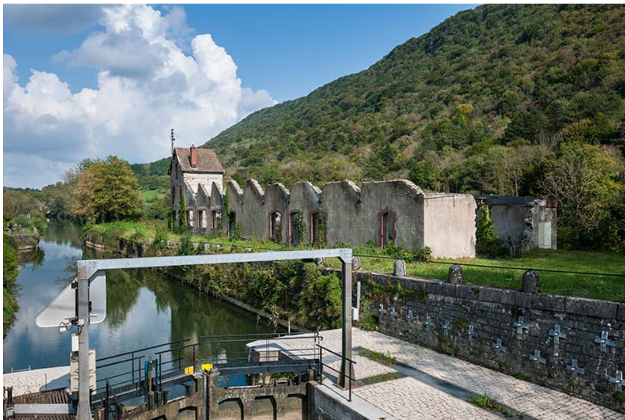
Vue d'ensemble depuis la porte aval de l'écluse.

25, Ougney-Douvot RD 277, lieudit : Douvot