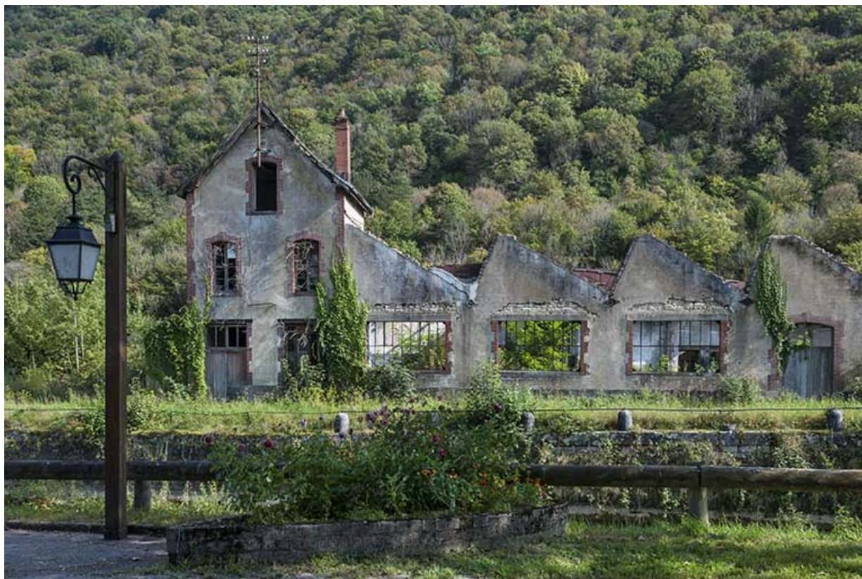
Partie nord de l'usine, depuis la route départementale.

25, Ougney-Douvot RD 277, lieudit : Douvot