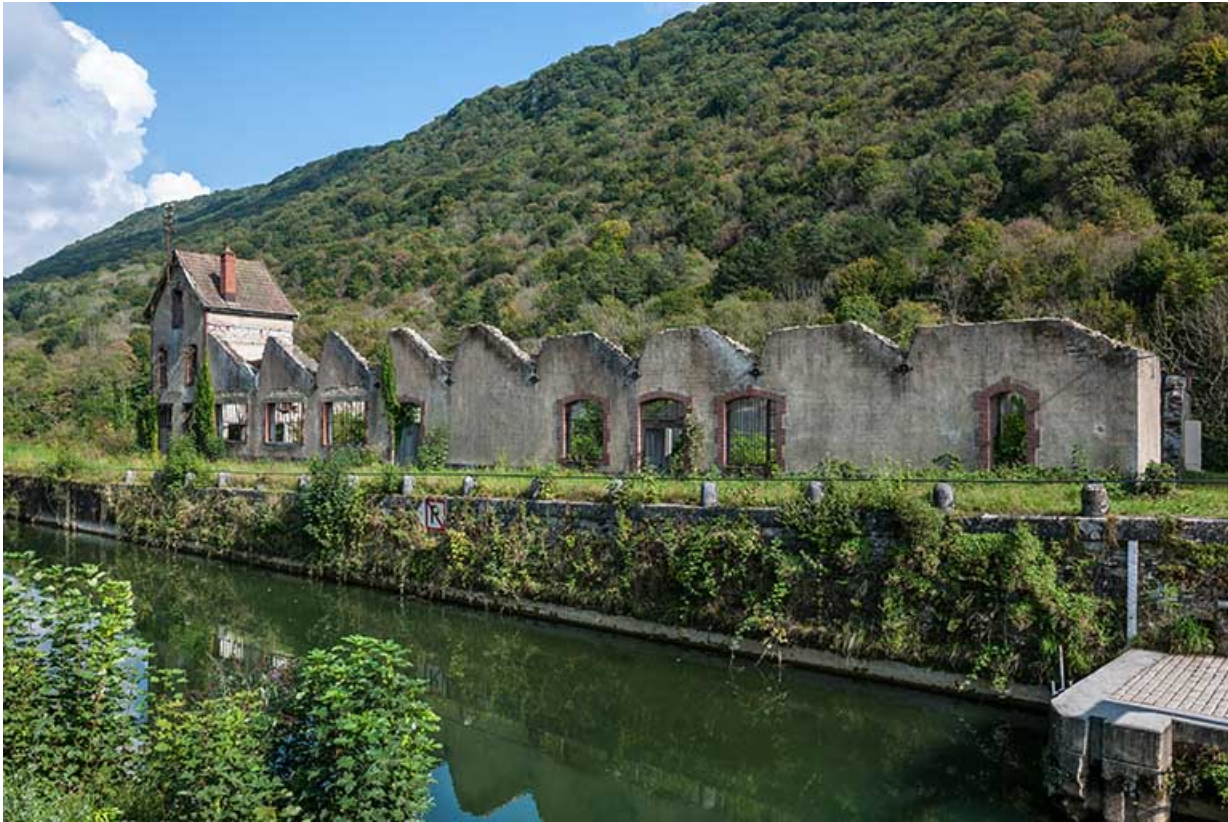
vue d'ensemble depuis l'ouest.

25, Ougney-Douvot RD 277, lieudit : Douvot