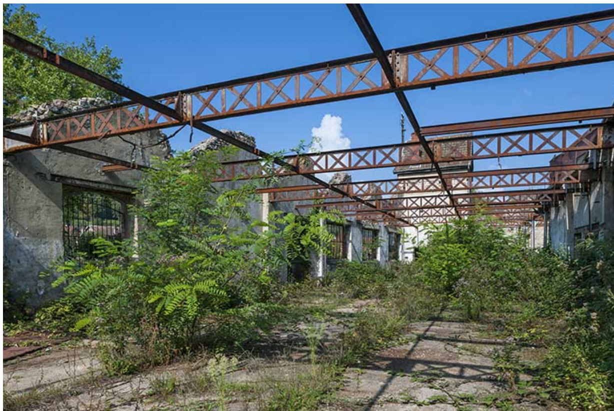
Vue Intérieure de l'atelier de fabrication.

25, Ougney-Douvot RD 277, lieudit : Douvot