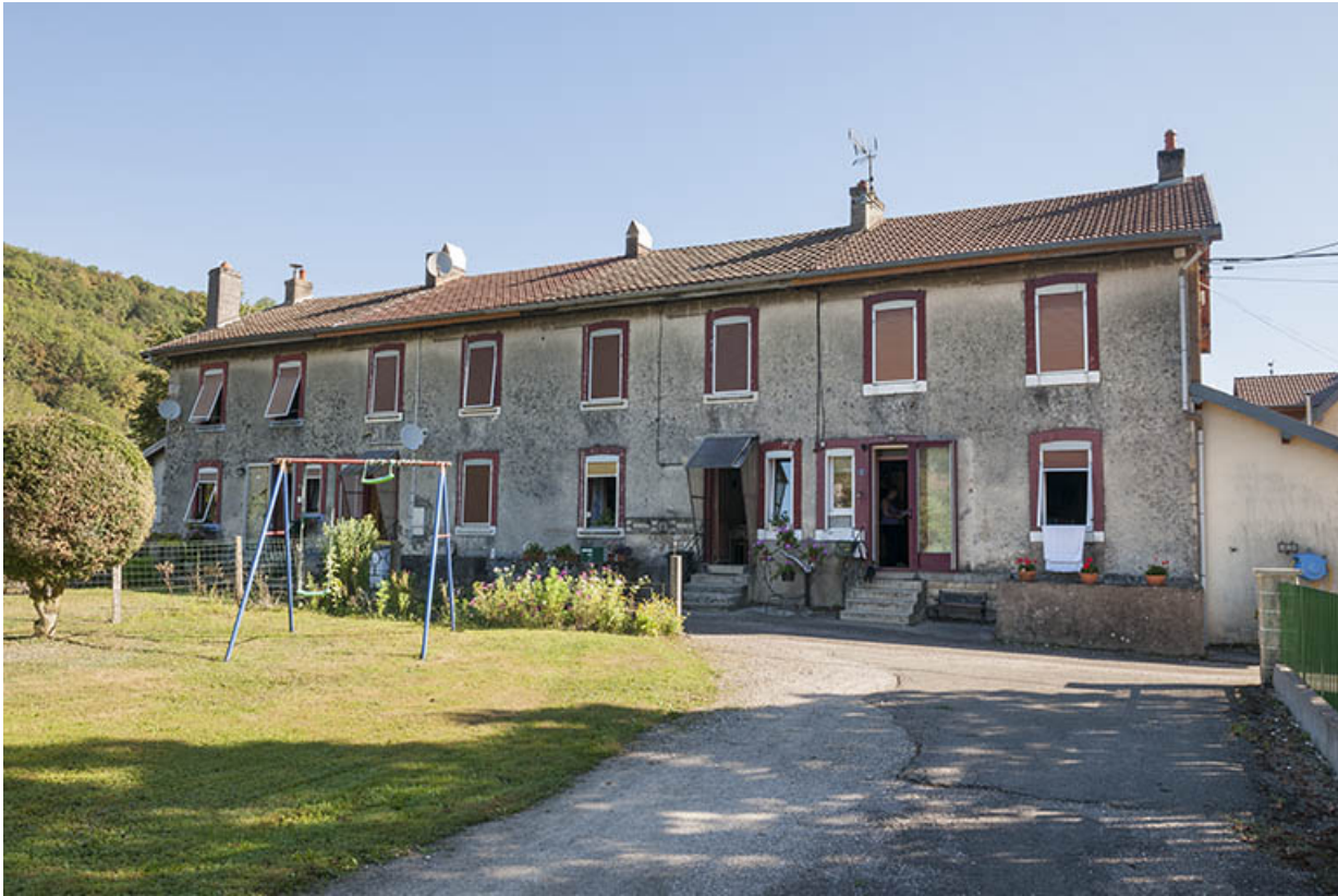
Logement ouvrier (8 appartements). Vue depuis le nord.

25, Ougney-Douvot RD 277, lieudit : Douvot