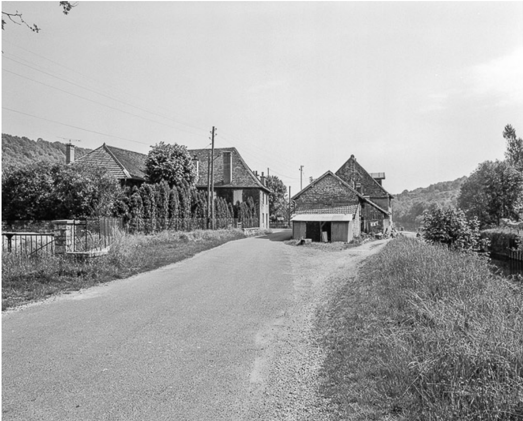
Chemin de halage le long du canal du Rhône au Rhin.

25, Ougney-Douvot RD 277, lieudit : Douvot