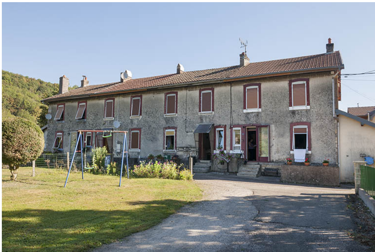
Logement ouvrier (8 appartements). Vue depuis le nord.

25, Ougney-Douvot RD 277, lieudit : Douvot