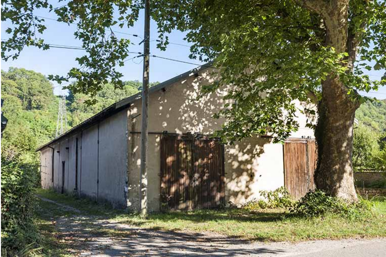
Magasin industriel vu depuis la route.

25, Ougney-Douvot RD 277, lieudit : Douvot