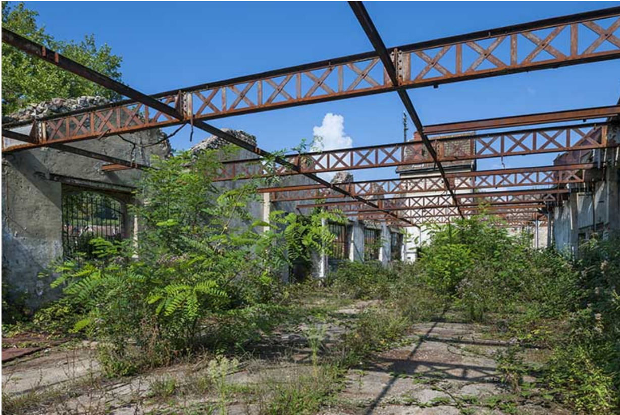
Vue Intérieure de l'atelier de fabrication.

25, Ougney-Douvot RD 277, lieudit : Douvot