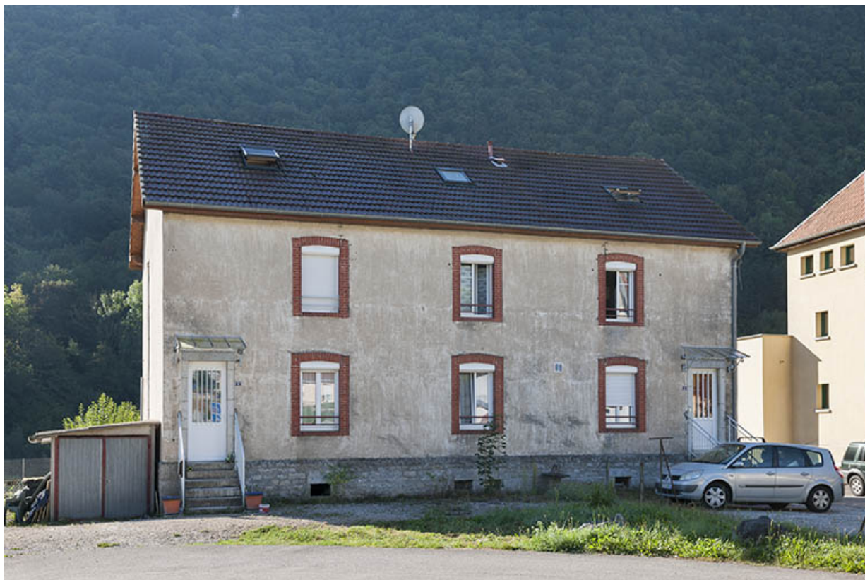
Logement ouvrier (sud) à 4 appartements. Façade ouest.

25, Ougney-Douvot RD 277, lieudit : Douvot