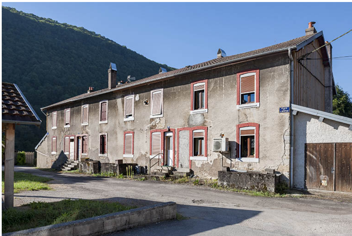
Logement ouvrier (8 appartements). Vue depuis le sud.

25, Ougney-Douvot RD 277, lieudit : Douvot