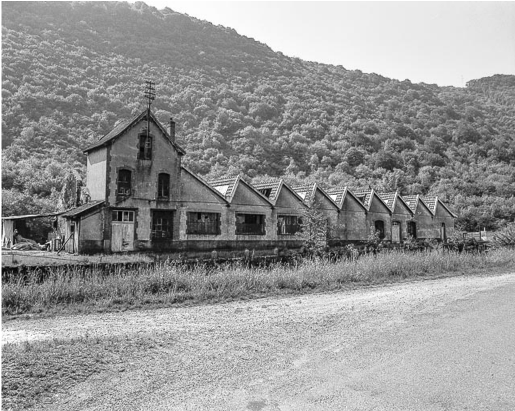
Vue d'ensemble depuis la route départementale.

25, Ougney-Douvot RD 277, lieudit : Douvot