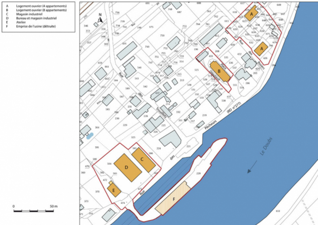
Plan-masse et de situation. Extrait du plan cadastral, 2015, section D. 25, Ougney-Douvot RD 277, lieudit : Douvot