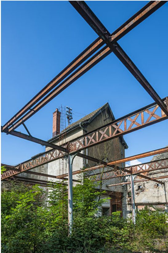
Charpente métallique de l'atelier de fabrication.

25, Ougney-Douvot RD 277, lieudit : Douvot