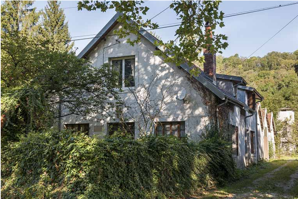
Bureau et magasin industriel. Vue depuis la route.

25, Ougney-Douvot RD 277, lieudit : Douvot