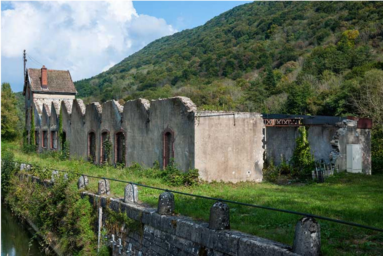
Façade ouest depuis la porte aval de l'écluse.

25, Ougney-Douvot RD 277, lieudit : Douvot