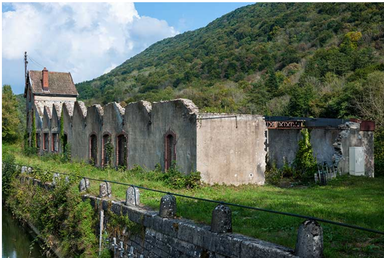
Façade ouest depuis la porte aval de l'écluse.

25, Ougney-Douvot RD 277, lieudit : Douvot