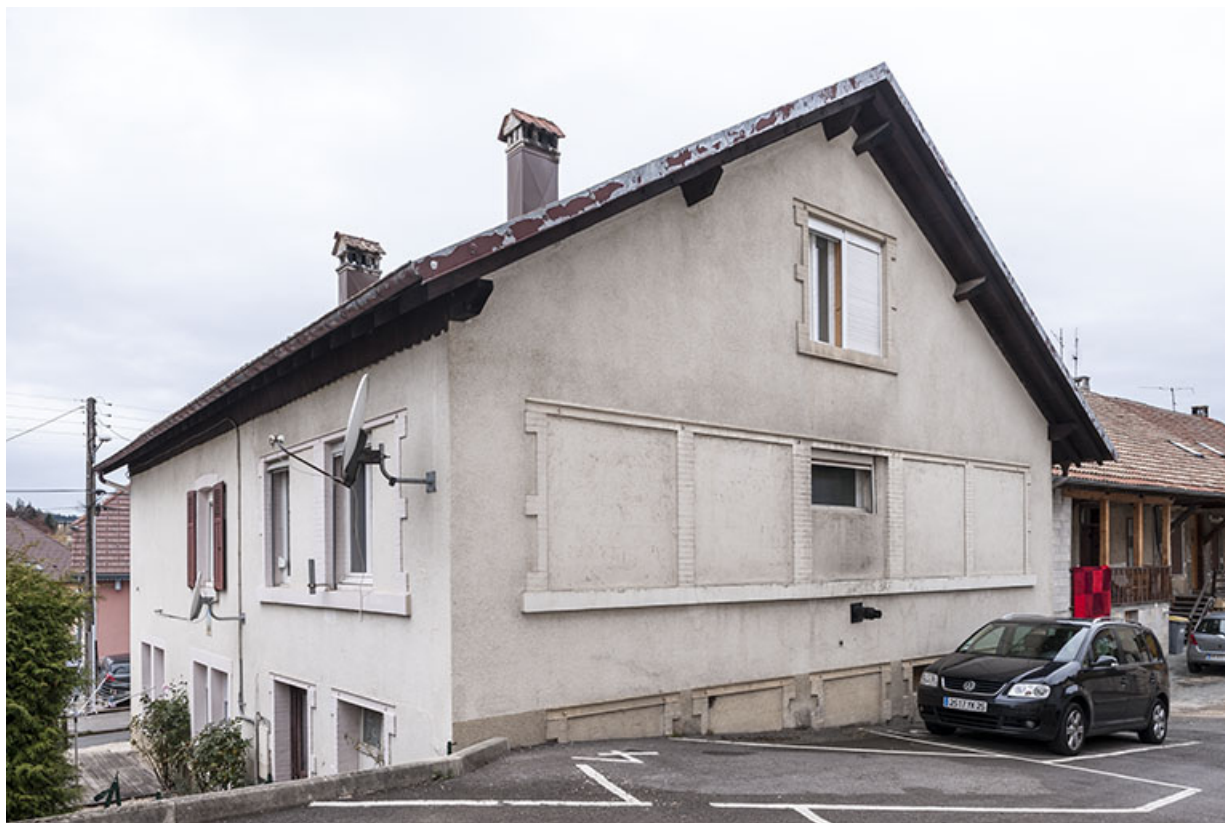
Maison : façades postérieure et latérale droite.