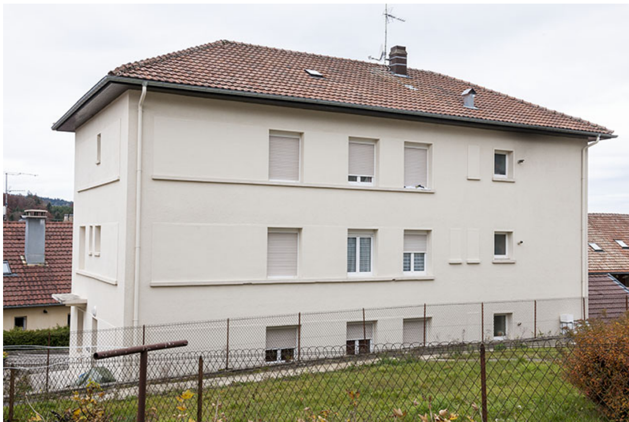
Usine : façades postérieure et latérale droite.