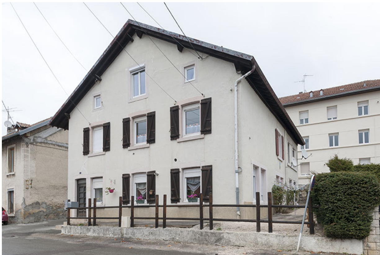
Maison : façades antérieure et latérale droite.