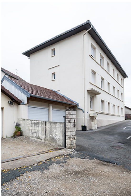
Usine : façades antérieure et latérale gauche. 25, Maîche, 6 et 6 B rue du Belvédère