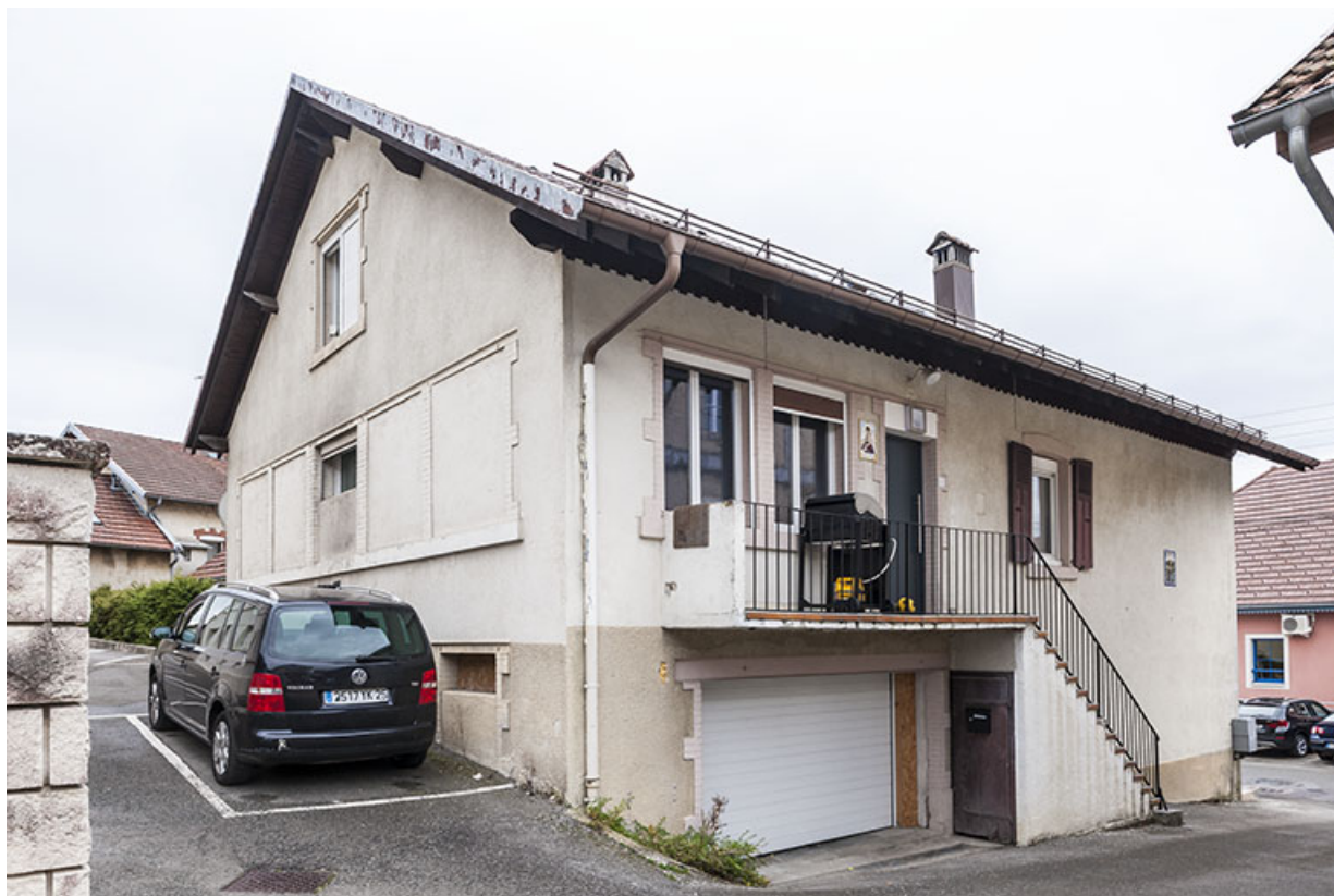
Maison : façades postérieure et latérale gauche.