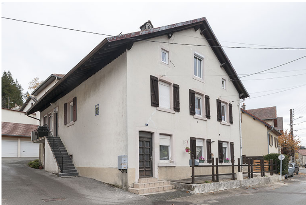
Maison : façades antérieure et latérale gauche.