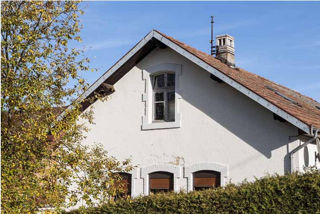
Atelier de fabrication : façade latérale droite.