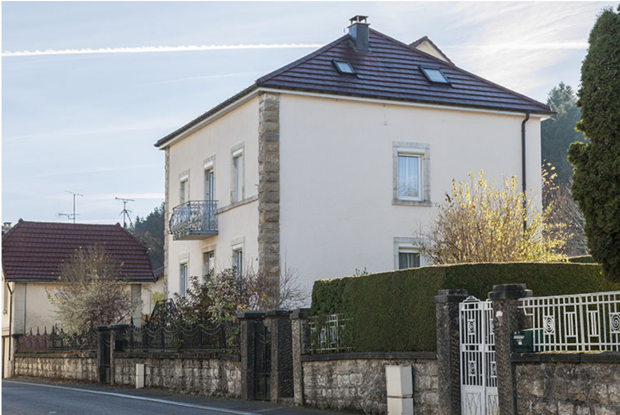
Maison au n° 16 : façades antérieure et latérale droite.