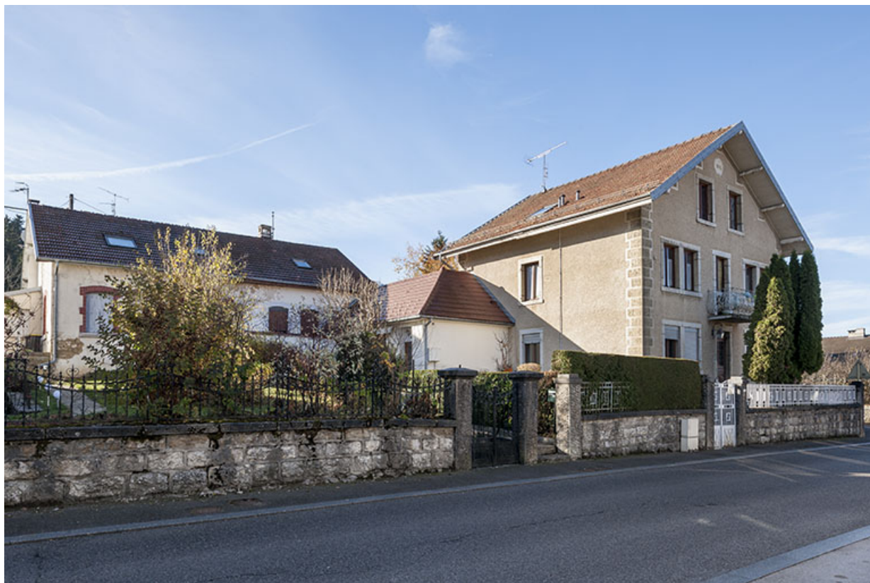
Maison au n° 14 et atelier de fabrication.