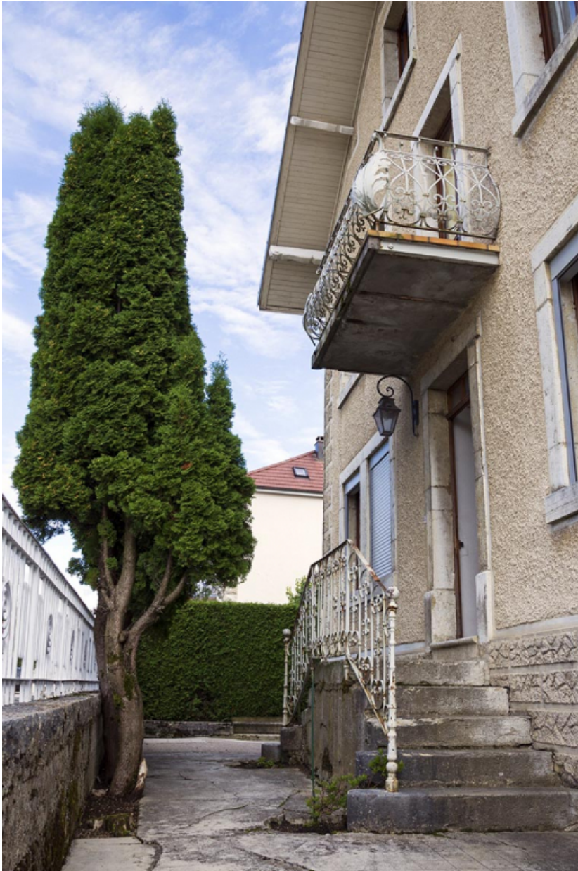
Maison au n° 14, façade antérieure : escalier et balcon, vus en enfilade.