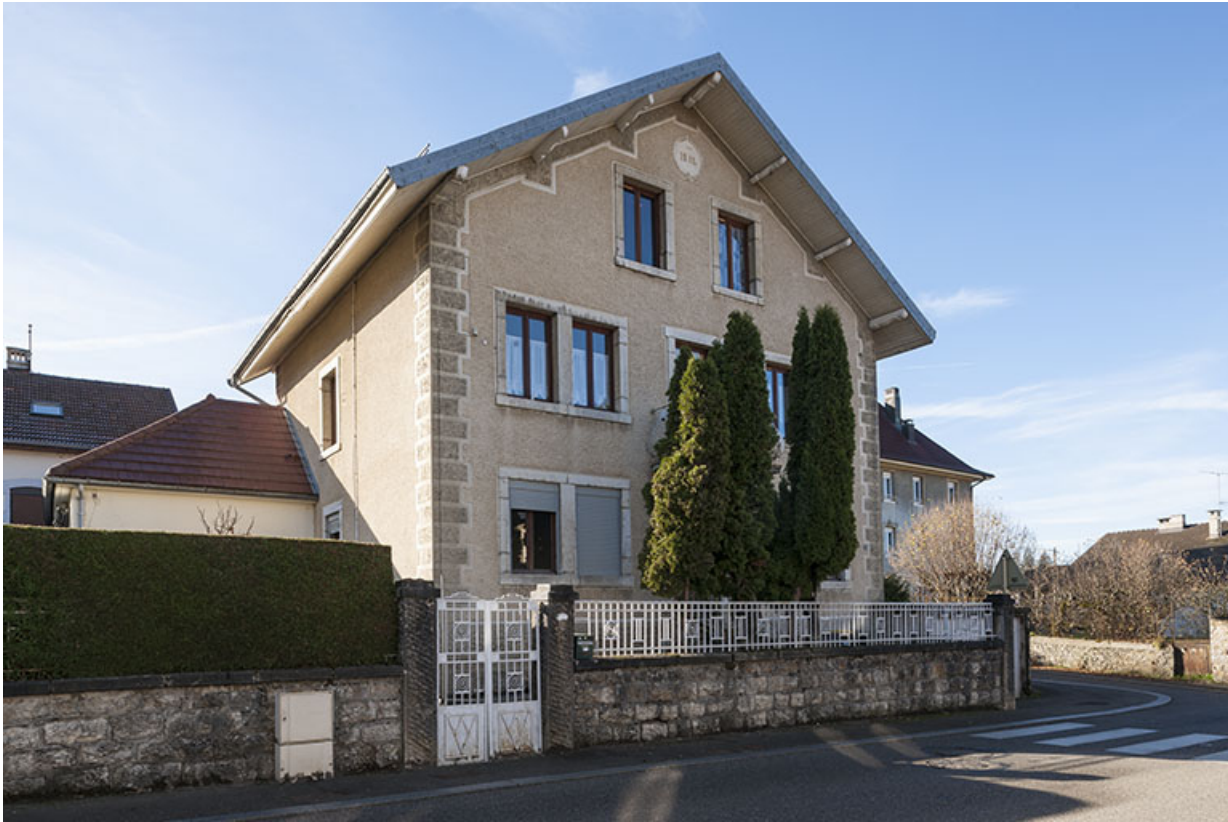
Maison au n° 14 : façades antérieure et latérale gauche.