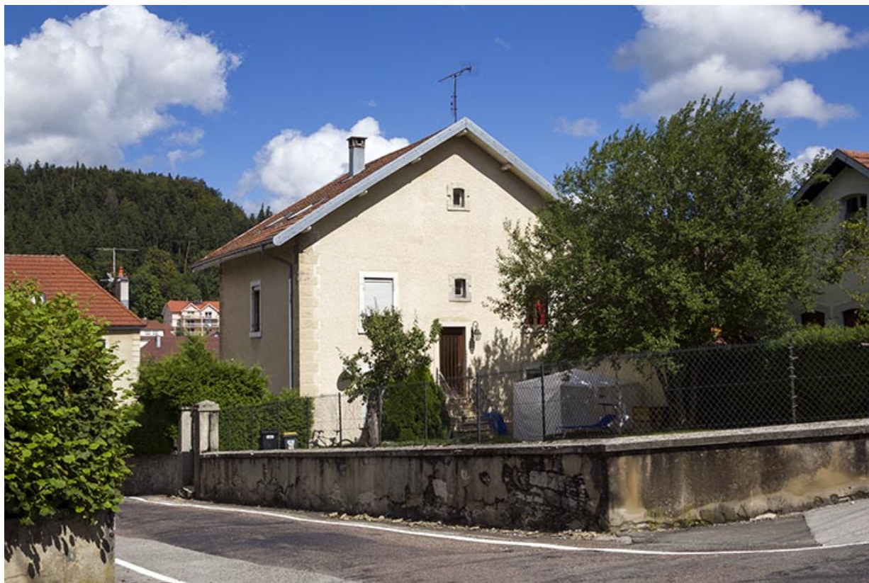
Maison au n° 14 : façades postérieure et latérale droite.