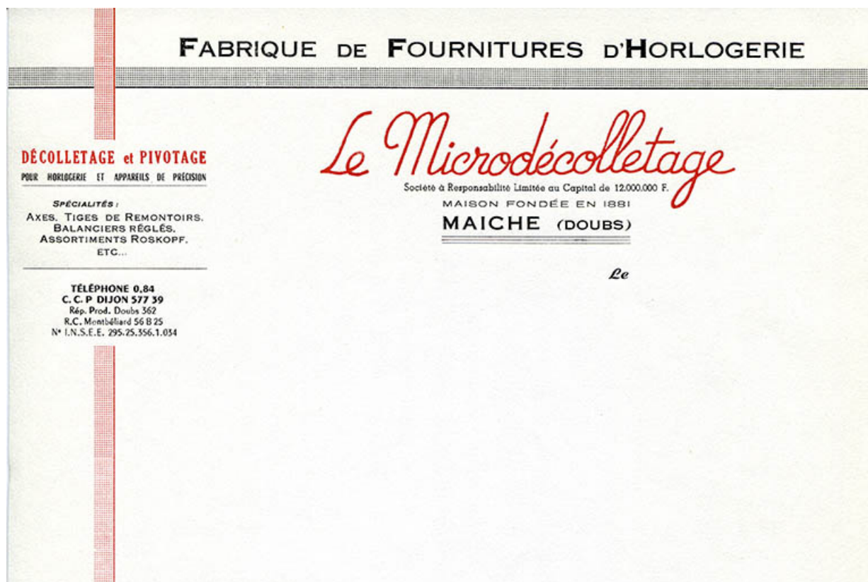
Papier à en-tête de la société Le Microdécolletage, 3e quart 20e siècle (entre 1945 et 1960). 25, Maîche, 14 et 16 rue de l' Helvétie