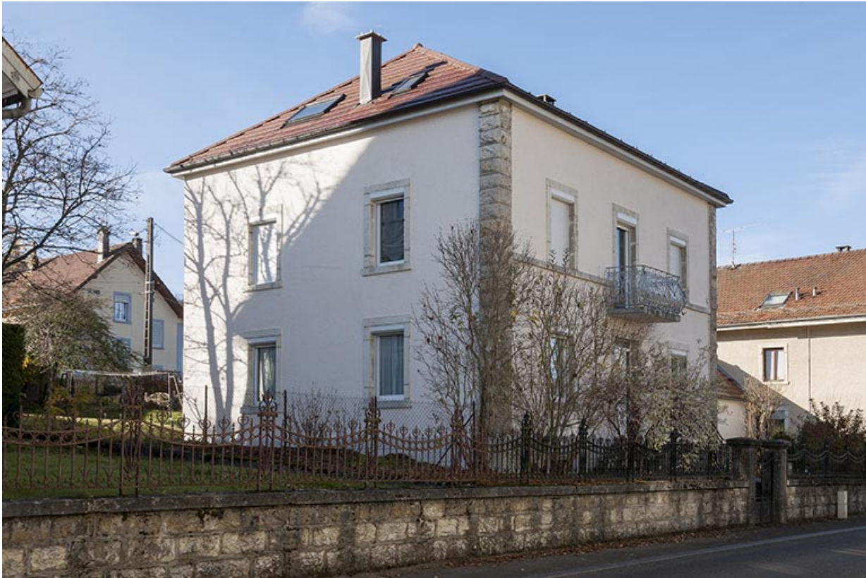
Maison au n° 16 : façades antérieure et latérale gauche.