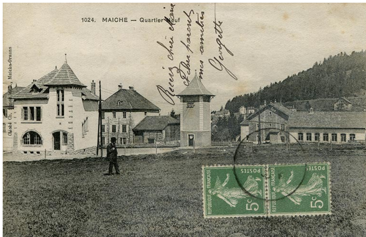
1024. Maïche - Quartier Neuf, 1912 ou 1913.