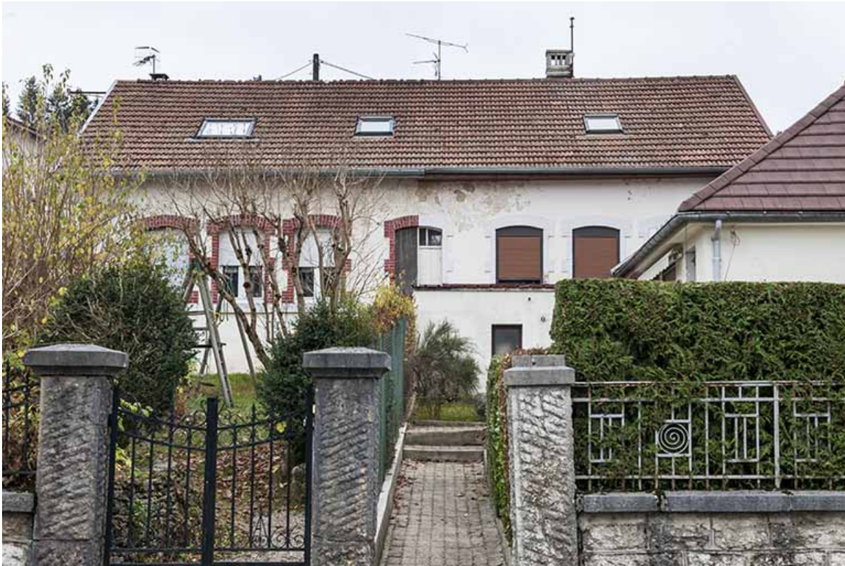
Atelier de fabrication : façade antérieure.