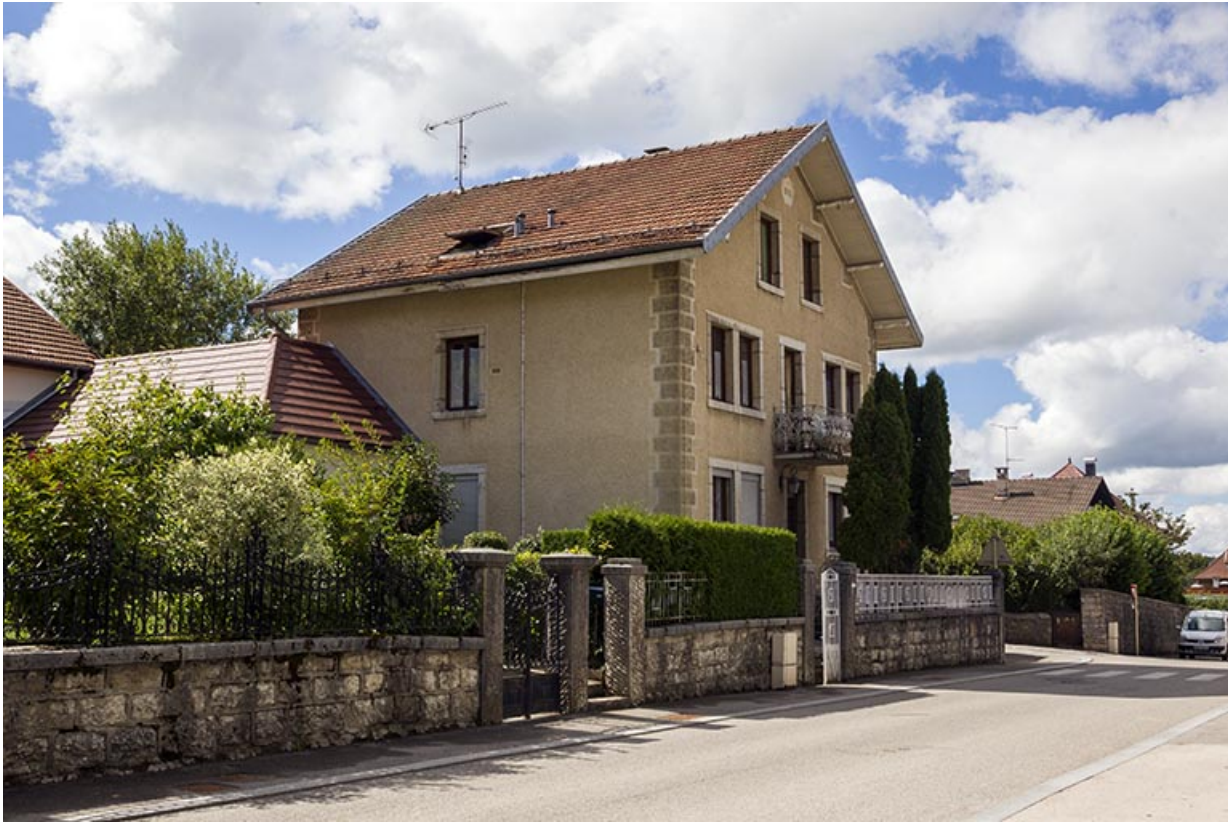
Maison au n° 14 : façades antérieure et latérale gauche (vue éloignée).