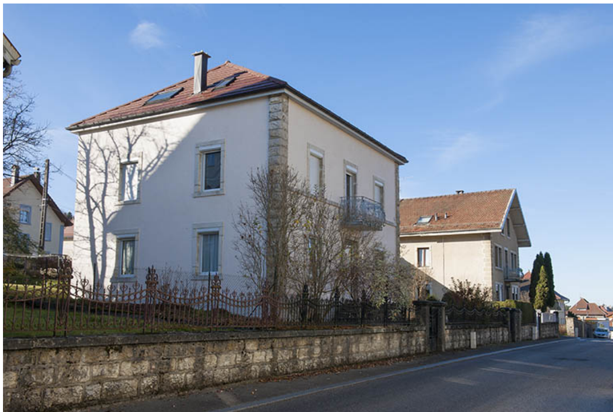
Vue d'ensemble du site, depuis l'est.