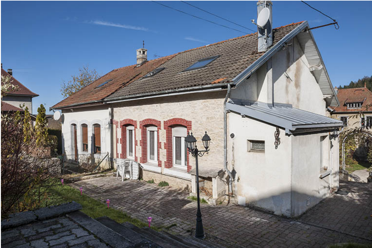
Atelier de fabrication : façades postérieure et latérale gauche.