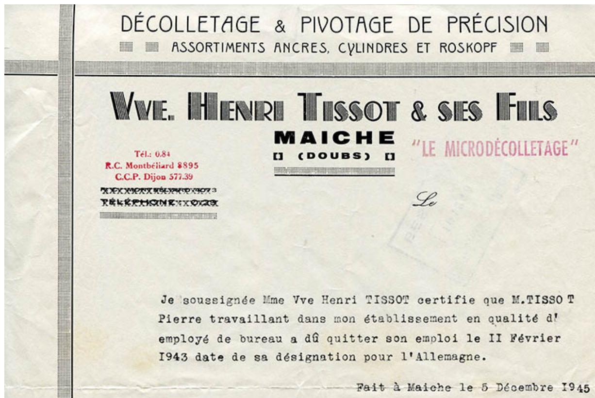
Papier à en-tête de la société Veuve Henri Tissot et ses Fils "Le Microdécolletage", 5 décembre 1945. 25, Maiche, 14 et 16 rue de l' Helvétie