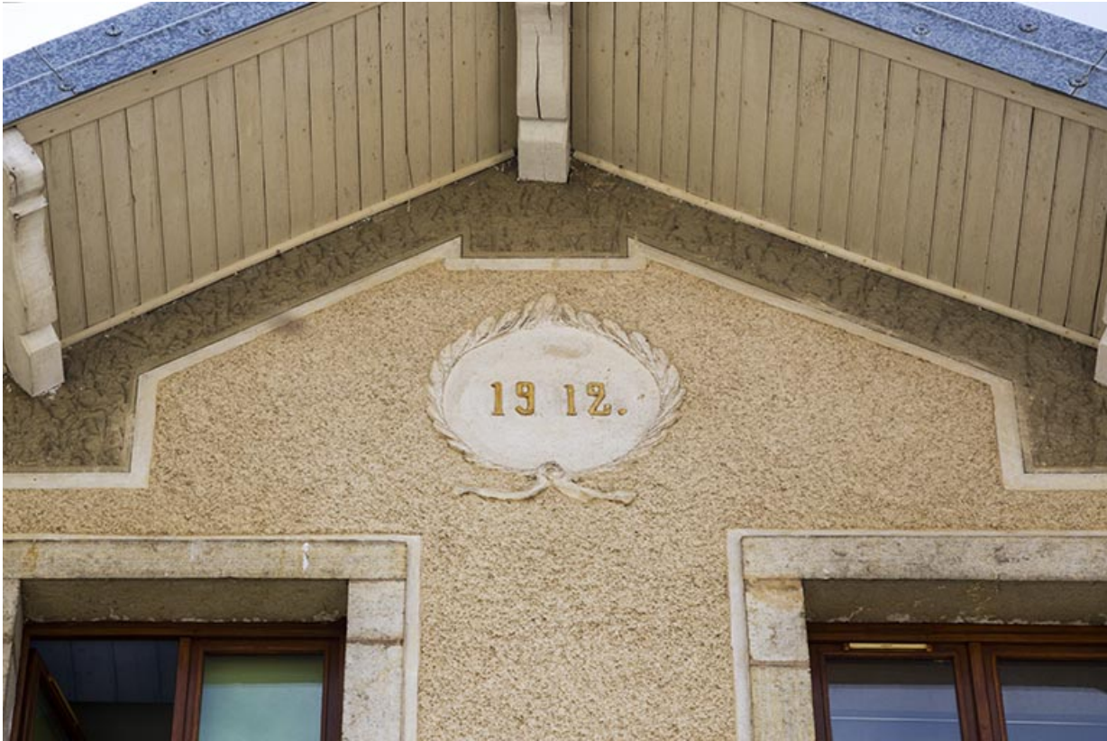
Maison au n° 14, façade antérieure : date sur le pignon.