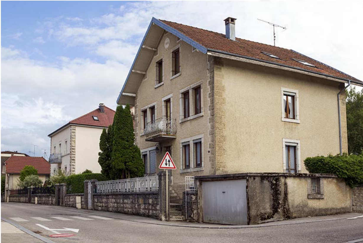
Vue d'ensemble du site, depuis l'ouest.