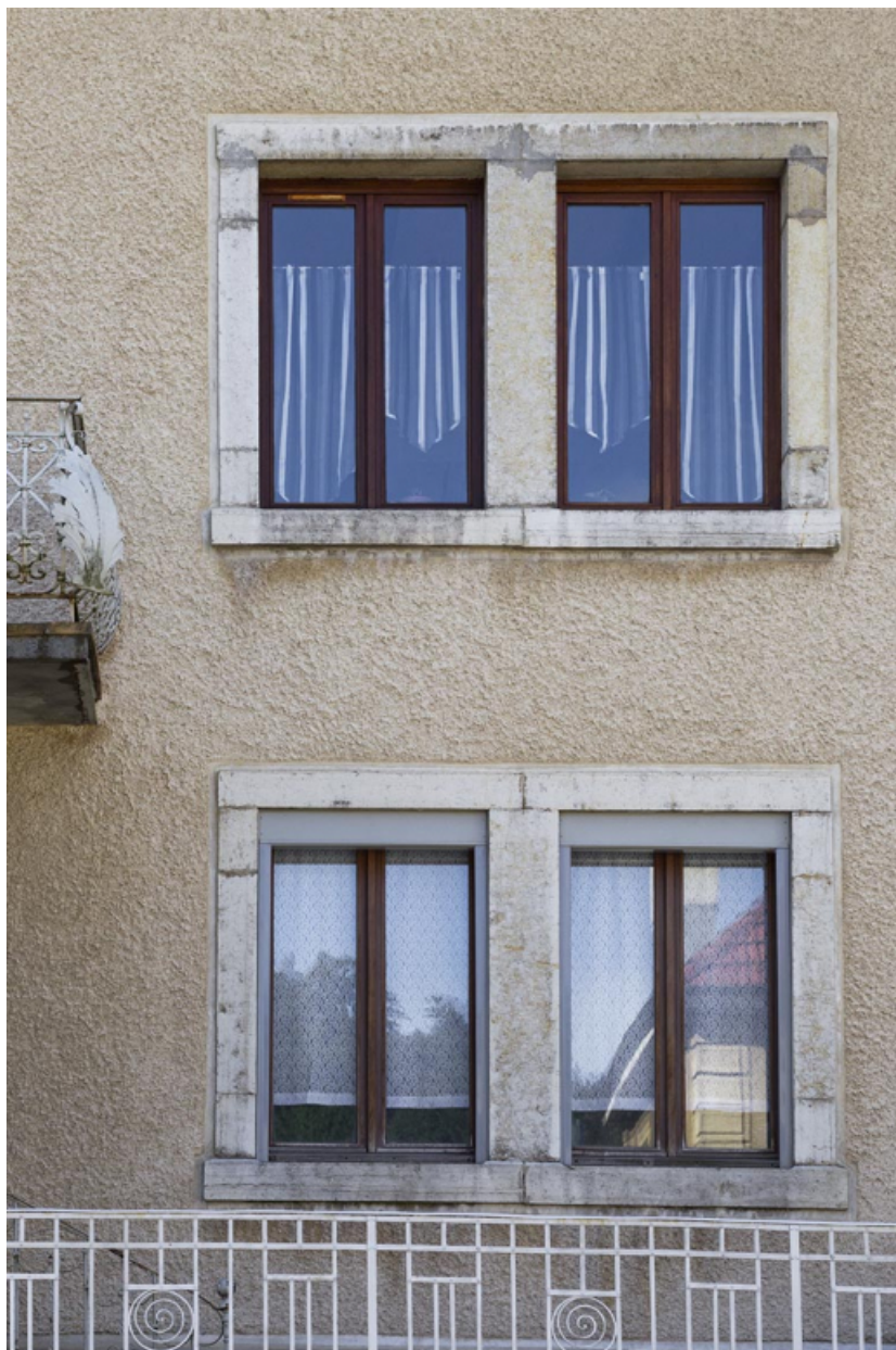
Maison au n° 14, façade antérieure : fenêtres horlogères.