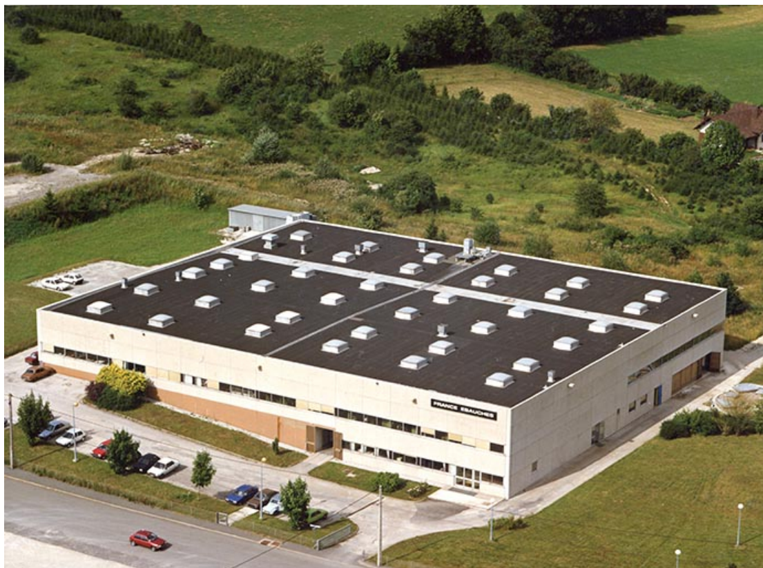
Vue aérienne de l'usine, entre 1981 et 1995. 25, Maîche, 2 rue Henri Rotschi