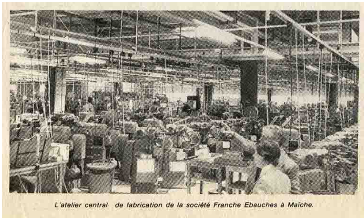
L'atelier central de fabrication de la société France Ebauches à Maïche, mai 1981.