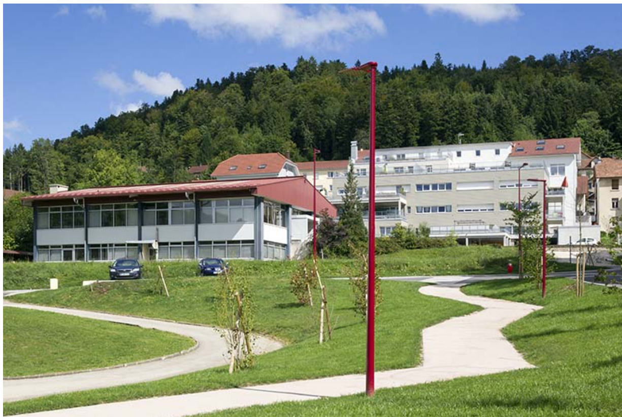
Vue d'ensemble, depuis le sud-ouest.