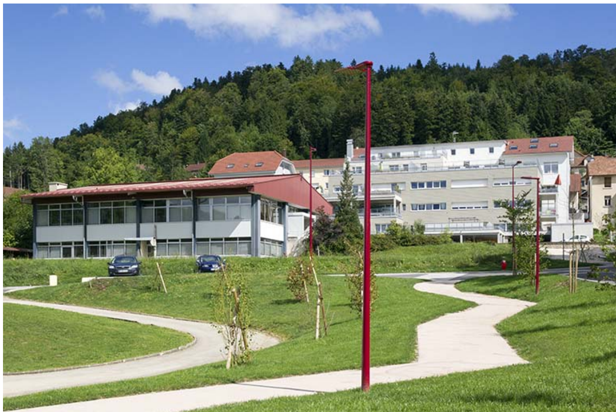
Vue d'ensemble, depuis le sud-ouest.