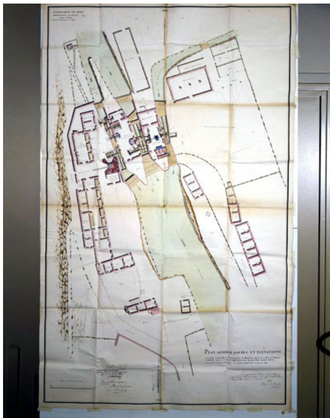
Plan de détail de l'usine en 1821.