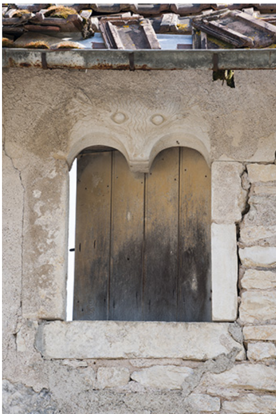
Détail d'une fenêtre du premier étage. 25, Moncley rue du Moulin