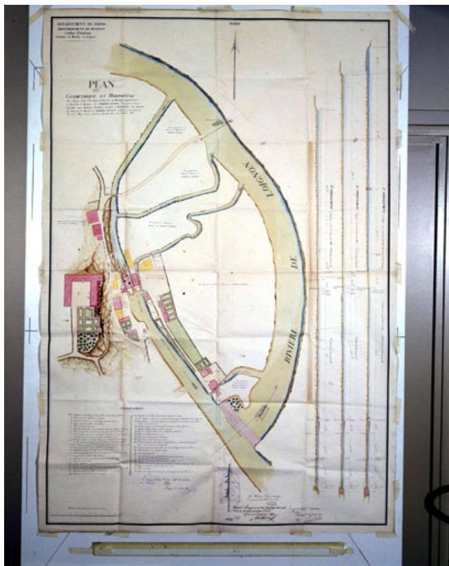
Plan général de l'usine en 1821.