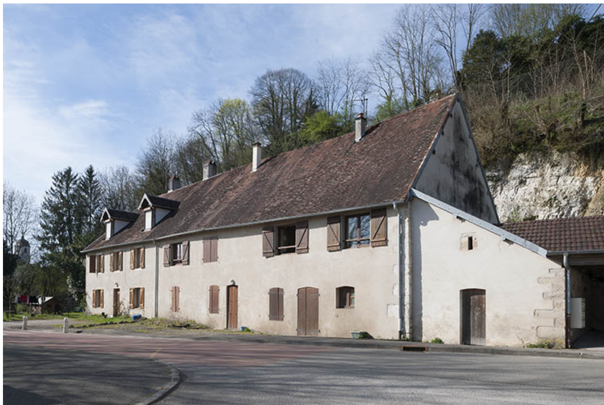
Logement ouvrier (11-13 route d'Emagny). 25, Moncley rue du Moulin