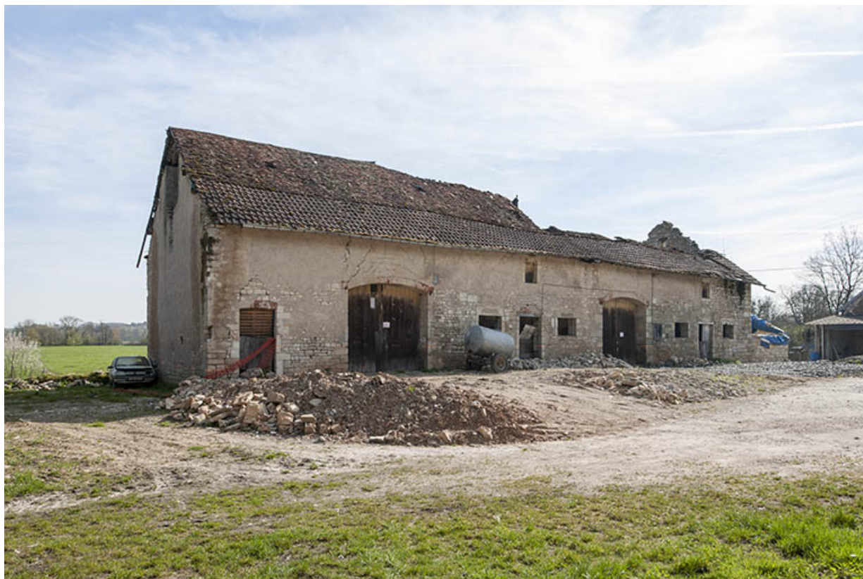
Bâtiment agricole vu de trois quarts gauche. 25, Moncley rue du Moulin