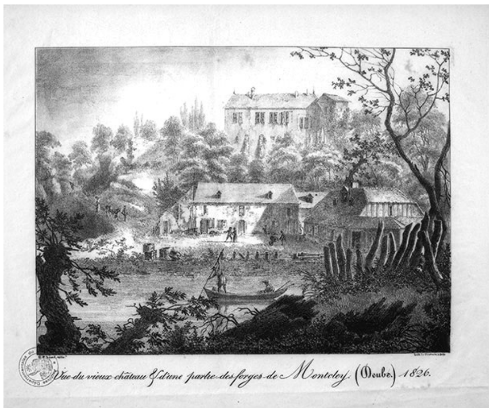
Vue du vieux château et d'une partie des forges de Montcley (Doubs), 1826.