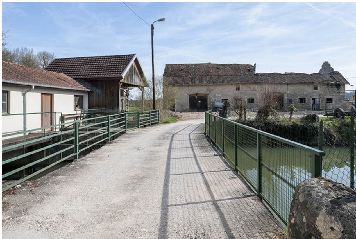
Centrale hydroélectrique (à gauche) et bâtiment agricole. 25, Moncley rue du Moulin