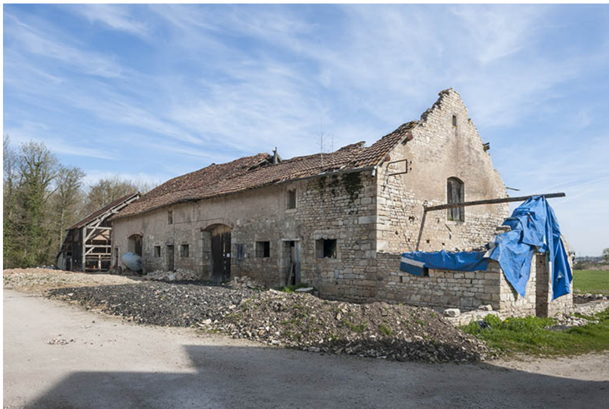
Bâtiment agricole vu de trois quarts droite. 25, Moncley rue du Moulin