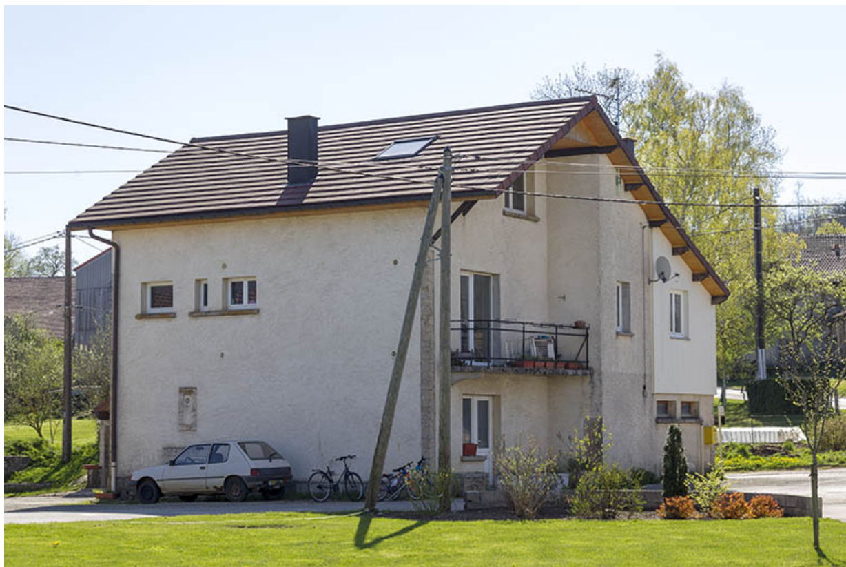
Vue d'ensemble, depuis l'ouest (façades antérieure et latérale gauche).

25, Belleherbe, 1 rue de la Fontaine, lieudit : Ebey