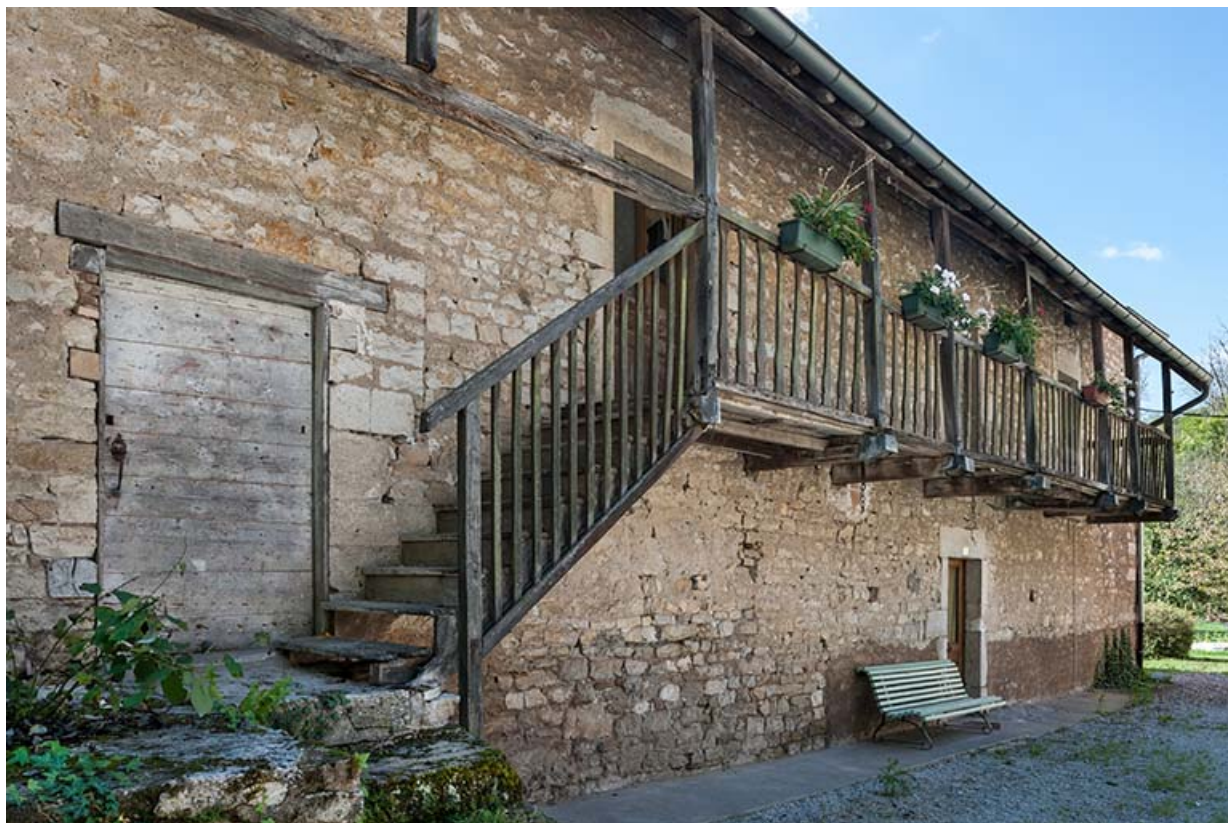
Détail de la façade nord du logement patronal.

25, Montagney-Servigney rue du Haut fourneau