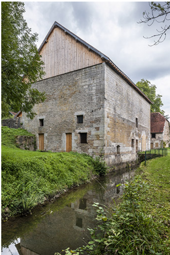
Canal de fuite longeant la façade sud du bâtiment du haut fourneau.

25, Montagney-Servigney rue du Haut fourneau