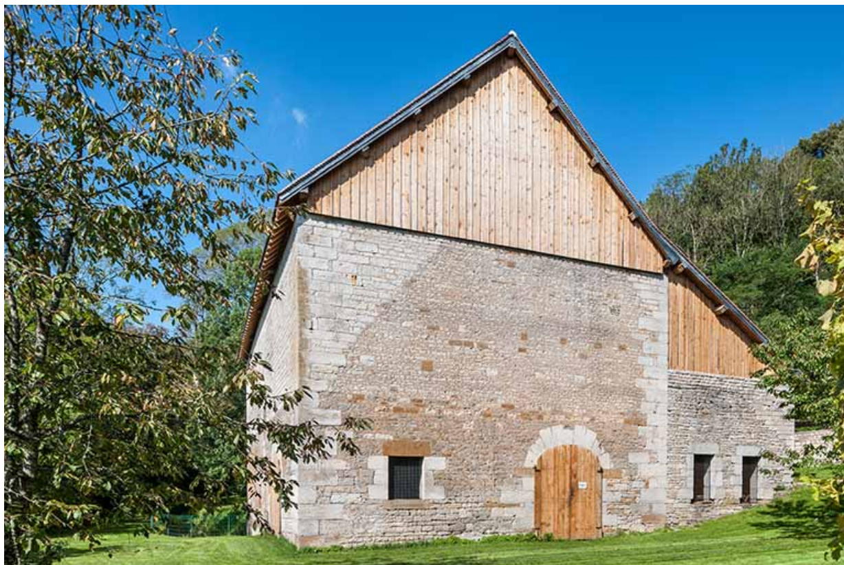
Pignon est du bâtiment du haut fourneau.

25, Montagney-Servigney rue du Haut fourneau