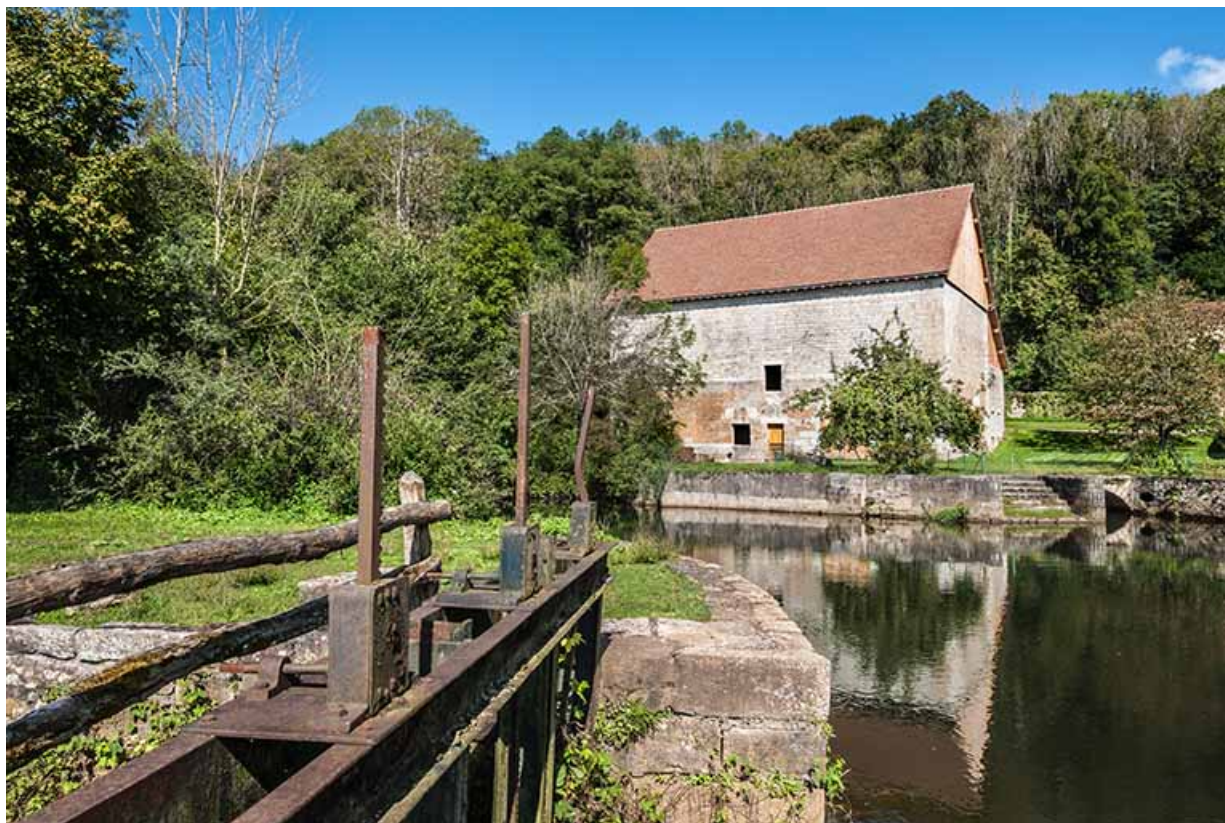
Bâtiment du haut fourneau depuis le vannage de l'ancien atelier de forge.

25, Montagney-Servigney rue du Haut fourneau