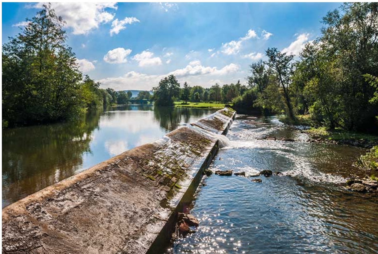
Vue d'ensemble du barrage depuis la rive droite.

25, Montagney-Servigney rue du Haut fourneau