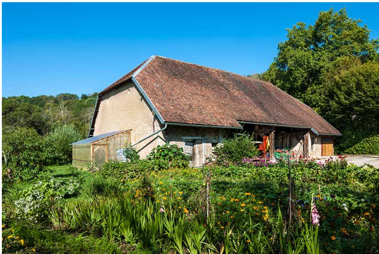
Vue du magasin industriel depuis le sud-est. 25, Montagney-Servigny rue du Haut fourneau