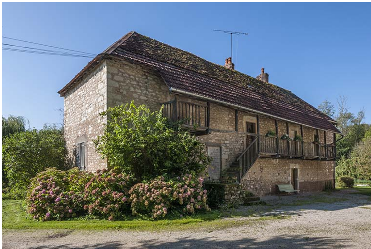
Logement patronal. Vue de trois quarts droite.

25, Montagney-Servigney rue du Haut fourneau