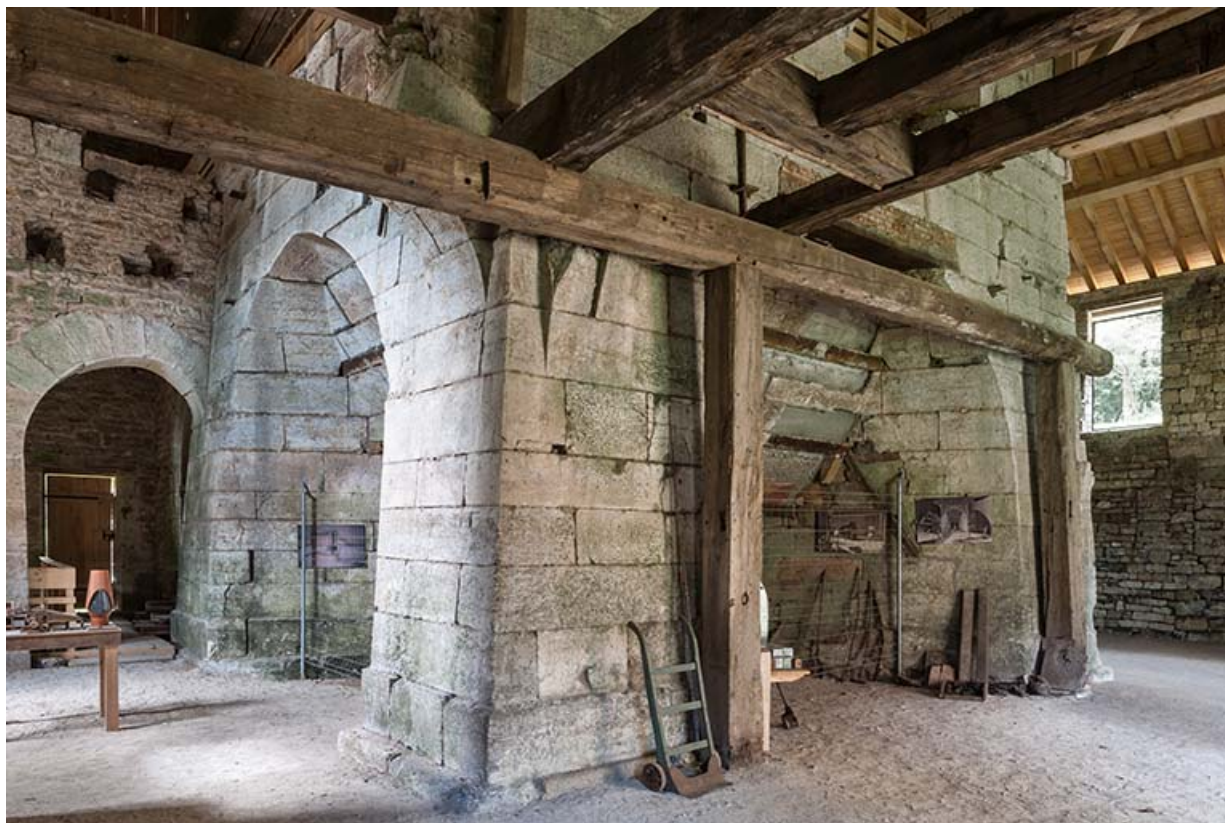
Haut fourneau. Vue rapprochée de trois quarts.

25, Montagney-Servigney rue du Haut fourneau