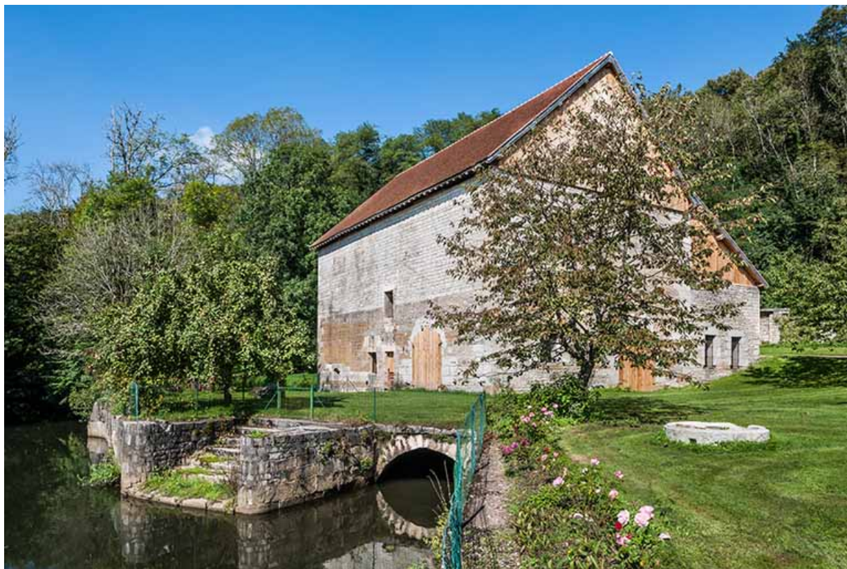
Bâtiment du haut fourneau depuis le sud-est. 25, Montagney-Servigny rue du Haut fourneau