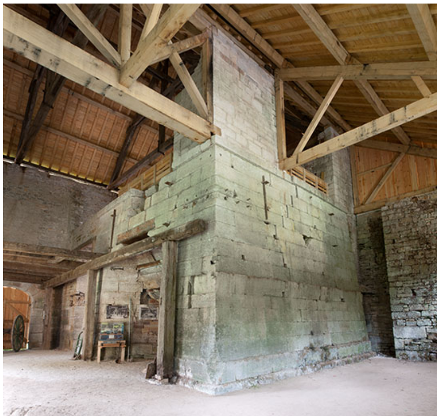
Massif du haut fourneau, vu de trois quarts. 25, Montagney-Servigney rue du Haut fourneau