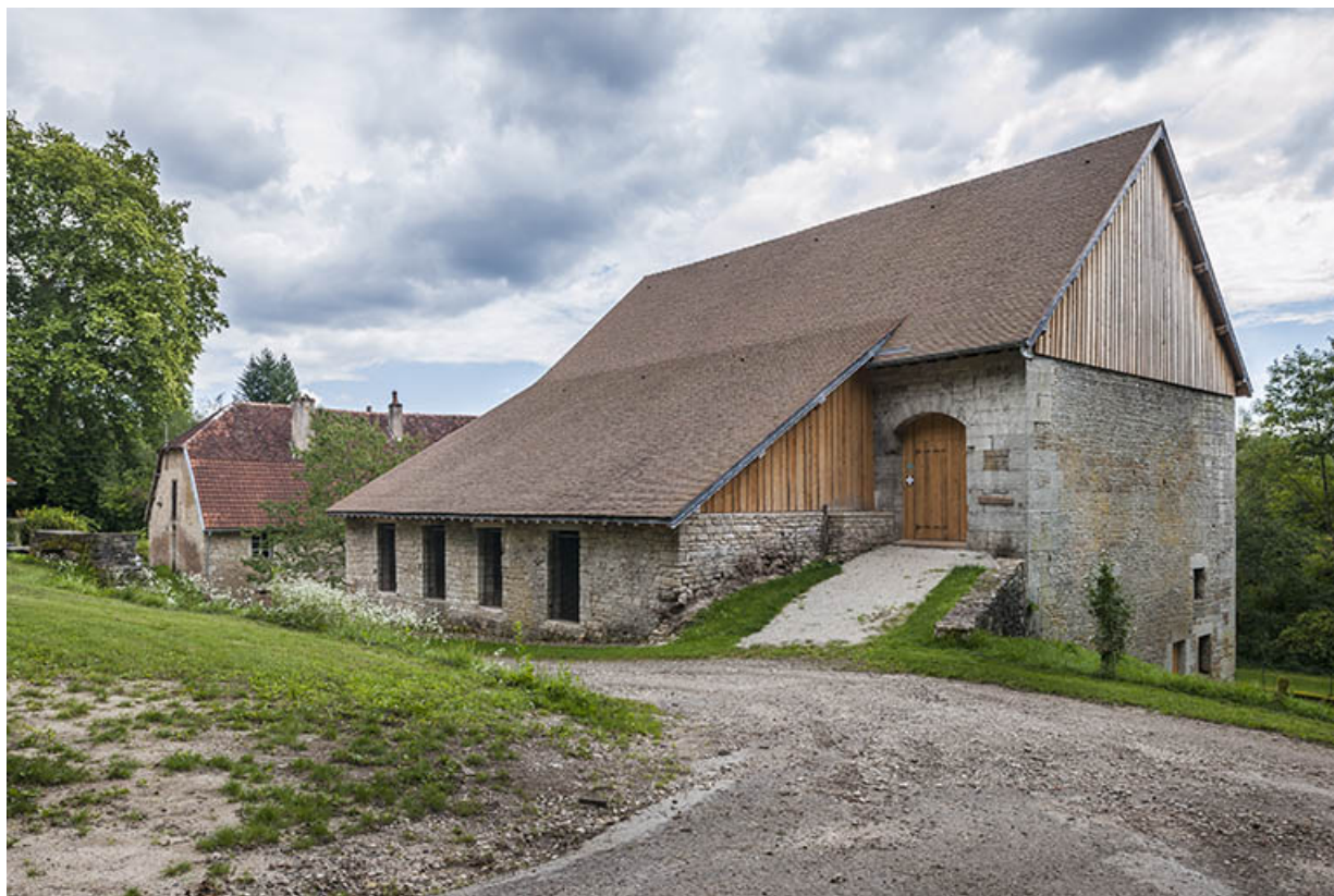
Bâtiment du haut fourneau vu de trois quarts droite.

25, Montagney-Servigny rue du Haut fourneau