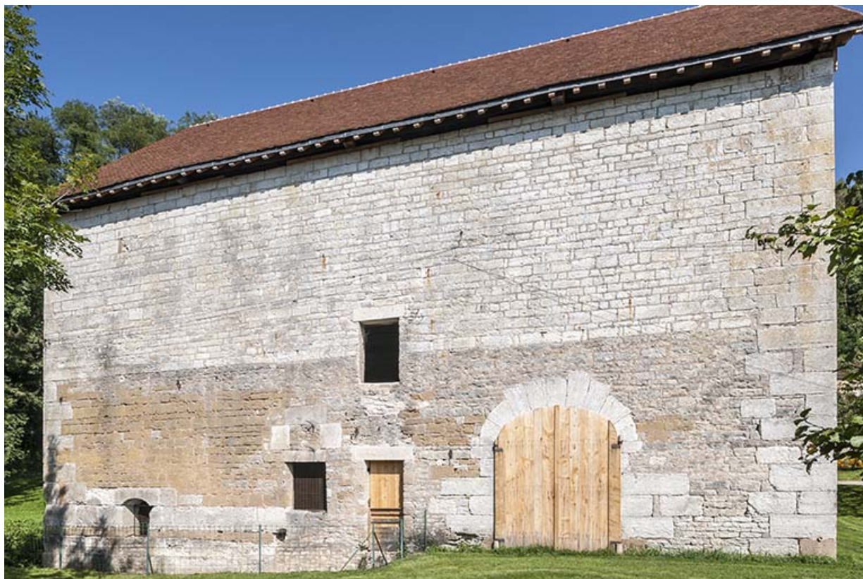
Façade sud du bâtiment du haut fourneau.

25, Montagney-Servigney rue du Haut fourneau