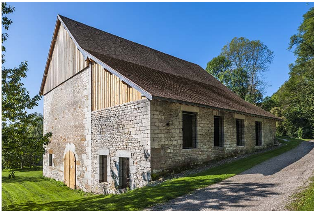
Bâtiment du haut fourneau vu de trois quarts gauche.

25, Montagney-Servigney rue du Haut fourneau