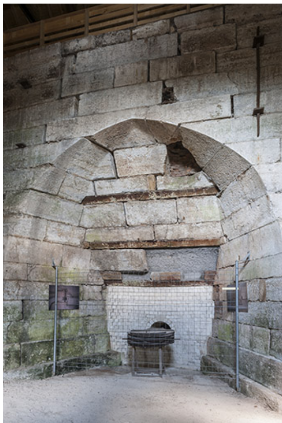
Base du haut fourneau (côté sud) et ouverture de la soufflerie.

25, Montagney-Servigney rue du Haut fourneau