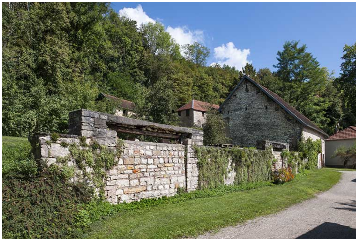
Vestiges de la halle à charbon (premier plan) et bâtiment agricole.

25, Montagney-Servigney rue du Haut fourneau