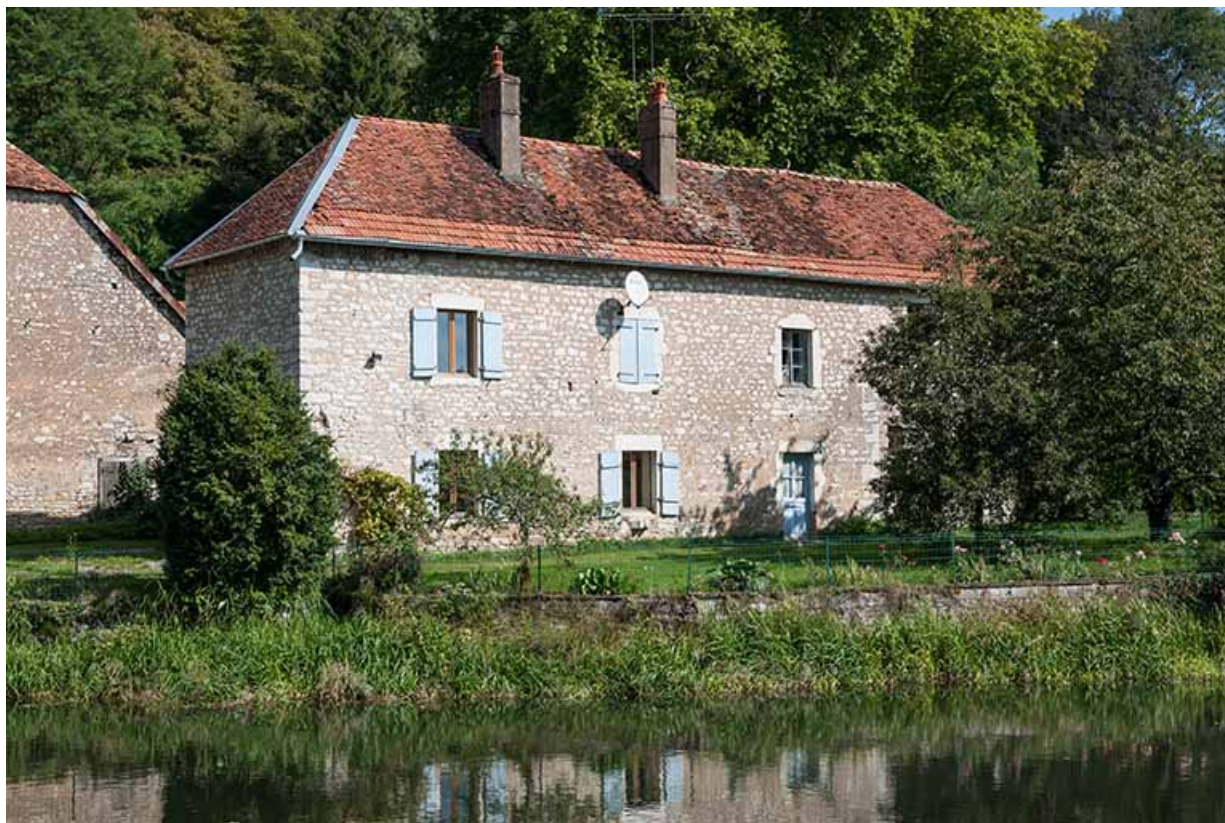
Vue de trois quarts arrière du logement patronal (devenu ensuite logement d'ouvriers). 25, Montagney-Servigny rue du Haut fourneau