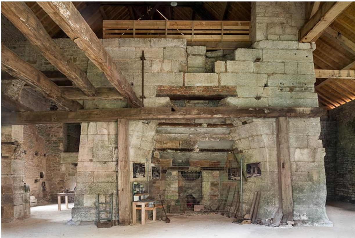
Haut fourneau, vu de face.