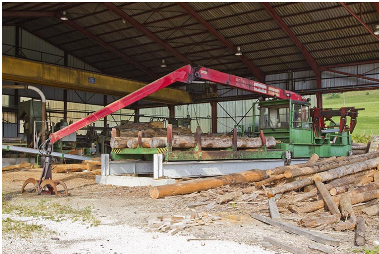
Parc aux grumes : scie sur chariot mobile Herkules.