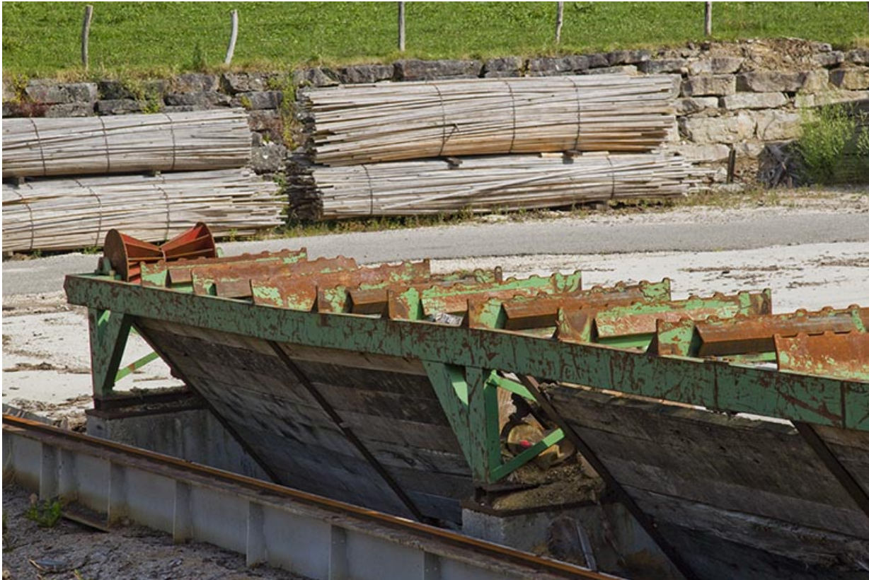
Parc aux grumes : détail du convoyeur. 25, Cour-Saint-Maurice, 10 Rue Grande