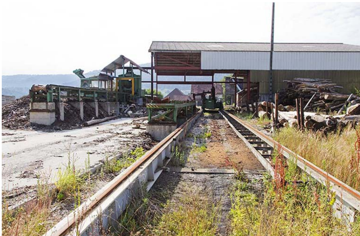
Parc aux grumes : installations d'écorçage et de sciage.