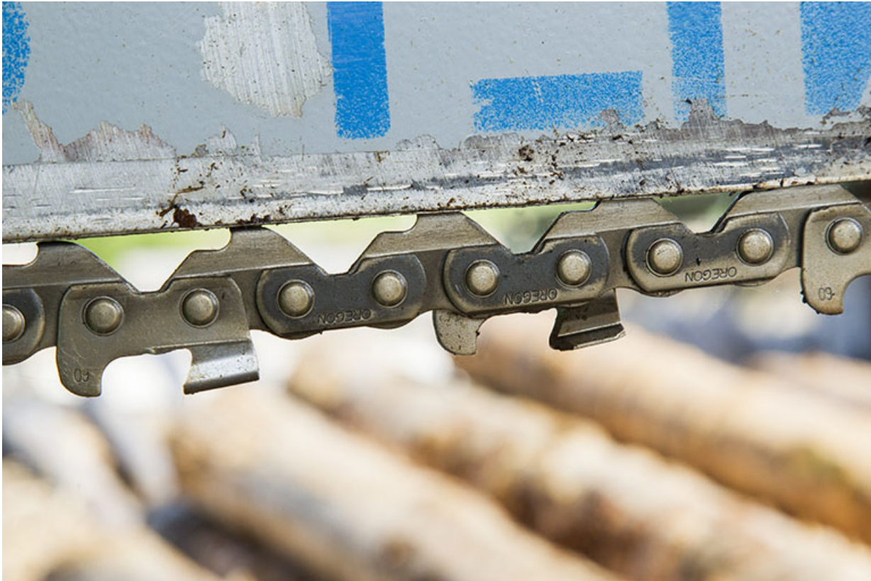
Parc aux grumes : bras de sciage de la scie Herkules (détail de la chaîne). 25, Cour-Saint-Maurice, 10 Rue Grande