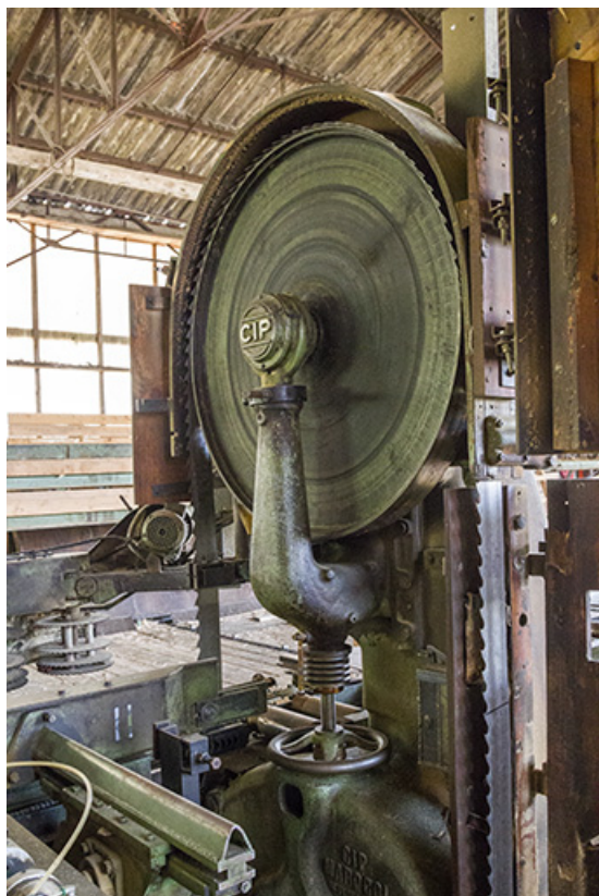
Atelier de fabrication de 1953 : volant et lame de la scie CIP Marqcol (détail). 25, Cour-Saint-Maurice, 10 Rue Grande