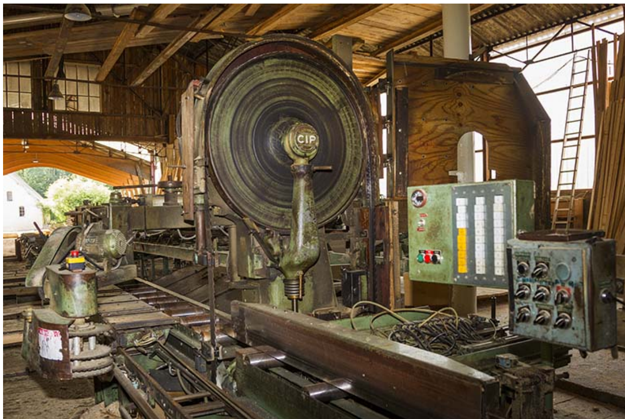
Atelier de fabrication de 1953 : scie CIP Marqcol. 25, Cour-Saint-Maurice, 10 Rue Grande