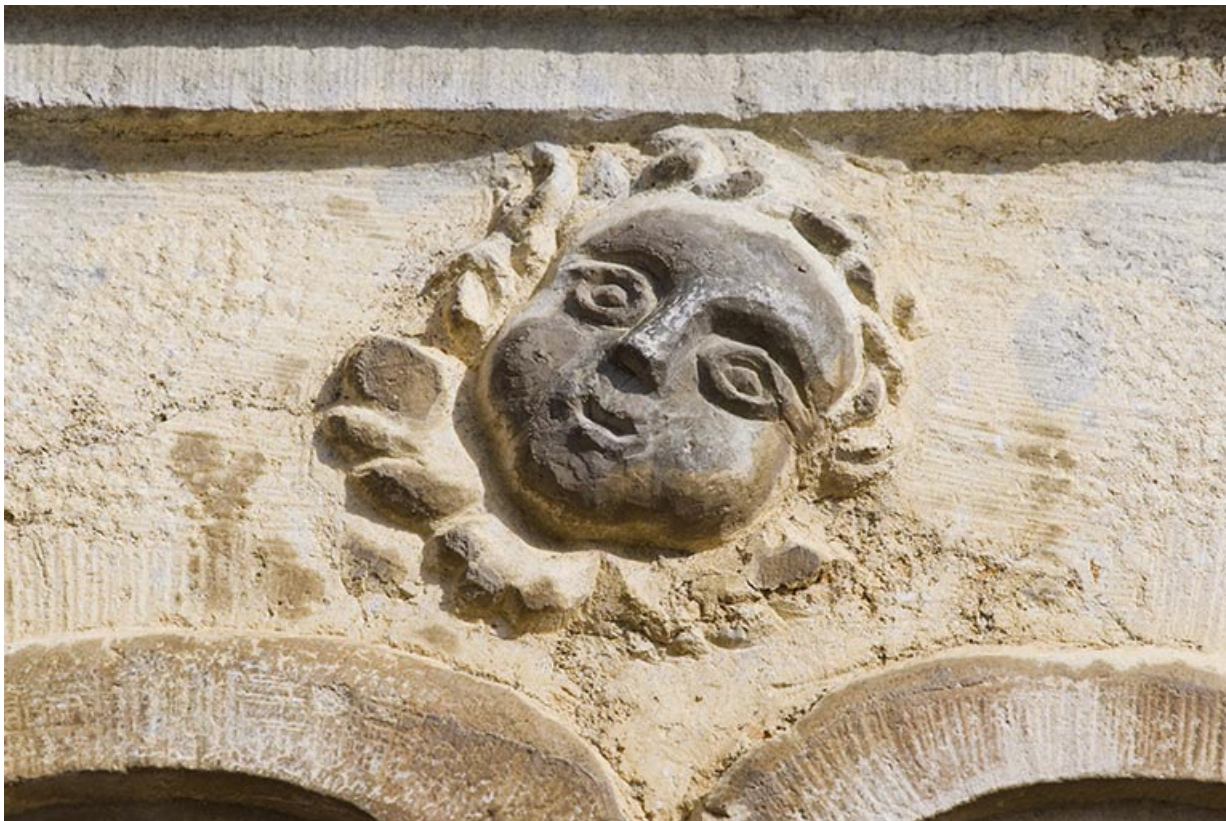
Maison : tête d'angelot sur le linteau de la porte d'entrée.