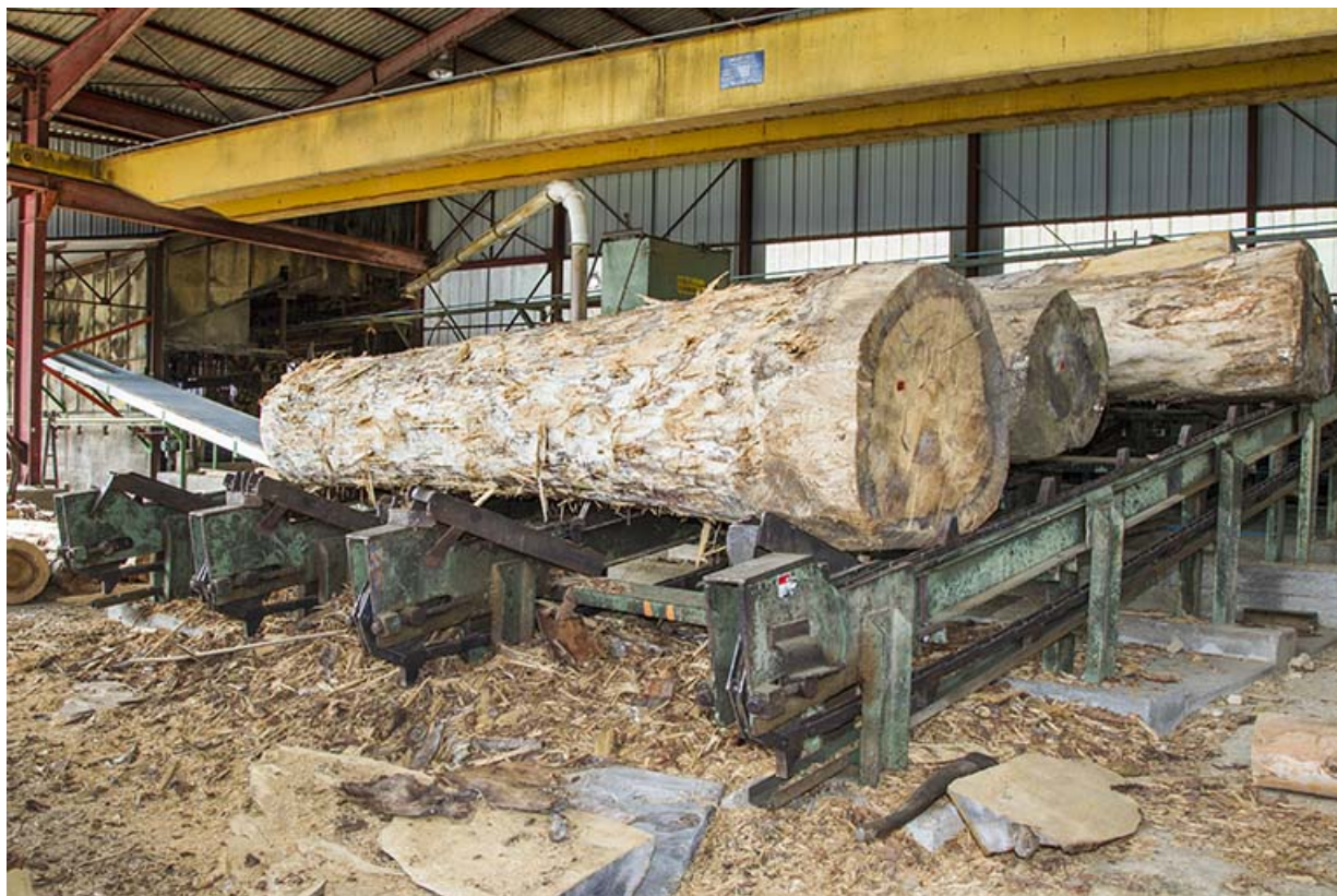
Atelier de fabrication de 1980-1982 : chariot à grumes alimentant la scie Gillet et Vigneau. 25, Cour-Saint-Maurice, 10 Rue Grande