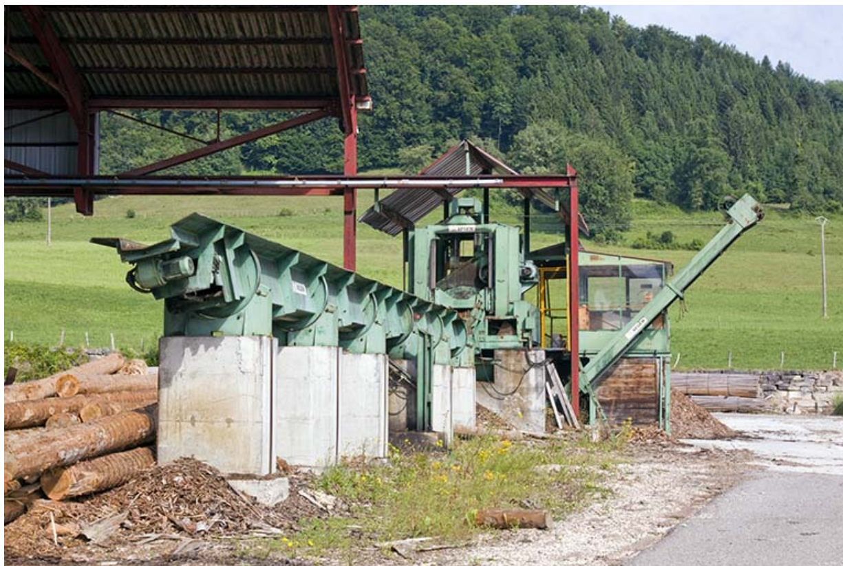
Parc aux grumes : écorceuse Segem. 25, Cour-Saint-Maurice, 10 Rue Grande