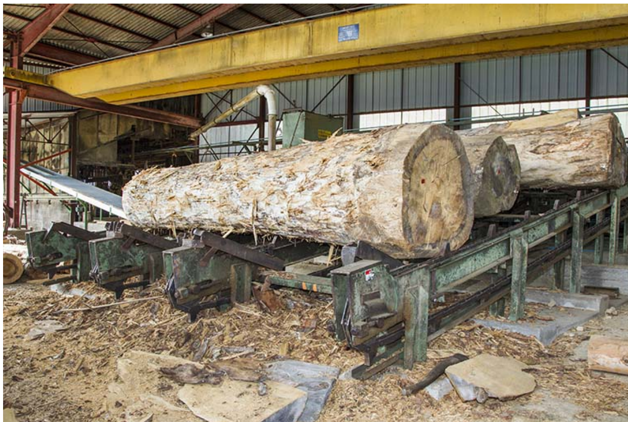
Atelier de fabrication de 1980-1982 : chariot à grumes alimentant la scie Gillet et Vigneau.