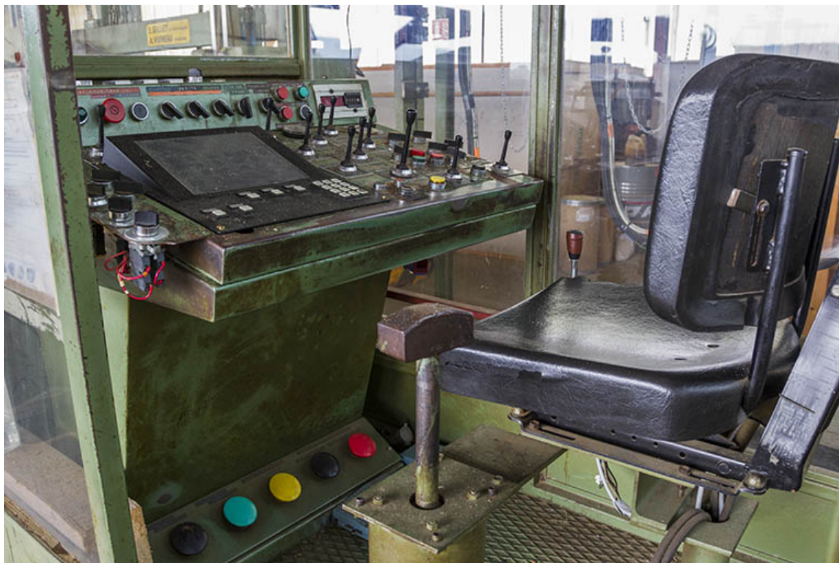
Atelier de fabrication de 1980-1982 : poste de commande de la scie Gillet et Vigneau. 25, Cour-Saint-Maurice, 10 Rue Grande