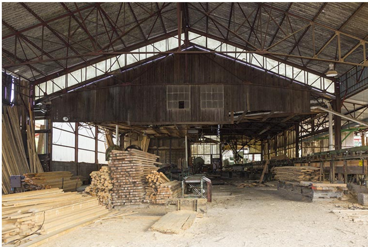
Hangar de 1969-1970 et atelier de fabrication de 1953 : intérieur.