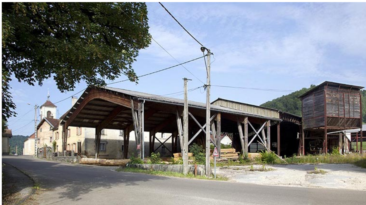
Entrée de la scierie : hangar de 1990 et silo à sciure.