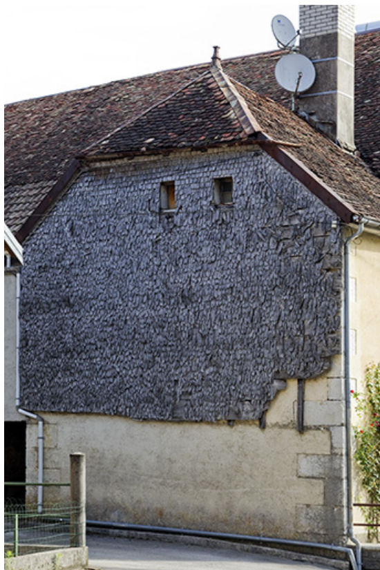
Maison : essentage de tavaillons.