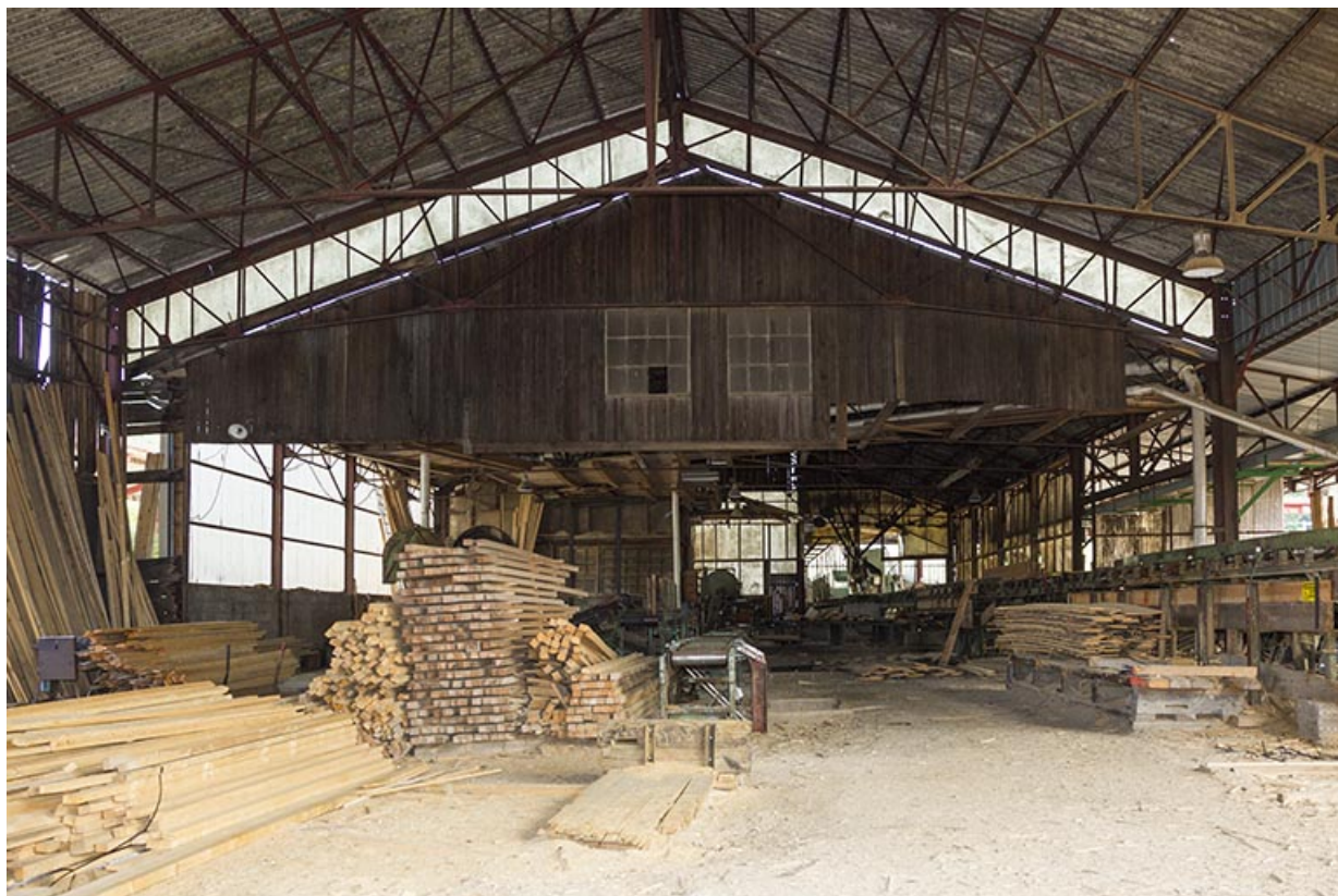
Hangar de 1969-1970 et atelier de fabrication de 1953 : intérieur.