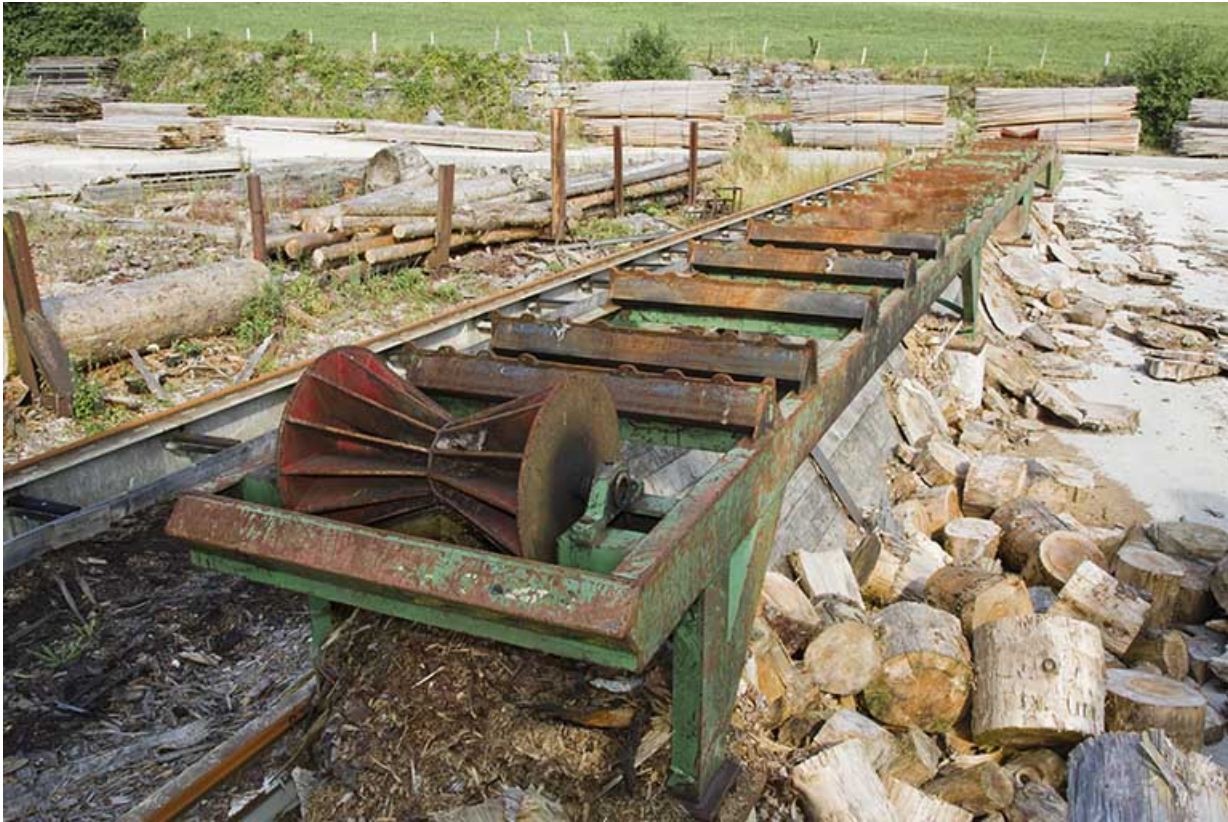
Parc aux grumes : convoyeur.