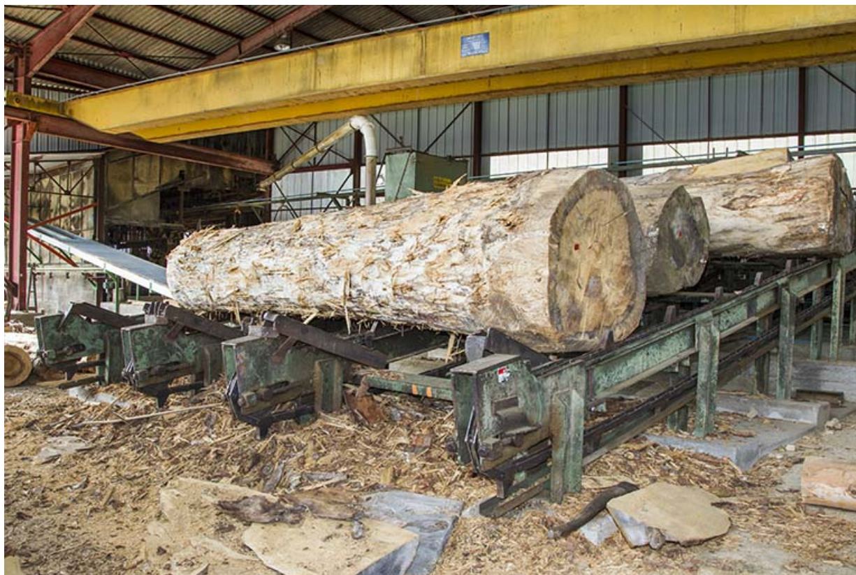
Atelier de fabrication de 1980-1982 : chariot à grumes alimentant la scie Gillet et Vigneau. 25, Cour-Saint-Maurice, 10 Rue Grande