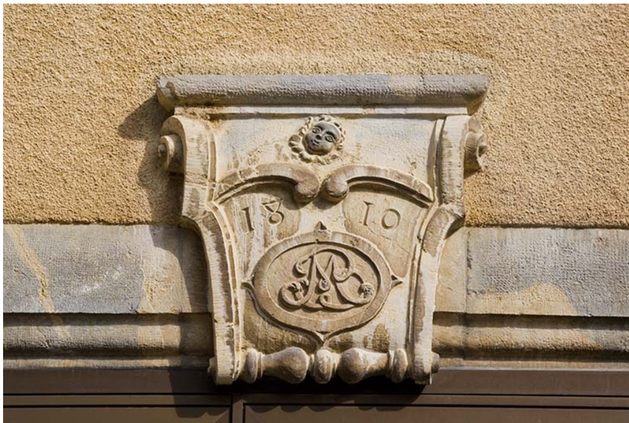
Maison : date et décor du linteau de la porte d'entrée.