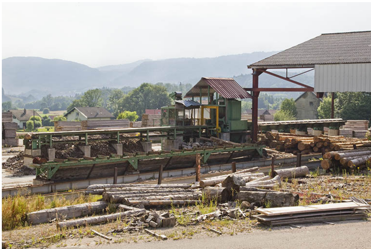
Parc aux grumes : convoyeur et écorceuse Segem.