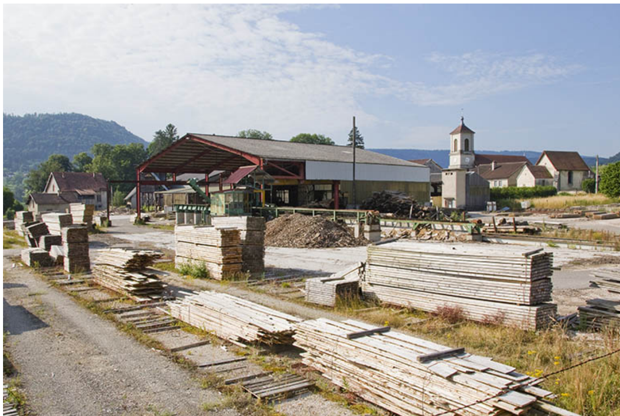
Atelier de fabrication et aire des produits manufacturés, depuis le nord.