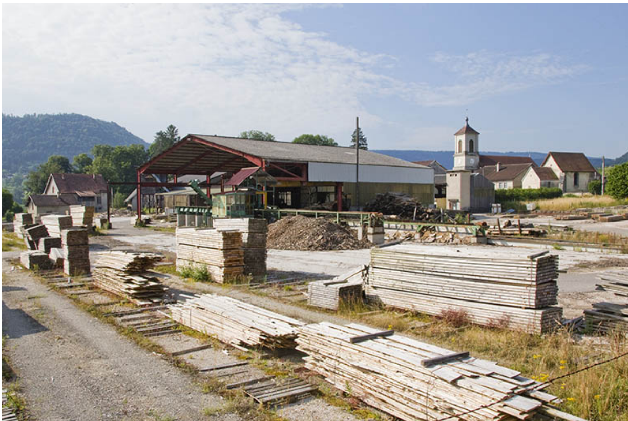
Atelier de fabrication et aire des produits manufacturés, depuis le nord.