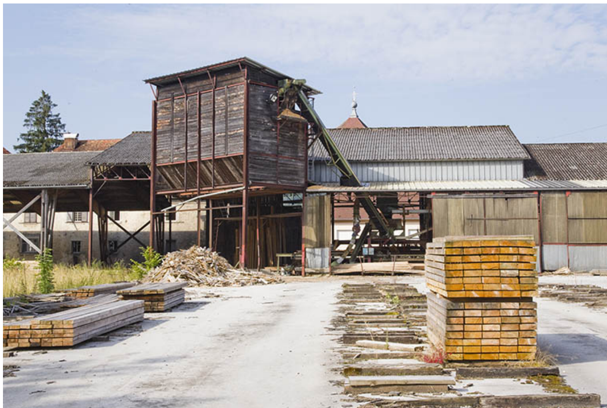
Silo à sciure et hangar de 1969-1970.