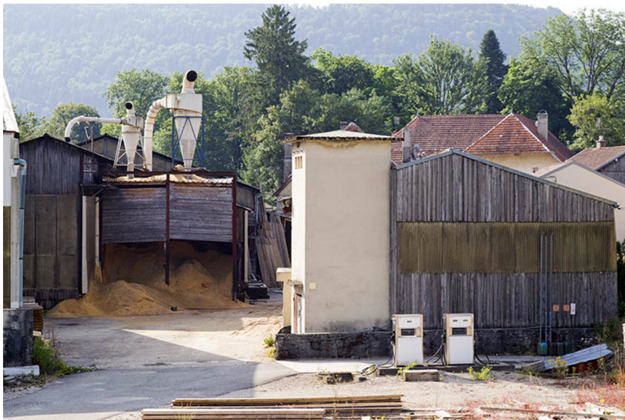
Silos à sciure et magasin industriel situés à l'ouest.