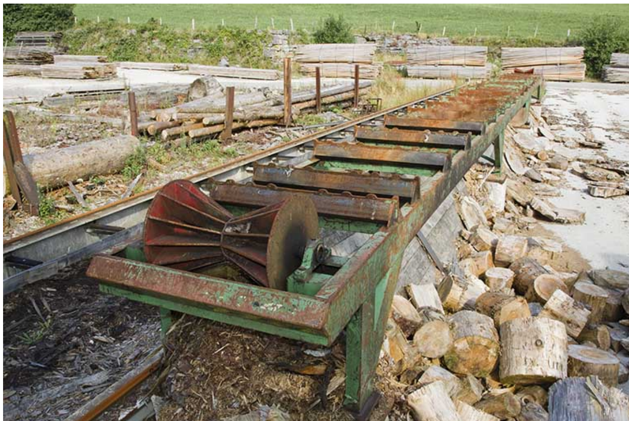
Parc aux grumes : convoyeur.