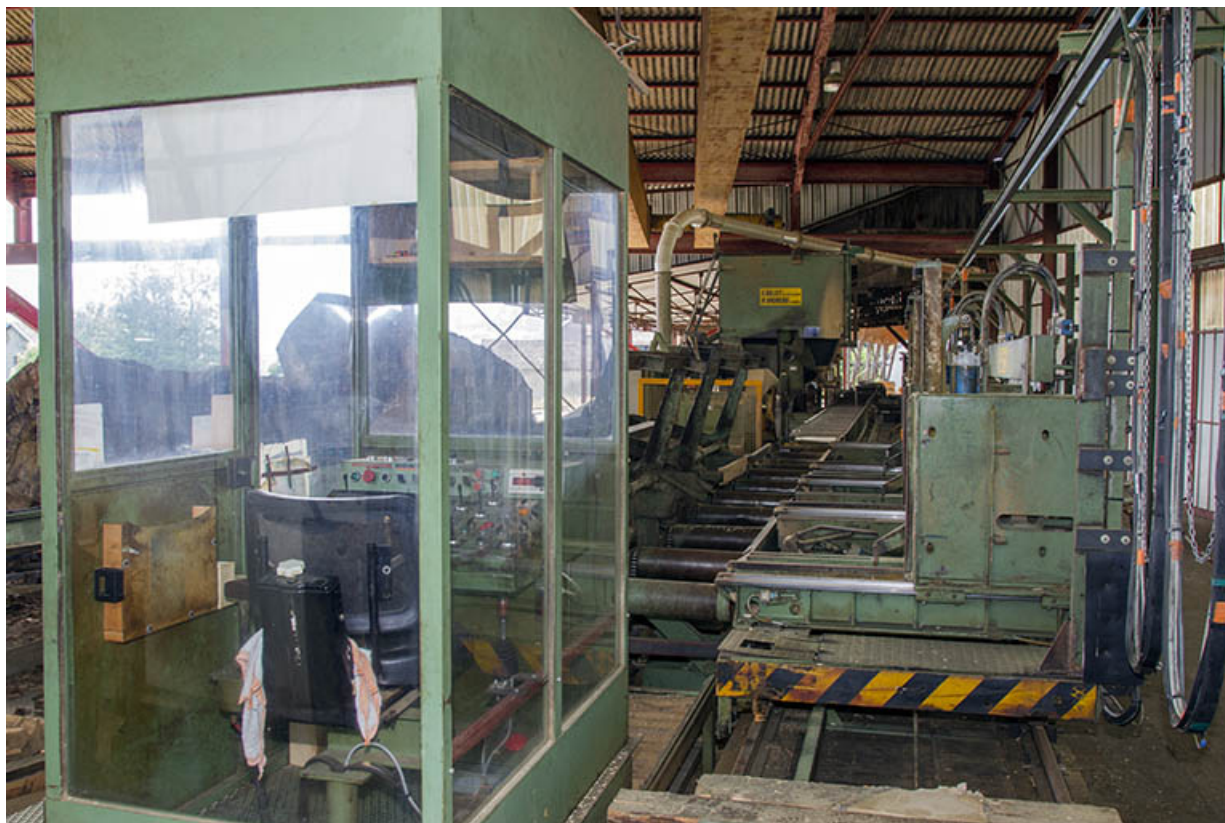
Atelier de fabrication de 1980-1982 : scie Gillet et Vigneau.