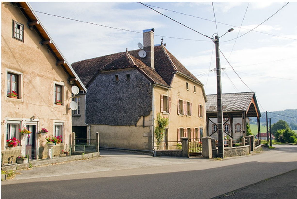
Maison et hangar de 1990, depuis la route à l'ouest.