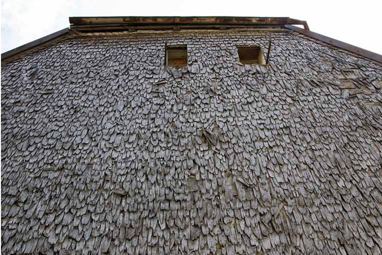
Maison : détail de l'essentage de tavaillons.