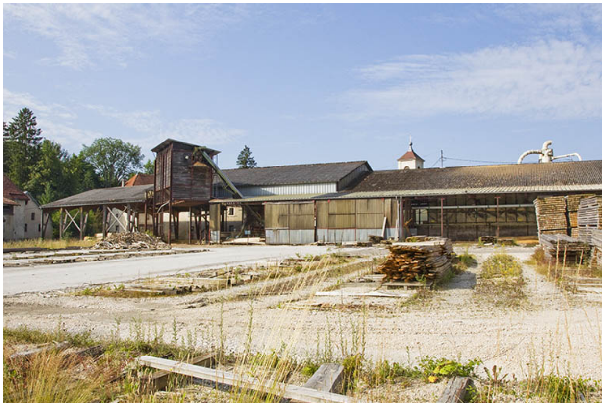
Scierie vue de l'est : de gauche à droite, hangars de 1990 et 1969-1970, atelier de fabrication de 1953. 25, Cour-Saint-Maurice, 10 Rue Grande