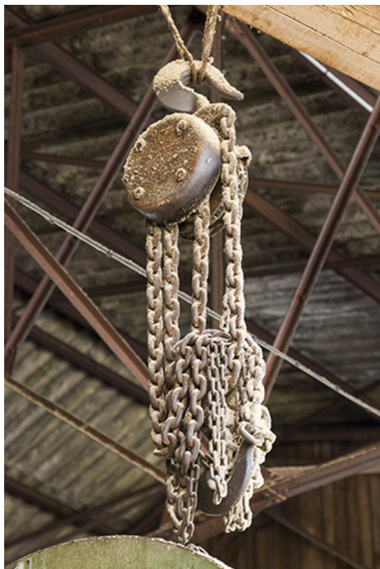
Atelier de fabrication de 1953 : palan manuel. 25, Cour-Saint-Maurice, 10 Rue Grande