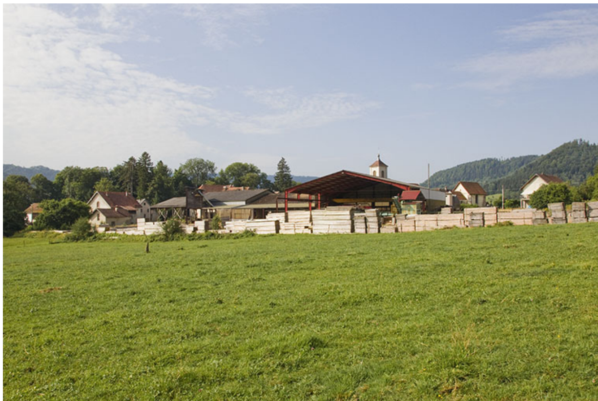
Vue d'ensemble, depuis le nord.