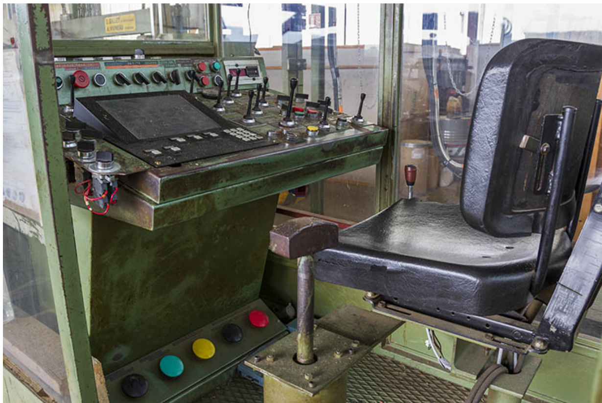
Atelier de fabrication de 1980-1982 : poste de commande de la scie Gillet et Vigneau. 25, Cour-Saint-Maurice, 10 Rue Grande