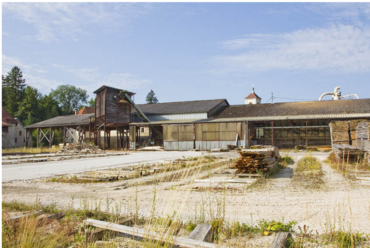
Scierie vue de l'est : de gauche à droite, hangars de 1990 et 1969-1970, atelier de fabrication de 1953. 25, Cour-Saint-Maurice, 10 Rue Grande