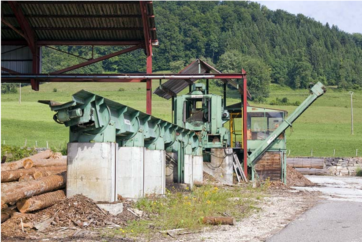
Parc aux grumes : écorceuse Segem. 25, Cour-Saint-Maurice, 10 Rue Grande