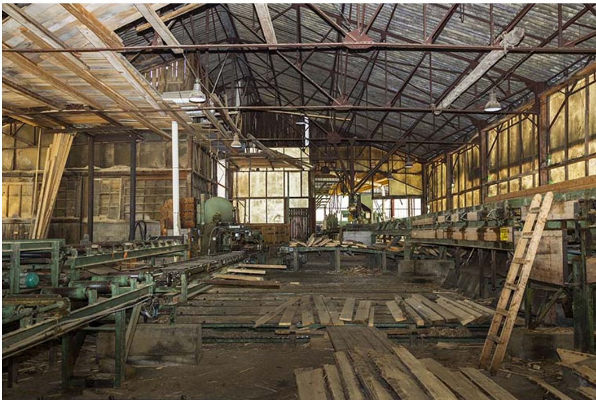
Atelier de fabrication de 1953 : intérieur et machines.