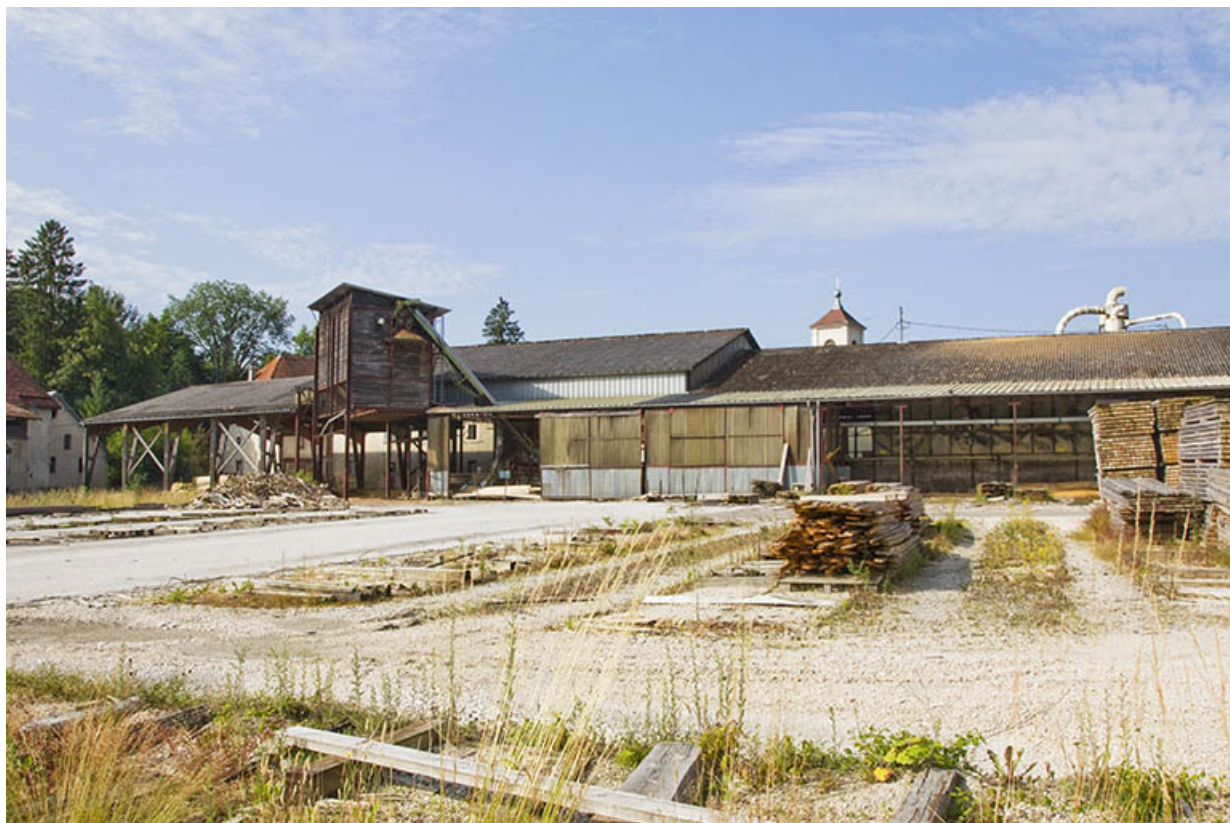
Scierie vue de l'est : de gauche à droite, hangars de 1990 et 1969-1970, atelier de fabrication de 1953.