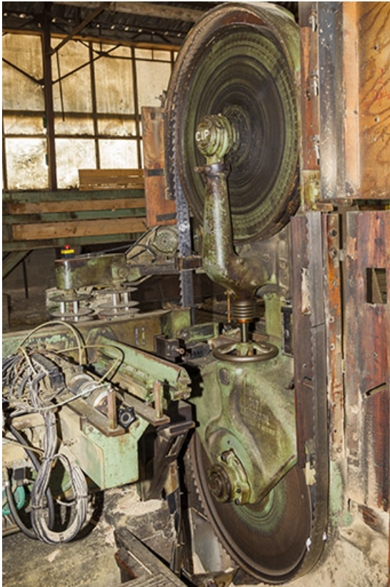
Atelier de fabrication de 1953 : volants et lame de la scie CIP Marqcol. 25, Cour-Saint-Maurice, 10 Rue Grande