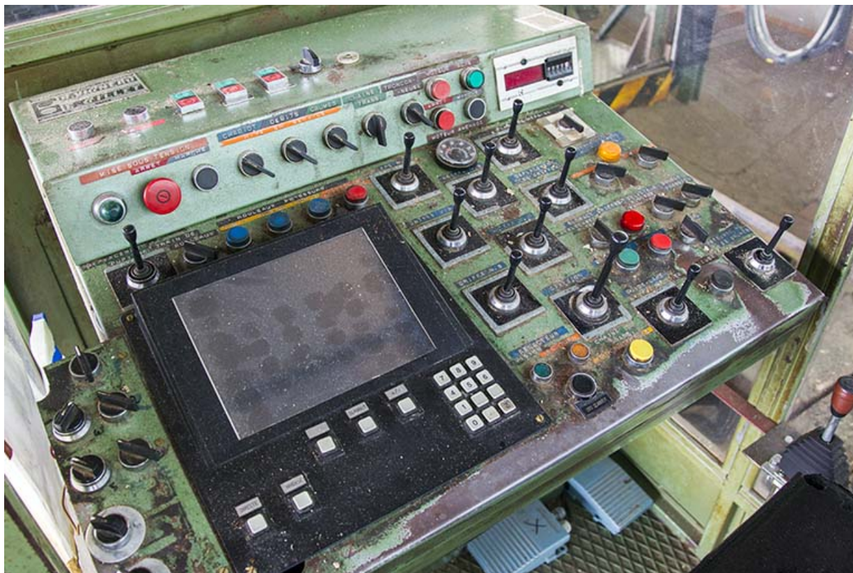
Atelier de fabrication de 1980-1982 : pupitre du poste de commande de la scie Gillet et Vigneau.