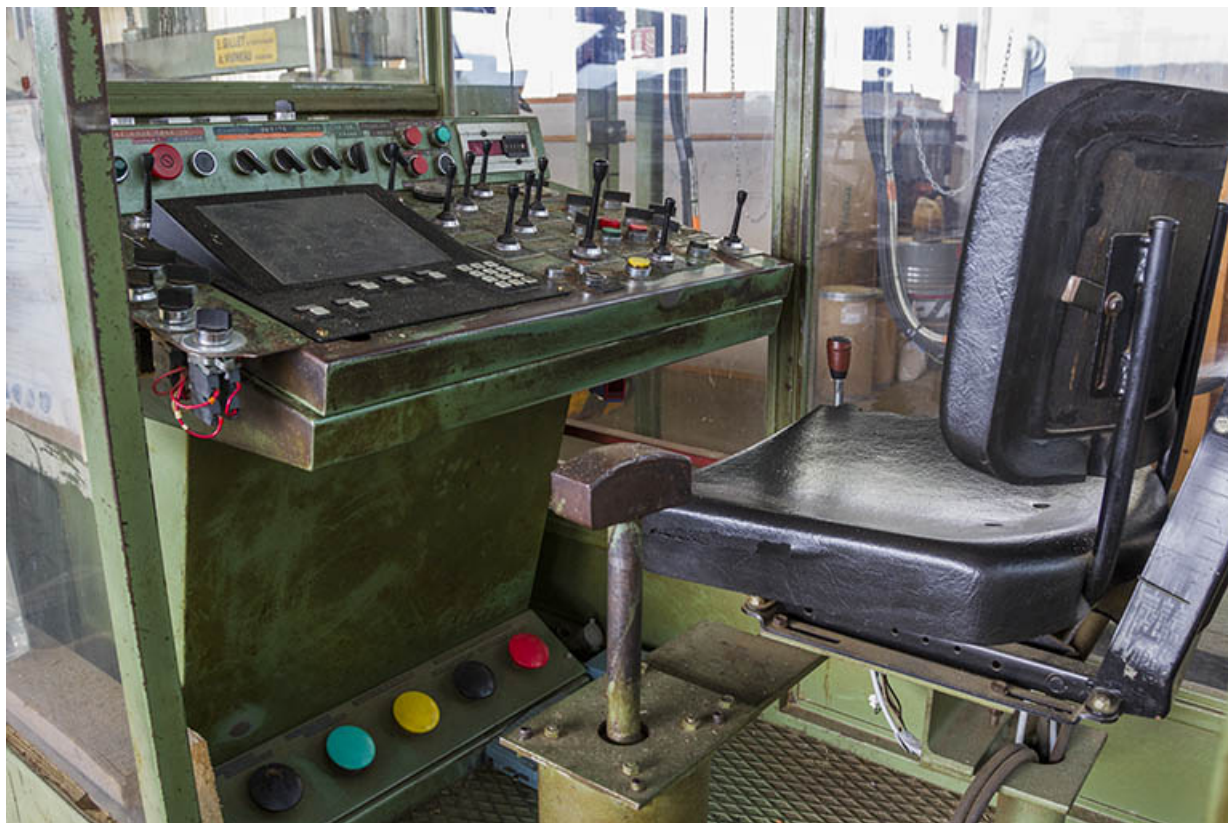
Atelier de fabrication de 1980-1982 : poste de commande de la scie Gillet et Vigneau. 25, Cour-Saint-Maurice, 10 Rue Grande