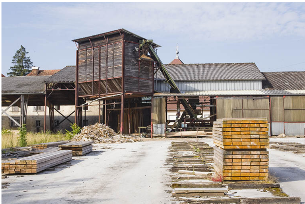
Silo à sciure et hangar de 1969-1970.