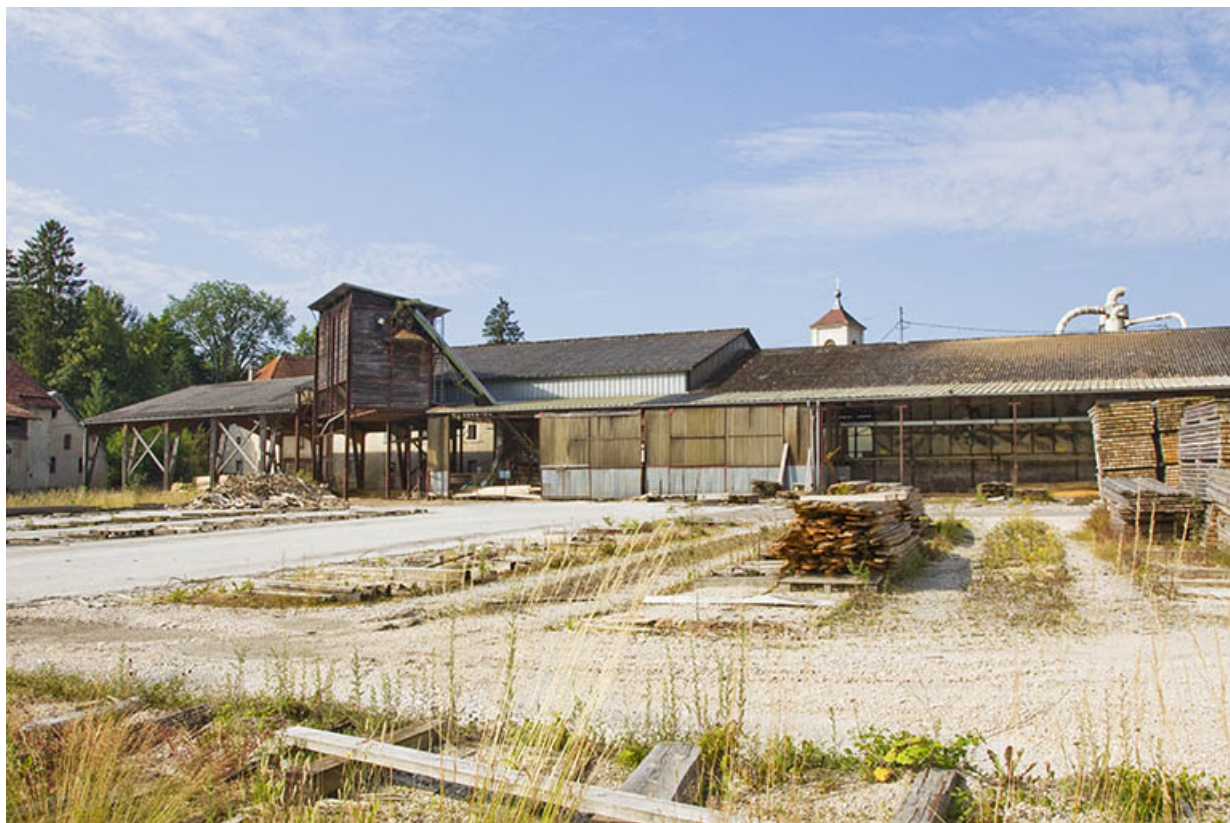
Scierie vue de l'est : de gauche à droite, hangars de 1990 et 1969-1970, atelier de fabrication de 1953. 25, Cour-Saint-Maurice, 10 Rue Grande