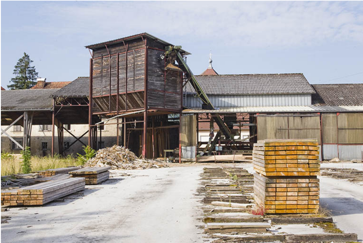
Silo à sciure et hangar de 1969-1970.