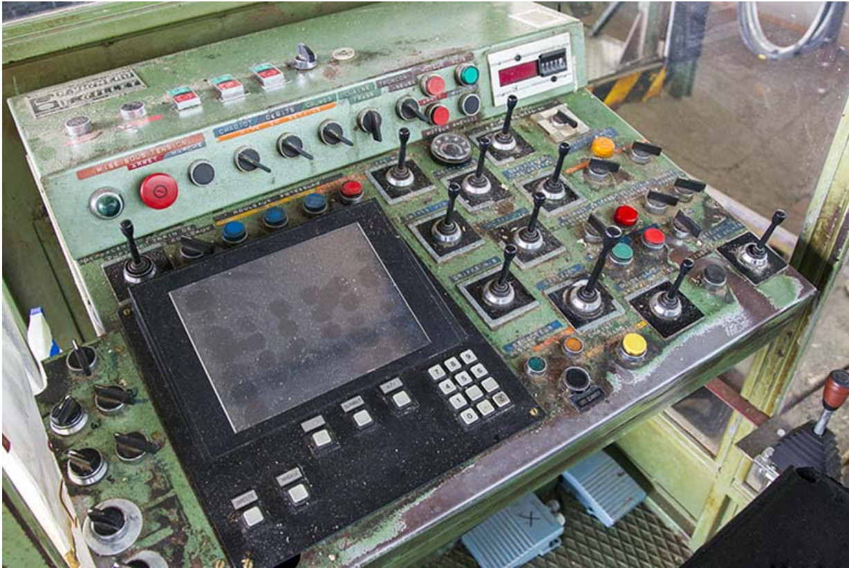
Atelier de fabrication de 1980-1982 : pupitre du poste de commande de la scie Gillet et Vigneau.