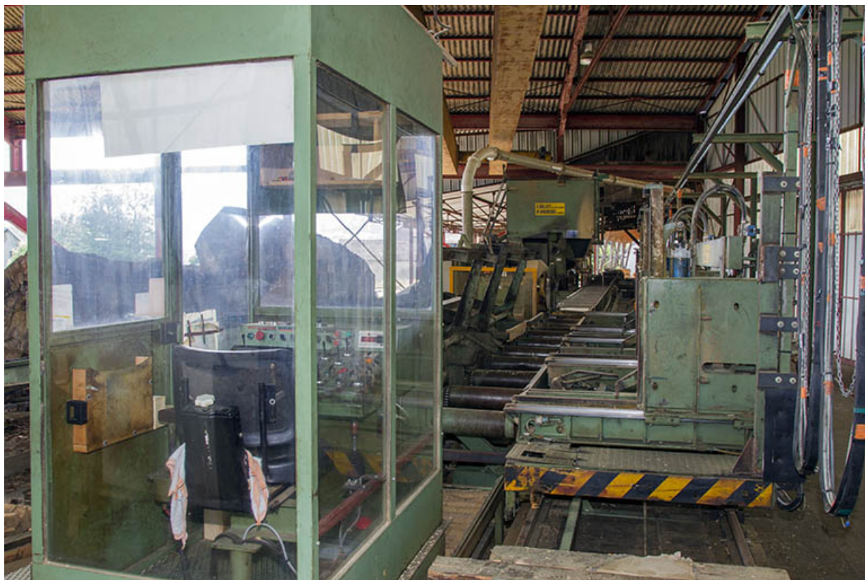
Atelier de fabrication de 1980-1982 : scie Gillet et Vigneau.