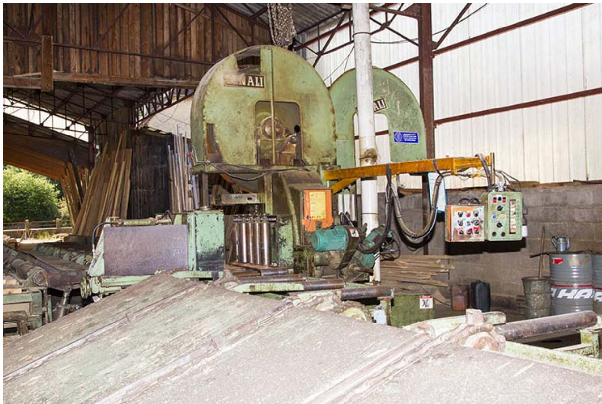
Atelier de fabrication de 1953 : scie Canali. 25, Cour-Saint-Maurice, 10 Rue Grande