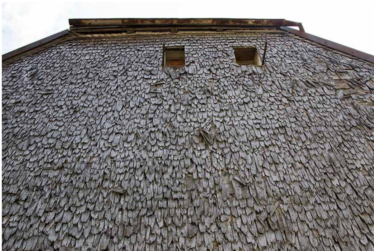
Maison : détail de l'essentage de tavaillons.