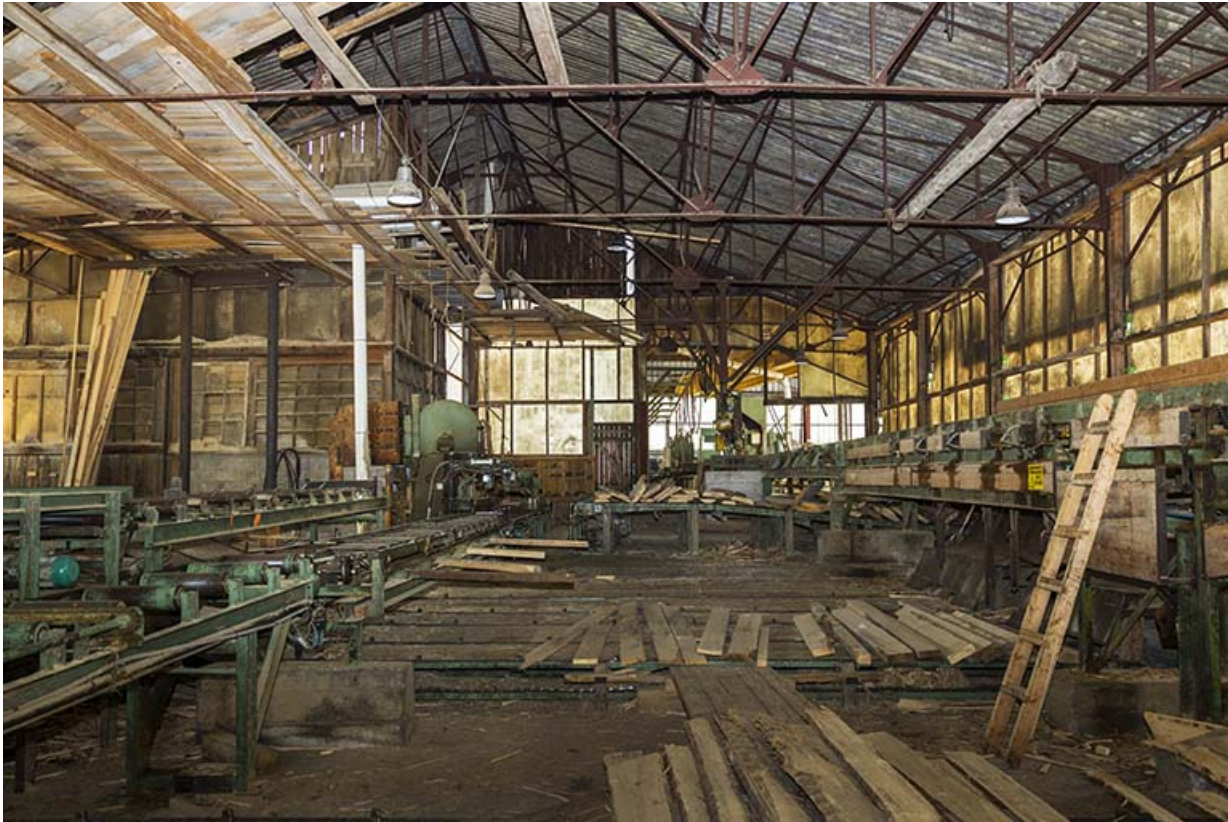
Atelier de fabrication de 1953 : intérieur et machines.