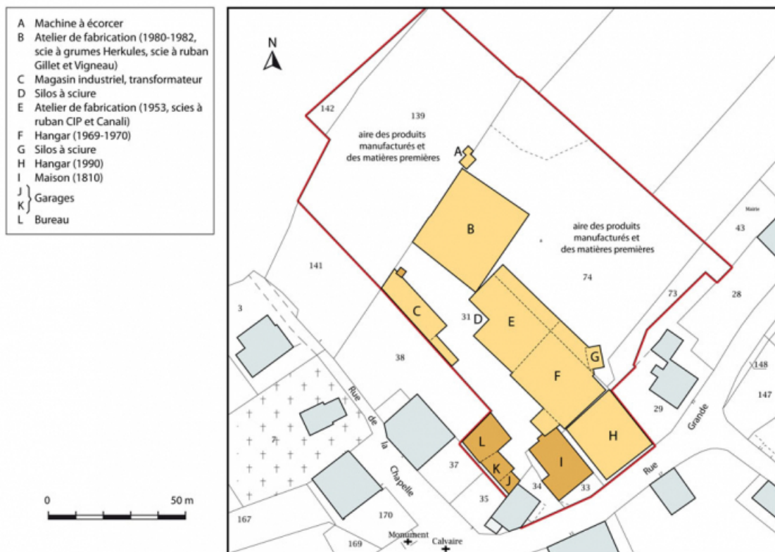
Plan-masse et de situation. Extrait du plan cadastral, 2015, section AC. 25, Cour-Saint-Maurice, 10 Rue Grande