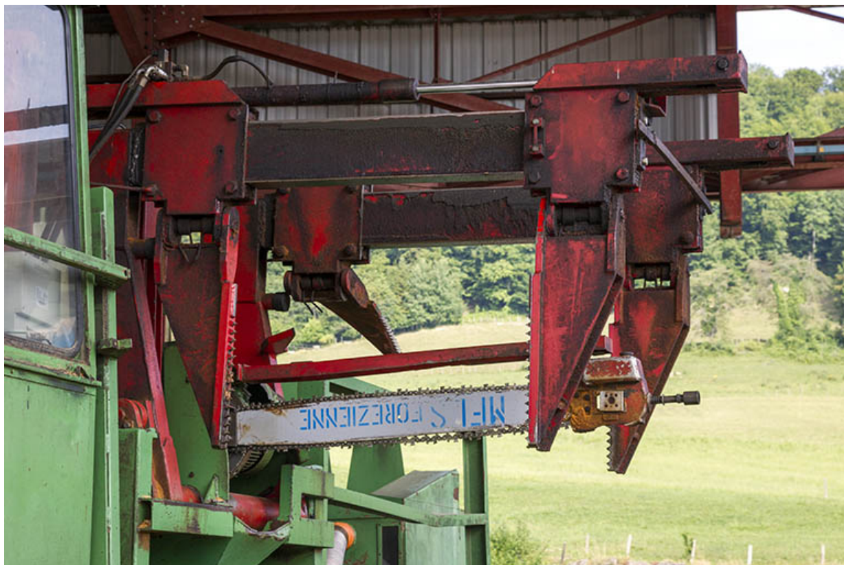
Parc aux grumes : bras de sciage de la scie Herkules. 25, Cour-Saint-Maurice, 10 Rue Grande