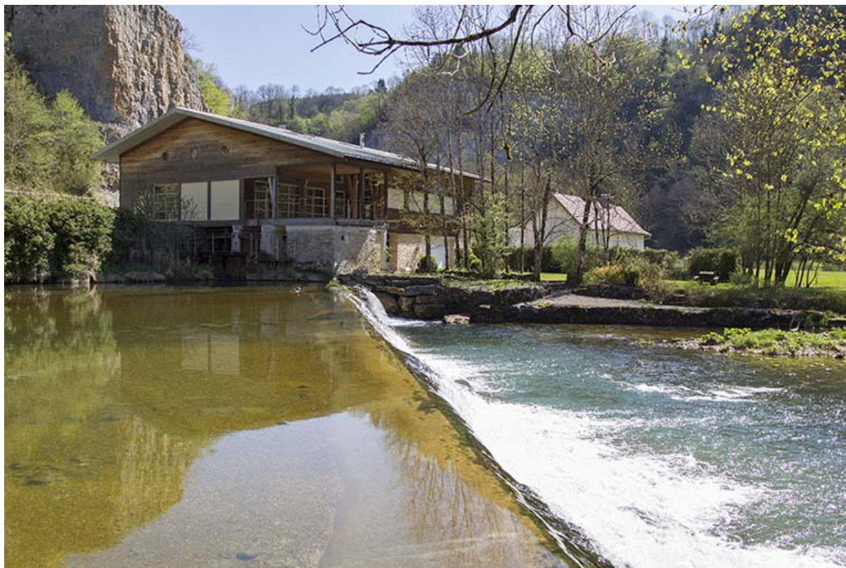
Site de la scierie : atelier de fabrication et barrage, depuis l'ouest (amont). 25, Cour-Saint-Maurice, lieudit : le Moulin du Bas