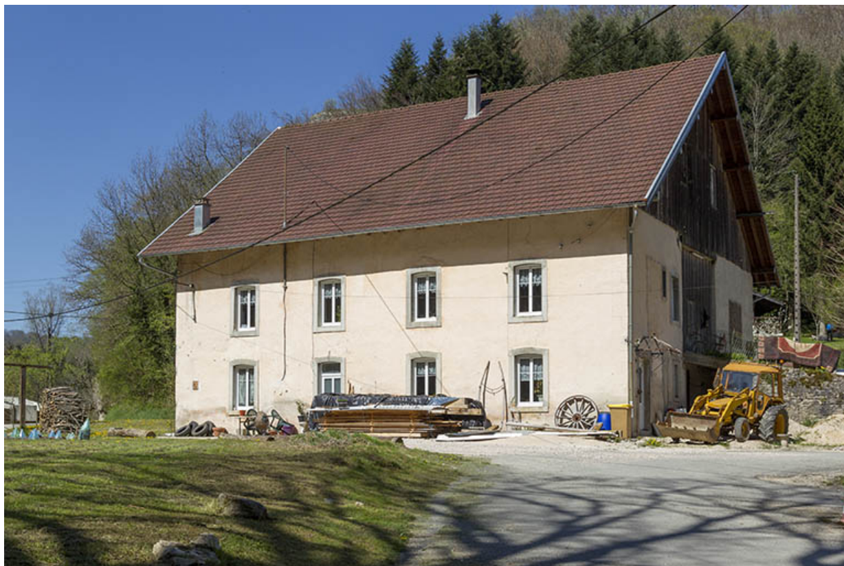
Site du moulin : logement d'ouvriers, depuis l'ouest.

25, Cour-Saint-Maurice, lieudit : le Moulin du Bas