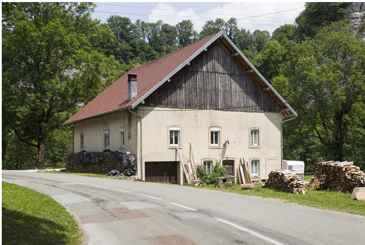
Site du moulin : logement d'ouvriers, depuis le sud.

25, Cour-Saint-Maurice, lieudit : le Moulin du Bas