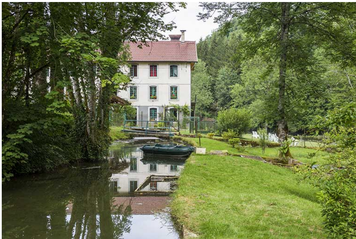
Moulin, façade antérieure : bief d'amenée.

25, Cour-Saint-Maurice, lieudit : le Moulin du Bas