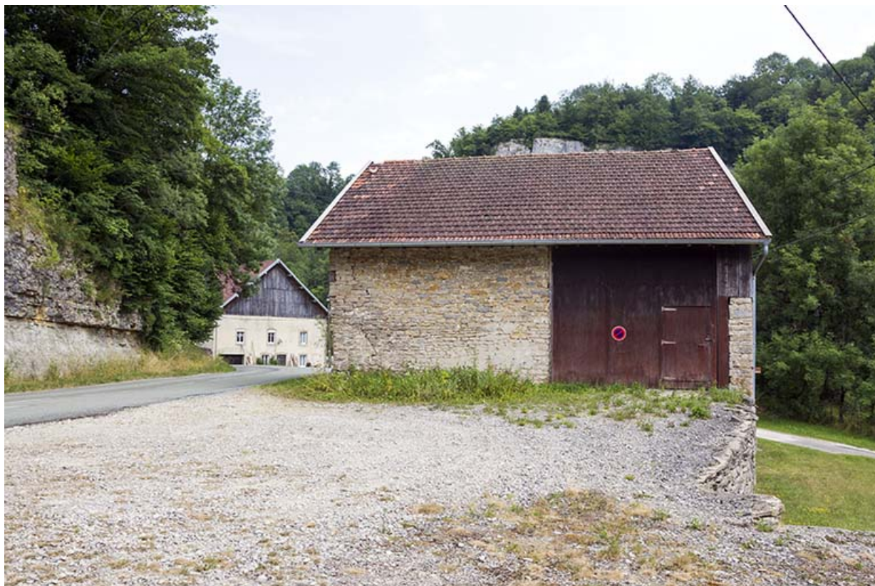
Site de la scierie : remise et étable (avec à l'arrière-plan le logement d'ouvriers proche du moulin).

25, Cour-Saint-Maurice, lieudit : le Moulin du Bas