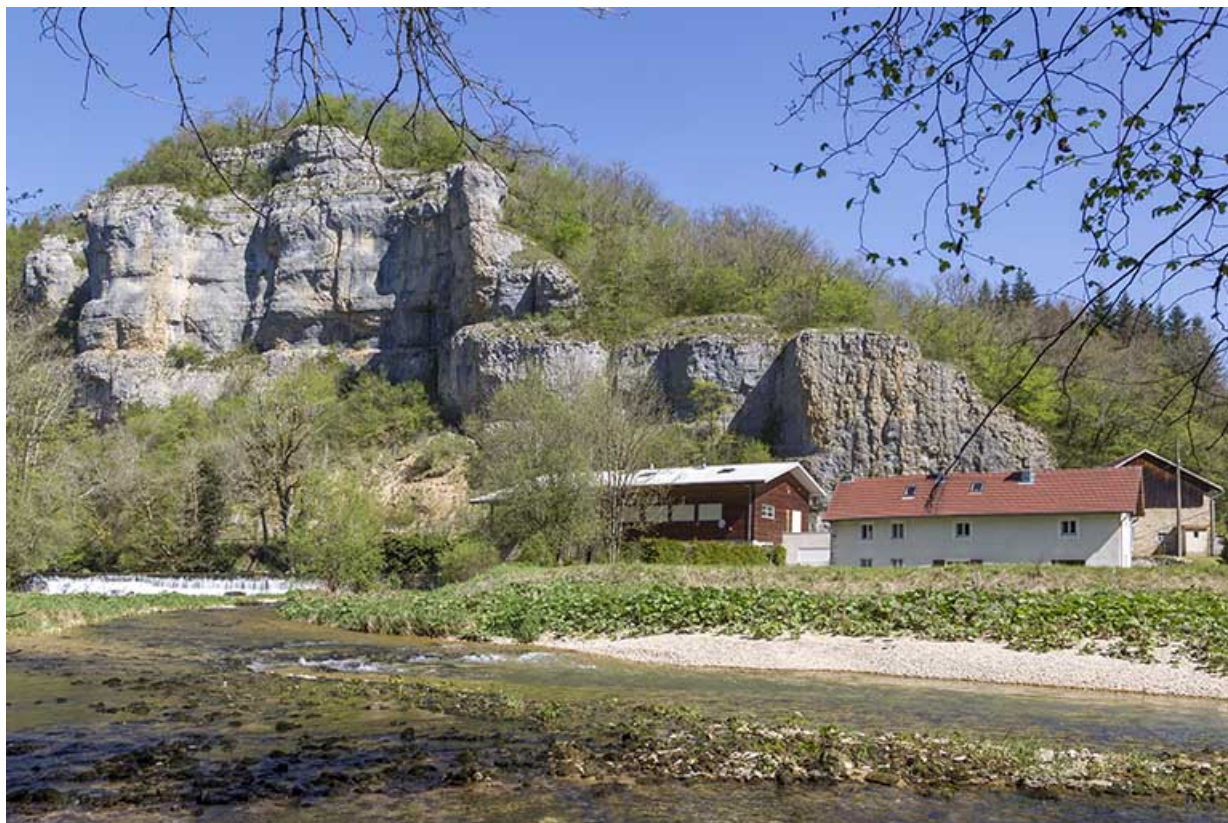
Site de la scierie : vue d'ensemble, depuis le sud.

25, Cour-Saint-Maurice, lieudit : le Moulin du Bas