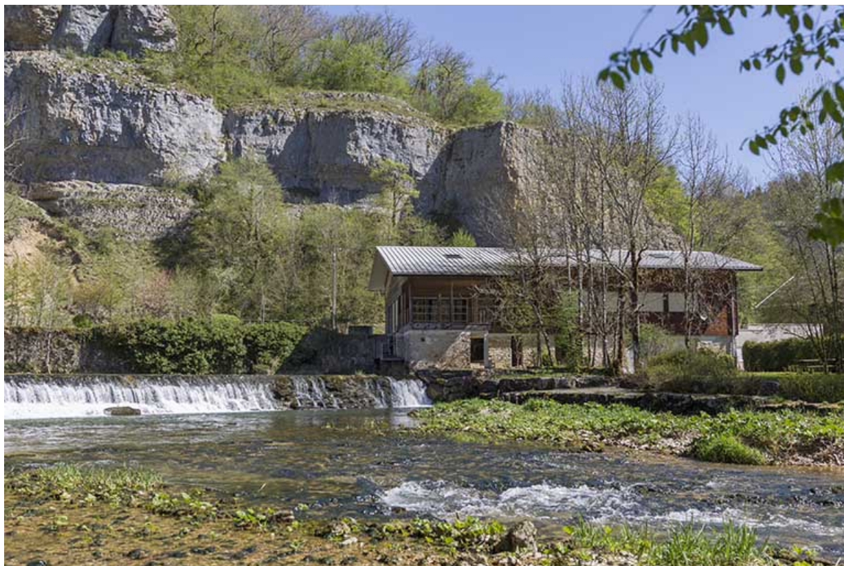
Site de la scierie : atelier de fabrication et barrage, depuis le sud.

25, Cour-Saint-Maurice, lieudit : le Moulin du Bas