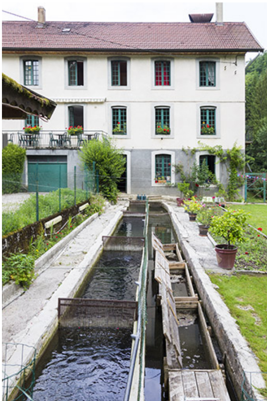
Moulin, façade antérieure : bief d'amenée transformé en vivier.

25, Cour-Saint-Maurice, lieudit : le Moulin du Bas