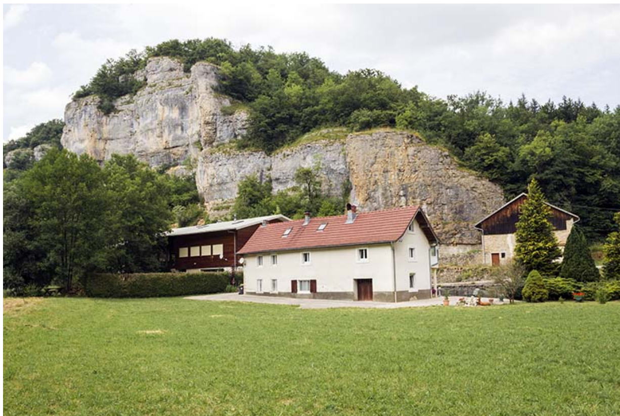
Site de la scierie : vue d'ensemble, depuis le sud-est.

25, Cour-Saint-Maurice, lieudit : le Moulin du Bas