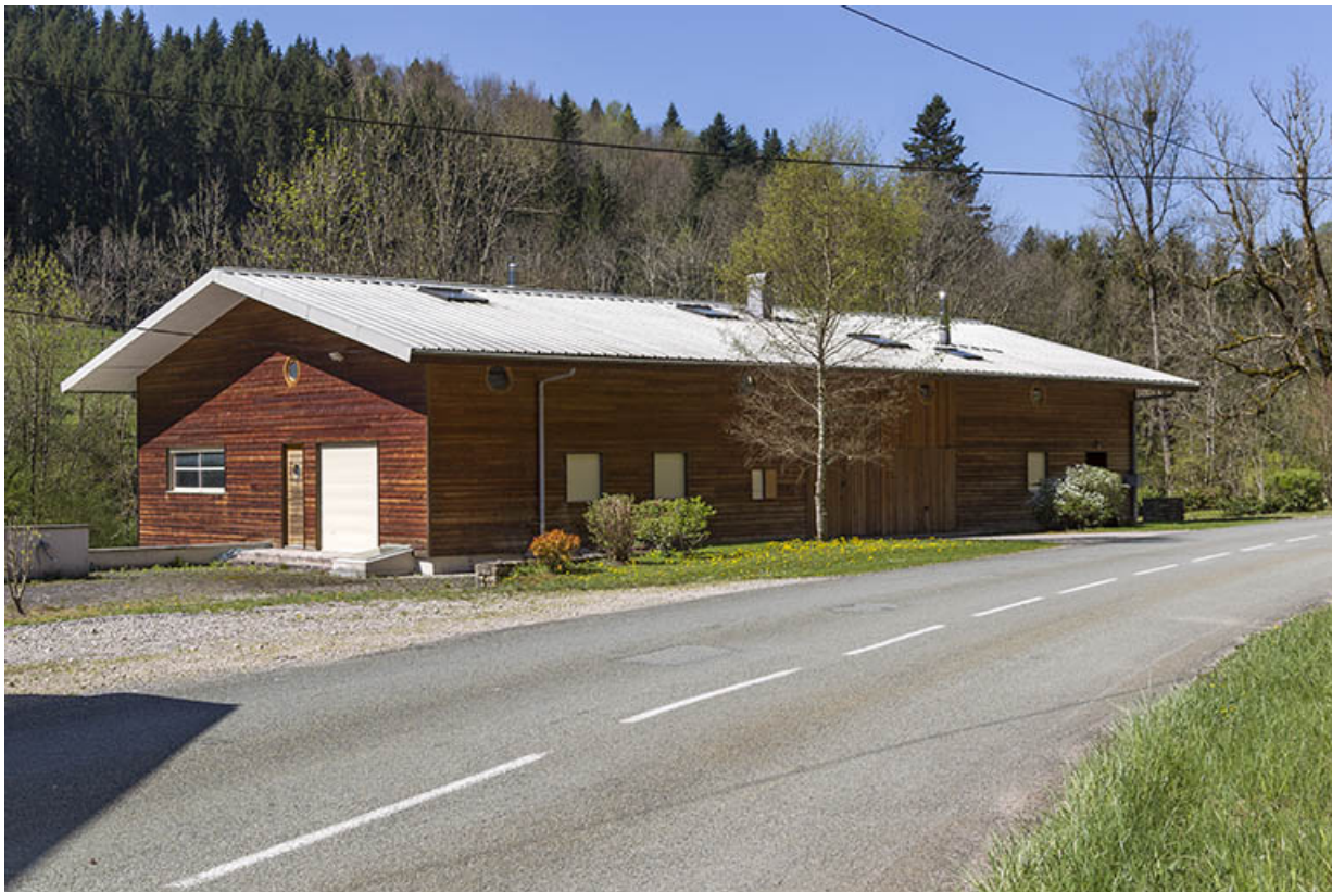
Site de la scierie : atelier de fabrication refait, depuis le nord-est.

25, Cour-Saint-Maurice, lieudit : le Moulin du Bas