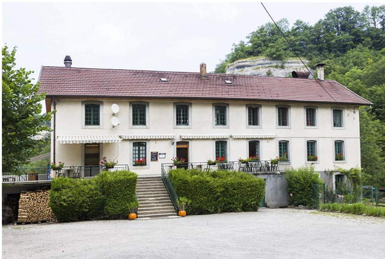
Moulin : façade antérieure.

25, Cour-Saint-Maurice, lieudit : le Moulin du Bas