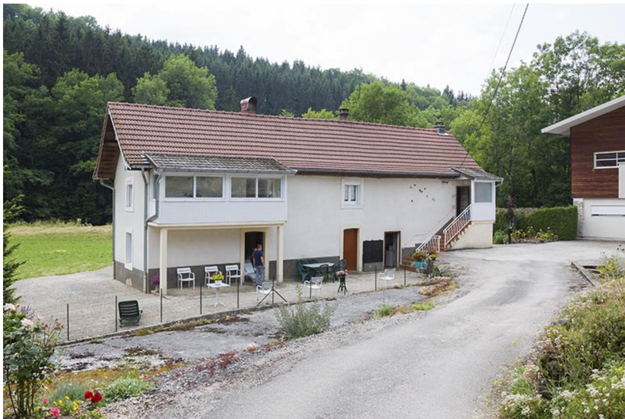
Site de la scierie : logement d'ouvriers.

25, Cour-Saint-Maurice, lieudit : le Moulin du Bas