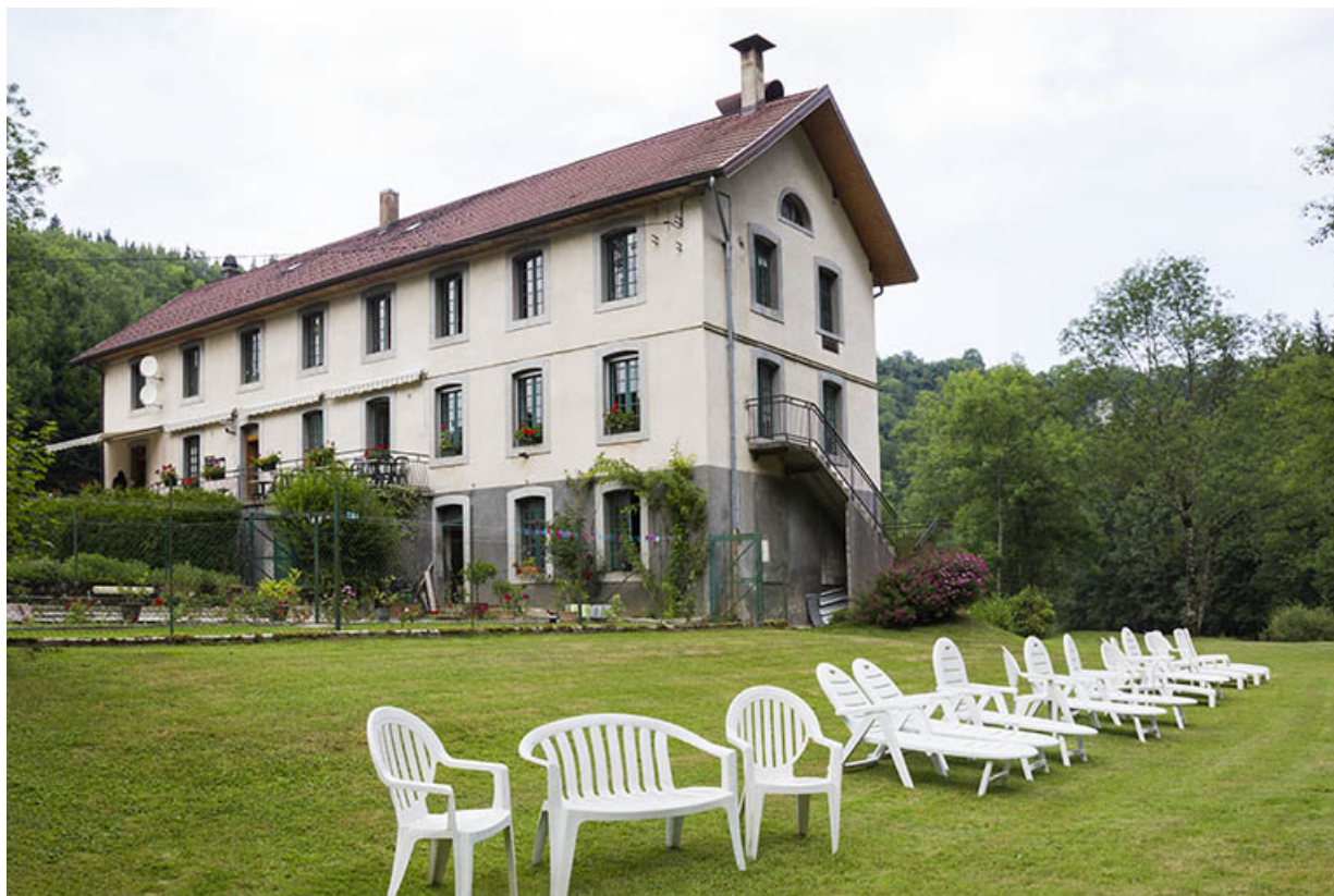
Moulin : façades antérieure et latérale droite.

25, Cour-Saint-Maurice, lieudit : le Moulin du Bas