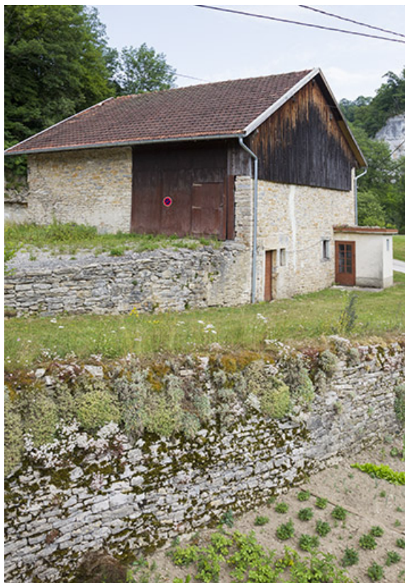
Site de la scierie : remise et étable (cadrage vertical). 25, Cour-Saint-Maurice, lieudit : le Moulin du Bas