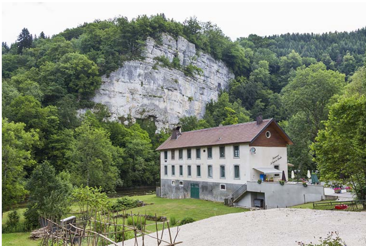
Site du moulin : vue d'ensemble, depuis le nord.

25, Cour-Saint-Maurice, lieudit : le Moulin du Bas