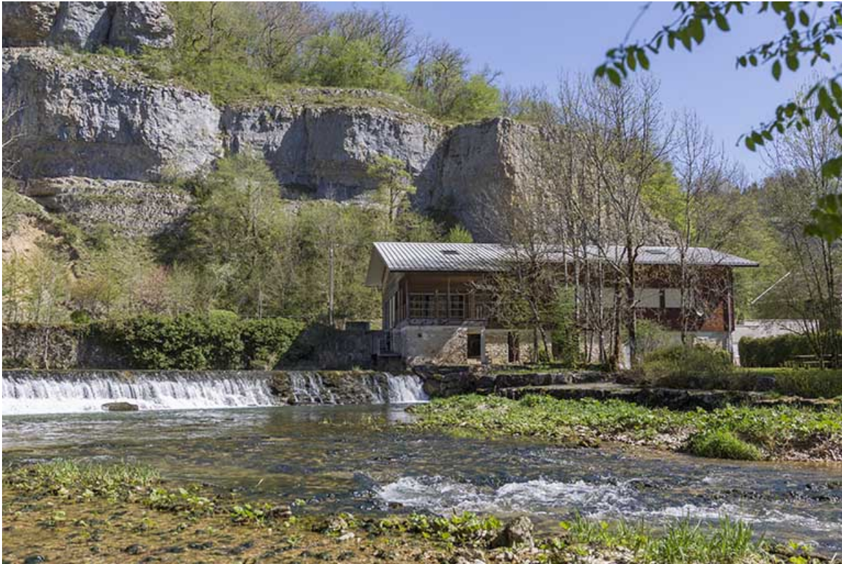
Site de la scierie : atelier de fabrication et barrage, depuis le sud.

25, Cour-Saint-Maurice, lieudit : le Moulin du Bas