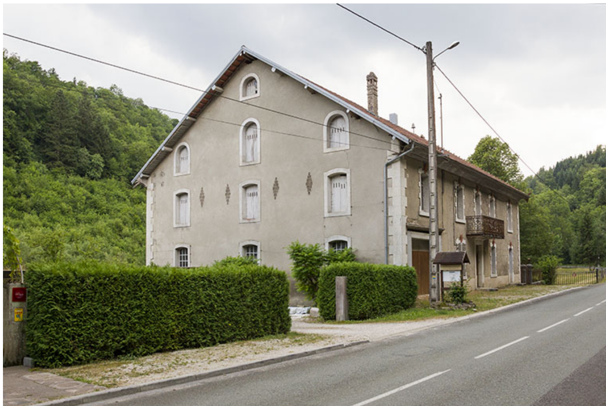
Logement patronal de 1900 : façades antérieure et latérale gauche.

25, Vaucluse, lieudit : le Moulin du Milieu