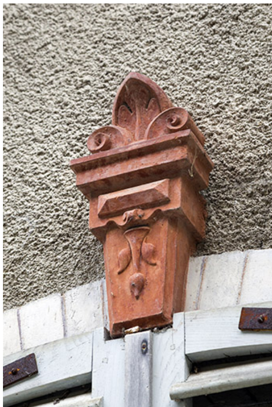
Logement patronal de 1900, façade antérieure : agrafe en céramique. 25, Vaucluse, lieudit : le Moulin du Milieu