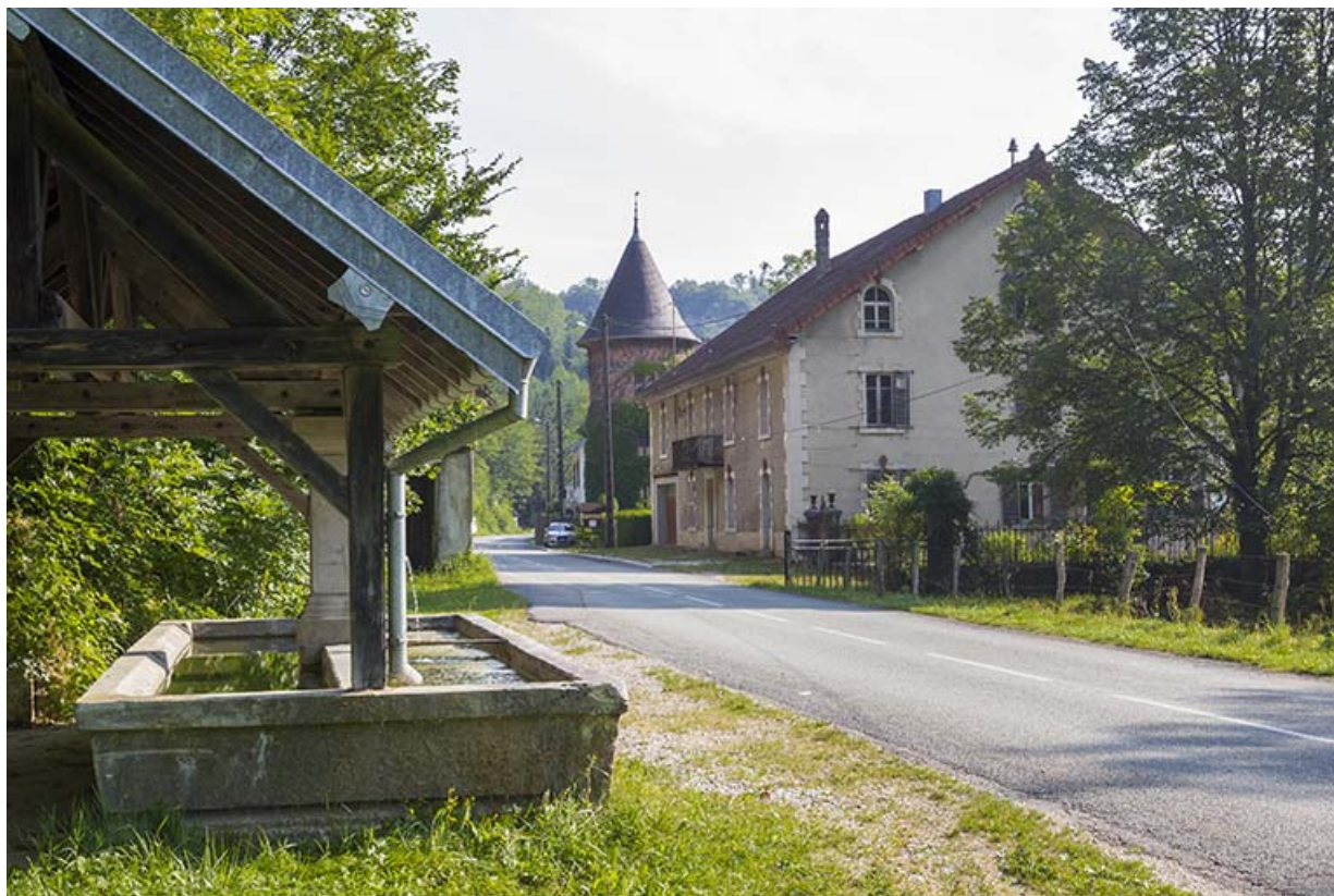
Vue d'ensemble du site, depuis le sud.

25, Vaucluse, lieudit : le Moulin du Milieu