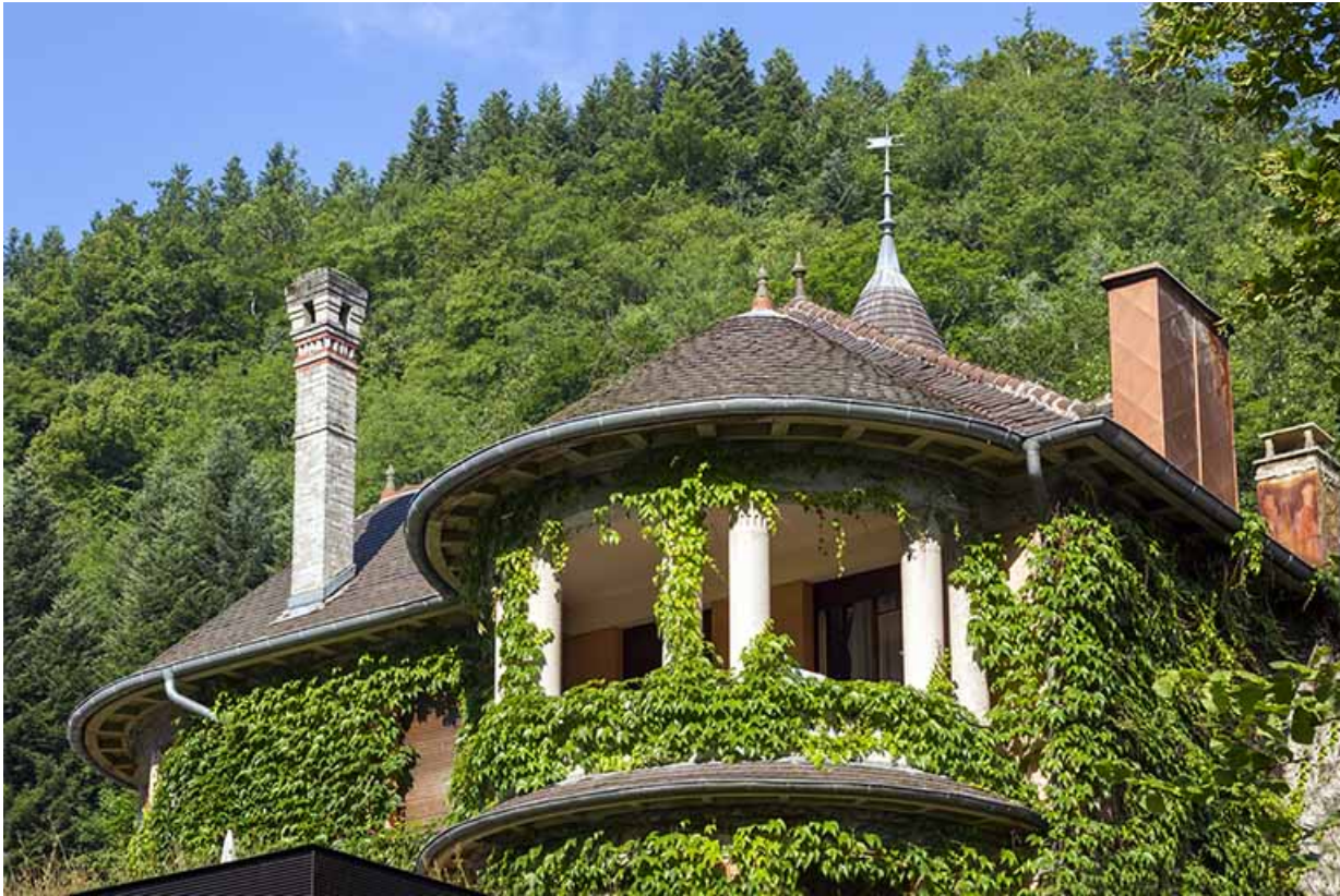
Logement patronal de 1931, façade postérieure : loggia.

25, Vaucluse, lieudit : le Moulin du Milieu