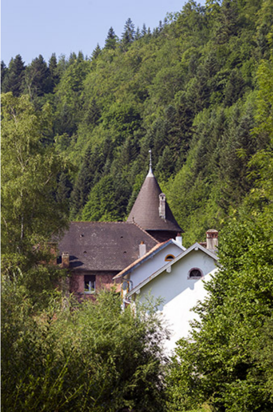
Bâtiments au milieu de la végétation, vus du nord.

25, Vaucluse, lieudit : le Moulin du Milieu