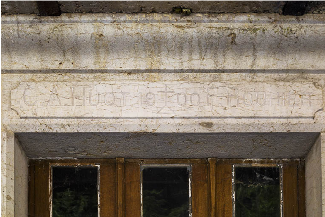
Logement patronal de 1900, façade antérieure : linteau d'entrée daté.

25, Vaucluse, lieudit : le Moulin du Milieu