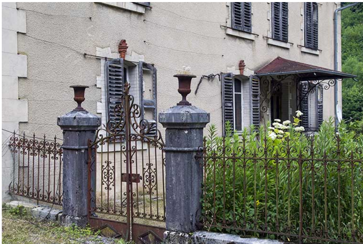
Logement patronal de 1900, façade latérale droite : portail et grille de clôture. 25, Vaucluse, lieudit : le Moulin du Milieu