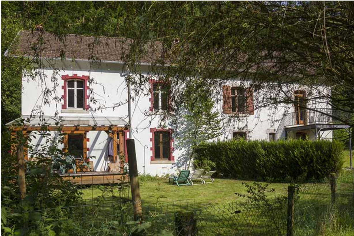
Logements d'ouvriers : façade postérieure.

25, Vaucluse, lieudit : le Moulin du Milieu