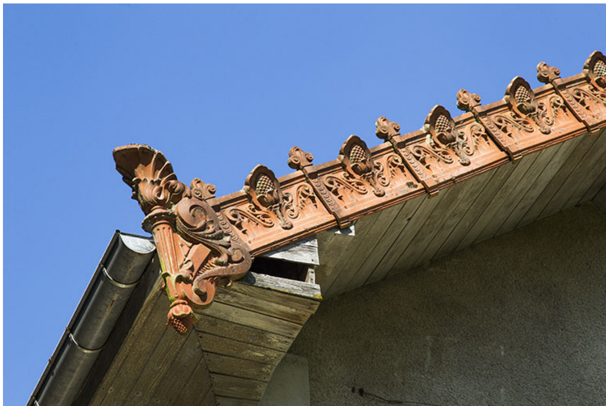
Logement patronal de 1900, façade latérale droite : acrotère et tuiles de rive en céramique. 25, Vaucluse, lieudit : le Moulin du Milieu