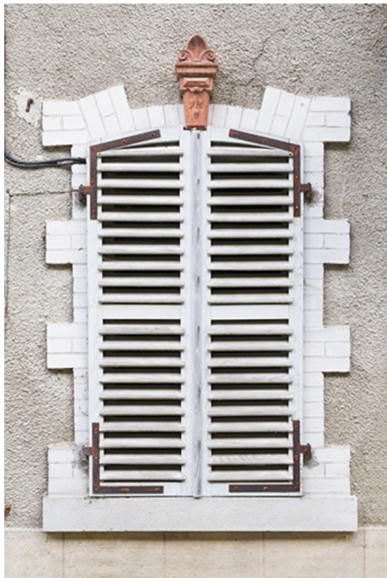
Logement patronal de 1900, façade antérieure : une fenêtre.

25, Vaucluse, lieudit : le Moulin du Milieu