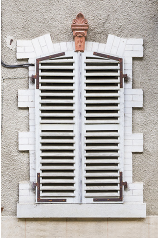
Logement patronal de 1900, façade antérieure : une fenêtre.

25, Vaucluse, lieudit : le Moulin du Milieu