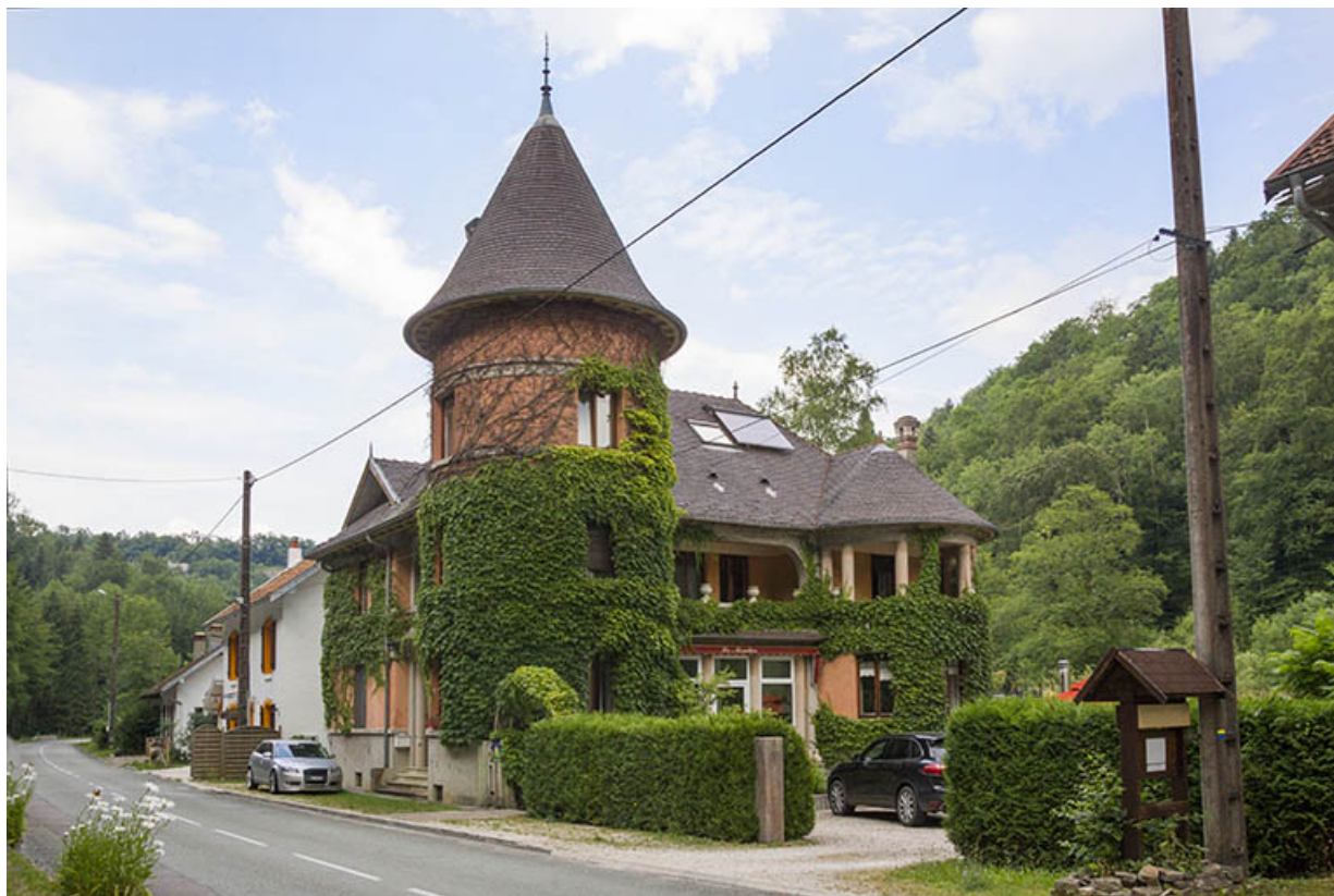
Logement patronal de 1931 : façades antérieure et latérale droite.

25, Vaucluse, lieudit : le Moulin du Milieu