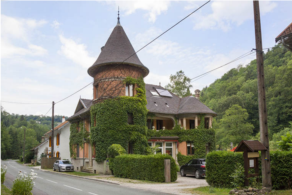
Logement patronal de 1931 : façades antérieure et latérale droite.

25, Vaucluse, lieudit : le Moulin du Milieu