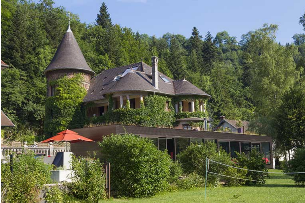
Logement patronal de 1931 : façades postérieure et latérale droite.

25, Vaucluse, lieudit : le Moulin du Milieu