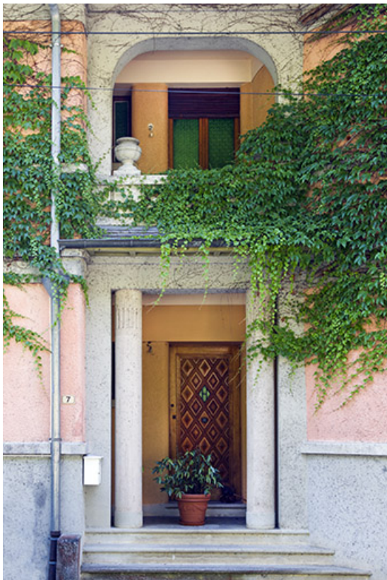
Logement patronal de 1931, façade antérieure : entrée. 25, Vaucluse, lieudit : le Moulin du Milieu