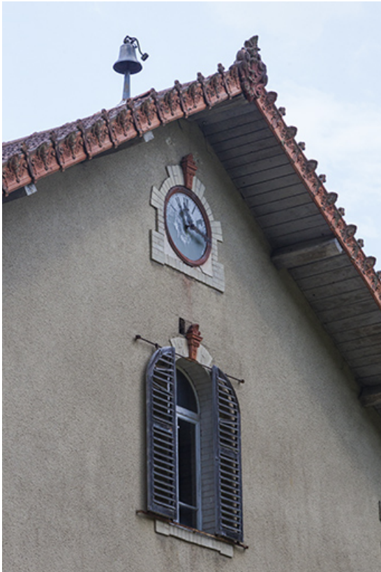
Logement patronal de 1900, façade latérale droite : fenêtre, horloge et cloche. 25, Vaucluse, lieudit : le Moulin du Milieu