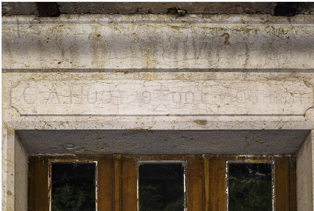
Logement patronal de 1900, façade antérieure : linteau d'entrée daté. 25, Vaucluse, lieudit : le Moulin du Milieu