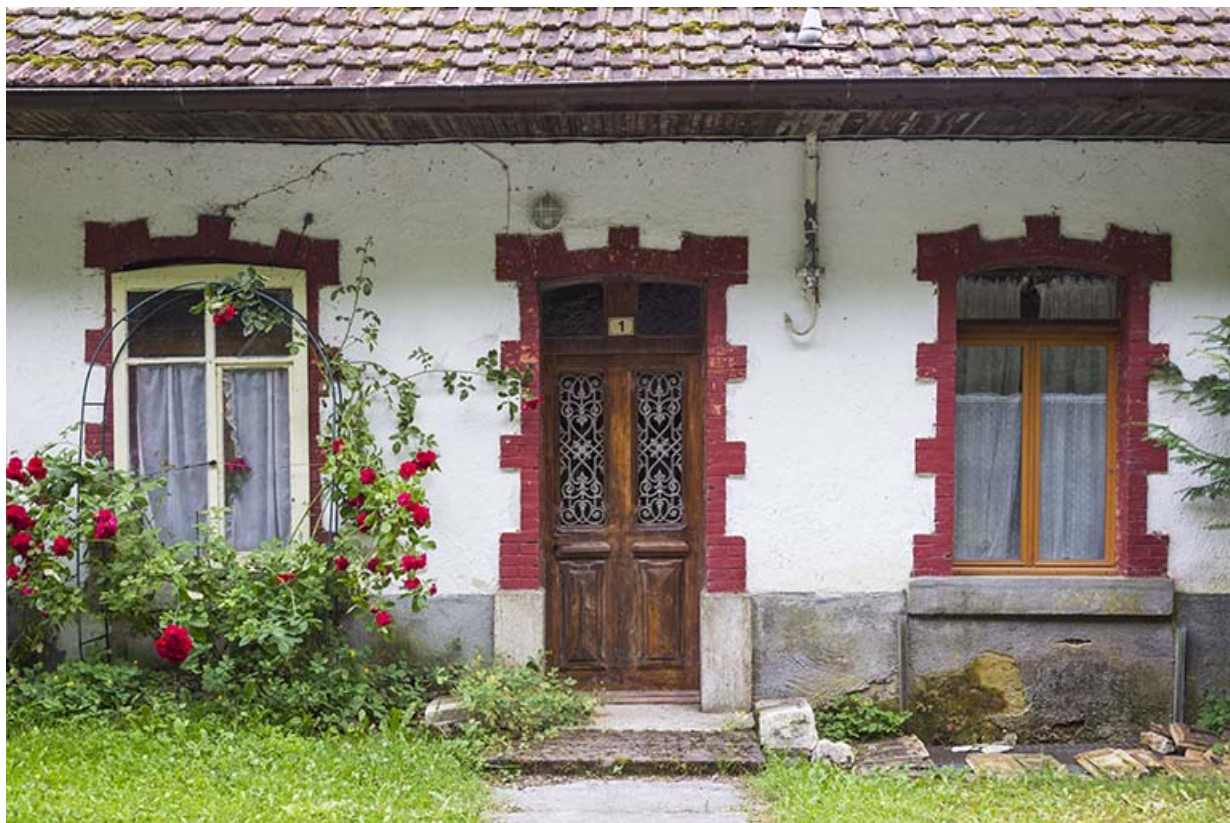
Logements d'ouvriers : façade antérieure du logement nord.

25, Vaucluse, lieudit : le Moulin du Milieu