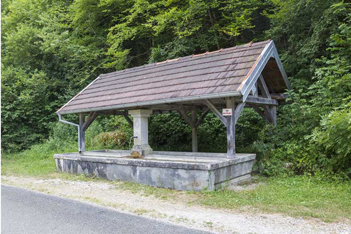
La fontaine et son abri.

25, Vaucluse, lieudit : le Moulin du Milieu