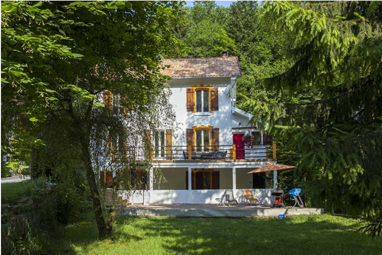
Logement de contremaître : façade postérieure.

25, Vaucluse, lieudit : le Moulin du Milieu