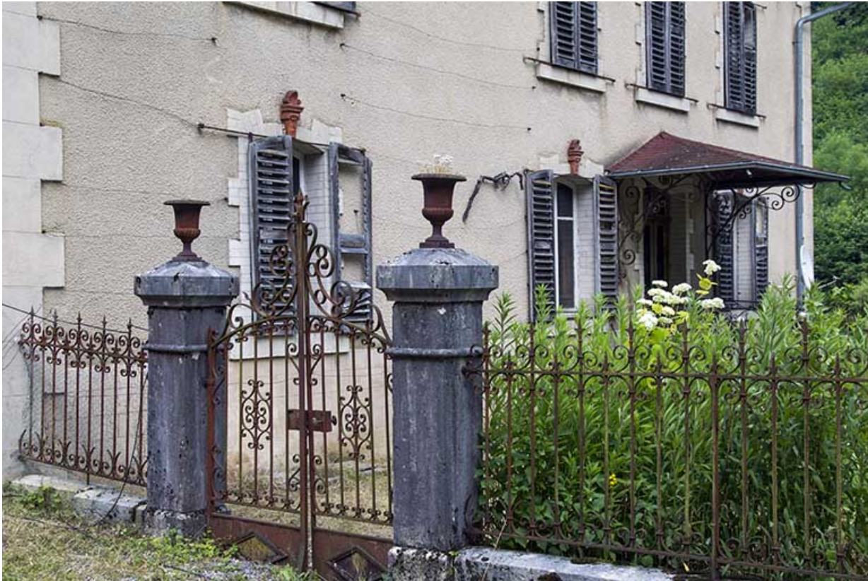
Logement patronal de 1900, façade latérale droite : portail et grille de clôture.

25, Vaucluse, lieudit : le Moulin du Milieu