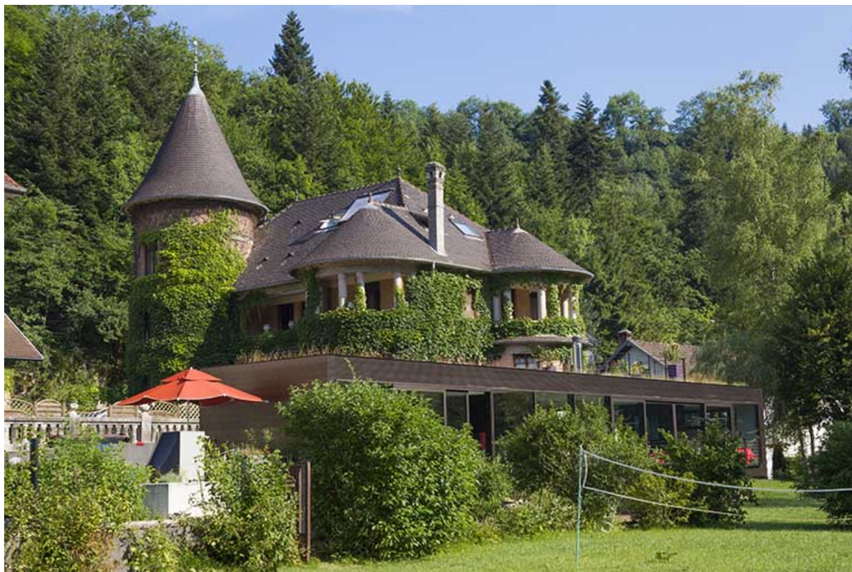
Logement patronal de 1931 : façades postérieure et latérale droite.

25, Vaucluse, lieudit : le Moulin du Milieu