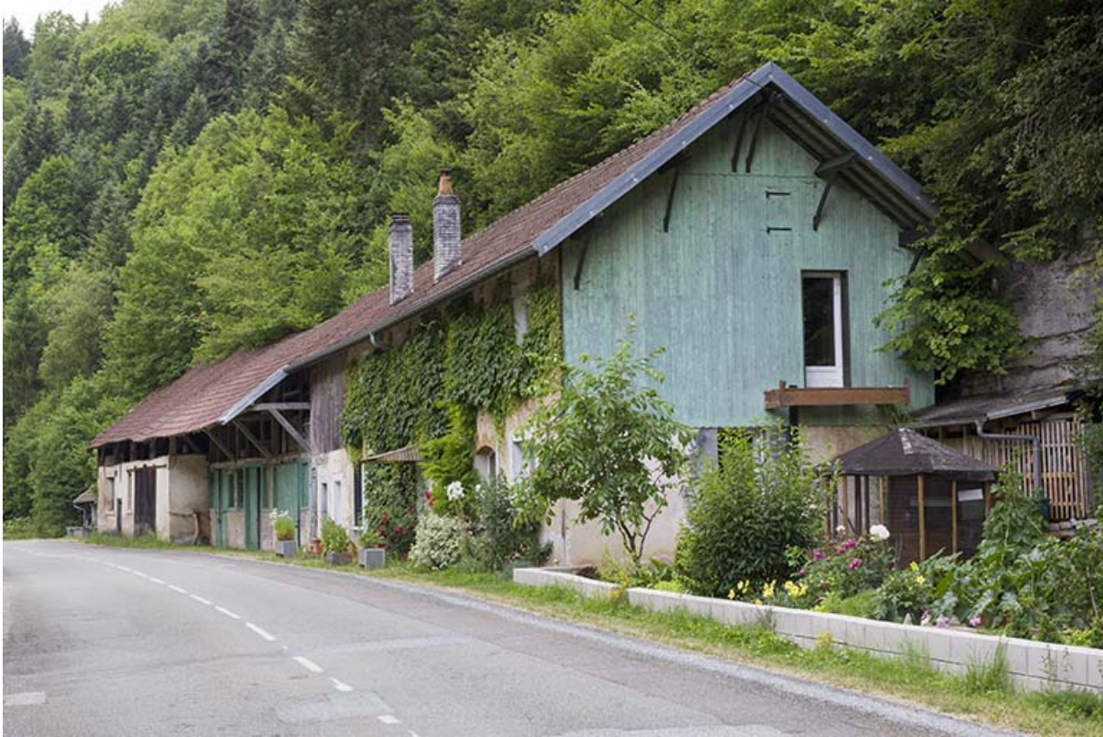
Logements d'ouvriers, écuries et remises, depuis le nord.

25, Vaucluse, lieudit : le Moulin du Milieu