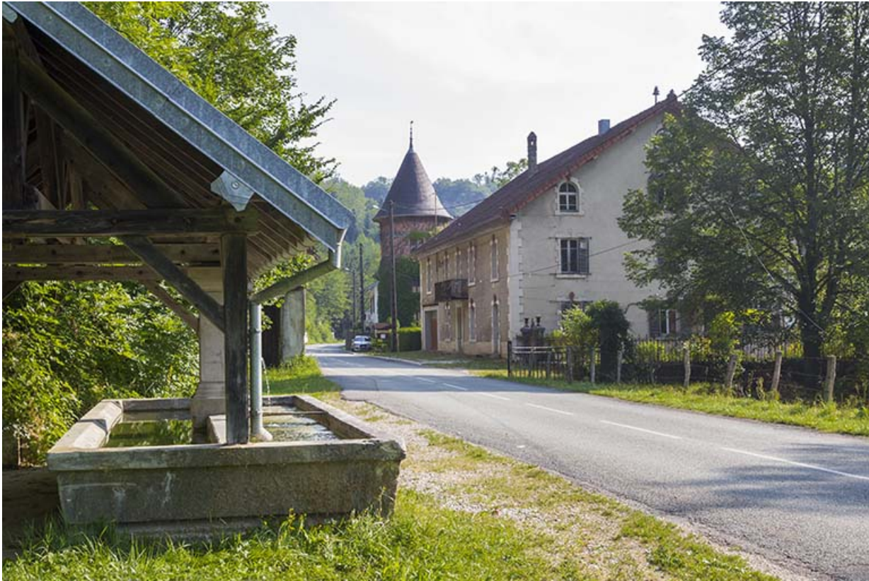
Vue d'ensemble du site, depuis le sud.

25, Vaucluse, lieudit : le Moulin du Milieu