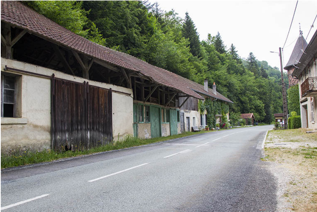
Logements d'ouvriers, écuries et remises, depuis le sud.

25, Vaucluse, lieudit : le Moulin du Milieu