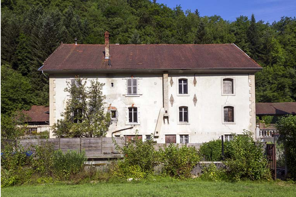
Logement patronal de 1900 : façade postérieure.

25, Vaucluse, lieudit : le Moulin du Milieu