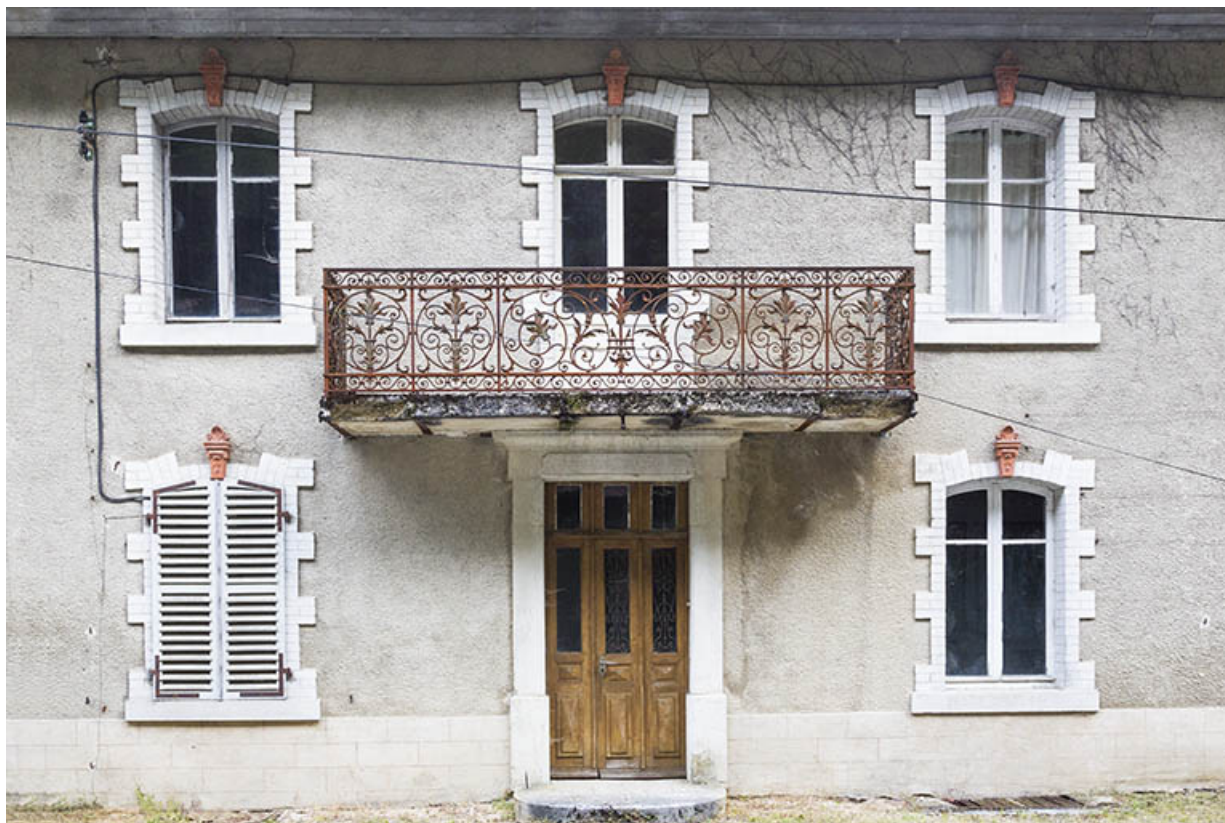
Logement patronal de 1900, façade antérieure : travées centrales.

25, Vaucluse, lieudit : le Moulin du Milieu