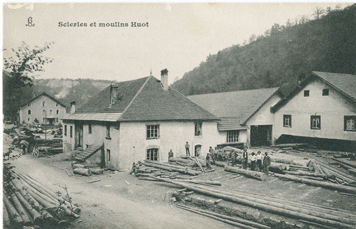
Scierie et moulins Huot, 1er quart 20e siècle. Le logement patronal de 1900 est visible à l'arrière-plan à gauche. 25, Vaucluse, lieudit : le Moulin du Milieu