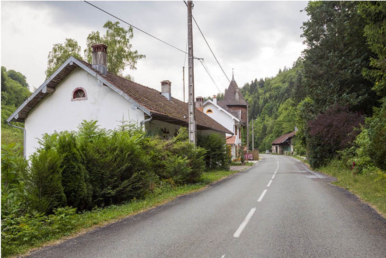
Vue d'ensemble du site, depuis le nord.

25, Vaucluse, lieudit : le Moulin du Milieu