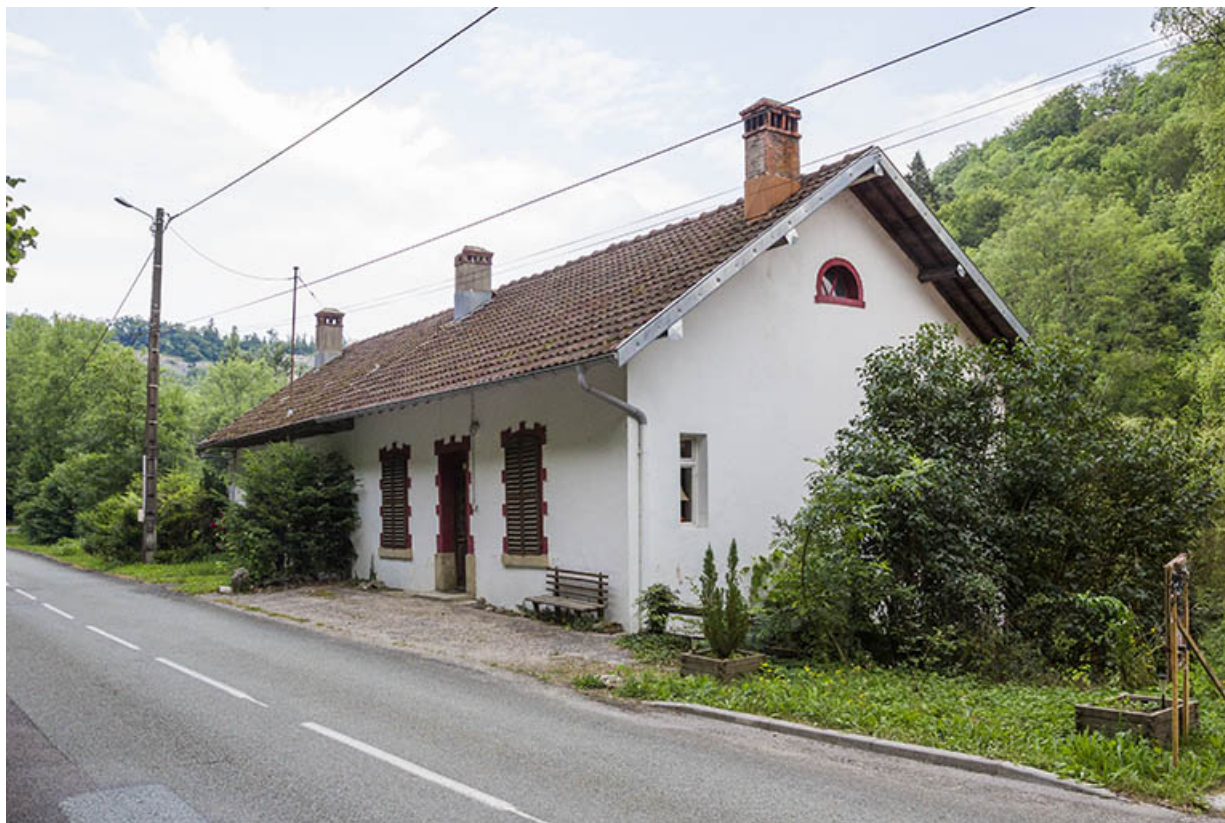
Logements d'ouvriers : vue d'ensemble, depuis le sud-ouest. Logement sud au premier plan. 25, Vaucluse, lieudit : le Moulin du Milieu