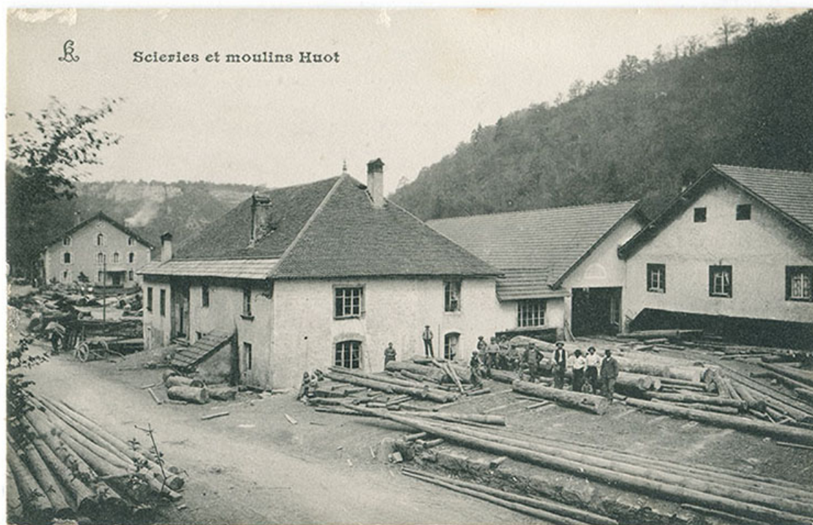
Scierie et moulins Huot, 1er quart 20e siècle. Le logement patronal de 1900 est visible à l'arrière-plan à gauche. 25, Vaucluse, lieudit : le Moulin du Milieu

Scierie et moulins Huot, carte postale, s.n., s.d. [1er quart 20e siècle]