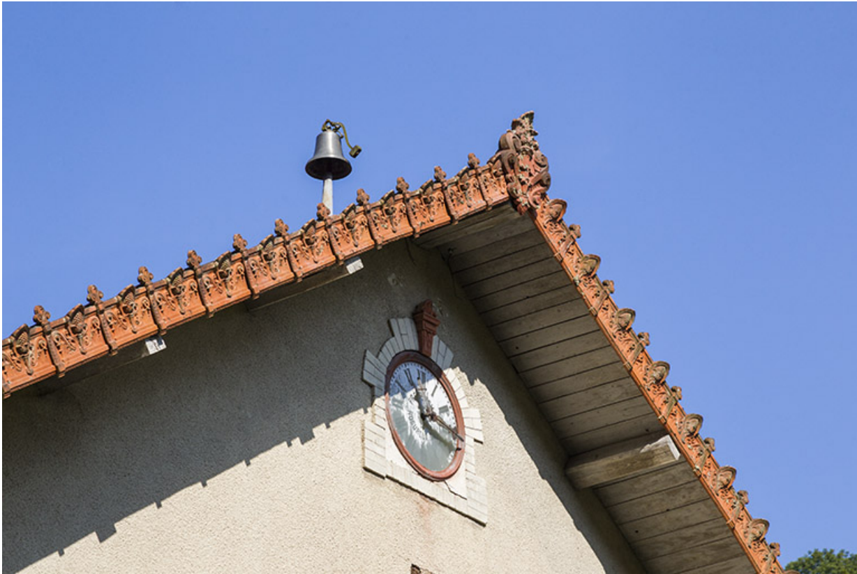
Logement patronal de 1900, façade latérale droite : horloge et cloche.

25, Vaucluse, lieudit : le Moulin du Milieu