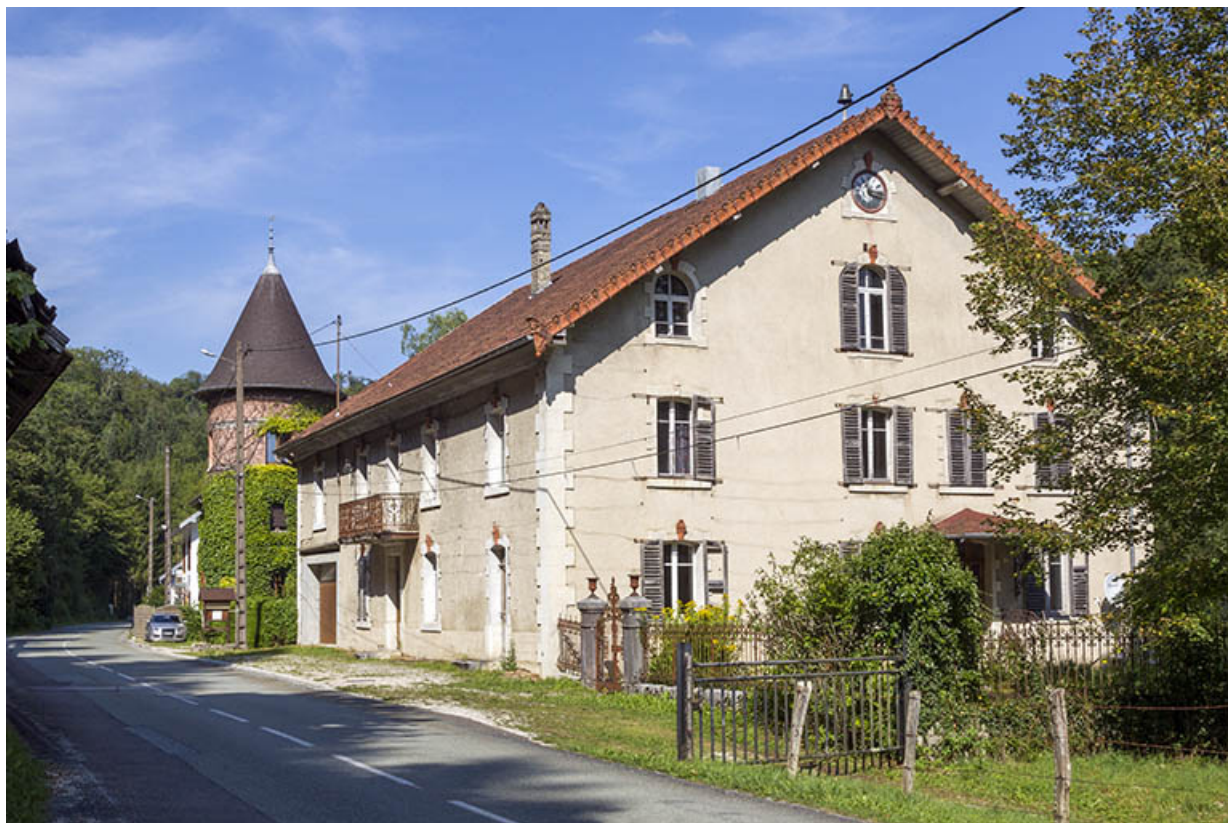
Logement patronal de 1900 : façades antérieure et latérale droite.

25, Vaucluse, lieudit : le Moulin du Milieu