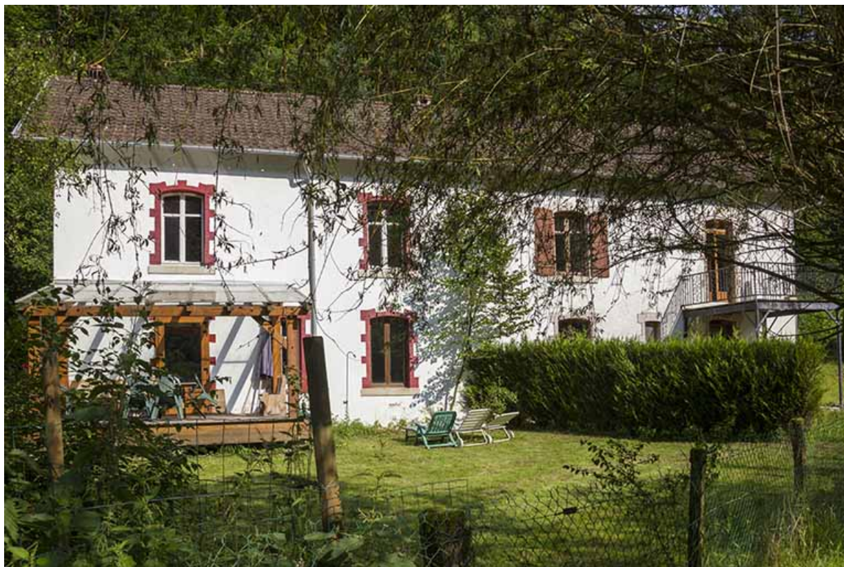
Logements d'ouvriers : façade postérieure.

25, Vaucluse, lieudit : le Moulin du Milieu