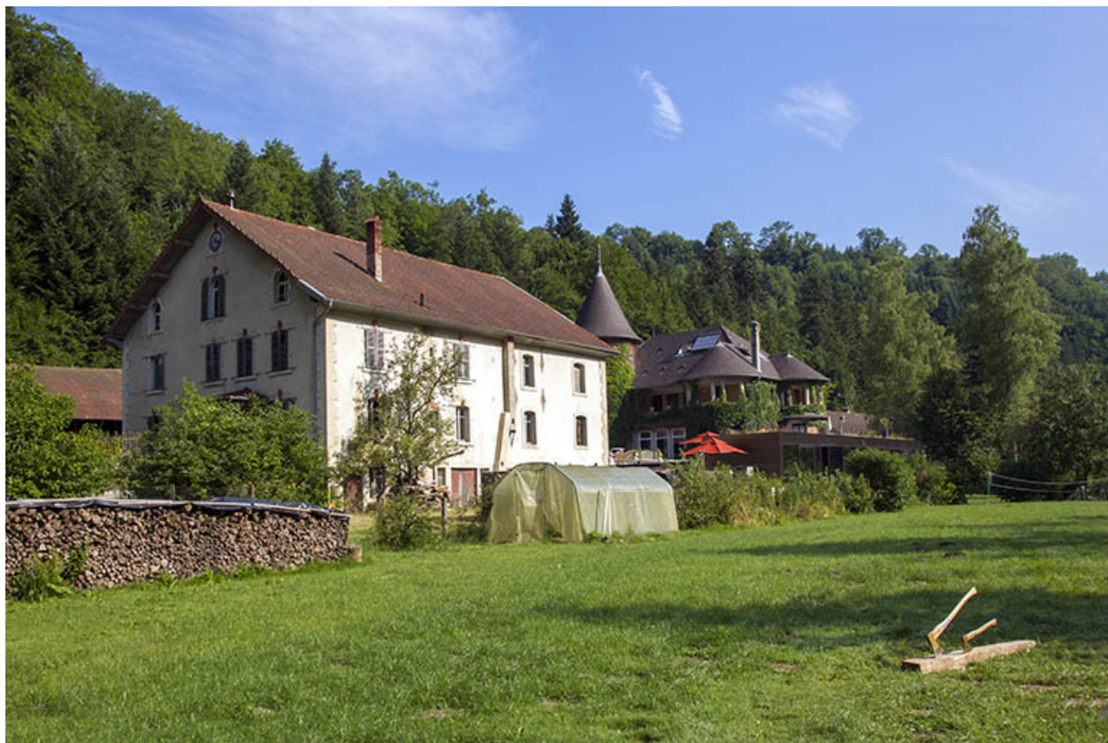
Vue d'ensemble du site, depuis le sud-est.

25, Vaucluse, lieudit : le Moulin du Milieu