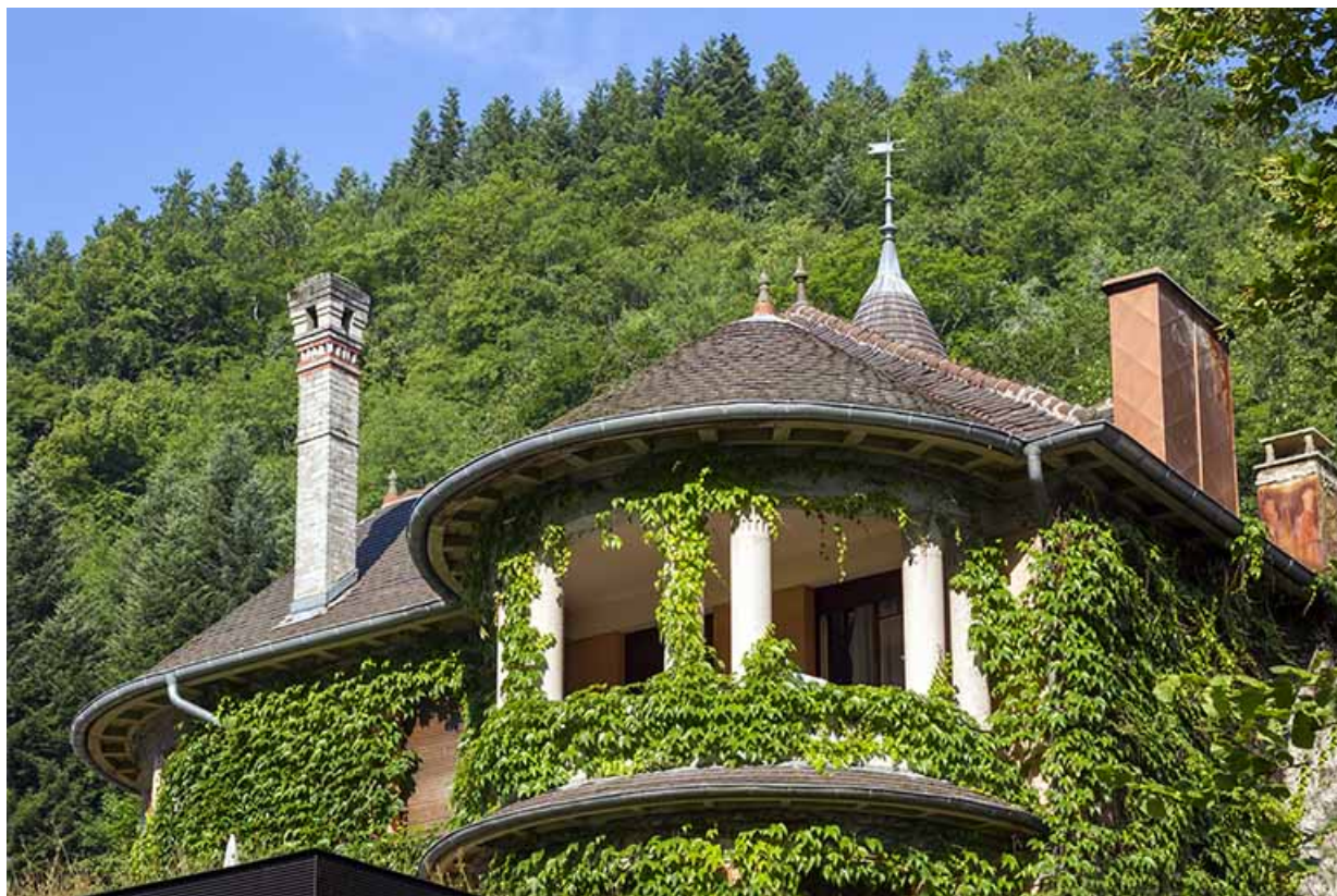
Logement patronal de 1931, façade postérieure : loggia.

25, Vaucluse, lieudit : le Moulin du Milieu