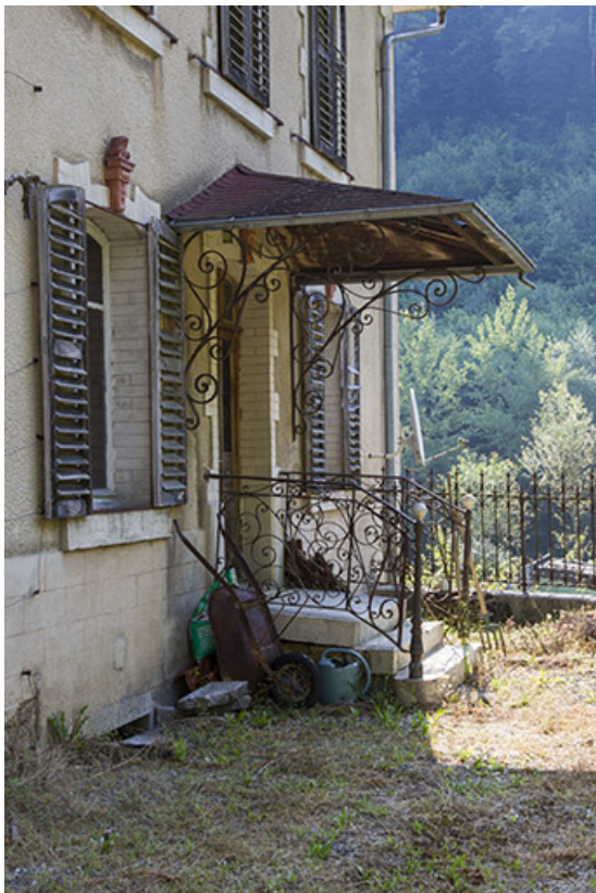
Logement patronal de 1900, façade latérale droite : entrée et auvent. 25, Vaucluse, lieudit : le Moulin du Milieu