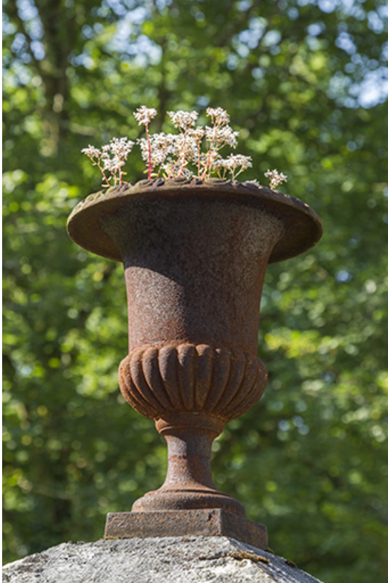
Logement patronal de 1900, façade latérale droite : vase d'amortissement sur un pilier du portail. 25, Vaucluse, lieudit : le Moulin du Milieu