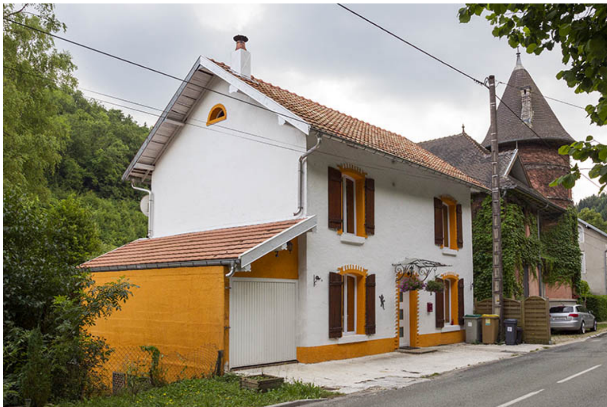
Logement de contremaître : façade antérieure, de trois quarts gauche. 25, Vaucluse, lieudit : le Moulin du Milieu