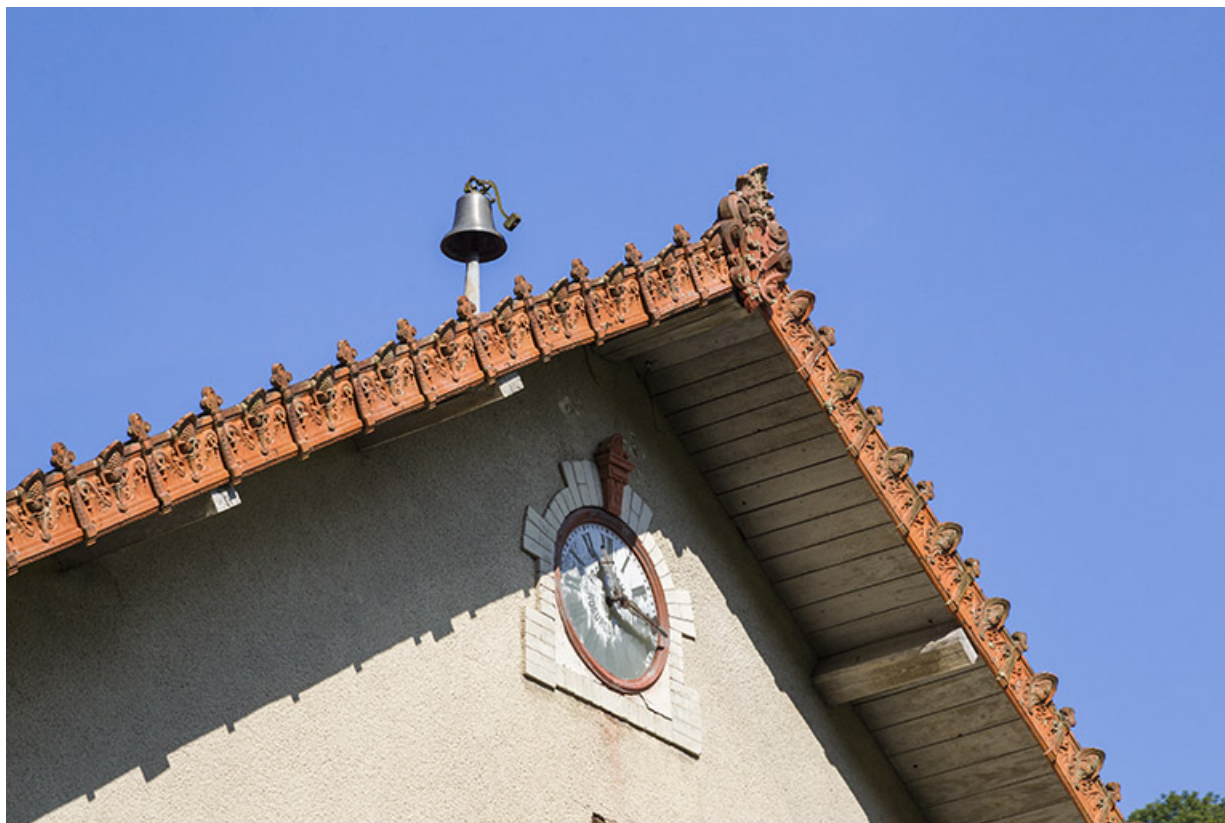
Logement patronal de 1900, façade latérale droite : horloge et cloche.

25, Vaucluse, lieudit : le Moulin du Milieu