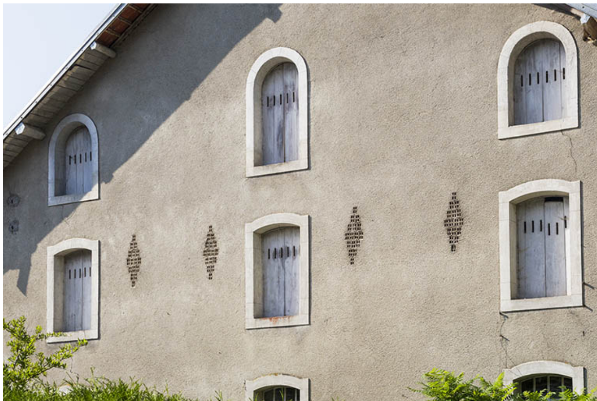
Logement patronal de 1900 : fenêtres de la façade latérale gauche.

25, Vaucluse, lieudit : le Moulin du Milieu